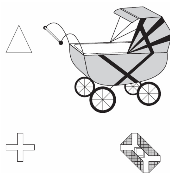
Рис. 3. Тест замаскированных фигур (ТЗФ) . В этом тесте испытуемый должен найти малую часть (показана слева) в целой фигуре (справа). Это затрудняется выступанием на первый план общей формы. Люди с аутизмом превосходят как в детском, так и во взрослом ТЗФ 51 (верхний и нижний рисунки соответственно), возможно потому, что не соблазняются гештальтом и находят части столь же значимыми, как и целое 22 .