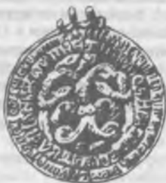
Золотой половецкий амулет IX—X века, символизирующий единство и родство человека и змия.