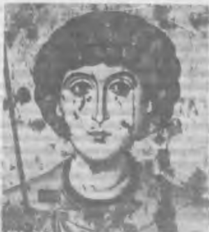
Таким было, оказывается, истинное изображение Святого Георгия-воина. Икона XII века, Москва, Кремль.