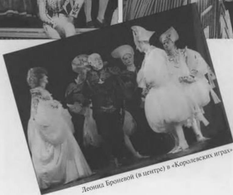
Леонид Броневой (в центре) в «Королевских играх»