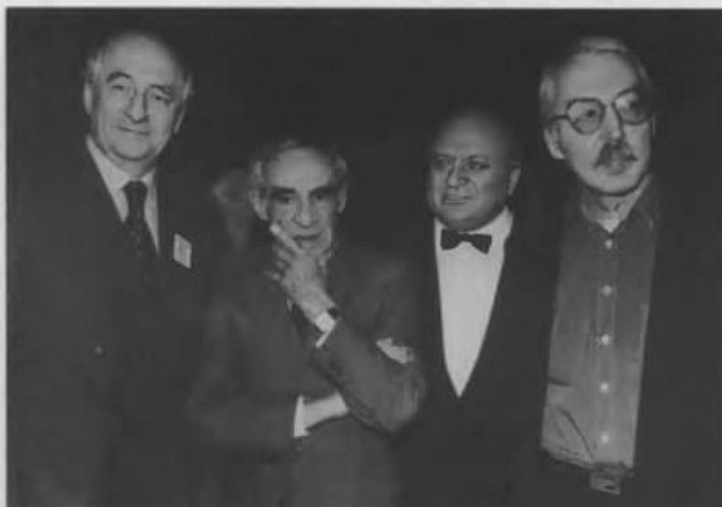
Зиновия Гердта, Михаила Жванецкого, Андрея Битова...