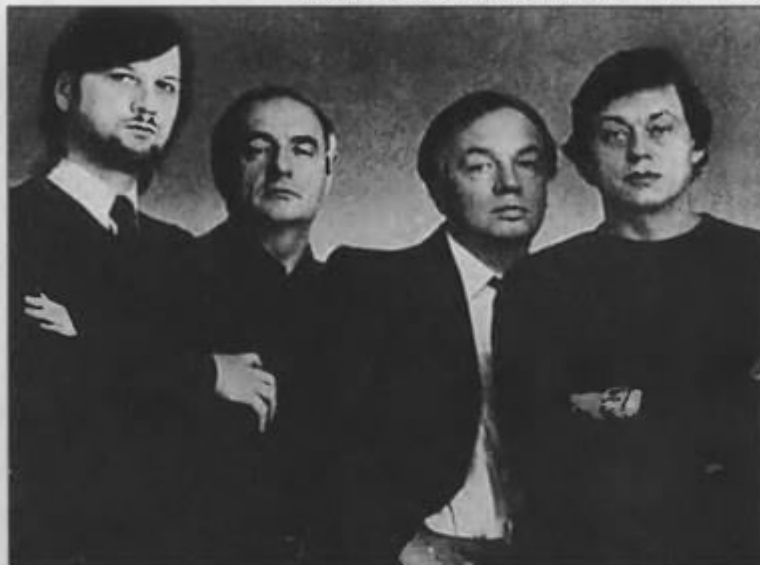
Люди, причастные к созданию первой русской рок-оперы «Юнона и Авось» — Алексей Рыбников, Марк Захаров, Андрей Вознесенский и Николай Караченцов