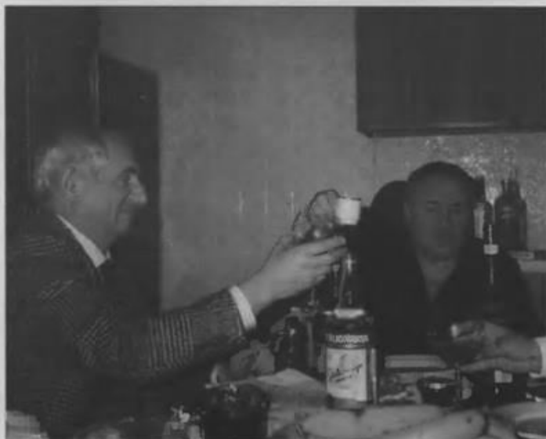
...и даже пить водку в нью-йоркской мастерской Эрнста Неизвестного