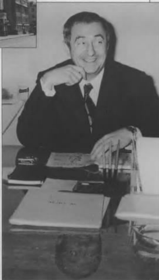
...и его новый главный режиссер