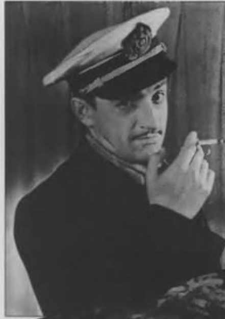
Памятная роль Остапа Бендера в Театре миниатюр