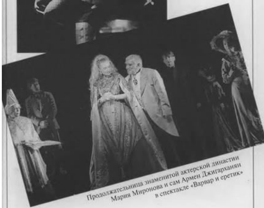
Продолжательница знаменитой актерской династии Мария Миронова и сам Армен Джигарханян в спектакле «Варвар и еретик»