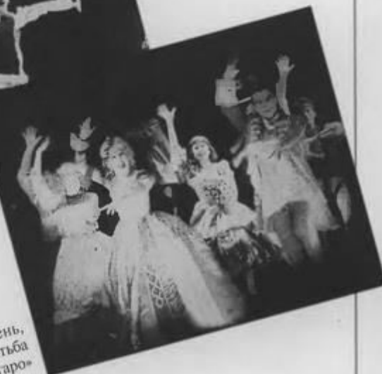
«Безумный день, или Женитьба Фигаро»