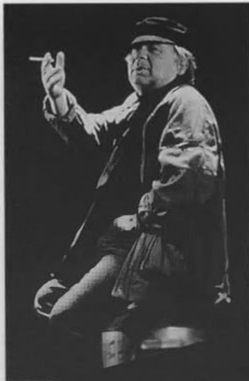
Великий русский артист Евгений Павлович Леонов в «Поминальной молитве»