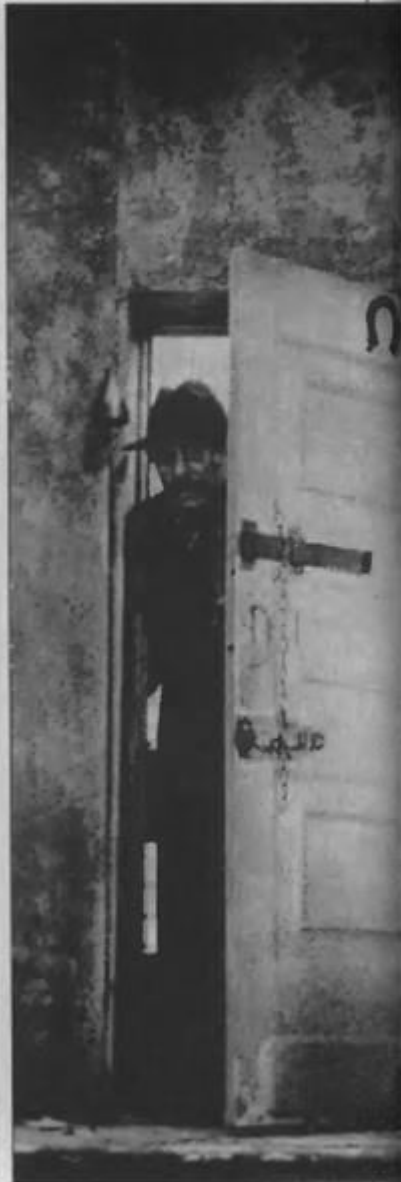
...и Анатолий Папанов — Киса Воробьянинов