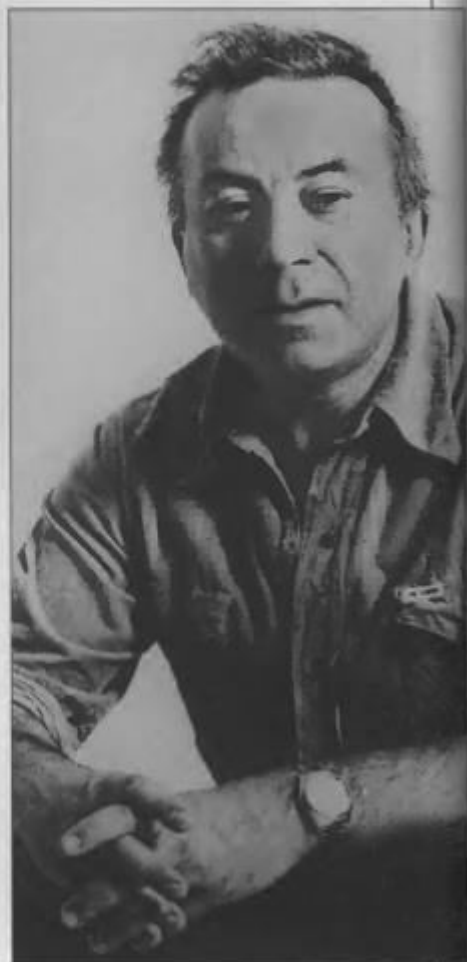
Анатолий Васильевич Эфрос