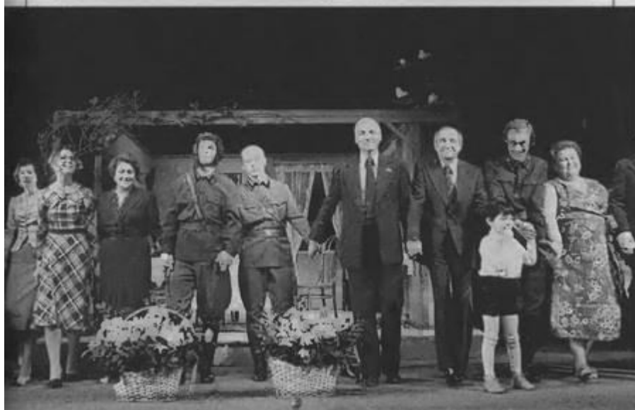
Константин Симонов на премьере «Парня из нашего города»