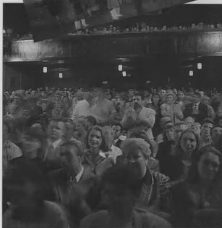
...и зрителей должно быть много