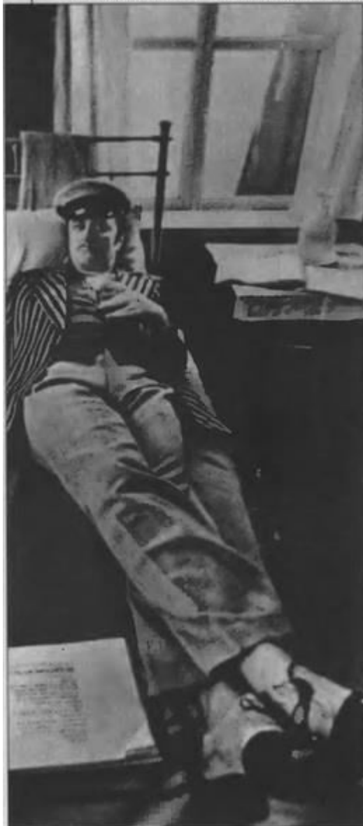
Андрей Миронов — Остап Бендер...

Герои моего первого телевизионного действия