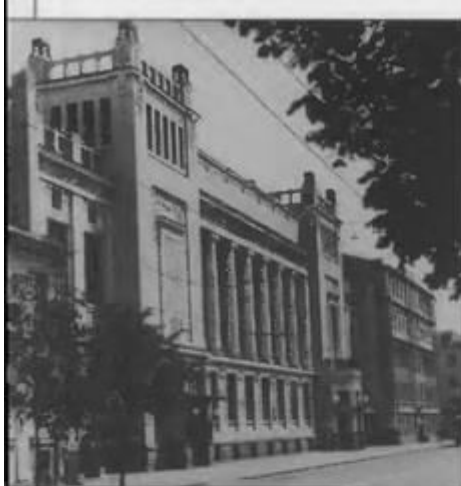
Так выглядели в 1973 году Ленком...