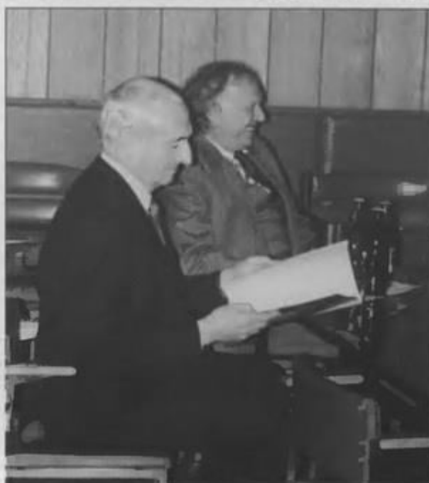
С Иннокентием Смоктуновским