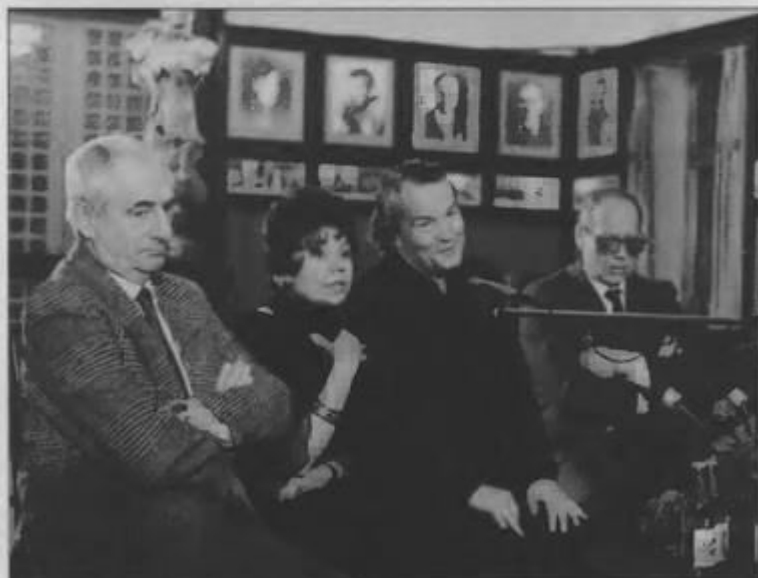
Здесь я задумался о достоинствах немецкого режиссера Петера Штайна — он сидит неподалеку (в центре)