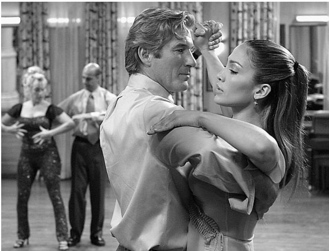
Кадр из фильма «Давайте потанцуем» — Ричард Гир и Дженнифер Лопес