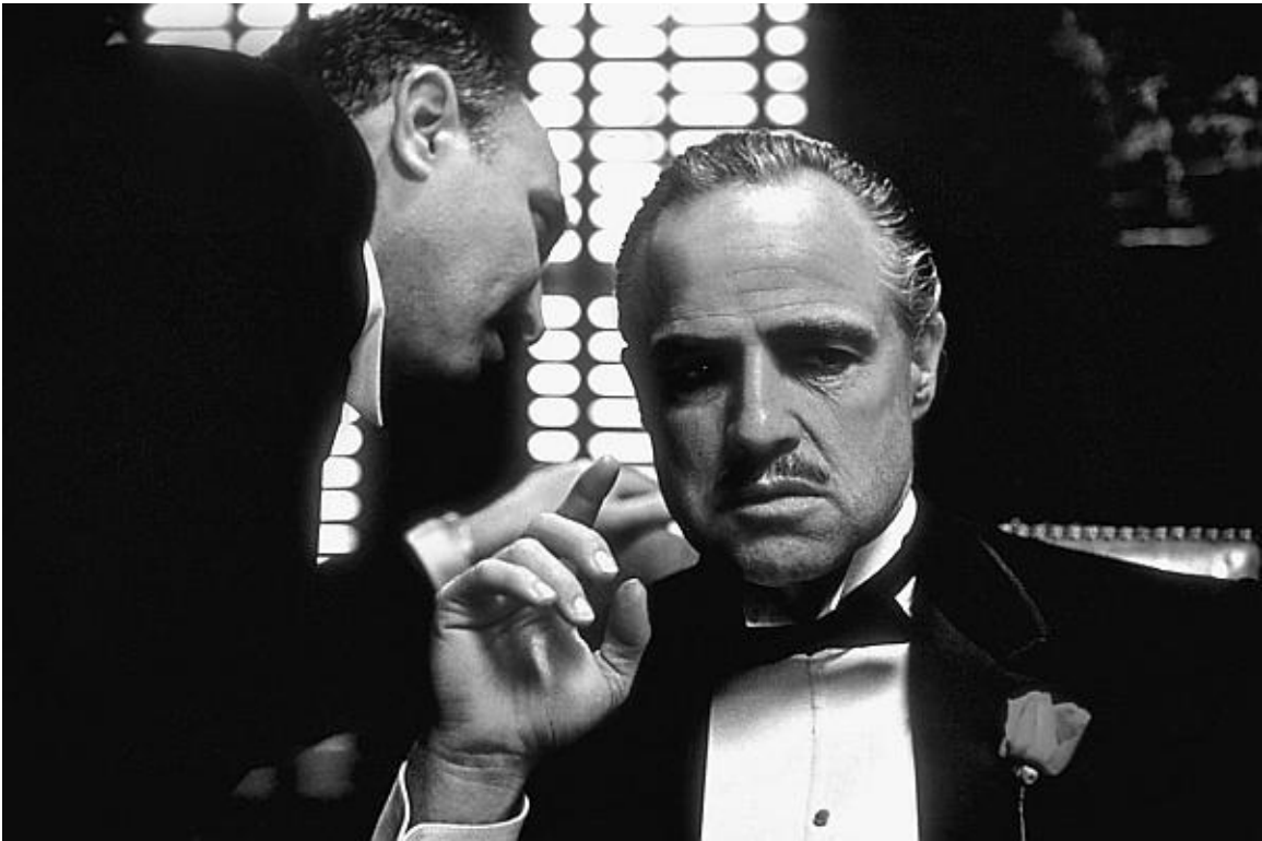
Марлон Брандо в культовом фильме «Крестный отец»