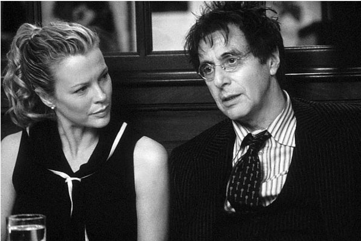
Ким Бэсинджер и Аль Пачино в фильме «Люди, которых я знаю»