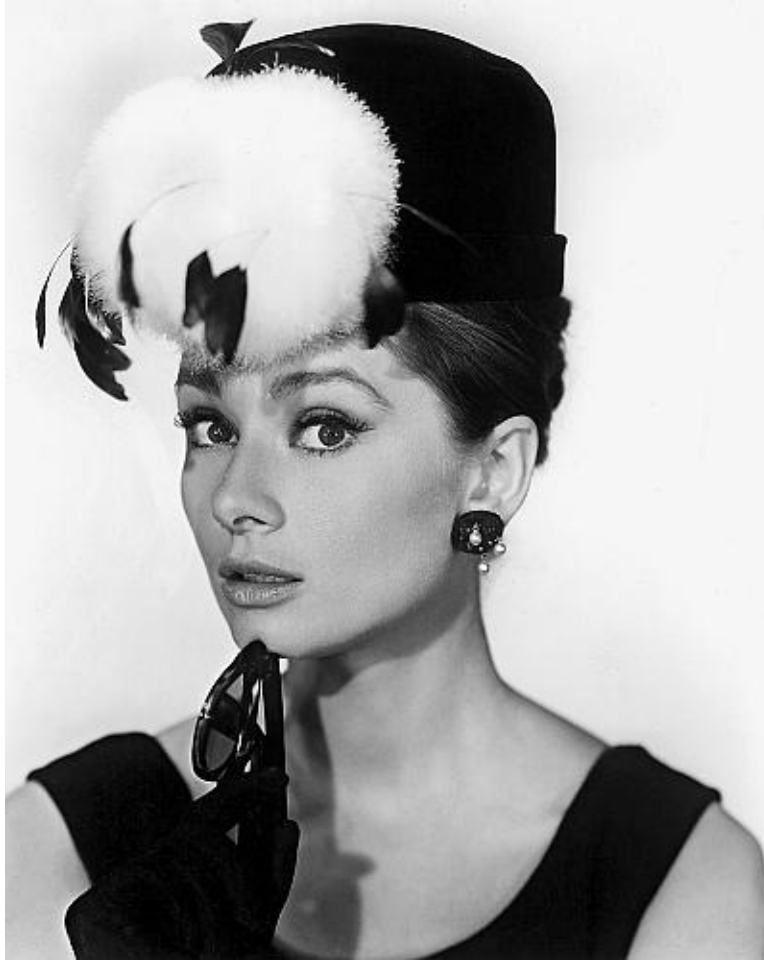
Одри Хепберн в филъме „Завтрак у Тиффани“. 1961 год