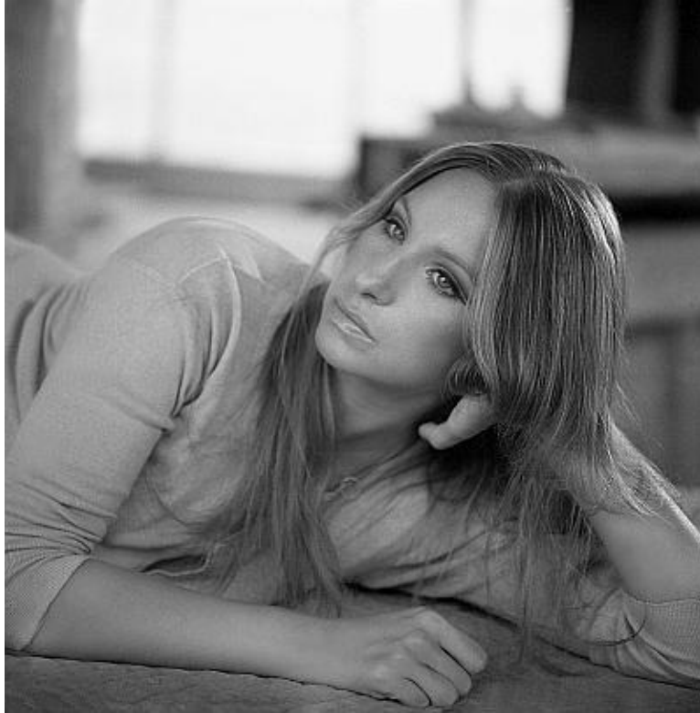
Барбра Стрейзанд в фильме «Что нового, док?» 1972 год