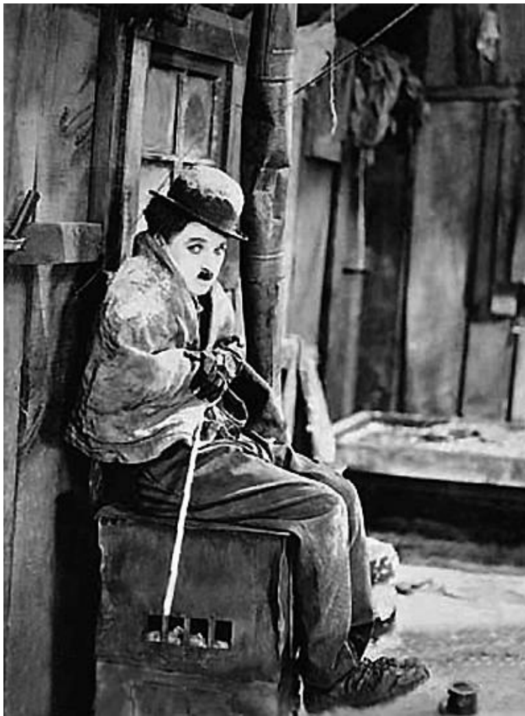
Кадр из фильма Чарли Чаплина «Золотая лихорадка»