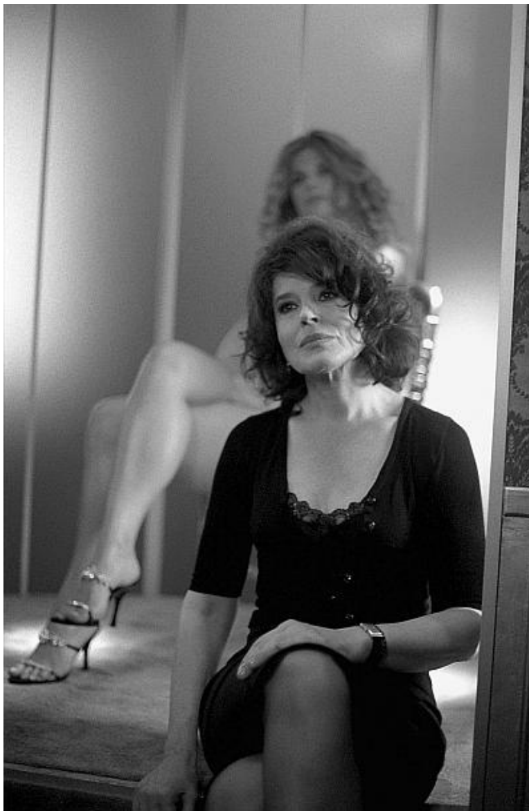
Фанни Ардан в фильме «Париж, я тебя люблю»