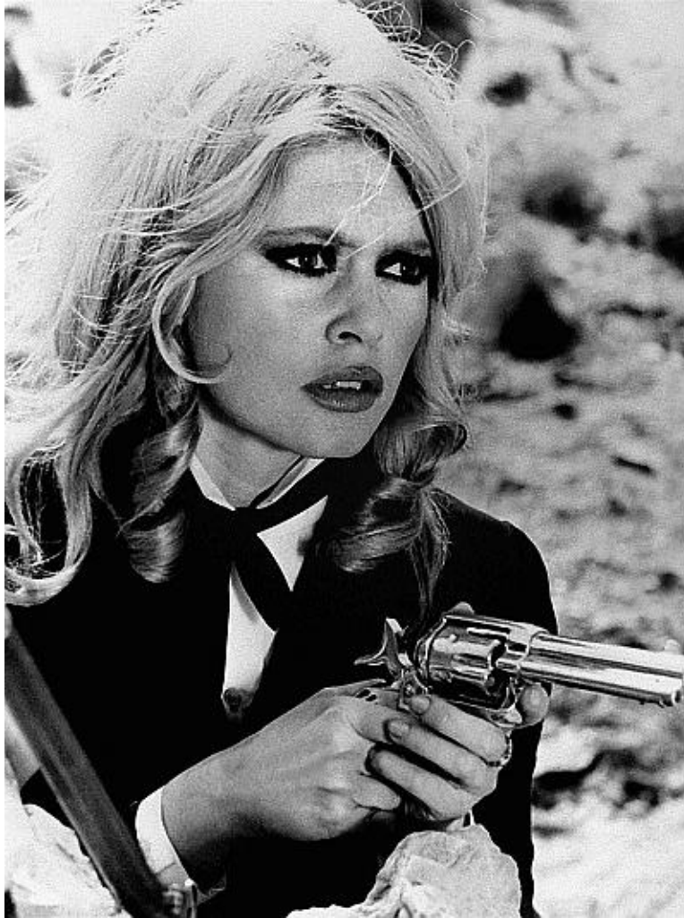
Брижит Бардо с пистолетом в руках — кадр из кинофильма „Шалако“. Германия, 1968 год