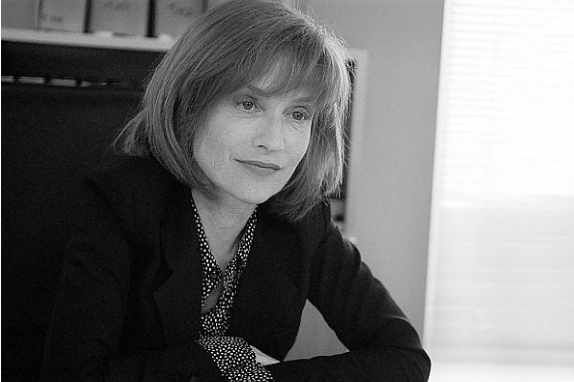
Изабель Юппер в фильме «Комедия власти»