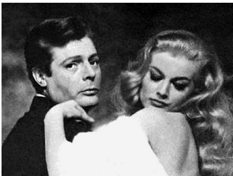
Марчелло Матростянни и Анита Экберг в картине „Сладкая жизнь“