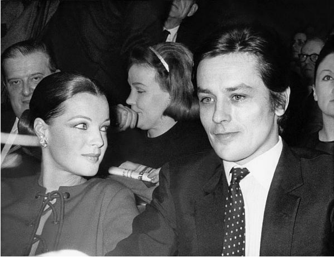
Лондон. Август 1970 года. Роми Шнайдер и Ален Делон на церемонии вручения Делону премии „Сезар“