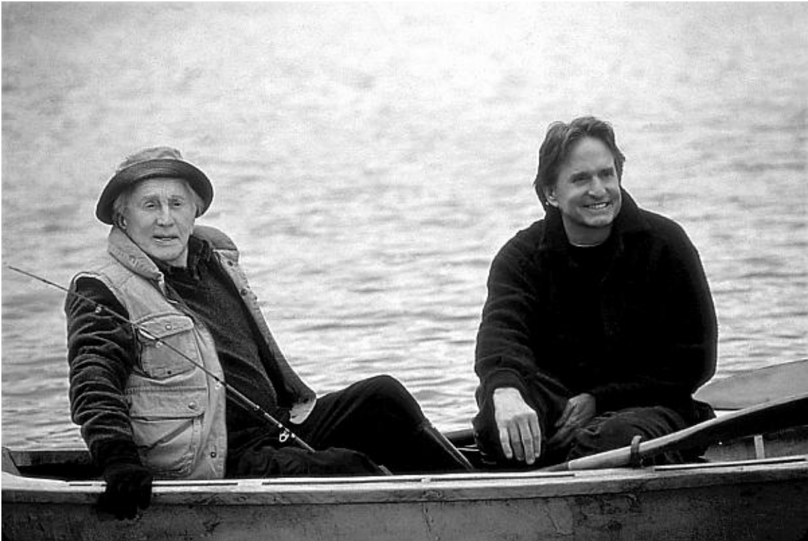
Керк и Майкл Дугласы в фильме «Дела семейные»