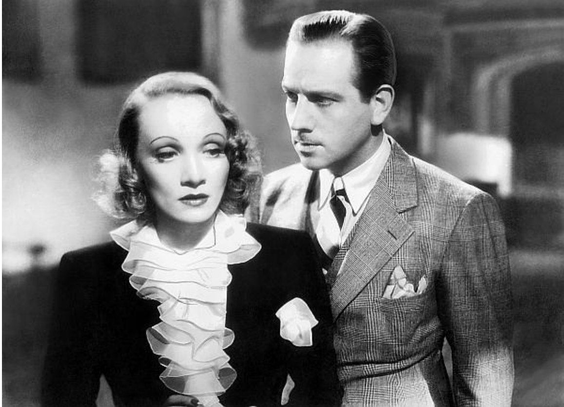
Марлен Дитрих со своим партнером Мелвином Дугласом в кинофильме Эрнста Любича „Ангел“. 1937 год