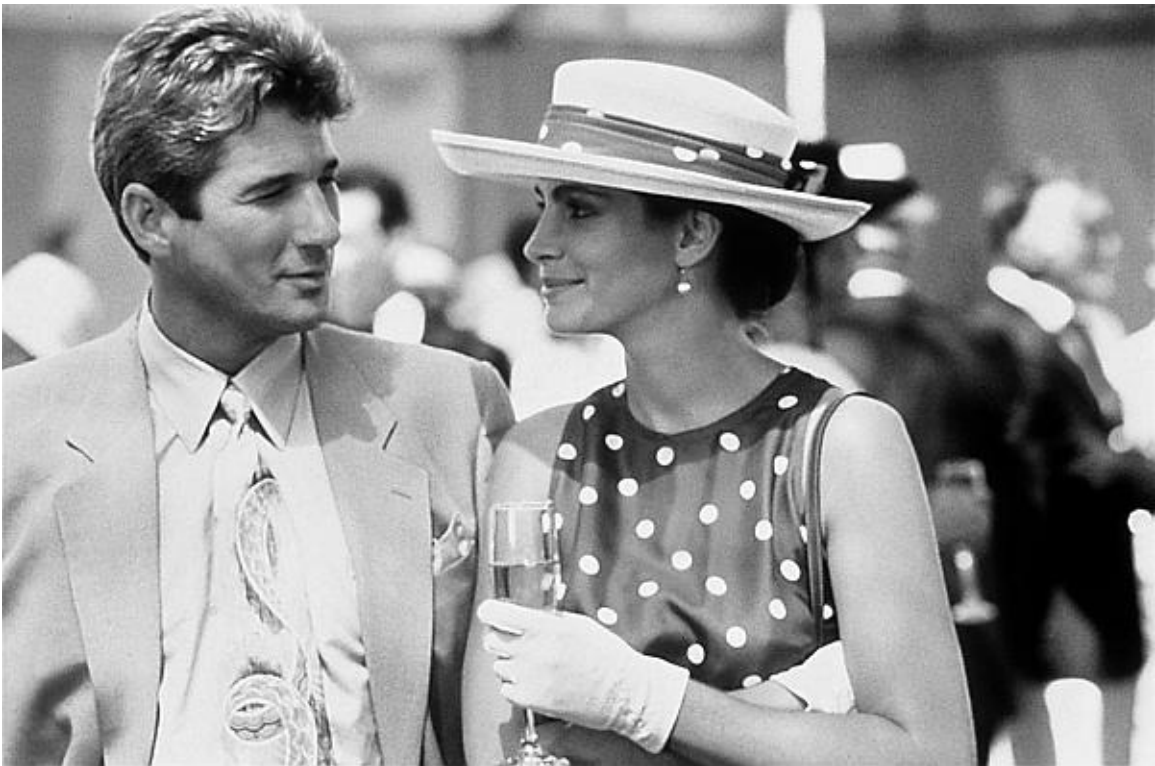
Знаменитая «Красотка». Джулия Робертс и Ричард Гир