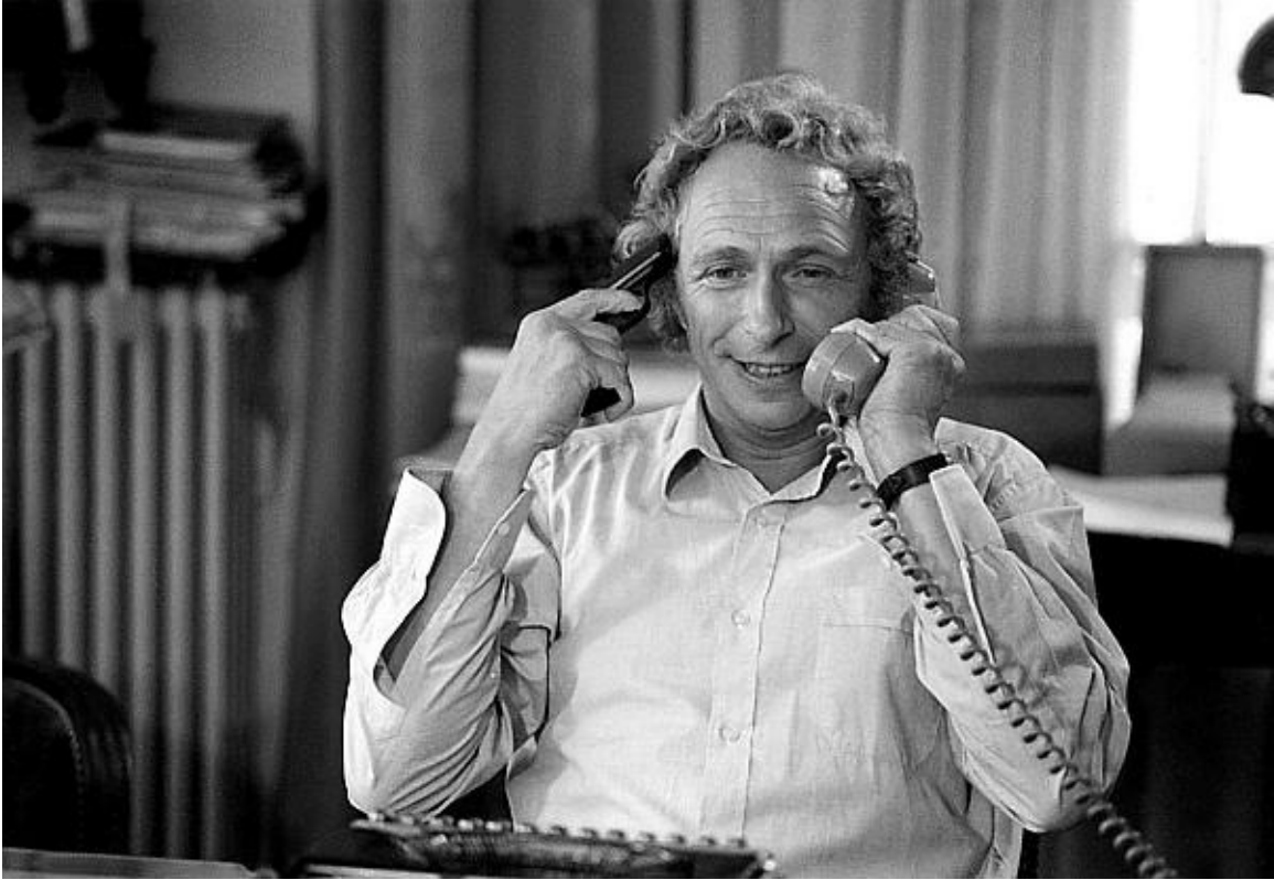
Пьер Ришар в фильме „Папаша“