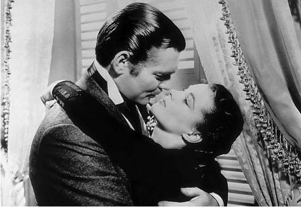
Хрестоматийный кадр из фильма «Унесенные ветром». Кларк Гейбл и Вивьен Ли