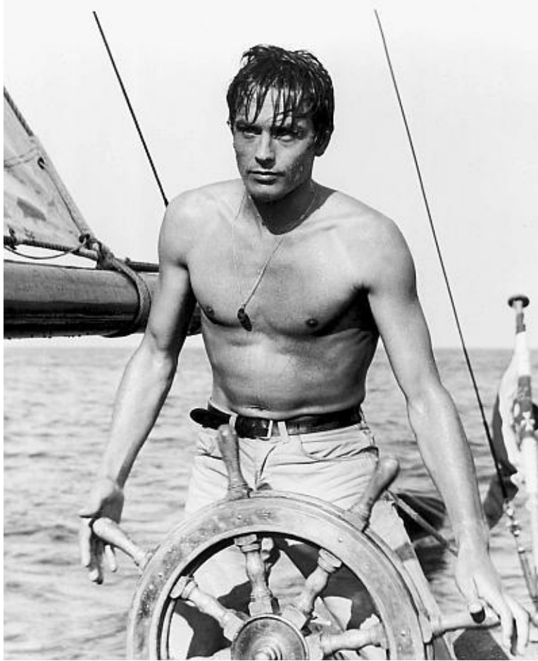
26-летний Ален Делон в фильме „Яркое солнце“. Франция. 1961 год