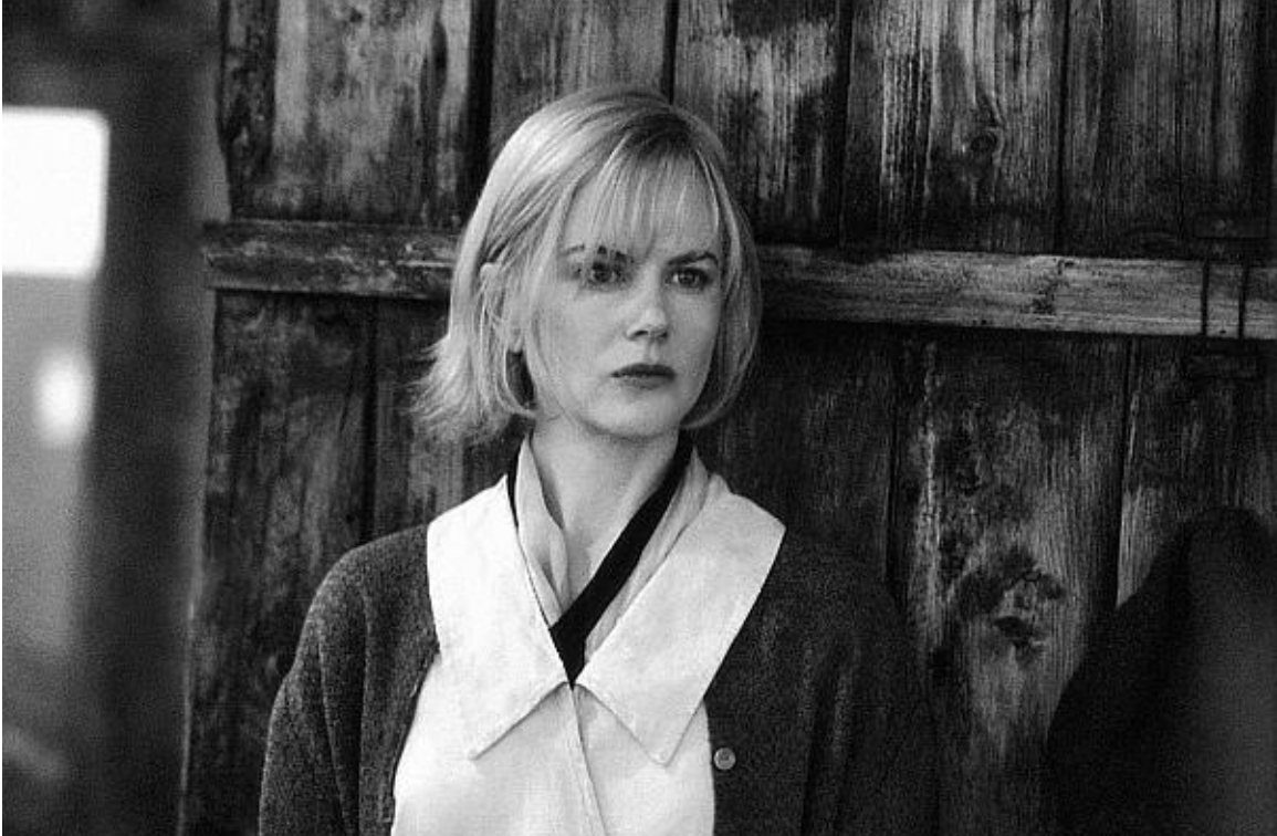
Кадр из фильма «Догвилль». 2003 год. Красивая Николь Кидман в «некрасивой» роли