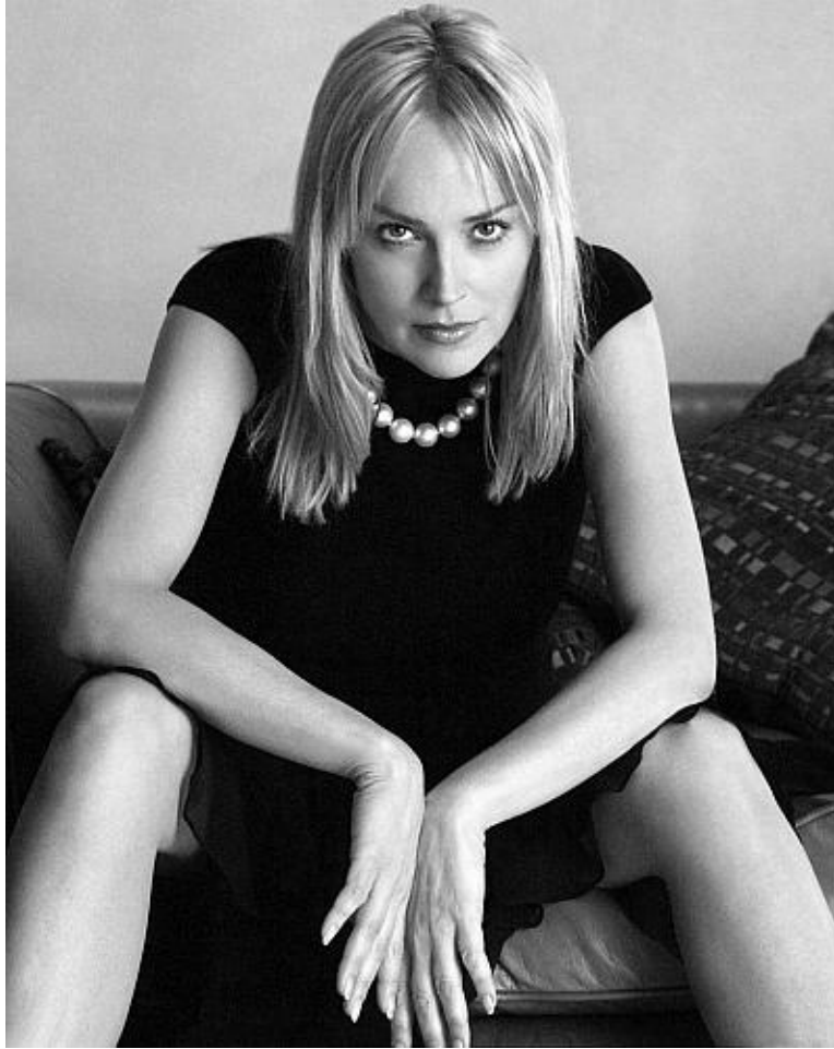
Шарон Стоун в фильме «Основной инстинкт-2»