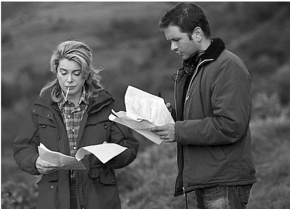
Катрин Денёв и Гаэл Морель. Рабочий момент съемки