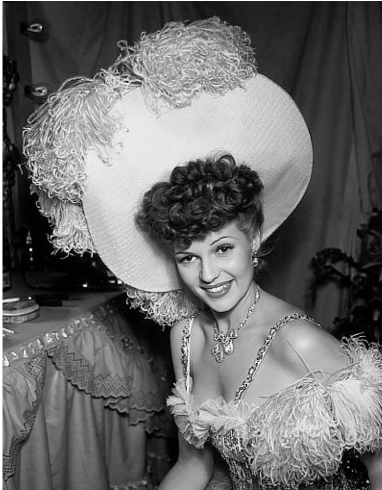
24-летняя Рита Хейуорт демонстрирует новую моду