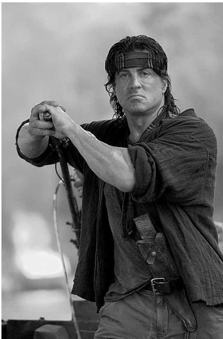
Сильвестр Сталлоне в фильме «Рэмбо-4»