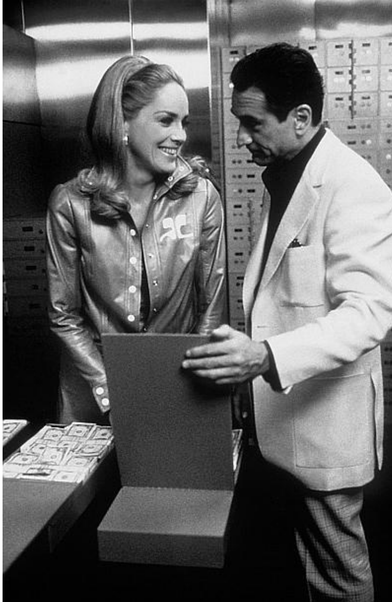
Шарон Стоун и Роберт Де Ниро в фильме «Казино» режиссера Мартина Скорцезе. 1995 год