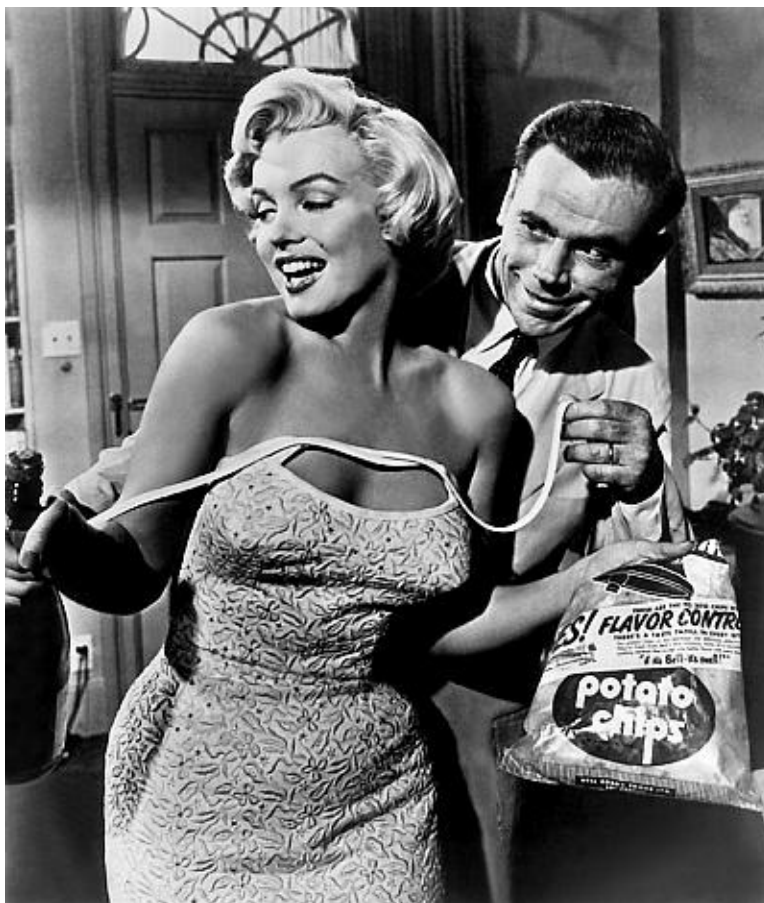
Мэрилин Монро в ленте «Семь лет желания» режиссера Билли Уайльдера. 1955 год