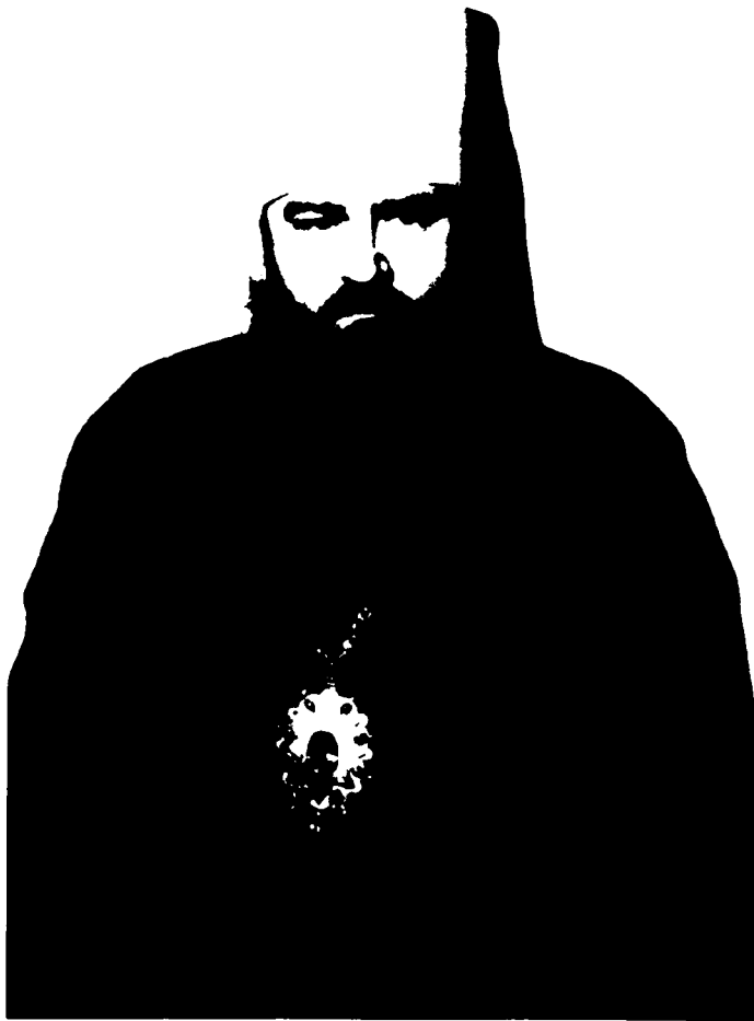
Митрополит Ленинградский и Новгородский Никодим (1929-1978)