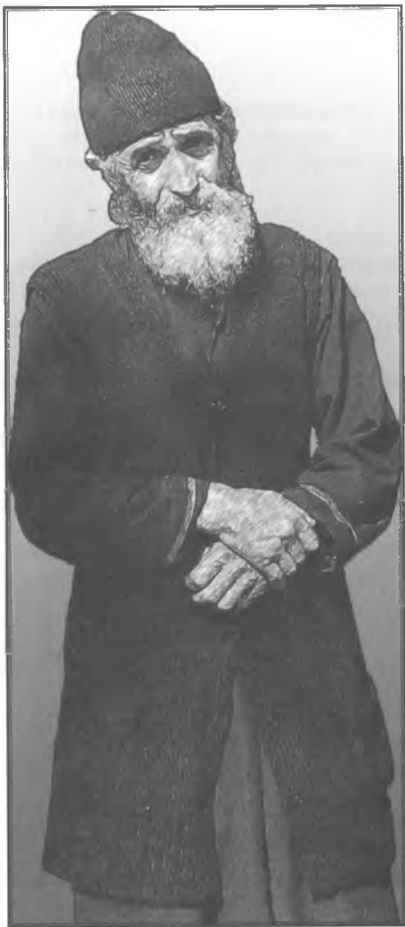
Старец Паисий Святогорец (1924 – 1994)