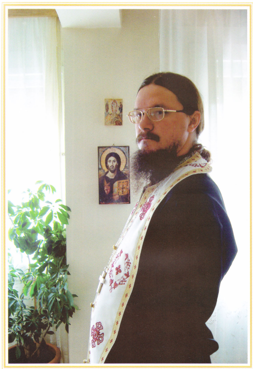
Македонија. Во време служби на квартирном храме