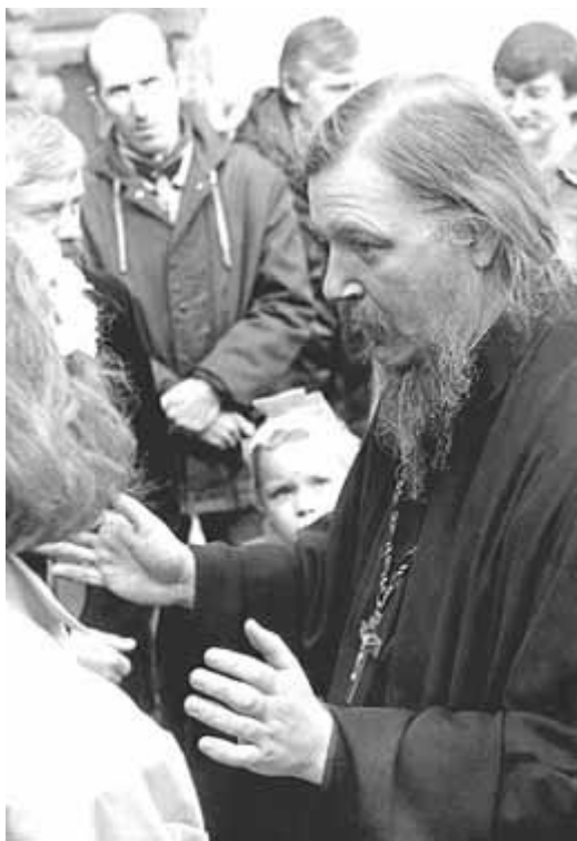
Беседа с прихожанами

Вот Достоевский, какой был умница, какой был талантливый, а смиренно к старцу Амвросию ездил в Оптину пустынь, что-то у него спрашивал. А что Амвросий? Простой человек, все время болел; лежал, народ принимал - то есть и тело угнетено, и никаких дарований нет. Был у него, правда, поэтический дар, он старался свои поучения давать в стихах. Стихи эти очень нескладные, чудные, потому что он человек простой, не как Борис Пастернак, но сколько в них премудрости. И запоминаются они очень быстро: "Без смиренья нет спасенья". Или, допустим: "Там, где просто, там ангелов со сто, а где мудрено, там ни одного". И он такими стихами и Гоголя просвещал, и братьев Киреевских, и Достоевского. Хотя Го-голь - уж такой талант! Есть ли более талантливый писатель на Руси, чем он? А тем не менее к старцу Амвросию ездил, потому что стремился к этой духовной красоте.