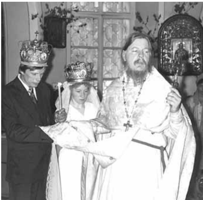
Венчание в Крестовоздвиженском храме

Дальше апостол пишет: "блуд и всякая нечистота и любостяжание не должны даже именоваться у вас, как прилично святым. Также сквернословие и пустословие и смехотворство не приличны вам, а, напротив, благодарение; ибо знайте, что никакой блудник, или нечистый, или любостяжатель, который есть идолослужитель, не имеет наследия в Царстве Христа и Бога". То есть если ты, живя на земле, Царствие Божие не