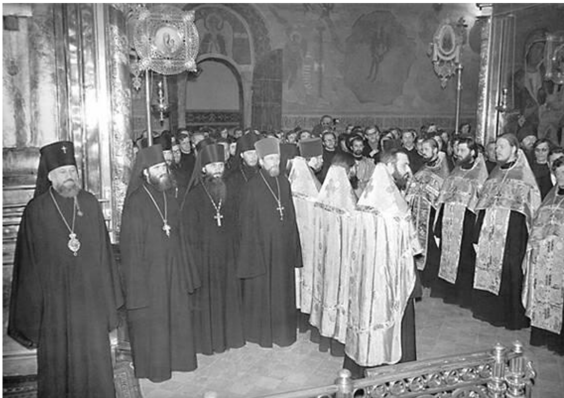
Молебен в Троице-Сергиевой Лавре на память преподобного Сергия, 1980 год