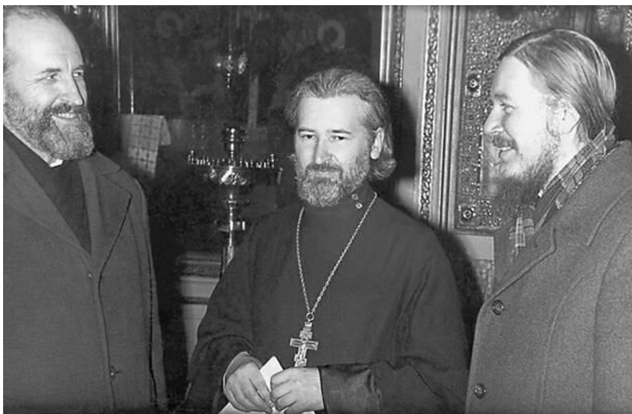
В Николо-Кузнецком храме