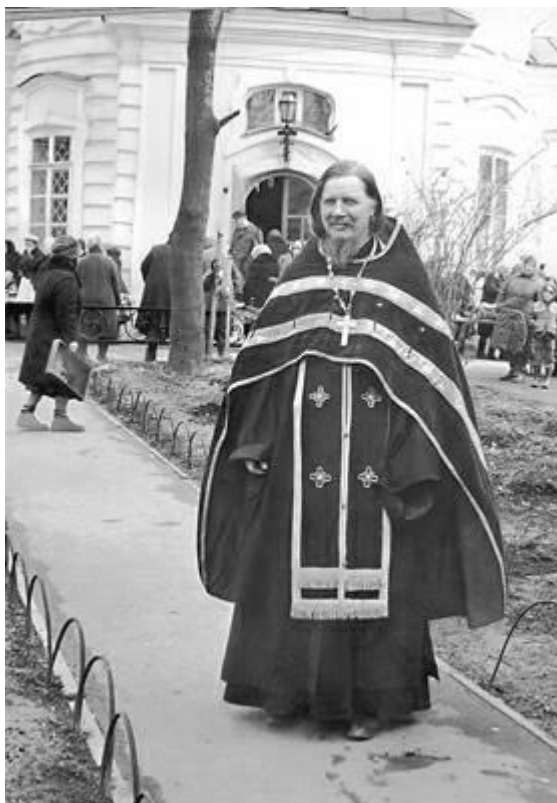
Пасха в Алтуфьево