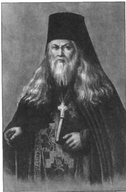
Преподобный Лев Оптинский Литография XIX века

Макария эти труды были бесценным руководством в стяжании внутренних добродетелей. Он внимательно изучал святоотеческие творения, а также переписывал их уставом, которым овладел специально для этого. Сделанные им точные списки с переводов преподобного Паисия впоследствии послужили основой для книгоиздательской деятельности Оптиной пустыни, а усвоенное святоотеческое учение помогло старцу Макарию в последующем окормлении многочисленных духовных чад.