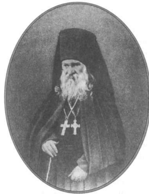
Преподобный Макарий Оптинский Литография. 1860-е годы