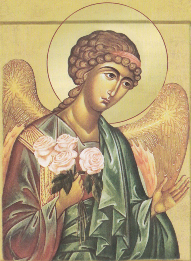
ѠА АРХ ВАРАХІНАЪ