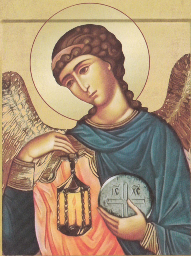
ОД АРХ ГАВРИЛАЪ