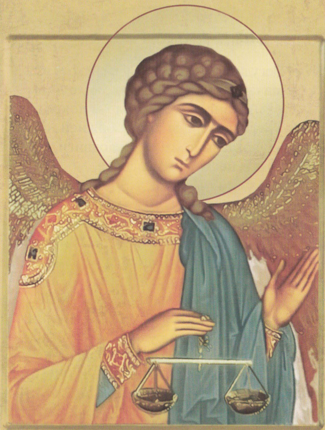
ОД АРХ ІЕРЕМІАЪ