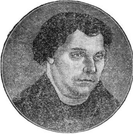
ЛЮТЕР. С портрета Кранаха, 1525. Виттенберг.