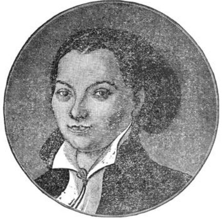
КАТАРИНА ФОН БОРА. С портрета Кранаха, ок. 1525. Берлин.

Вечером 13 июня, во вторник после воскресенья Троицы, он пригласил Бугенгагена, Юста Ионаса, Лукаса Кранаха с женой и профессора юриспруденции Апеля (бывшего декана собора в Бамберге, который сам женился на монахине) к себе домой и в их присутствии сочетался браком с Катариной фон Бора во имя Святой Троицы. Бугенгаген провел церемонию, как было принято. На следующее утро Лютер принимал своих друзей за завтраком. Юст Ионас сообщил о бракосочетании Шпалатину через специального гонца. Он был растроган до слез и видел в этом событии чудесную руку Божью 594 .