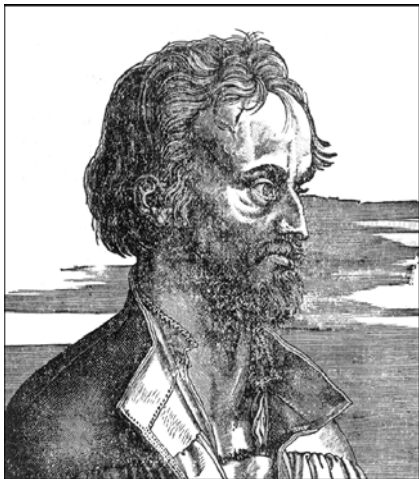
Меланхтон (с портрета Дюрера).

которые довелось испытать Лютеру. Его опыт был скорее опытом Иоанна, чем Павла. Он получил благочестивое воспитание дома. Ему доставляли наслаждение публичное поклонение, жития святых, а особенно — тщательное изучение Библии, которую он брал с собой даже на прогулку. Он прекрасно видел злоупотребления в церкви и необходимость реформы. Его классическое образование и близость с Рейхлином, благородным защитником еврейской учености от монашеского невежества и мракобесия, предрасположили его к евангельскому движению, которое развернулось в Виттенберге за несколько месяцев до того, как он покинул Тюбинген.