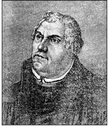
ЛЮТЕР. (С портрета Кранаха в городской церкви Веймара.)

Юность Лютера была трудной, без светлых воспоминаний. Воспитывали его строго. Когда он стащил какой-то маленький орех, мать била его до крови. Отец однажды высек его так жестоко, что он убежал и какое-то время злился 119 ; но