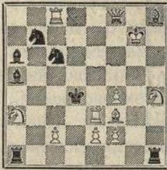
Обратный мат в 13 ходов.