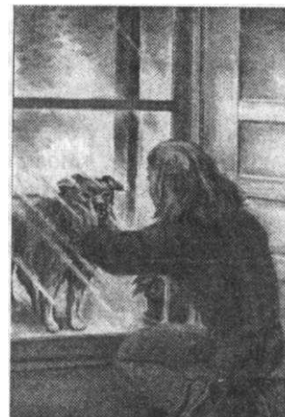
Сон про стеклянную дверь. 1980 год.