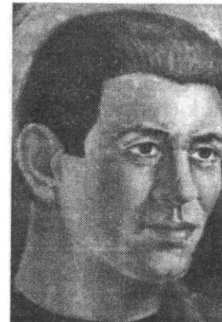
Вымышленный персонаж. 1968 год..

«Среда, 13 августа, 1980 года. Звонила Мэри. Со времени нашего последнего разговора она решила уйти от мужа...»