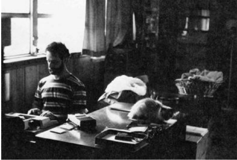
Джим расшифровывает сеанс 89 днем 9 июня 1092 года. Шоколадный Батончик, один из четырех котов, наблюдает за процессом.