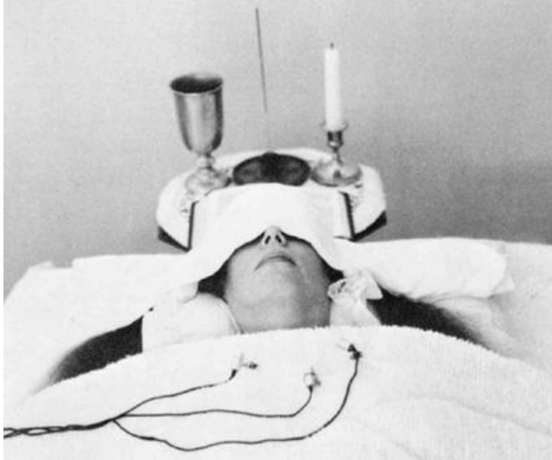
Ра, сеанс 2, 20 января 1981 года: "Инструмент укрепило бы белое одеяние. Инструмент должен быть укрыт, лежать ничком, глаза накрыты белым". 9 июня 1982 года.