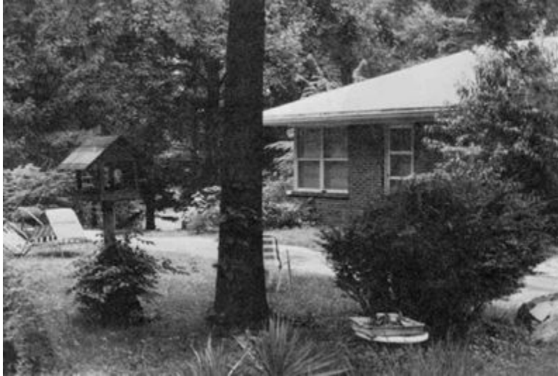
Внешний вид комнаты Ра: дверь и угловые окна комнаты, в которой с января 1981 года происходили сеансы с Ра. 9 июня 1982 года.