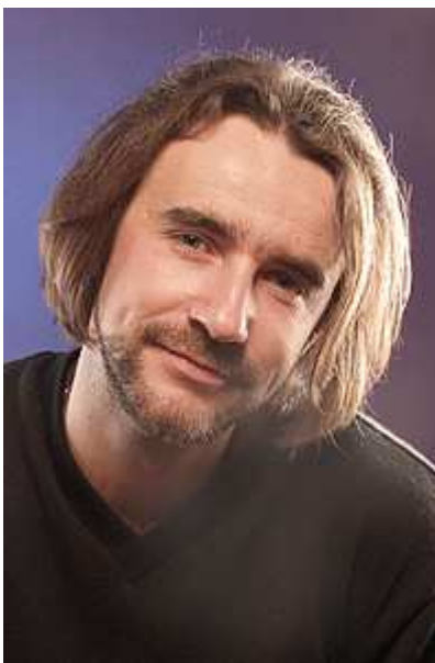
Александр Мордерер, фотограф

Выбирая модель для съемки, я доверяю портфолио, в котором есть образцы рекламных работ. Хорошему фотографу не составит труда за один съемочный день отснять модель в нескольких образах. Но буки с тестовыми фотографиями могут привлечь лишь непрофессиональных заказчиков. Профессионалу нужны доказательствами опытности модели. Поэтому не забывайте пополнять портфолио фотографиями с показов, страницами из журналов и рекламными работами. Ваш бук должен представлять вас наиболее выигрышным образом. Если вы работали с новым фотографом, если ваше фото появилось на обложке журнала, если вы стали лицом рекламной кампании — портфолио должно рассказать об этом заказчикам. А если вы поменяли образ: покрасили волосы, изменили прическу, округлили грудь или увеличили губы — нужно дополнить бук новыми фотографиями, потому что вы стали другой.