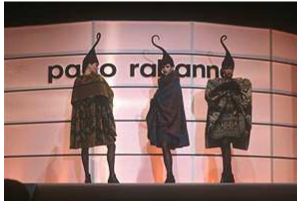
Haute couture (Высокая мода)

Haute couture (Высокая мода) — самый престижный вид показов. Как правило, показы Haute couture проходят два раза в год, зимой и летом, и самой шумной по-прежнему остается Неделя высокой моды в Париже. Настоящим couture считается одежда, созданная в Домах высокой моды — это вершина искусства и мастерства, которое может продемонстрировать модельер. Вещи Haute couture создаются ручным способом в единственном экземпляре, для их изготовления используются дорогие материалы, уникальная фурнитура и самые современные технологии.