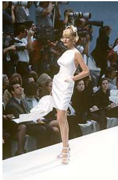
Prêt-a-porter («готовое платье»)

В показах Haute couture, как правило, принимают участие известные модели, которые привлекают внимание прессы не меньше, чем сама коллекция. В то же время существует обратная связь: модель, которая принимает участие в показе Haute couture, серьезно повышает свой рейтинг. Когда неизвестная модель завершает показ в свадебном платье у известного кутюрье, она делает шаг в категорию «топ». Триумфальный выход на подиум будет растиражирован средствами массовой информации, а топ-модель — это лицо, которое знают во всем мире.