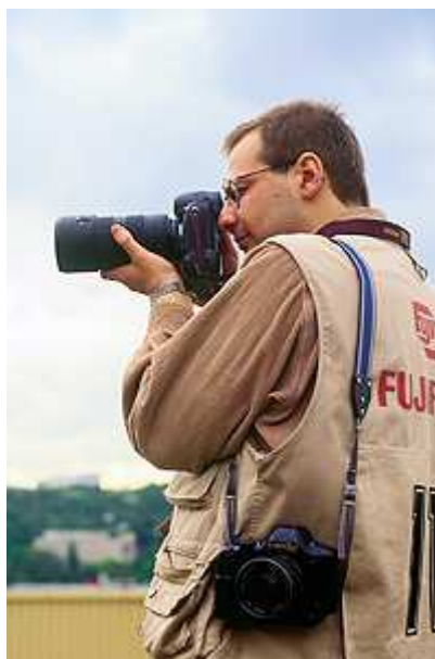
Валентин Карминский, фотограф

Независимо от того, какую манеру съемки выбирает фотограф, модель должна уметь позировать. Она должна знать, в каких ракурсах выглядит более фотогенично, и какое выражение лица наиболее удачно. Модель должна знать, что ей можно делать в кадре, а чего делать не стоит, кроме тех случаев, когда следует прямое указание сделать так, а не иначе. Конечно, фотограф выскажет замечания по поводу вашей работы: посоветует изменить позу или обратит ваше внимание на выражение лица, которое понравилось ему больше всего. При этом модель не имеет права возмущаться и протестовать, когда ей кажется, что фотограф запечатлел ее (по ее мнению) неудачно. Нужно понимать, что на съемках работают специалисты, которым виднее, что лучше сделать для того, чтобы получить задуманный сюжет. Стоит помнить, что от модели прежде всего ждут профессионализма.