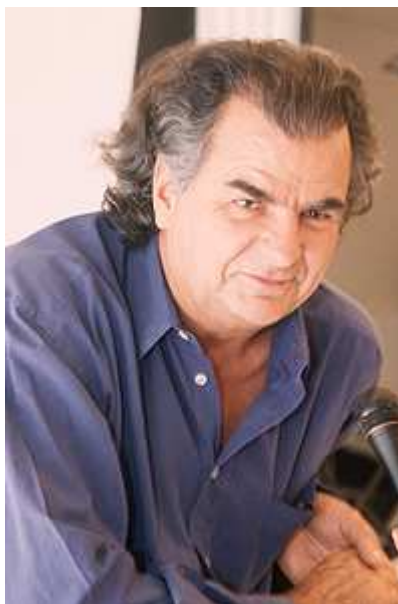
Патрик Демаршелье, фотограф

Настоящая работа — это поймать модель в момент спокойствия. Вот тогда модели получаются естественными и красивыми. Вот тогда я их и фотографирую.