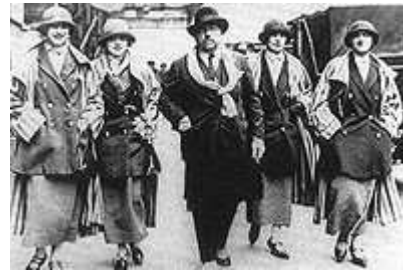
Поль Пуаре и его модели

Первое упоминание о модельном бюро, датированное 1915 годом, историки моды обнаружили в Соединенных Штатах. Примерно в то же время мадам Люсиль, открывшая свой Дом моделей в Лондоне в 1890 году, устроила в Нью-Йорке шоу с участием 150-ти манекенщиц, по масштабу вполне сравнимое с современными показами. Чарльз Ворт стал первым европейским модельером, который начал демонстрировать свои авторские коллекции на девушках-моделях. В 1911 году эту идею развил известный дизайнер Поль Пуаре, который организовал тур по городам Европы со своей командой манекенщиц.