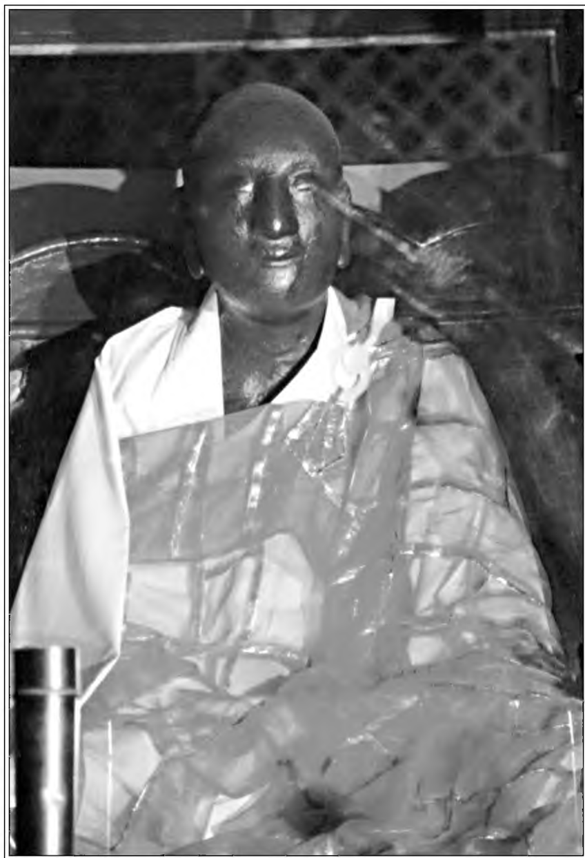
Чань-буддийский патриарх Ханьшань Дэцин