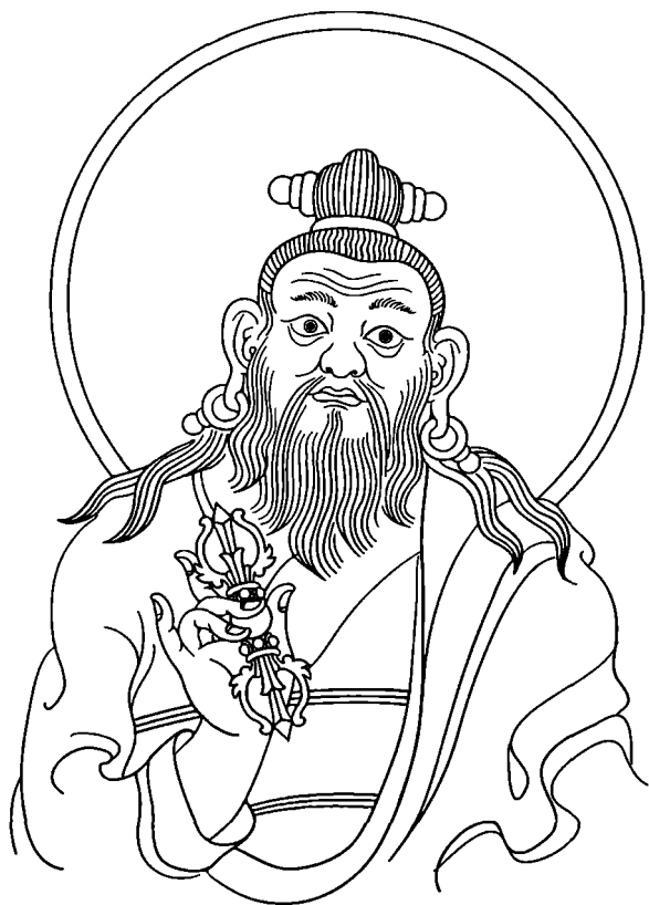
Дуджом Лингпа (1835–1904) Рисунок Уинфилда Клейна