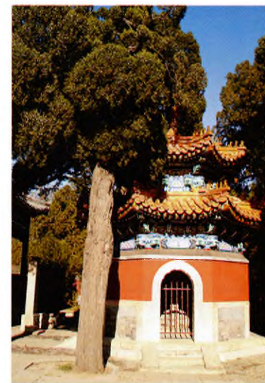
Монастырь Биюньсы (окрестности Пекина)