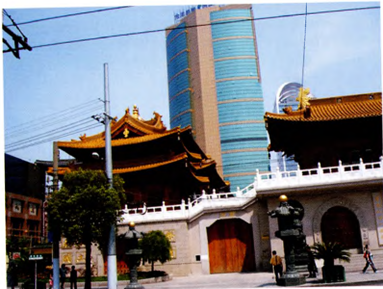
Монастырь Цзинаньсы (Шанхай)