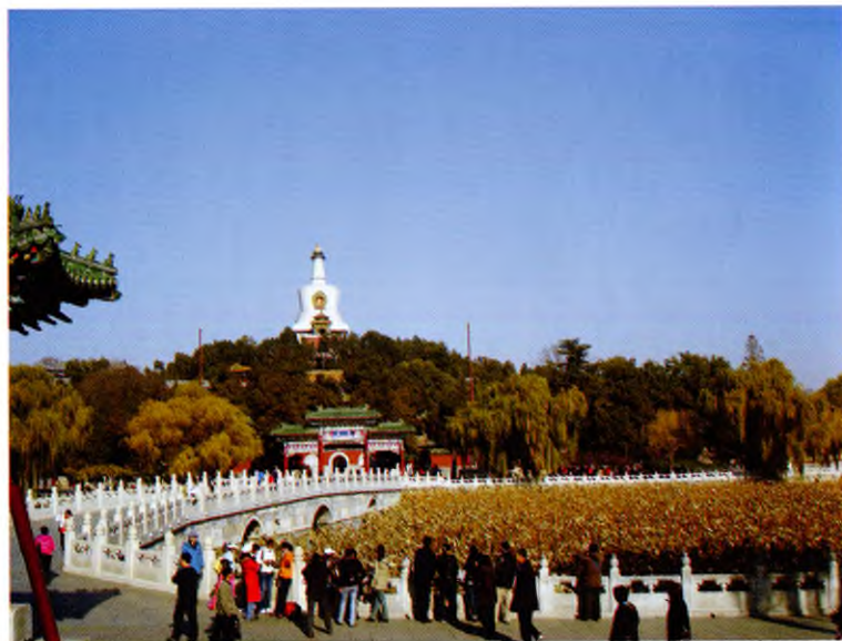
Белая пагода (Байта). Парк Бэйхай (Пекин)