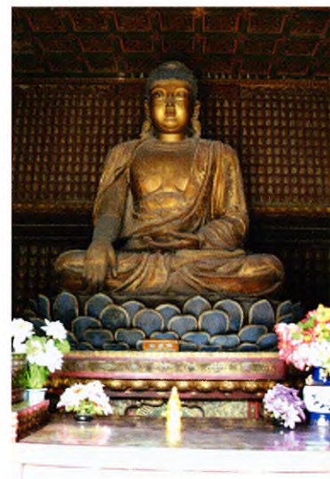
Будда Шакьямуни. Монастырь Чжихуасы