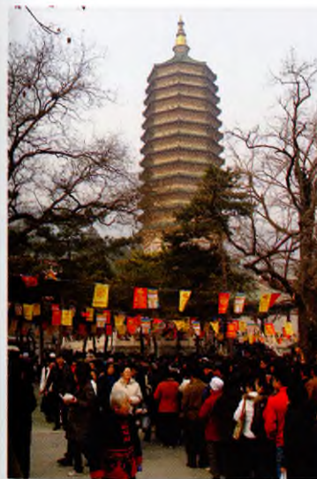
Пагода Зуба Будды (Фоята) в Бадачу (окрестности Пекина)