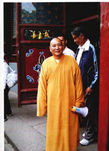
Буддийский монах из монастыря Пуцзисы (Путошань)