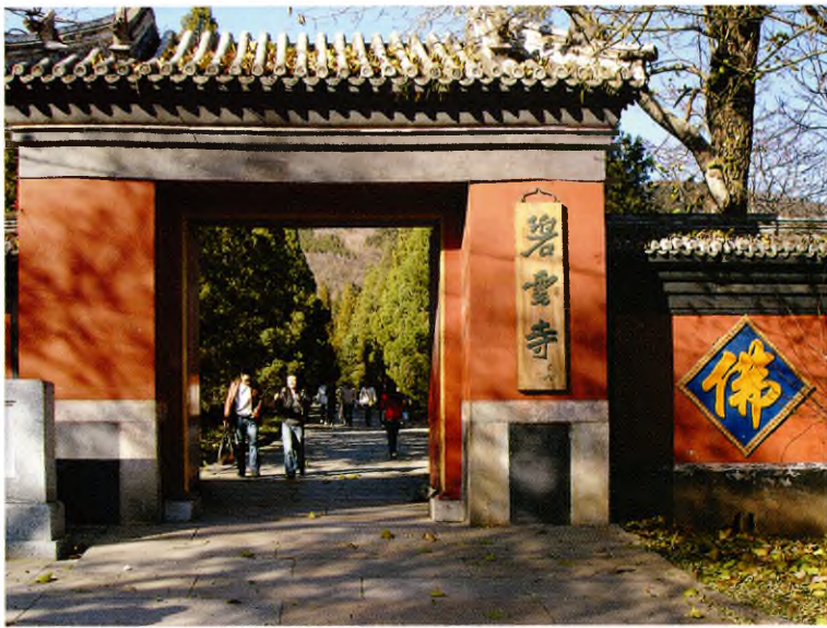
Сяншань (окрестности Пекина). Вход в монастырь Биюньсы