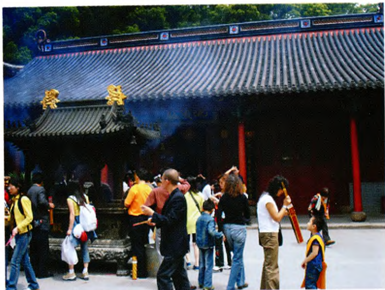
Монастырь Пуцзисы (Путошань)