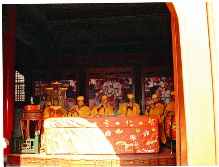
Монастырь Чжихуасы (Пекин)