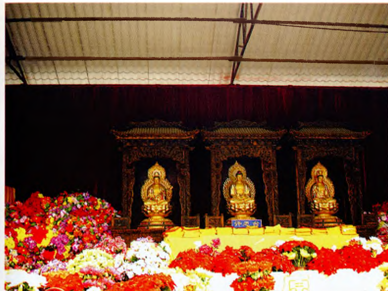
Алтарь храма Лингуансы в Бадачу (окрестности Пекина)