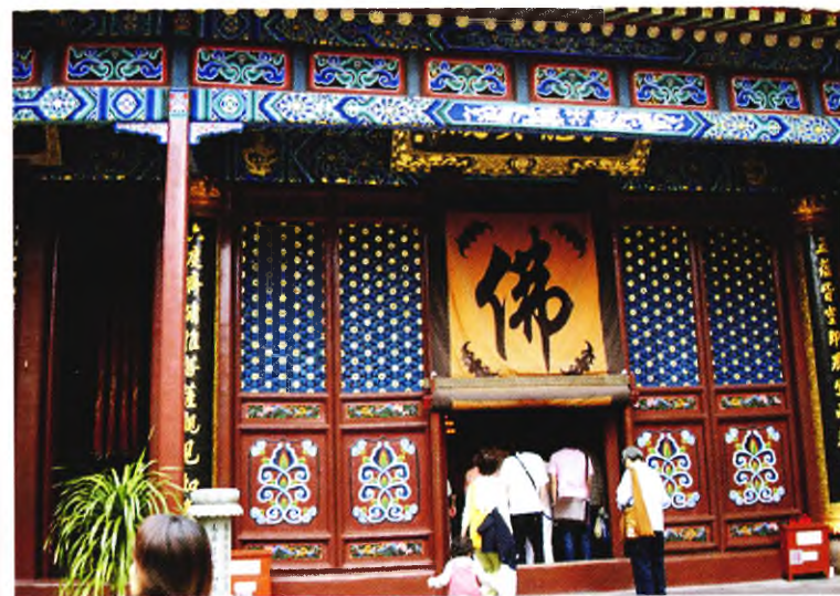
Монастырь Хуэйцзисы (Путошань)