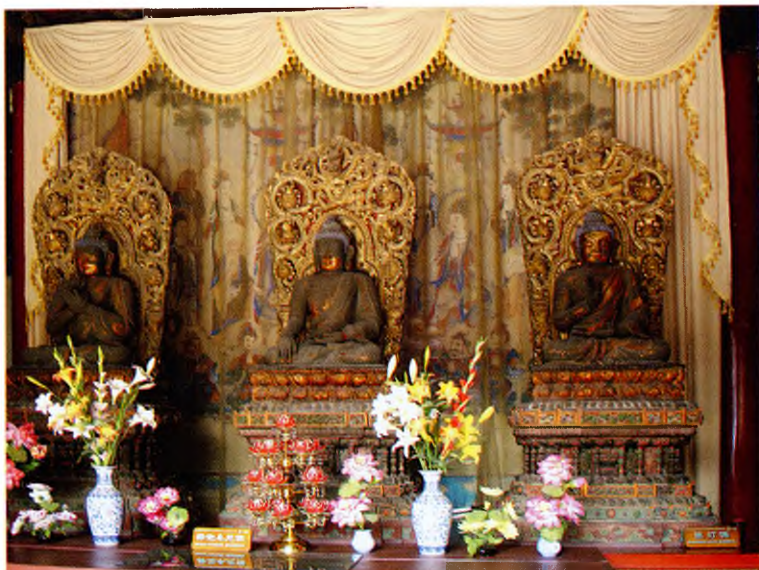
Монастырь Чжихуасы. Алтарь