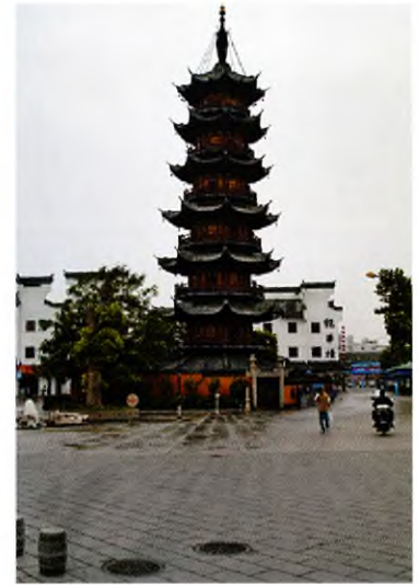
Пагода около монастыря Лунхуасы (Шанхай)