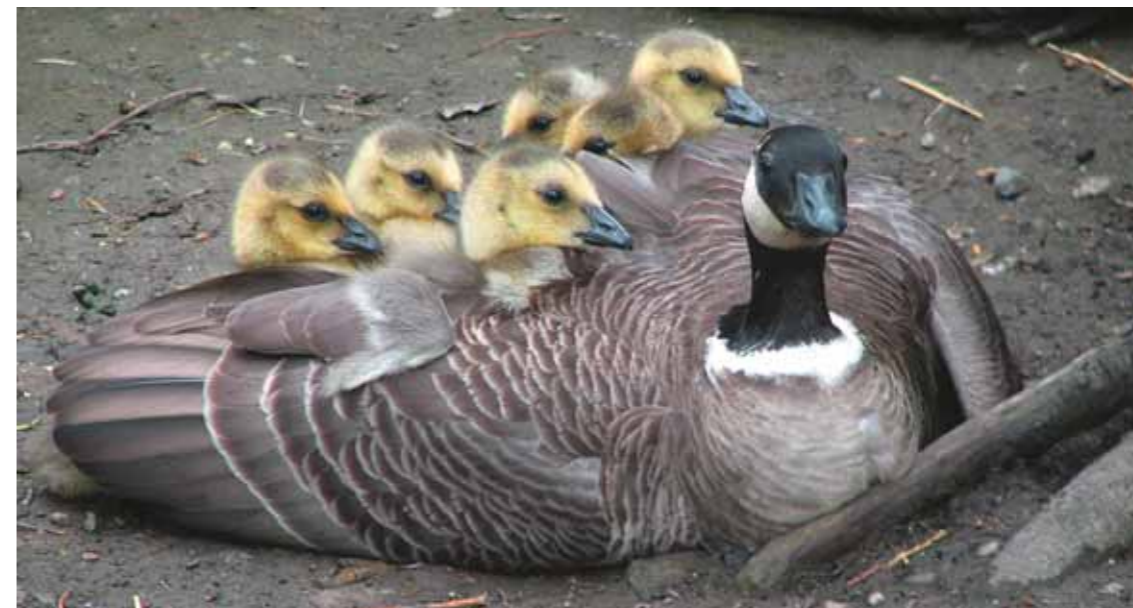
Казарки — очень заботливые родители

У мелких птиц период больших забот и нескончаемых. Им сейчас не до песен: надо кормить родившихся ещё в прошлом месяце, но ещё требующих внимания постоянно голодных детей, к тому же птицы боятся привлечь к ним врагов. Но, оказывается, в это лето они замолкли ещё не совсем. И вот уже вновь без купюр исполняет свою арию соловей-красношейка, ему вторят малые мухоловки, овсянки, нет-нет да опять во весь голос заявит о се-