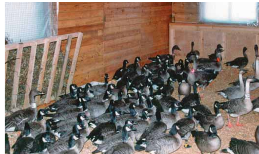
С ноября гуси ночуют, а в морозные дни и днюют в зимнике

С выпадением снега с территории питомника исчезают домовые воробьи, безраздельно пользующиеся ею летом. Остаются воробьи полевые. Раньше я как-то не обращал на это внимания. Так же случилось и в ноябре 2006 года. Зима в этот раз у нас выдалась на удивление «безптичья»: ни снегирей с осени, ни чечёток, ни синиц-гаичек. И только в конце декабря у нашего крыльца появились сначала два, потом стали прилетать три, а затем кормились уже шесть полевых воробьёв. Они были чу-