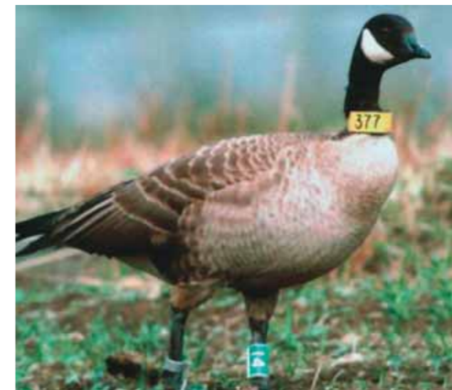
Одна из первых наших казарок в Японии

Сейчас же на фото мы видим одну из самых первых наших казарок, оставшихся зимовать на острове Хоккайдо. Прилетела ли она туда вместе с лебедями или присоединилась к ним только в Японии, не известно. И здесь семья из двух взрослых и шести молодых кликунов явно приняла, «усыновила» нашу казарочку на трудное для неё время зимовки. Коллеги сообщали, что другие лебеди, пытавшиеся как-то обидеть, прогнать сидзюкара-ган, тотчас семьёй изгонялись сами. Такой вот удивительный феномен проявления межвидового альтруизма.