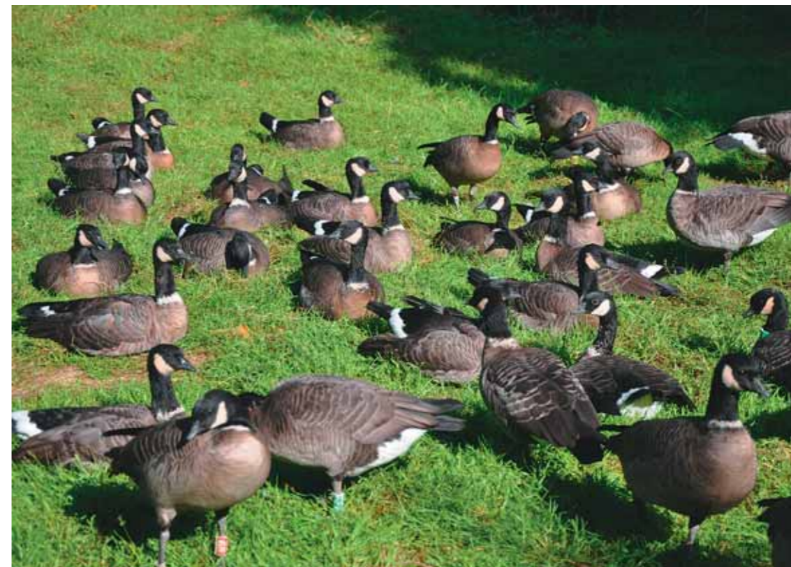
У казарок подрезаны крылья, им предоставлена относительная свобода

Нашим гусям этой осенью лететь куда не предстоит, на одном крыле у них подрезаны маховые перья, но они, похоже, с этим ещё не смирились. Казарки вдруг начинают «лететь» по территории всей стаей. Конечно же, это всего лишь бег с частыми взмахами не способных к полёту крыльев. Иногда спокойно кормящаяся до того на траве стая вдруг, будто чем-то испуганная, вся враз взрывается взметнувшись вверх веерами крыльев. Точь-точно так же взрывоподобно взлетали испуганные тихоокеанскими орланами — Haliaeetus pelagicus чёрные казарки —