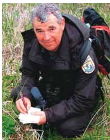
Вернон Бёрд, о-в Булдир