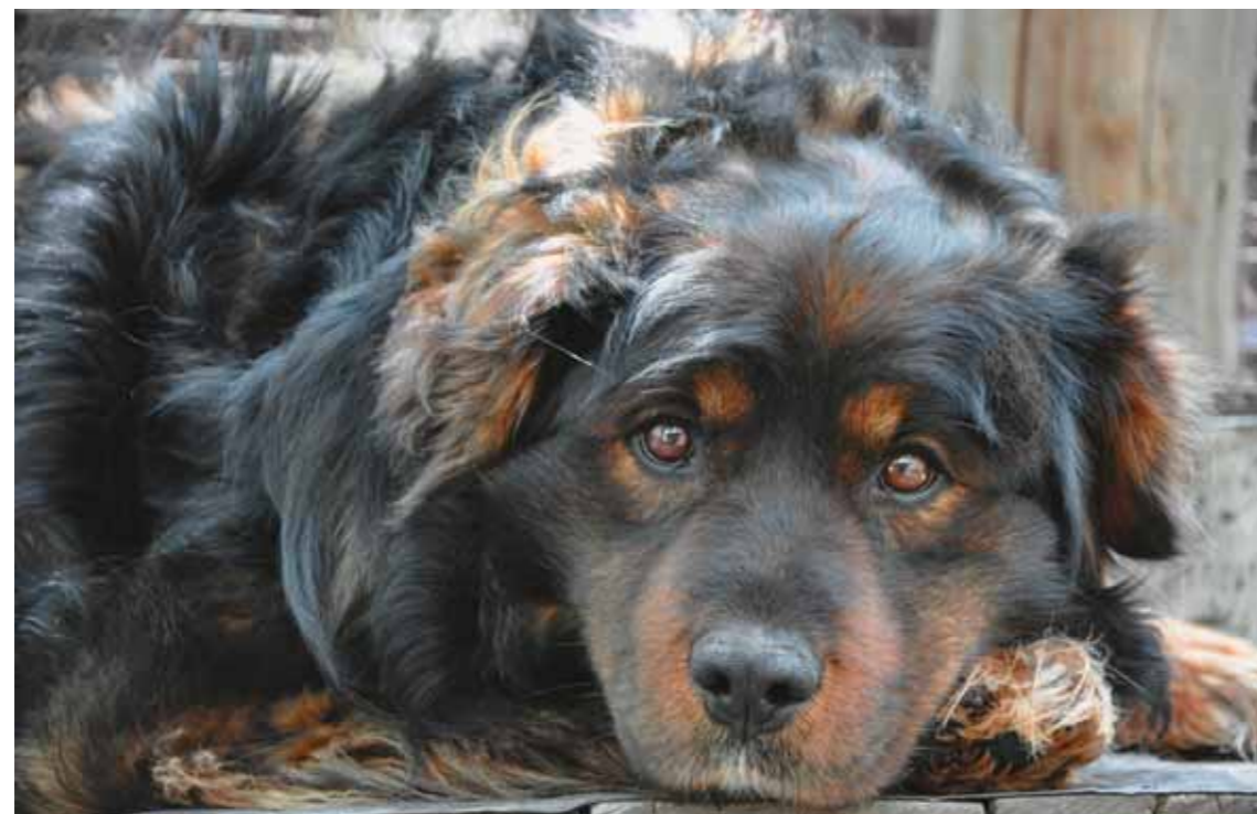
Наш верный охранник Гром

Этот год был в череде тех, когда бессонница и нелёгкие думы мучили меня особенно часто. Какого понимания наших задач, наших трудностей можно ожидать от некоторых зажавшихся чиновников Камчатки, если «Скажите, а кому всё это надо?» задаёт будущая (это не оставляло сомнений уже ни у кого) «первая леди» России.