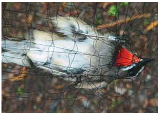
Впервые этот красношейка побывал в наших сетях шесть лет назад

Голоса летящих над Авачей на юг перевозчиков и крачек — Sterna hirundo ещё