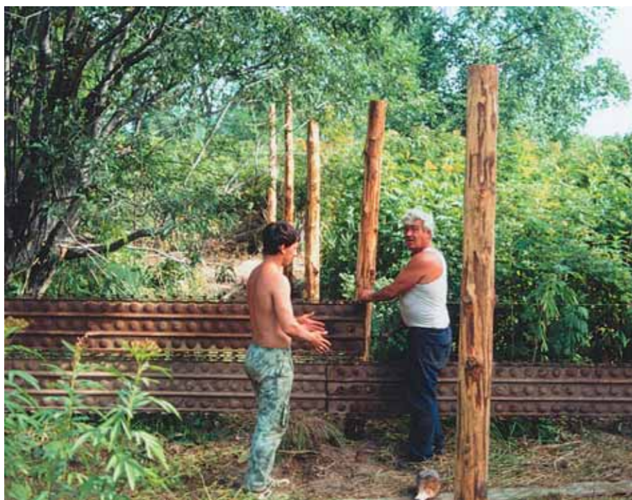
Закладывается вольерный комплекс

скал всю давно уже идеально очищенную от былого изобилия территорию. На свалке набрал несколько кусков кем-то использованных и выброшенных ржавых труб, сложил их около ворот. В питомник зашёл главный инженер.