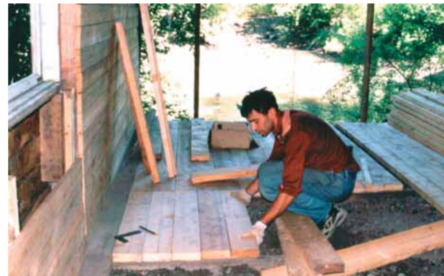
Строится «вторая очередь» зимника

— Коллеги, давайте объединим наши возможности: ваши птицы и ваши деньги, наши птицы и наша работа. Выпускать гусей будем в местах их бывшего обитания. Этот проект мы сделаем вместе. Только вместе.