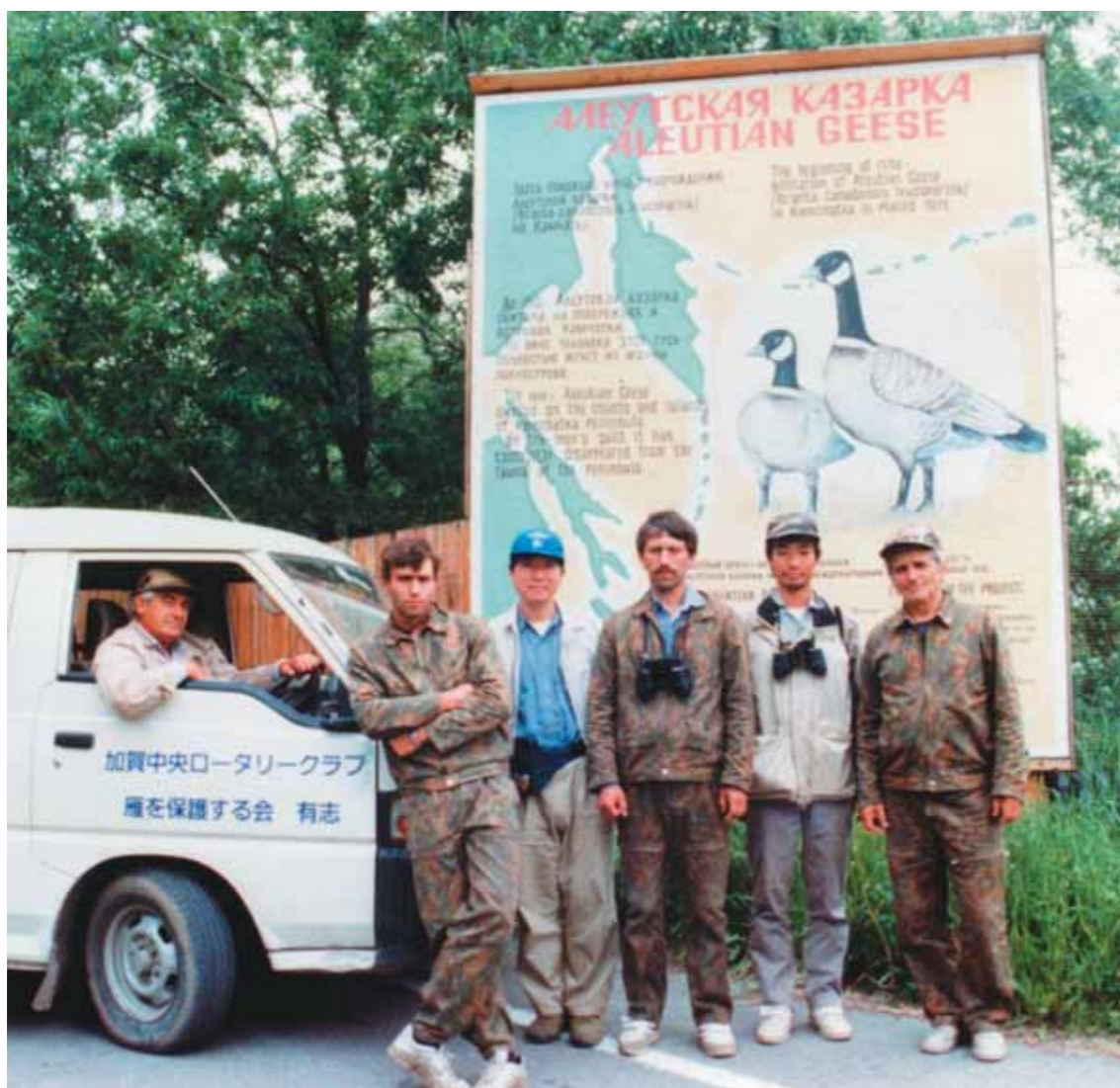
Мы начинали это вместе, середина 1990-х годов

Здесь моя дневниковая запись от 15 января 2008 года: «Сейчас, оглядываясь назад, я понимаю, в какую авантюру в том далёком 1989 году вверг не только себя, но и многих поверивших в меня людей. И