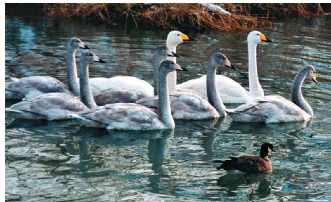
Семья кликунов, принявшая в свою стаю алеутскую казарку

Основным критерием, определяющим успешность наших усилий, является рост числа птиц на исторических японских зимовках. Выпуски казарок продолжались: 28, 16, 12 птиц были завезены на Экарму в последующие годы. Закончились они едва