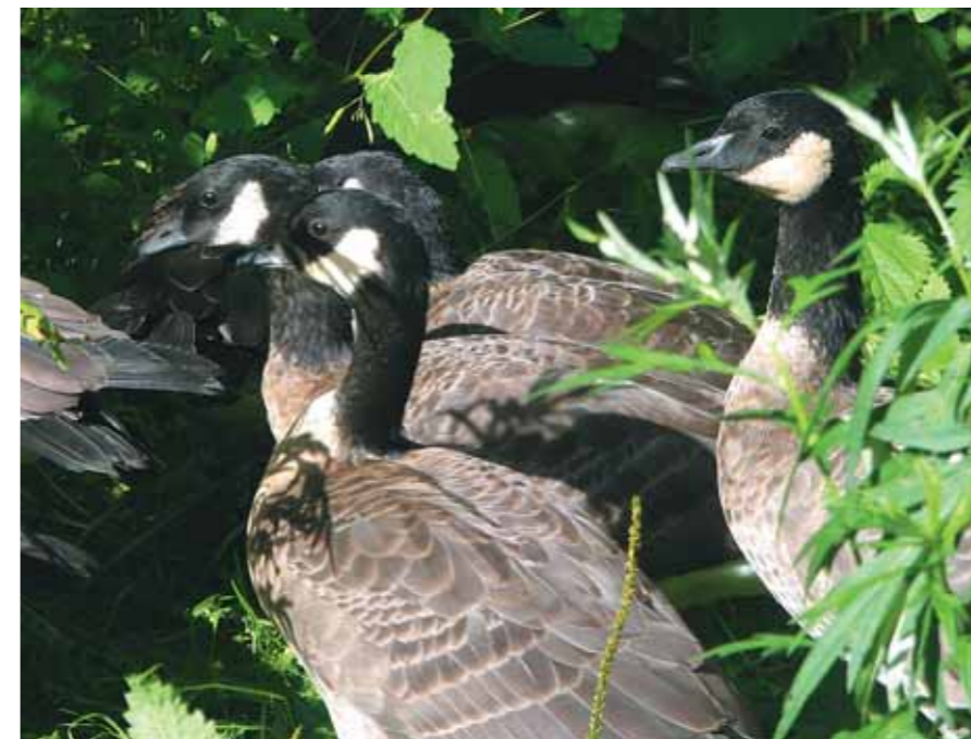
Островная растительность и кормит, и защищает этих птиц

На беду гусей, мясо их пришлось по вкусу мореходам. Люди убивали их без меры, ловить беззащитных птиц помогали привезённые на судах собаки. Уходя с островов, промышленники заготавливали «гусятину» впрок. Часть российского люда, а с ними и собаки оставались на островах на