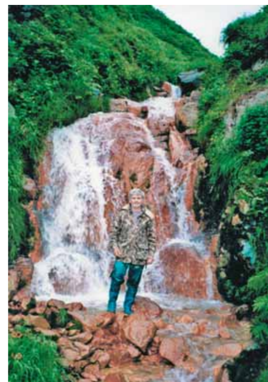
И таких водотоков на Экарме немало

Вздыбленный рельеф острова Экарма уже по своему строению предполагает наличие глубоких распадков. По ним вопреки сообщениям Сноу в море стекает, очевидно, не менее десятка немногочисленных, но не иссякающих в течение лета небольших