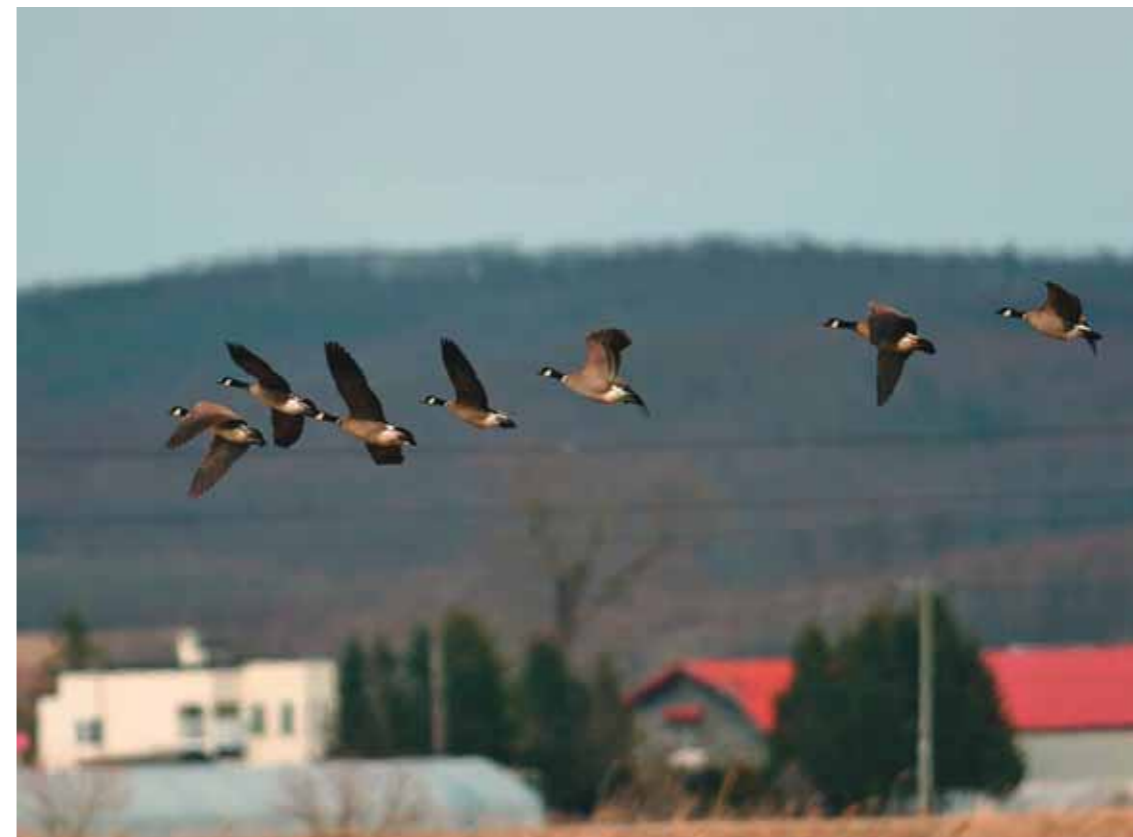
И они таки возвращаются. Япония, о-в Хонсю, 10 апреля 2007 г.

то моё заявление о готовности выполнить едва ли вообще выполнимое отнюдь не опиралось на разум, на трезвые расчёты. Но было огромное желание сделать это, уверенность в своих силах и возможностях, настоящая вера в исполнимость заявленного. Далёкий от политики, мог ли я знать, что живу реалиями, которые в те дни уходили в невозвратную для нынешних поколений историю. И, конечно же, ни я, ни мои коллеги не могли представить тогда глубину пропасти, на краю которой скоро мы, исполнители этой авантюры, окажемся.