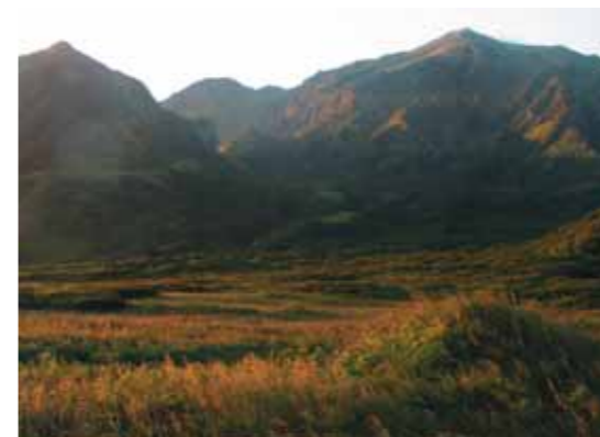
Место всех последних выпусков птиц