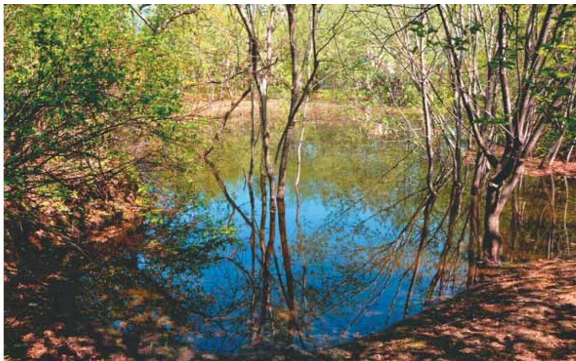
Фрагмент озёрной части территории питомника

Когда только-только были закопаны те первые три столба, а место будущих вольеров ещё находилось в абсолютной власти шиповниковых джунглей, девушка-гид привела к нам троих немецких туристов — любителей птиц: руководителя одной из европейских ассоциаций защиты хищных птиц, его жену и товарища. Все с тех пор прошедшие годы я очень сожалел, что не взял тогда у них визитных карточек. Стоя около сплошных зарослей шиповника, я буквально «на пальцах» рассказал гостям о том, что и ради чего здесь скоро будет. Гости видели и понимали, что я делился с ними всего лишь своими грёзами, но, очевидно, мой рассказ был очень убедителен — коллега достал из кармана две банкноты по 500 немецких марок и протянул их мне.