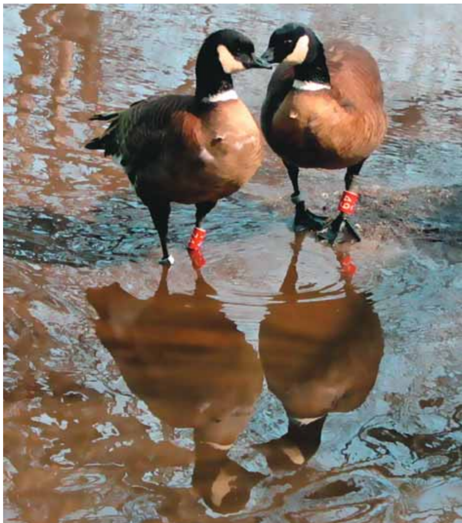
Последние дни марта и первое объяснение в любви

Год 2007-й. «Март нынешнего года с самого своего начала кажется действительно весенним: все дни конца первой недели, вся вторая неделя радуют плюсовой температурой. К середине месяца с нашей крыши, правда, только с солнечной стороны дома, свесились более трёх десятков сосулек, и некоторые из них длиной не менее метра. Во дворе уже несколько дней стоят небольшие лужи. Утром, перед выпуском гусей из зимника, я ломаю в них лёд, очищаю от льдин воду, и птицы, едва открываётся дверь, сразу бегут к лужам купаться».