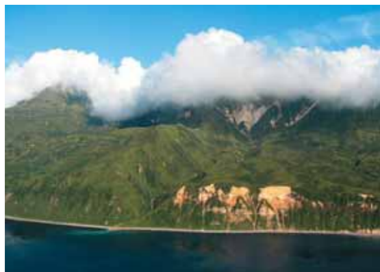
Береговая линия острова Экарма, в основном, представлена крутыми обрывами