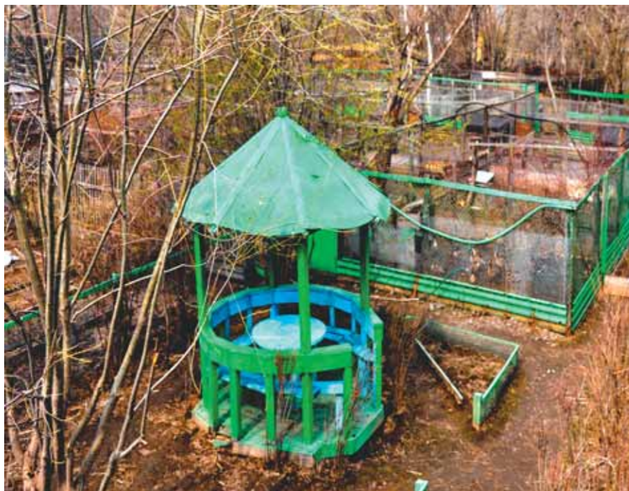
Фрагмент территории питомника в третьей декаде мая

не хотим их торопить, они ещё могут самостоятельно, без нашей помощи создать настоящие пары и иметь в этом году детей. И вот уже видим, что припозднившийся с подбором подруги молодой самец-двухлеток начинает демонстративно опекать родившуюся в прошлом году самочку, отгоняет от избранницы мнимых соперников. Скорее всего, подтолкнуло его к этому бурное кипение страстей у пар, находящихся в вольерах. А вот самочка, нам это хорошо заметно, не очень-то к нему и расположена: для создания семьи она ещё молода и созреет для полноценного брака, в самом лучшем случае, ещё через год. И ни она, ни её поклонник не знают того, что уже в конце нынешнего лета ей предстоит узнать, что такое настоящая свобода. Казарочку, это уже решено, через три месяца мы выпустим на волю.