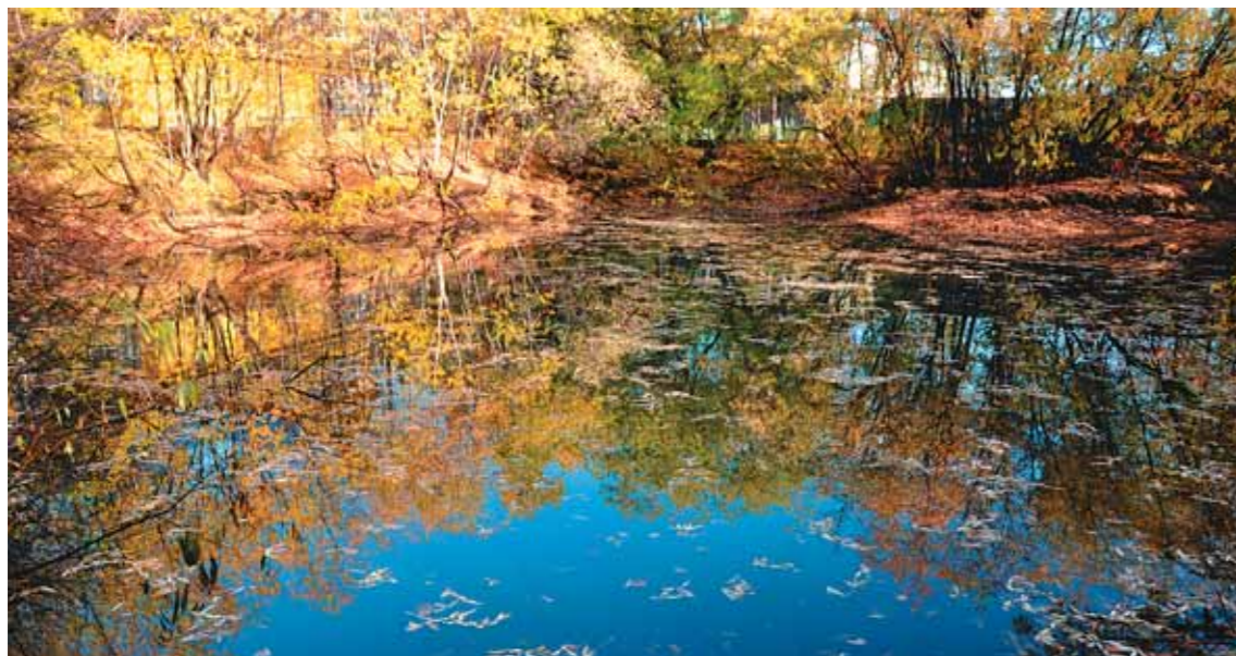
Наш водоём в первой декаде октября