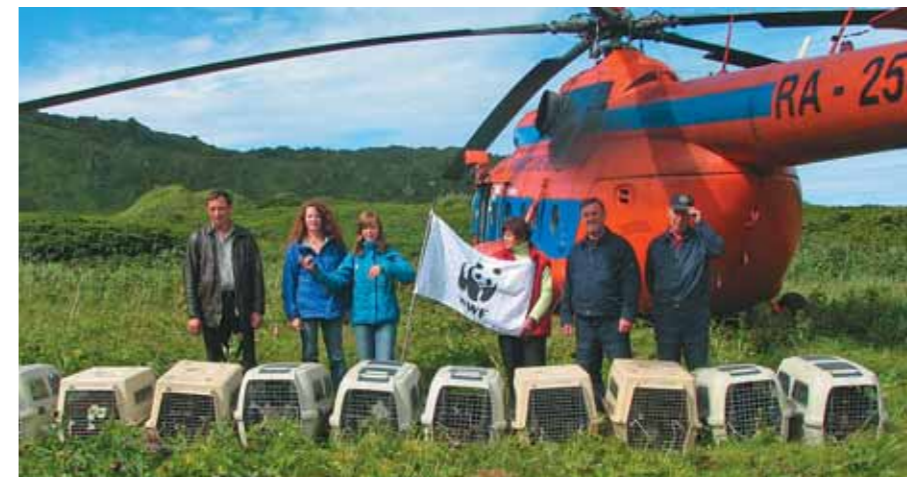
Экарма, год 2005-й

А в последний день этого года мы получили самый драгоценный новогодний подарок — сообщение о прилёте в Японию четырёх наших птиц! Это стало первой на-