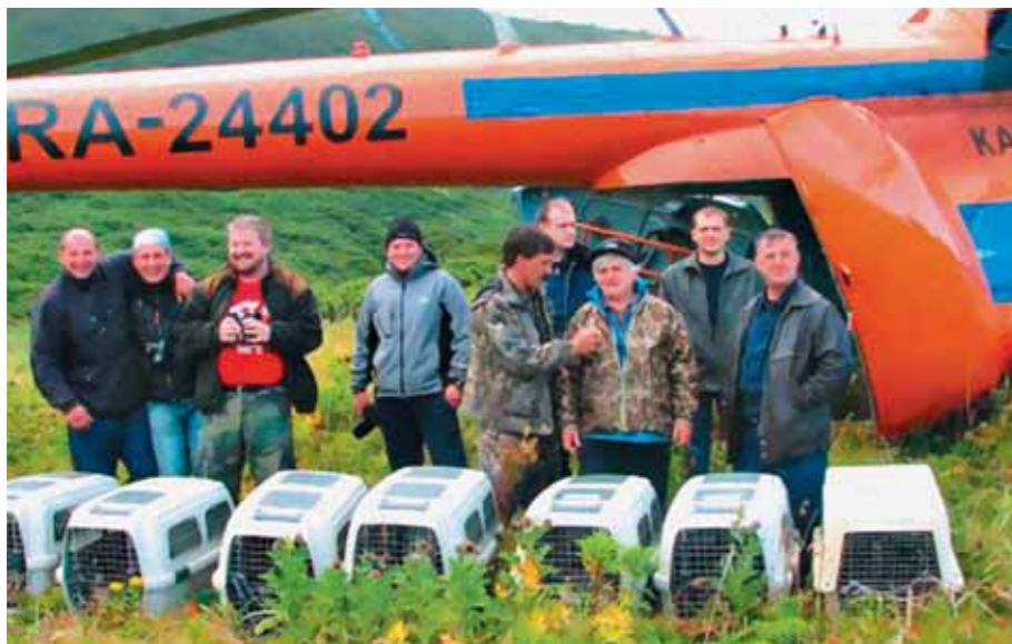
Это тоже год 2006-й, но уже сентябрь

шей победой, и первые бокалы при проводах уходящего 1997 года мы подняли за этот успех, за наших казарочек.