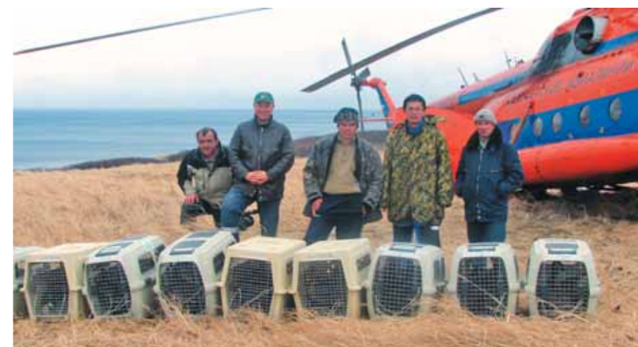
Единственный весенний выпуск, Экарма, май 2006 года