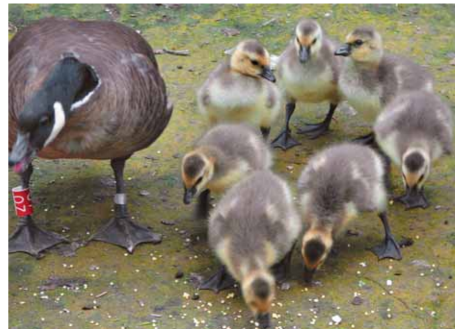
Они растут и постоянно хотят есть

«Сегодня 19 июня 1996 года. Четырём малышам только-только исполнилось пять дней отроду, а они уже третий день не вылезают из воды. Летнее половодье подтопило нашу территорию, вода проступила во всех вольерах. Нам беспокойство, а маленьким казарчатам это, похоже, в большую радость. Они плавают, что-то активно выискивают в сырой земле; к счастливчику, добывшему вдруг земляного червя, тотчас устремляются один или два родственника и устраивают с ним «кучу-малу». Гусята этого выводка по сравнению с малышами из всех других семей на удивление самостоятельны. Уже не первый день пуховички не держатся своих родителей, а каждый занимается сам по себе, чем хо-