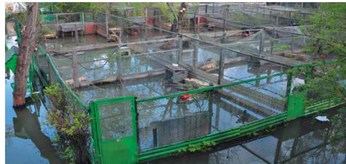
Под водой оказалась и вся «воспроизводственная» территория

Вода между тем продолжала подниматься с удивляющей скоростью: когда мы «обустроили» гнездо в пятом по счёту вольере, в первом кладка уже покрылась водой.