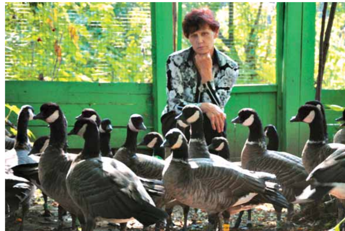
Не полюбить этих птиц невозможно

Ребята начинали свой проект без меня, и их самих для этого поначалу было достаточно. Они вели начальные строительные работы, и женский глаз в первые два и даже три года здесь вряд ли был бы так обя-