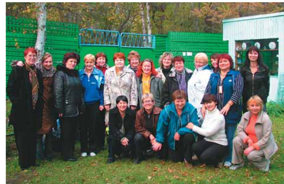
Учителя школ Камчатки

— Нет. У нас не зоопарк, а питомник для разведения редких диких гусей.