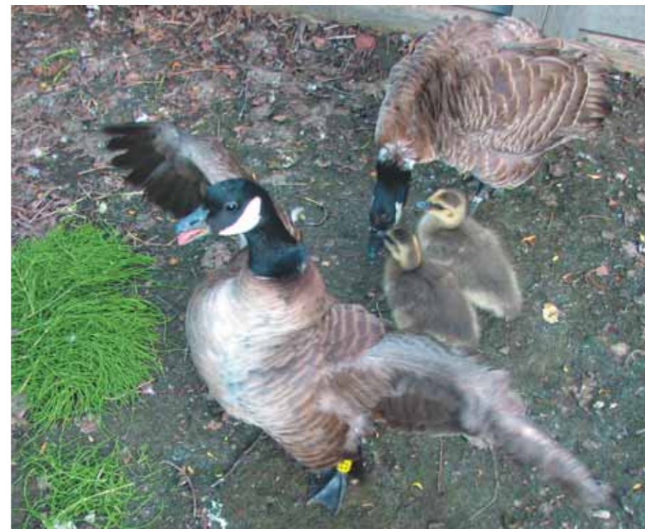
«Не отдам!» — так каждый раз встречает наше появление в вольере самка 82

Все вольеры уже через два-три года после заселения в них птиц полностью лишались любой годной для питания казарок травянистой растительности. Однажды во вновь построенном вольере мы обратили внимание на подрастающий сплошным ковром травостой. Самка насиживала кладку, самец находился рядом. К траве самец не касался, она, для нас это было ясно, для корма была непригодна. Вывелись казарчата, и через несколько дней травяной покров был выеден ими полностью. Оказывается, корм сохранялся для будущих малышей. И это стало ещё одним штрихом к нашему пониманию роли самца в семействе