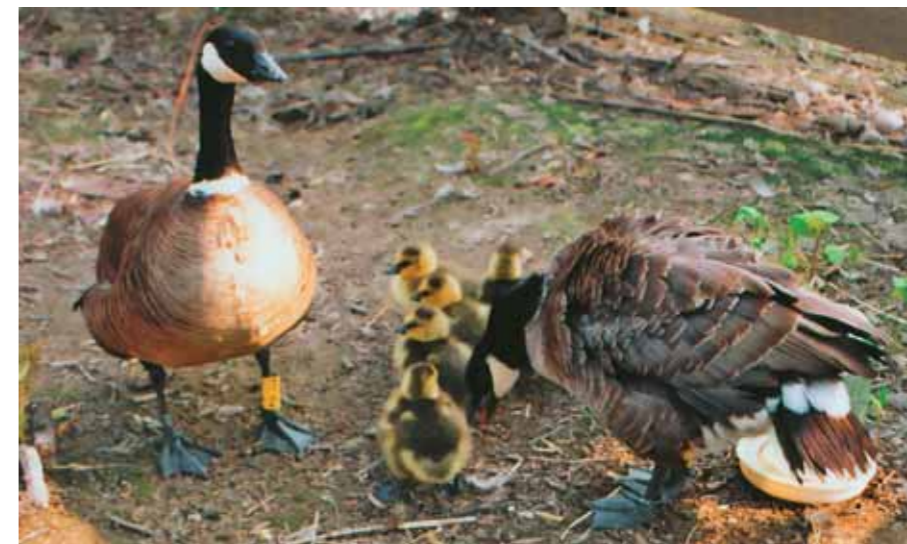
Семья 71—72. Самка (справа) демонстрирует недовольство нашим появлением в вольере, а самец спокоен

В период размножения на активную защиту своей «вотчины» готовы практически все самцы стаи. Часто они с таким остервенением набрасываются на мнимого агрессора, что, едва задав корм, освободив ванну от застоявшейся воды и успев-таки