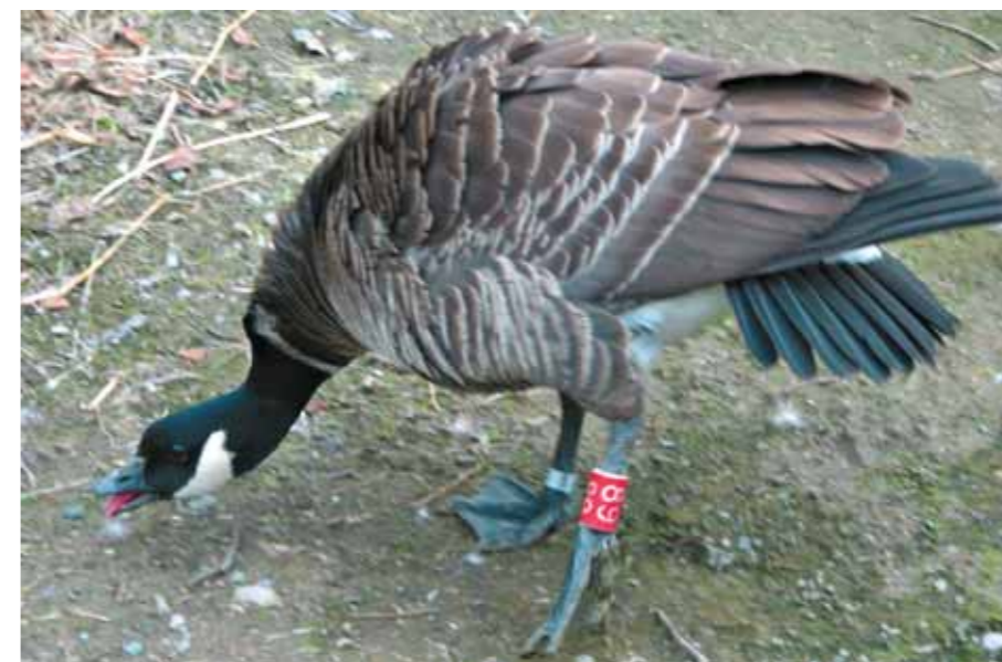
Самец в позе предупреждения о последующем за ним нападении

получить несколько больных щипков и ударов, мы бегом (это ещё больше вдохновляет драчуна) покидаем вольер. В общем-то, это нужно считать «нормой», и тем более удивительными для нас поначалу были случаи резкого изменения поведения некоторых таких боевитых отцов сразу же с