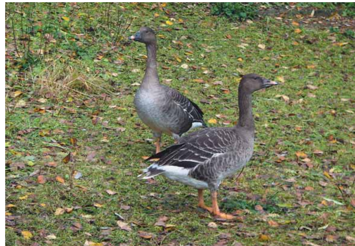
Тундровые гуменники Западной Камчатки