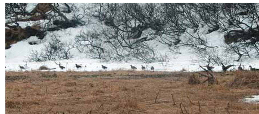
Птицы тогда уходили от нас пешком