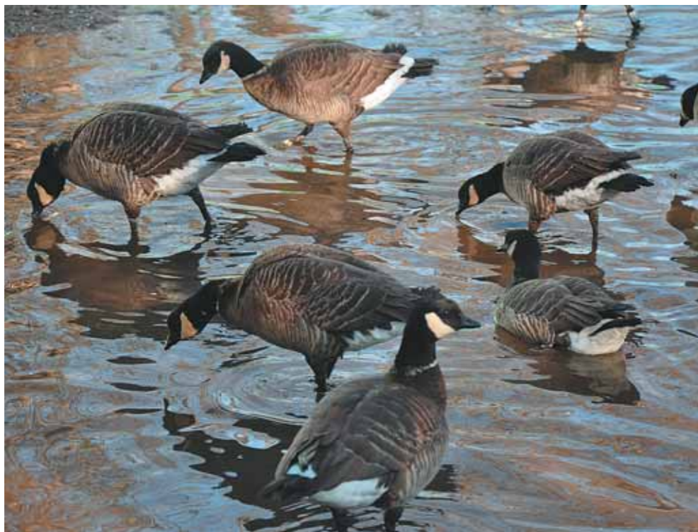
В марте, на радость гусям, в нашей «прихожей» образуются лужи