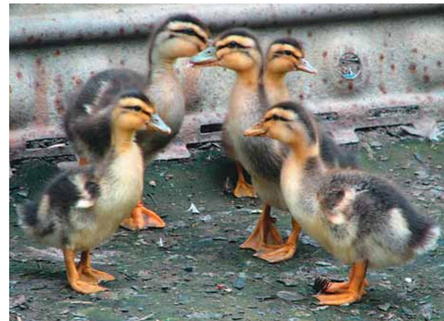
Они в растерянности: куда бежать?

С десяток же её яиц, по одному, мы разложили в гнёзда казарок. Так у нас появились шесть маленьких утят-подкидышей. Наблюдать за ними было, как говорится, «и смех и грех». В первые дни малыши были один в один утятами кряквы, а казарки-самки, похоже, не отличали их от своих родных детей. Но в двух семьях более внимательными оказались самцы, и стоило подкидышу появиться рядом с неродным папашей, тот сразу же пытался достать подозрительного «уродца» своим клювом. Но ещё больше поразила реакция «нелюбимых приёмых»: они моментально поняли, что «им здесь не рады». Один из «нелюбимых» постоянно держался в стороне от казарчат, другой вообще нашёл для себя укрытие за ванной, и до поры его не могли обнаружить в вольере даже мы. Эта самая «пора» для приёмых наступала с появлением в вольере очередной порции корма. Тот и другой пулей подлетали к выложенному корму, с жадностью выхватывали из него кусочки варёного яйца, после чего также стремительно убегали обратно. Не менее расторопными были утята и в других гусиных семьях: их любовь к яйцам и торопливая жадность оставляли