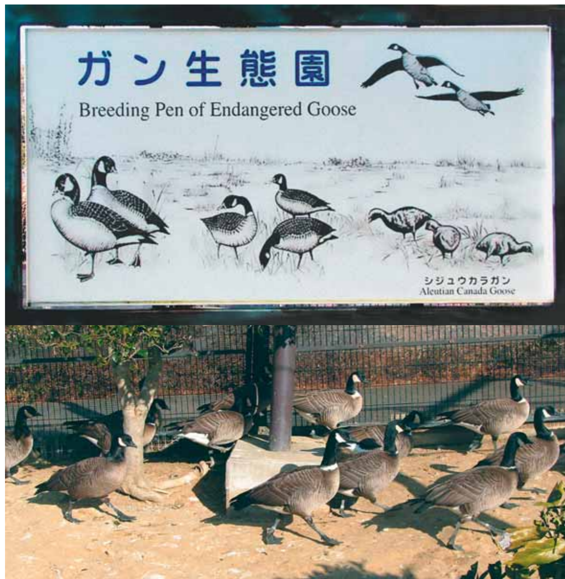
Я стоял около этих птиц, ещё не понимая, какая сила меня удерживает