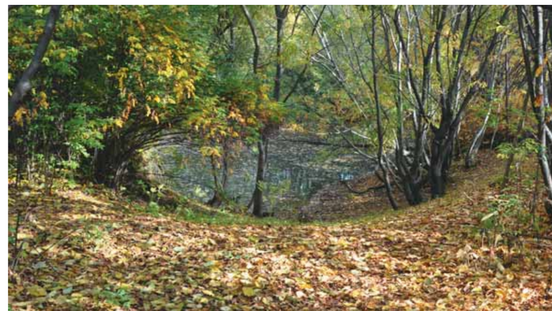
В питомнике вторая декада сентября

Нам жалко расставаться с летним теплом и так хочется считать, что хотя бы первая половина сентября — пора ещё летняя. Но с этим почему-то никак не хочет согласиться максималистка черёмуха. Ещё совсем тепло, а она торопливо избавляется от своих, уже поблекших листьев. Через не-