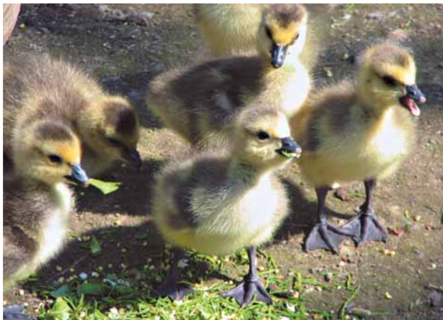
Им мы отдали годы своей жизни

какое-то время добавляется и ежедневный, иногда в течение дня неоднократный «медицинский осмотр» каждого выводка. Но об этом мы ещё скажем отдельно. И, не парадокс ли это, чем больше наши дети доставляют нам забот и печали, тем больше мы их любим. Но несравненно больше они приносят нам радости. Хорошо зная о том, что с первых часов жизни малышей заботы наши возрастают многократно, мы тем не менее каждый год с нетерпением ждем начала появления гусят на свет и хотим видеть их у себя всё в большем и большем числе.