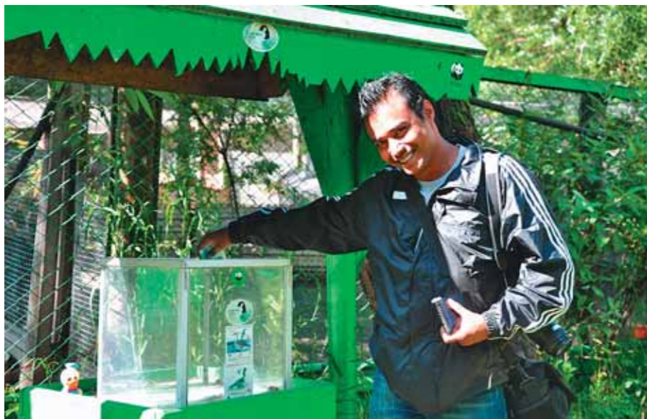
Гость из Индии