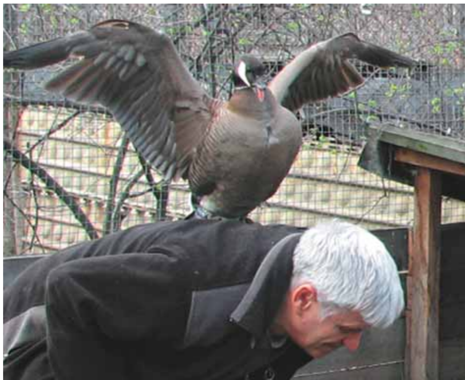
В нападении он старается подобраться ближе к голове

Отдельные особи оставались столь же неуёмными в своей «ненависти» и с появлением гусят. И тогда мы прибегали к радикальной мере — изымали их из семьи. В свой вольер он возвращался через пять-семь дней и, как правило, становился уже более «покладистым».