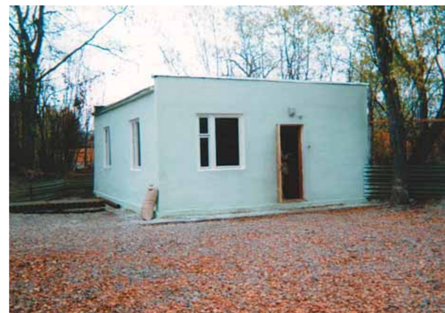
Казарок ожидало зимовочное помещение (конец сентября 1992 года)

А вот нам, неприкаянным, жить оказалось негде. Изобразив из клеток, в которых к нам привезли птиц, подобие ложа,