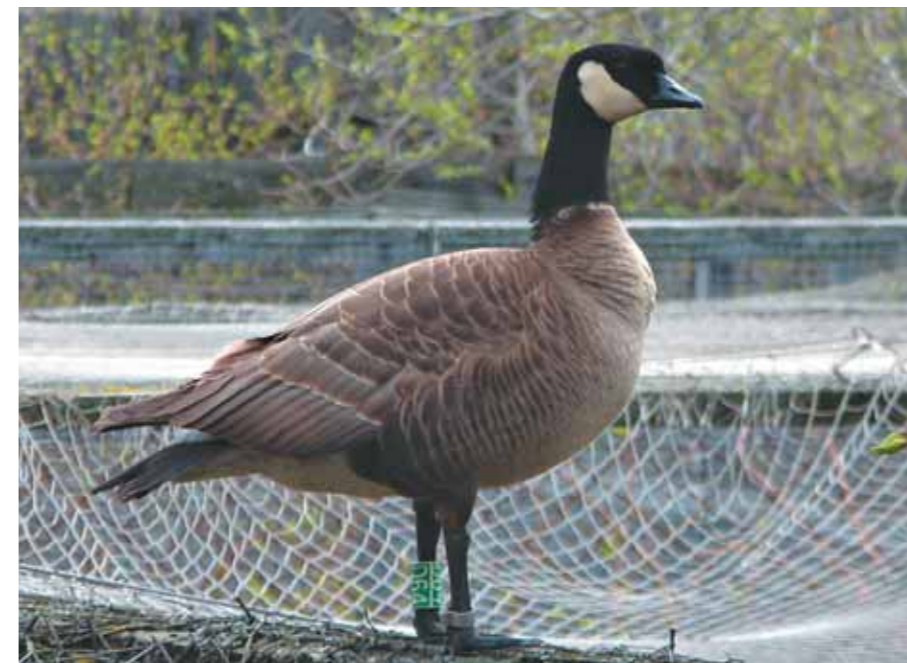
«Залётная» казарка несколько дней ходила по верхам вольеров

Гусь между тем облюбовал для себя верха вольеров, сквозь сетку рассматривал находящиеся внизу птиц. Потом перелетал на озёрную часть питомника, где к нему тотчас устремлялся один из наших «холостяков». Этот «один» права на прилётную гостью (очевидно, это была именно дама) заявил уже с первого своего с ней знакомства. В её отсутствие наши самцы держались вместе, но стоило рядом по-