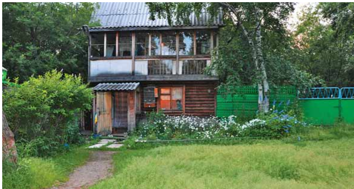
Наш дом годы спустя

несколько ночей я провёл вместе с гусями в зимнике. Оказалось, что для такого соседства нужно иметь действительно крепкое сердце. Минимум четыре-пять раз за ночь тишина вдруг взрывалась дружным, спросонья кажущимся диким рёвом криком всех девятнадцати горластых «птичек».