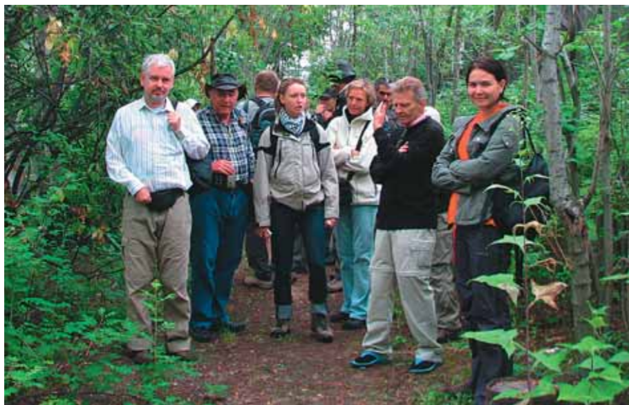
На озёрной части нашей территории любители птиц из Дании

Уже потом о питомнике узнали учителя городских школ, воспитатели детсадов и интернатов.