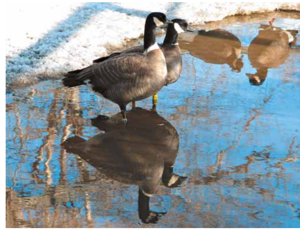
От стаи одна за другой отделяются пары

В третьей декаде марта гуси расходятся по территории питомника всё шире. К концу месяца некоторые пары уже пытаются