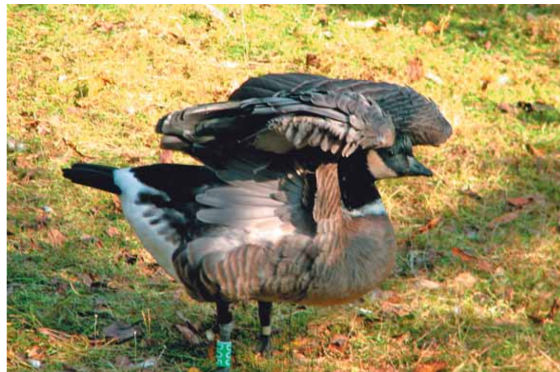
Как бы ей хотелось подняться в небо

Утренние температуры на дворе потихоньку подползают к минусам. А всего