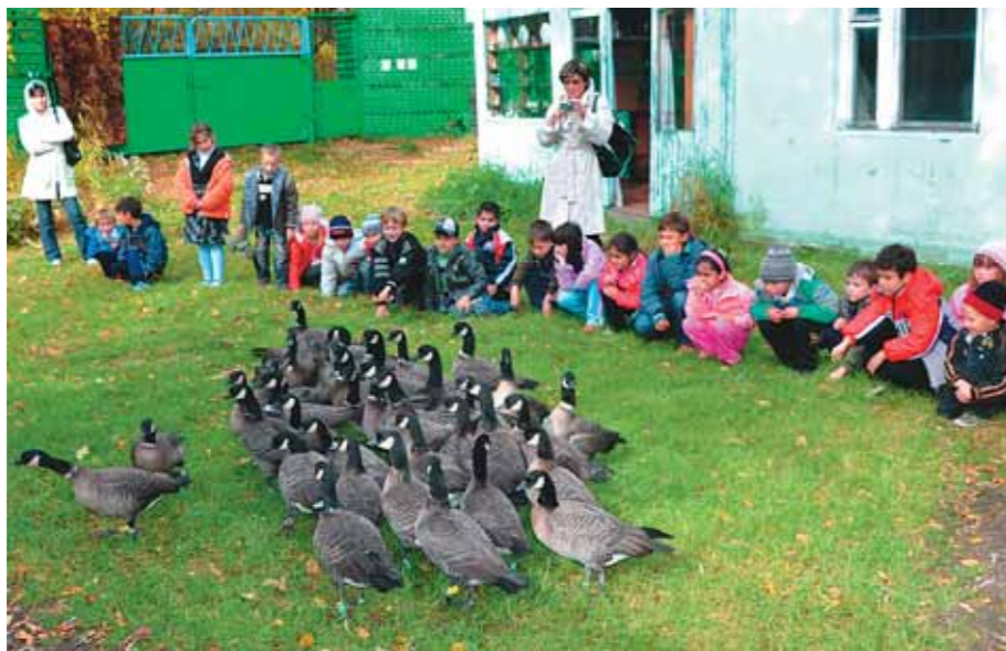
Дети — наши постоянные гости

лись через спутниковую связь. А совсем недавно видеозапись интервью с нами велась на совсем уж экзотическом валлийском языке.