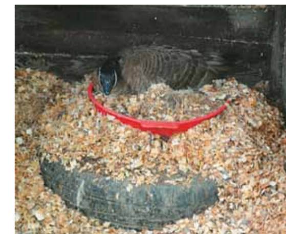
Гнёзда с кладками помещались в тази

Из большинства яиц уже слышались голоса гусят. И казарки, наверное, не меньше, чем мы, не хотели их гибели. Все птицы, едва мы выходили из вольера, тотчас занимали до неузнаваемости трансформированные гнёзда. А потом, по прошествии дней, некоторые птицы ещё долго не теряли надежды согреть уже погибшие кладки.