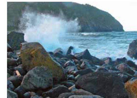
Характерный участок северного «пляжа»

Однако южная, самая непривлекательная для нас его часть была открытой. Вертолёт завис, мы попрыгали в высокую, казавшуюся сухой травянистую растительность, а пилоты ещё несколько минут пытались подыскать в ней подходящую для посадки Ми-8 площадку.