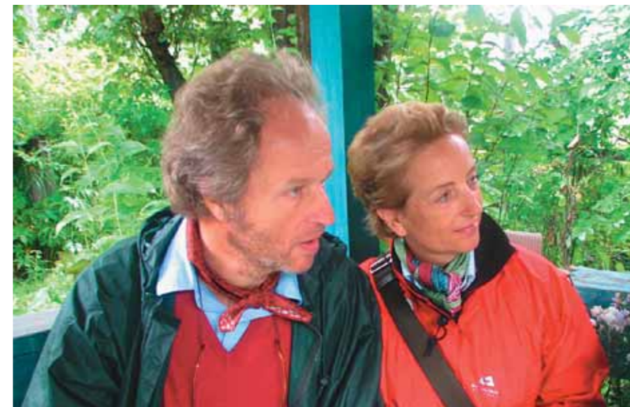
Посещали питомник и особы княжеских кровей

Вот так! А ещё недавно свой сарказм я готов был распространить чуть ли не на всех высоких столичных гостей.