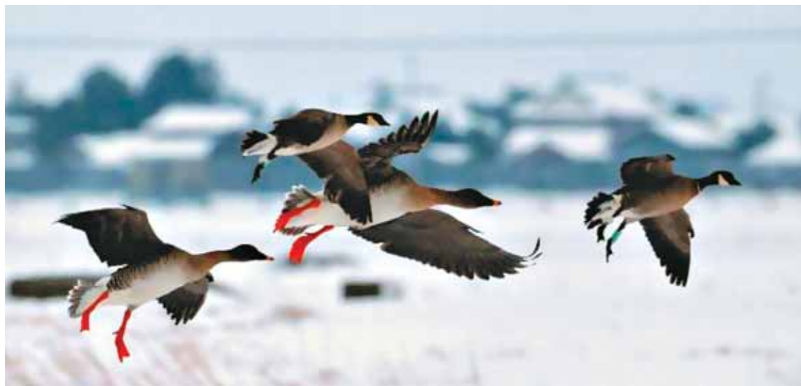
Наши «возвращенцы» и в Японии держались вместе

ленного нам его автором Teruo Tazawa. Вот они — D 68 и D 64 летят вместе с двумя гуменниками Миддендорфа над заснеженными полями острова Хоккайдо.