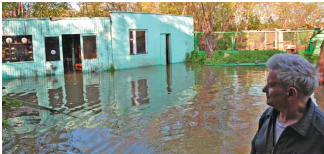
Такой «прихожую» питомника увидел объектив Е. Сыроечковского 4 июня 2009 г.

казарчёнка грелись, тесно прижимаясь к бокам вчера ещё такого недружелюбного «старшего брата», пятый лежал на его спине. Так у маленьких «подкидышей» появился, как потом выяснилось, очень ревностный «приемный родитель».