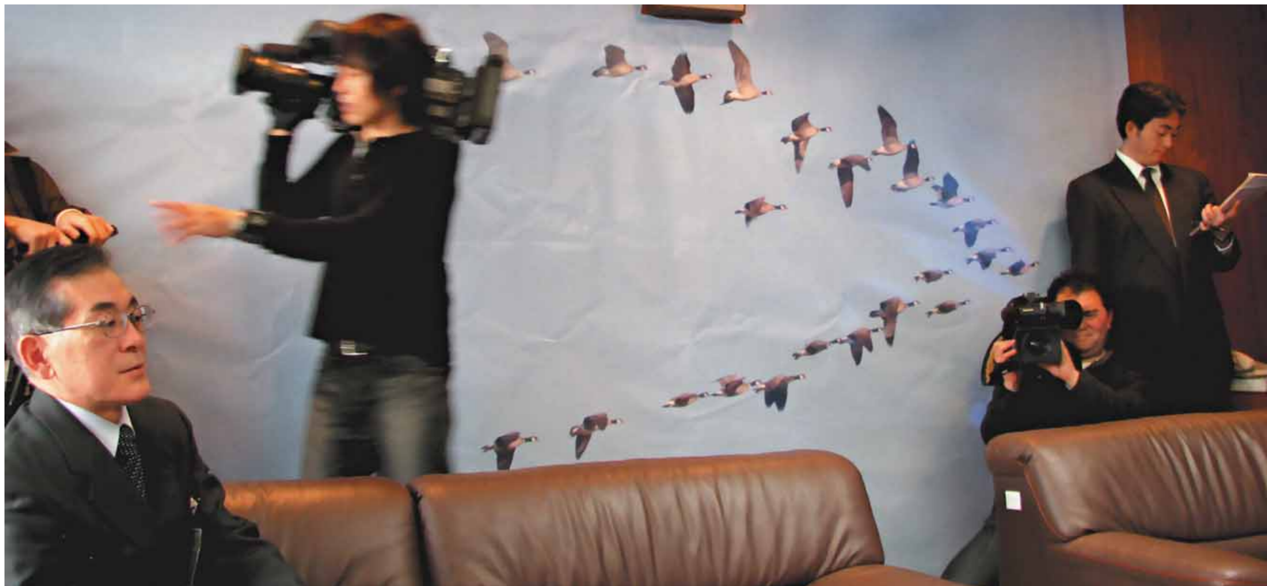
Приёмная мэрии, город Сендай, Япония, февраль 2008 года

на Курилы очередная партия птиц. И можно было с надеждой и нетерпением ждать хороших вестей от японских коллег.