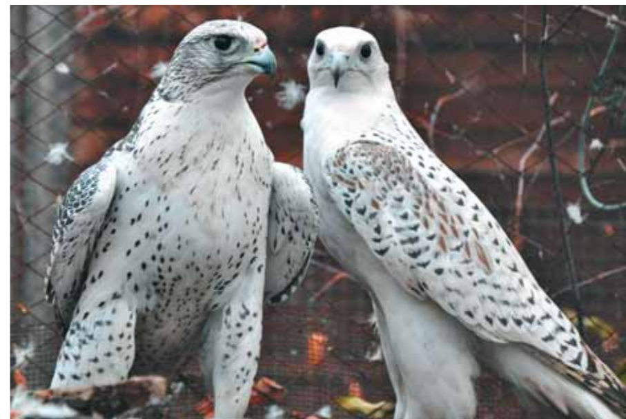
Наши «невольные невольники» — кречеты

Здесь, очевидно, нам пора рассказать о том, что, кроме гусей, в нашем питомнике