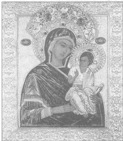
Чирская (Псковская) икона Божией Матери