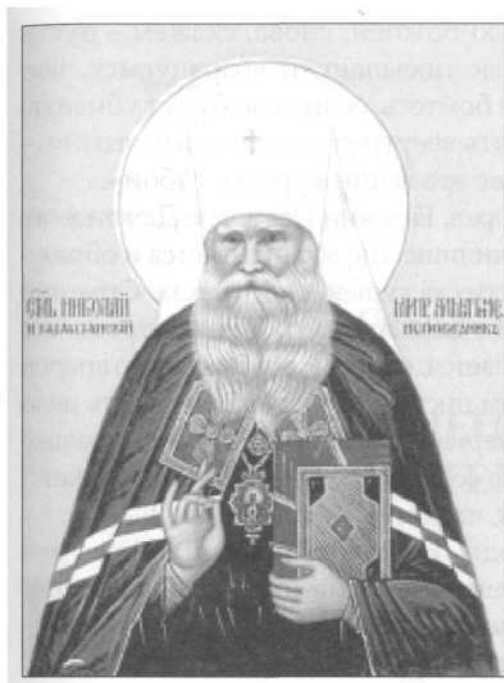
Митрополит Николай (Могилевский)

митрополита Алма-Атинского и Казахстанского, – исповедников.