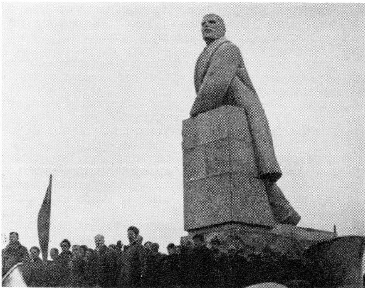
Торжественное открытие памятника В. И. Ленину в Петрозаводске. 7 ноября 1933 г.

Построен памятник волей нашего народа, самим народом. На строительство его, по давней народной традиции, во всех уголках Карелии собирали деньги. Собирали их, кстати, и школьники. Ходили они обычно по трое. Один носил металлическую кружку-копилку, другой — небольшие фотографии проекта памятника. Тому, кто дарил деньги, третий прикалывал на грудь фотографию, как своеобразный значок. Школьники не просили — люди сами останавливали их и давали деньги, кто сколько мог: кто пятак, кто рубль. В те дни по городу гордо ходили сотни людей, и на груди у них белела фотография памятника Ильичу. Все хотели