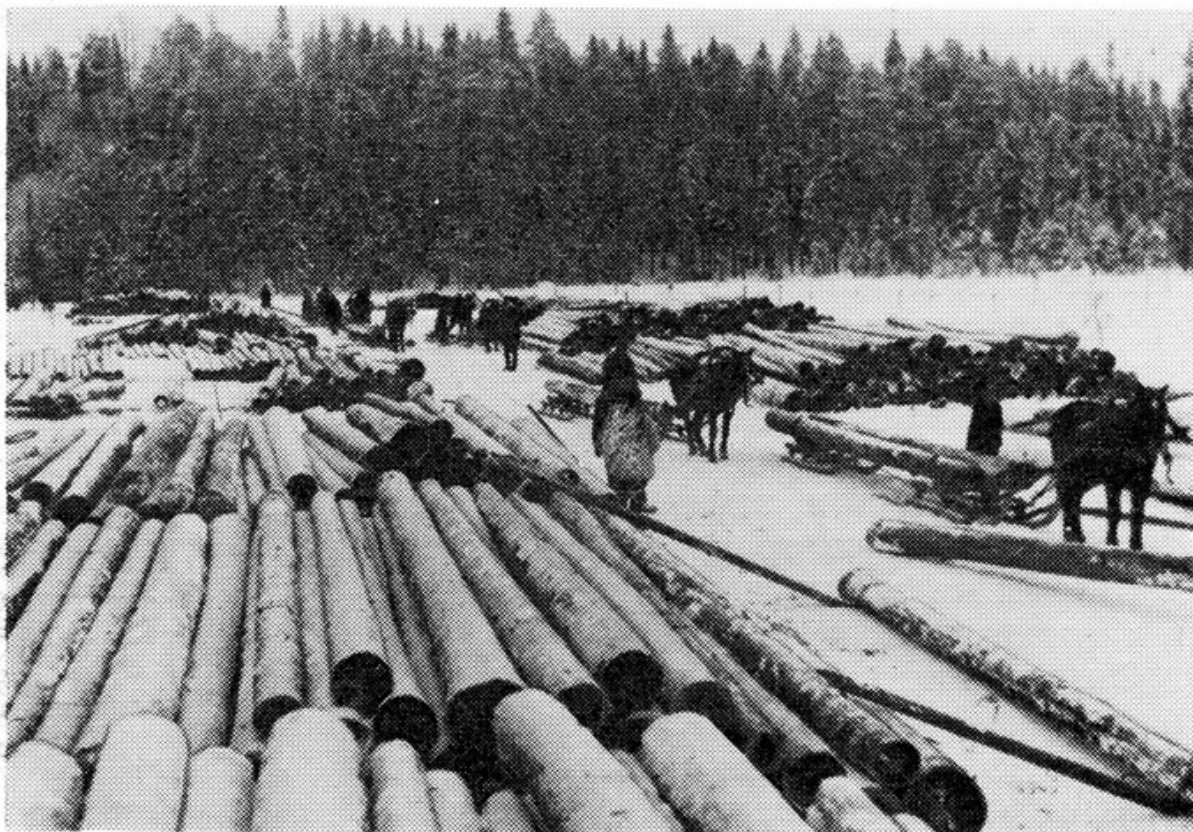
На бирже Матросского лесопункта

Делянка была рассчитана так, чтобы расстояние вывозки до штабеля не превышало двухсот метров.