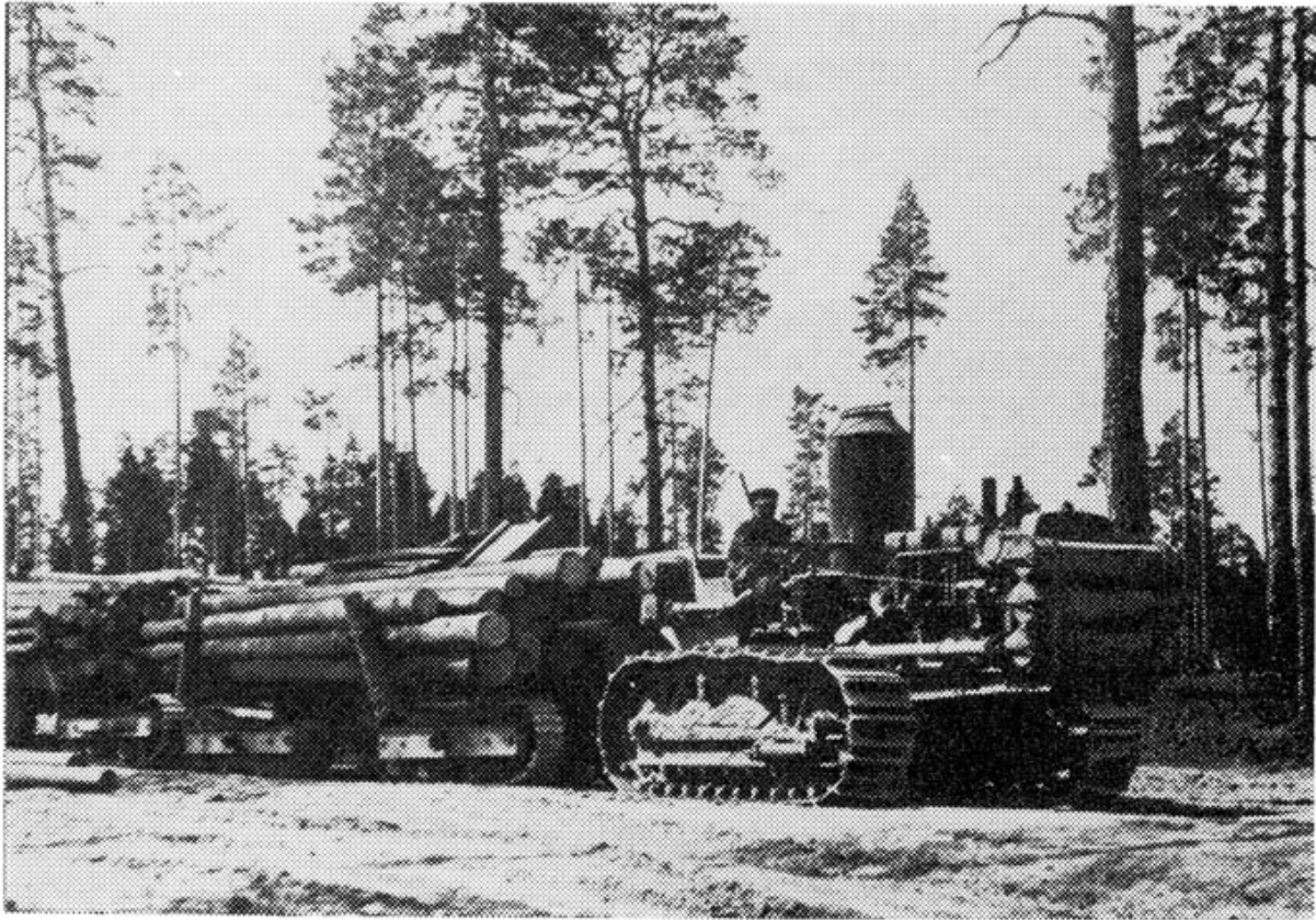
Вывозка леса трактором с газогенератором