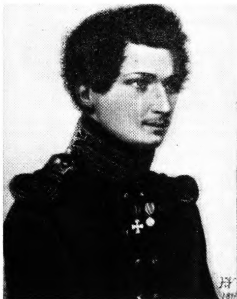
Иван Дмитриевич Якушкин. Портрет Н. Уткина. 1816 г.

тельной красоты, — писал впоследствии декабрист Н. В. Басаргин. — Нам было тяжело, грустно смотреть на это юное, прекрасное создание, так рано испытывающее бедствия этого мира». 2