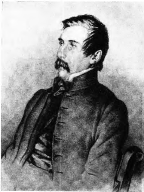
Иван Иванович Пушин. Рис. К. Мазера. 1850 г.

лись в разных местах страны, оторванные друг от друга, Якушкин взял на себя роль некоего центра, куда стекались сведения обо всех членах декабристской артели. Г. С. Батеньков в письме к Пушину от мая 1857 г. особо отмечает это обстоятельство. «Один только фотограф,* — пишет он, — умеет иногда группировать их» 22 (т. е. сведения о бывших соратниках). Напомним, что в годы сибирской ссылки такую роль — некоего общего центра — играл Иван Иванович Пушин, который даже имел прозвище Маремьяны-старичи за его постоянные заботы обо всех товарищах и их семьях. Евгений Иванович как бы принял от него эстафету добрых дел. Якушкин также навещал некоторых декабристов, поселившихся в разных губерниях. Он гостил у Пушина в имении его жены, у Муравьева-