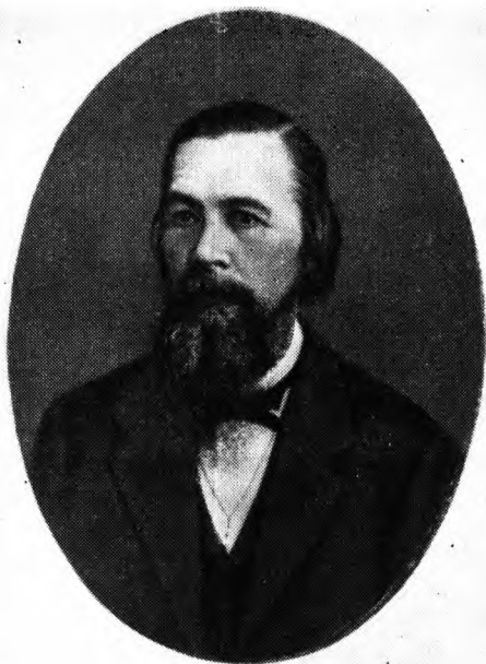
Петр Александрович Ефремов. Фотография. Начало 1870-х гг.

стояния. Как только в губернии были образованы статистический комитет и Ученая архивная комиссия, Якушкин фактически становится во главе этих учреждений.