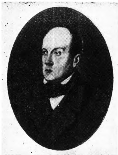
Петр Яковлевич Чаадаев. Портрет Ковима (?). Середина 1840-х гг.

легче дошли до молодого поколения, преемственно выразившись в нарождавшемся новом движении. Это были те библейские праведники, которыми спасался город ... В числе этих немногих представителей преданий разбитого, но не побежденного освободительного движения видное и независимое место занимал П. Я. Чаадаев». Он «выступал со словом обличения против пошлости, против отступничества, он проповедовал, он обличал, он рассказывал более молодым людям в поучение о времени своей молодости, о политическом движении при Александре I, о тайных обществах, о декабристах, об их деле». 3 Нет сомнения в том, что рассказ Вячеслава Евгеньевича основан на воспоминаниях отца, который и был одним из этих молодых людей, более чем внимательных слушателей «басманного отшельника». Огромный интерес к людям 14 декабря, уже заложенный семейными преданиями, еще