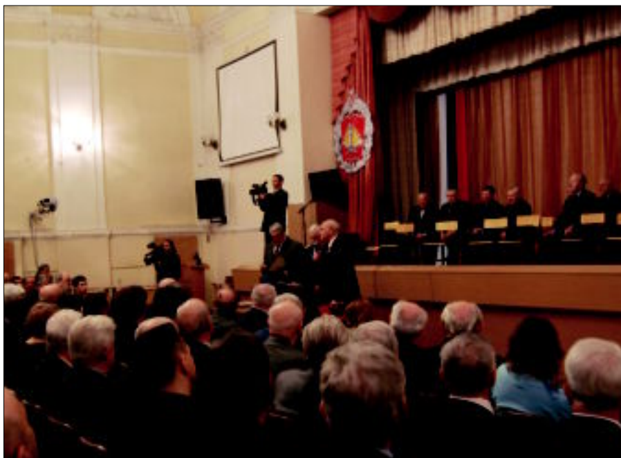
Чествование ветеранов по случаю 40-летия КУОС