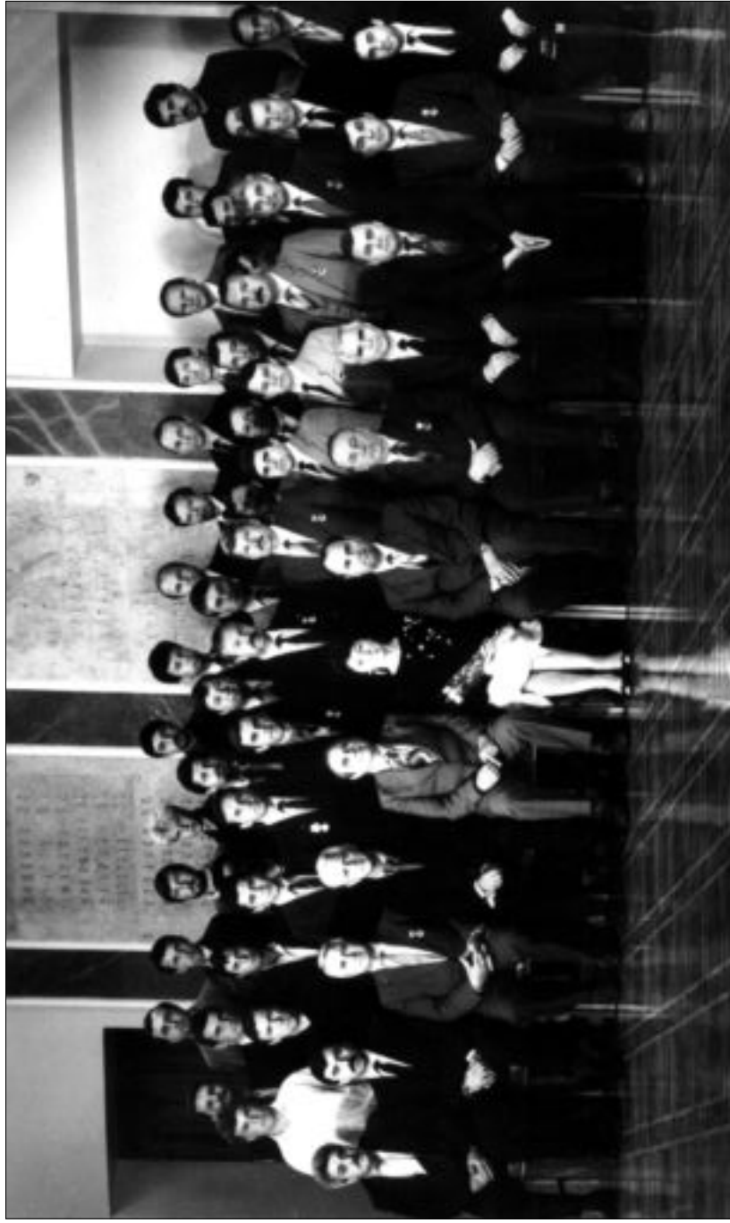
Награждение сотрудников спецназа КГБ УССР, участников боев в Афганистане. На переднем плане: председатель КГБ УССР генерал-полковник Н.М.Голушко и его заместители — В.Пыхтин, Л.Быхов, Г.Ковтун. 1987 г.