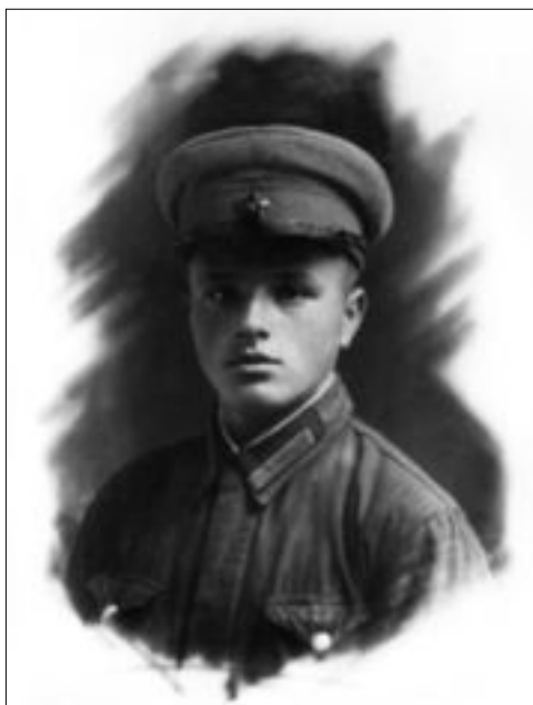
На лагерных сборах, г. Черкассы, октябрь 1940 г.