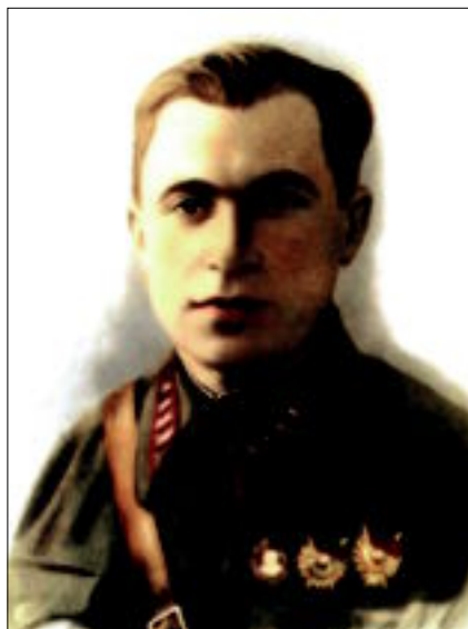
И.Старинов после возвращения из Испании