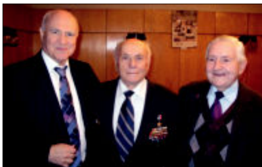
Авторы книги В.Суродин и А.Цветков с Героем России А.Ботяном на встрече в Академии ФСБ