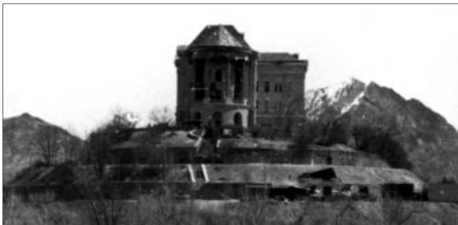
Дворец Амина «Тадж-бек»