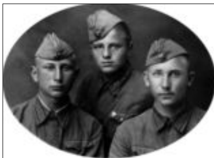
Перед окончанием училища и отправкой на фронт. 1941 г.