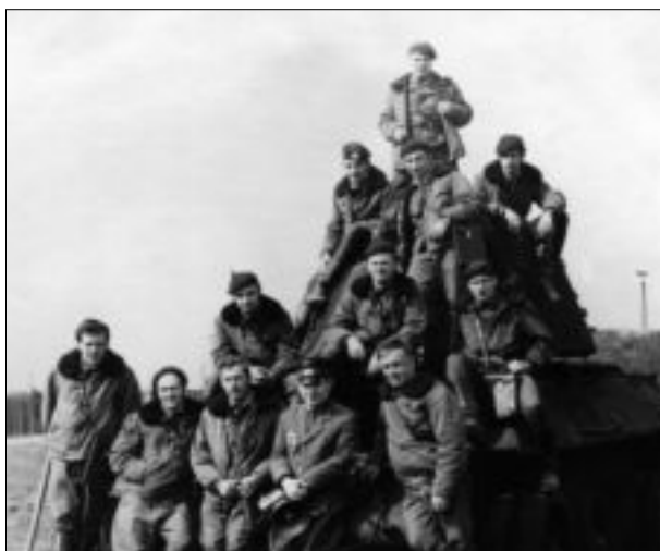
Группа на занятиях по минно-подрывной подготовке на полигоне