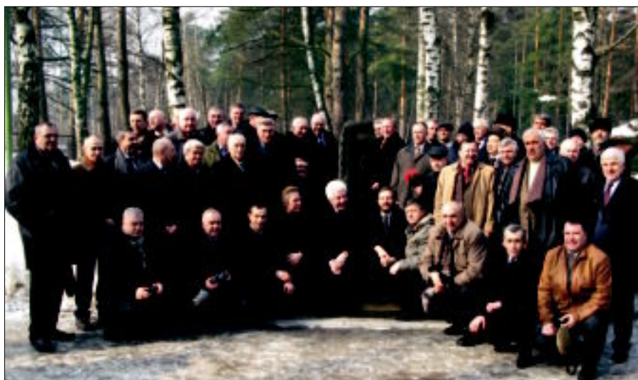
Традиционная декабрьская встреча ветеранов спецназа