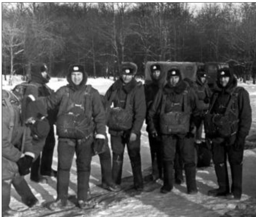
Группа слушателей в учебном центре ВДВ готова к посадке в самолет