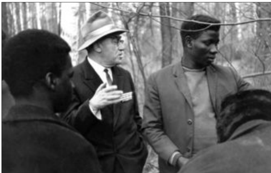
И.Г.Старинов передает свой опыт ангольским партнерам