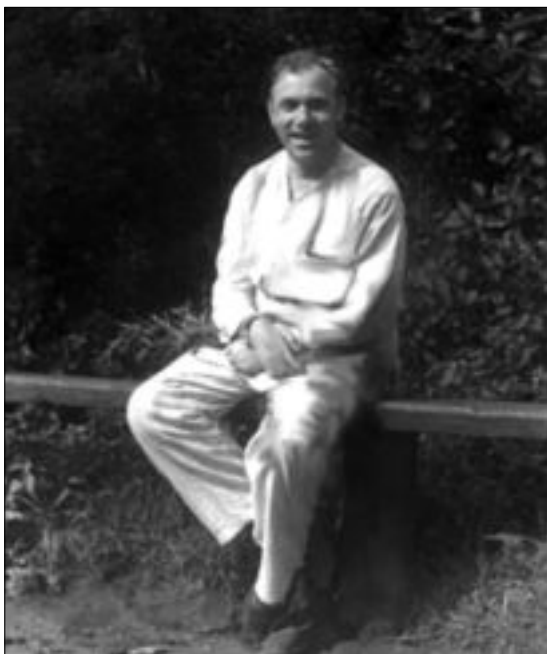
И.Старинов в госпитале после ранения на Финском фронте. Лето 1940 г.