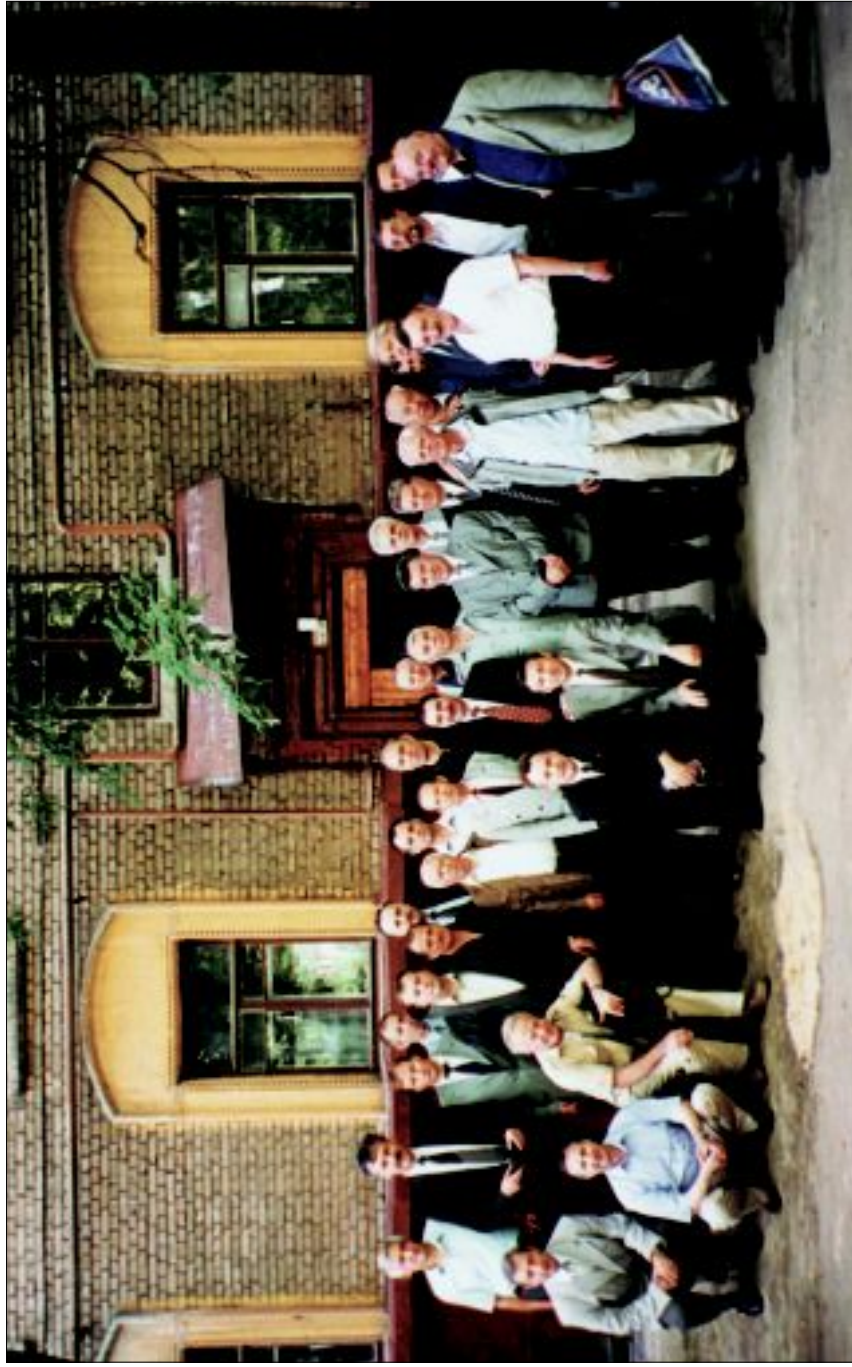
Ветераны КУОС перед встречей с И.Г.Стариновым в день его 100-летнего юбилея. 2 августа 2000 года