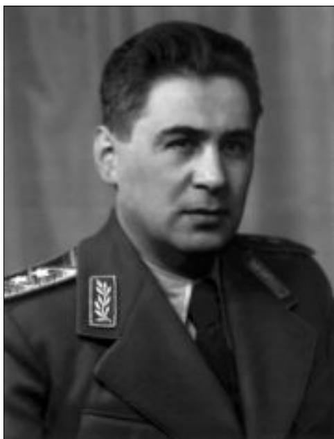
Легендарный генерал-лейтенант Павел Анатольевич Судоплатов