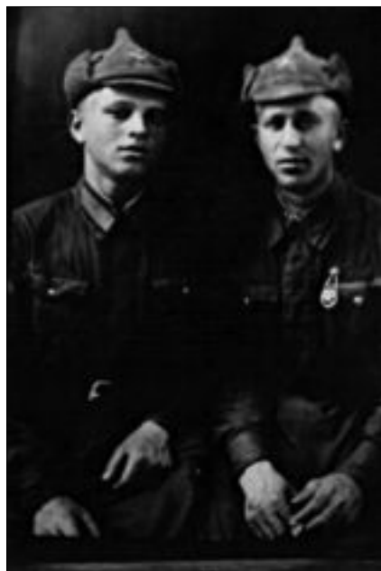
С одноклассником по училищу. Лето 1940 г.