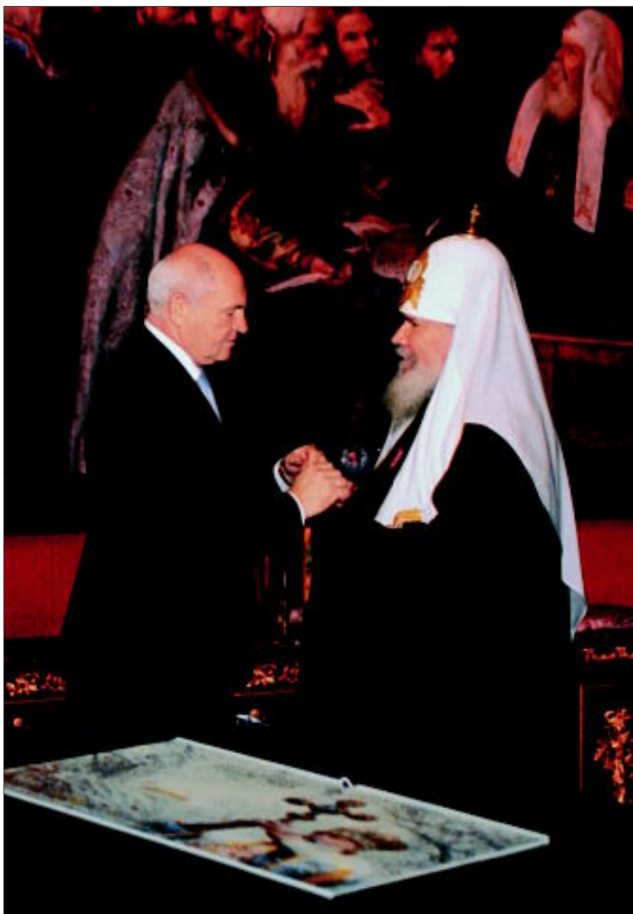
Награждение Святейшего Патриарха Московского и всея Руси Алексия II медалью Г.И.Бояринова