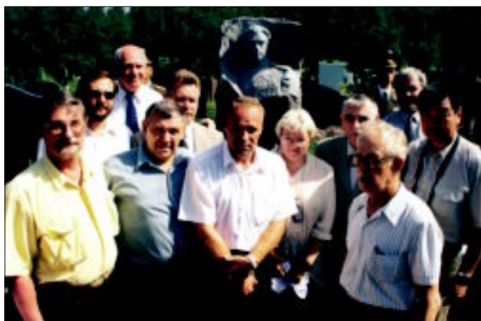
На открытии памятника И.Г.Старинову