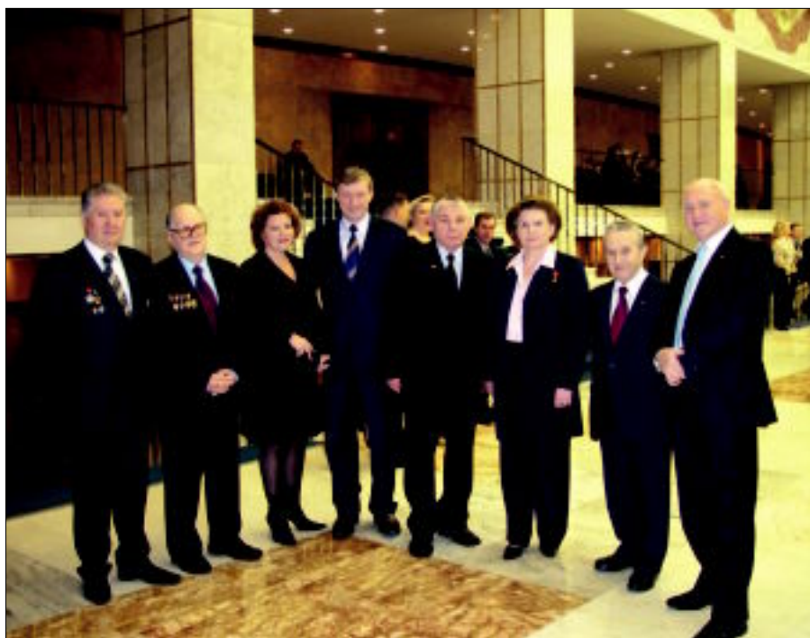
В Кремлевской дворце съездов. 20 декабря 2004 г.