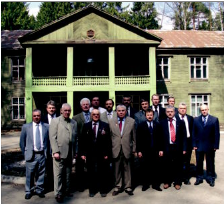
Ветераны спецназа перед зданием 1-го учебного корпуса