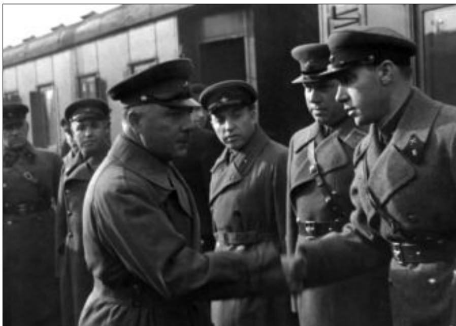
К.Е.Ворошилов и И.Г.Старинов с командирами подразделений на учении