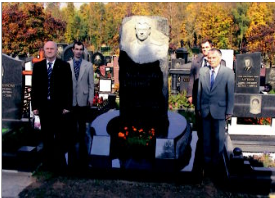
Почетный караул на открытии памятника И.Г.Старинову