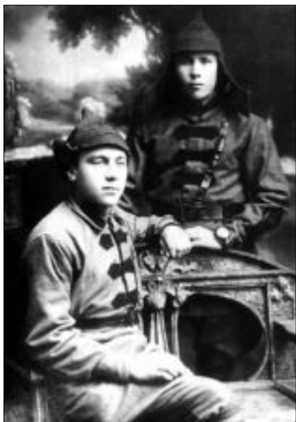
И.Старинов в Гражданскую войну