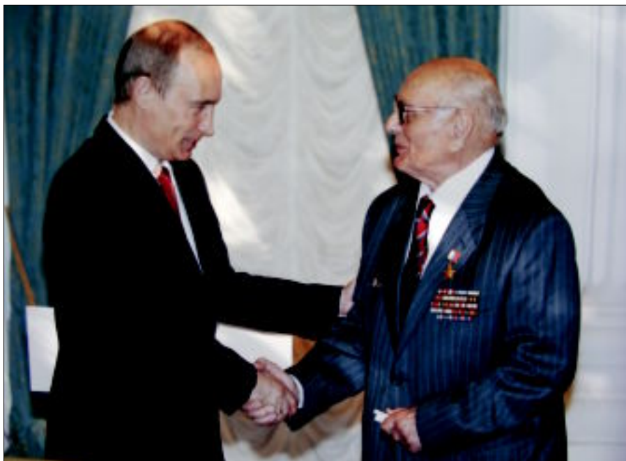
Президент России В.В.Путин поздравляет А.Н.Ботяна с присвоением звания Героя России. Май 2007 г.