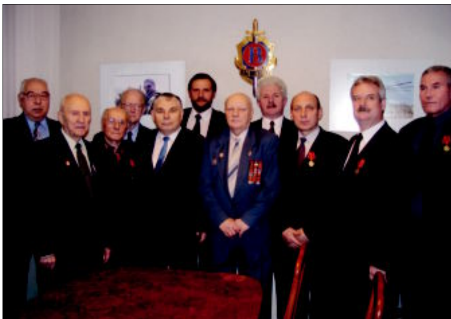
Встреча ветеранов в «Грант Вымпеле»