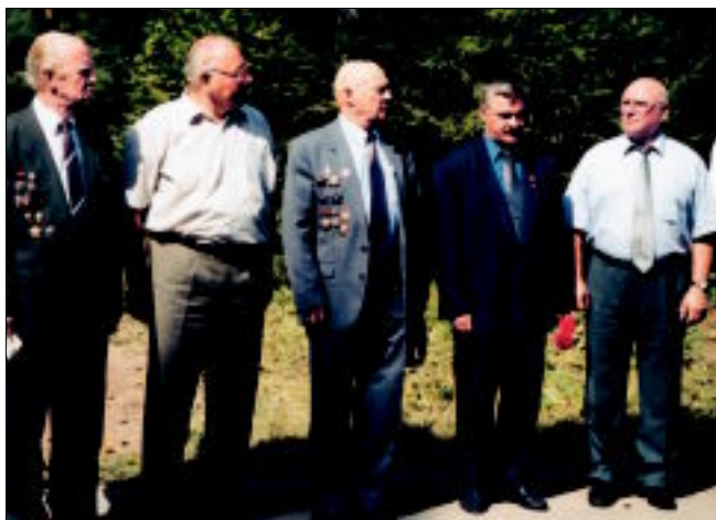
Старейшины спецгруппы «Вымпел» на 20-летию группы. 18 августа 2001 г.