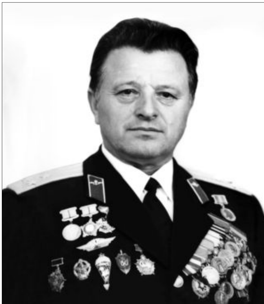
Герой Советского Союза полковник Григорий Иванович Бояринов