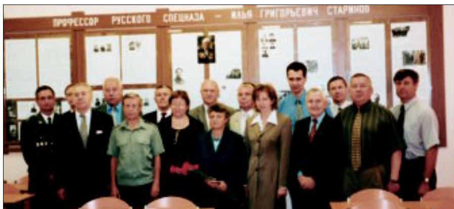
На открытии музея-класса в Академии ФСБ РФ в 101-ю годовщину со дня рождения И.Г.Старинова