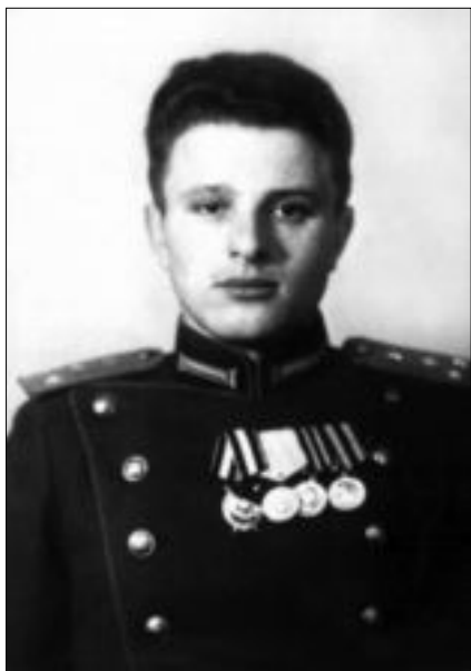
Слушатель 2-го курса института МГБ