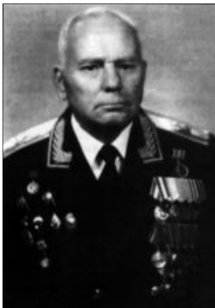
Генерал-майор Александр Иванович Лазаренко