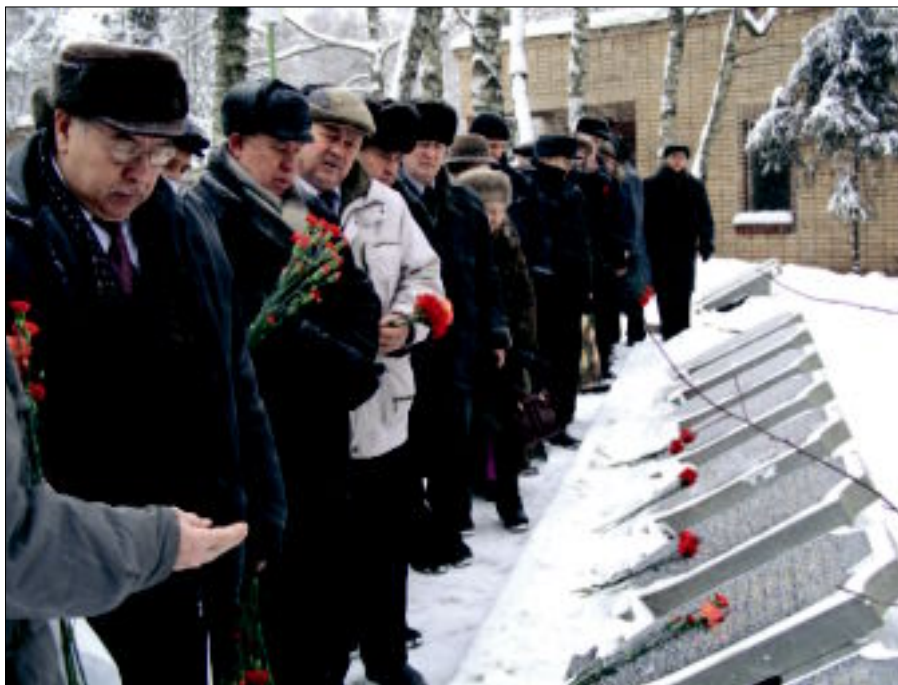
Вечная память ушедшим