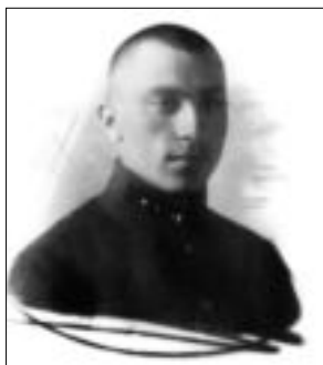
И.Старинов. Киев, 1920 г.