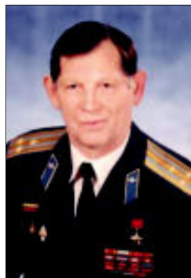
Герой Советского Союза полковник В.С.Белюженко