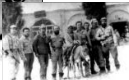
Боевые будни каскадеров