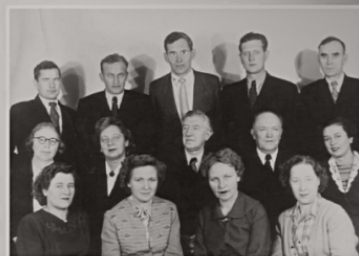
Коллектив кафедры ОХТ 1957 г.