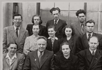
Кафедра технологии минеральных кислот и солей 1952 г.