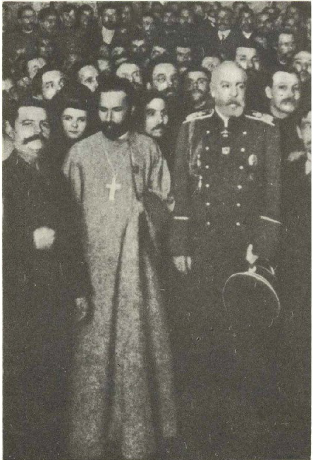
Гапон с петербургским градоначальником Фулоном