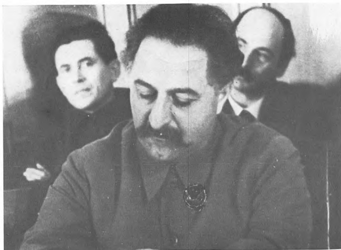
Н.И. Ежов, Г.К. Орджоникидзе, Я.А. Яковлев. 5 января 1936.