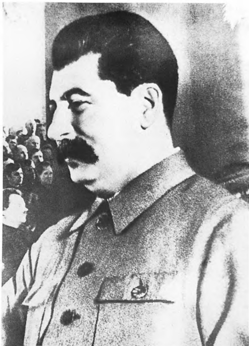
Генсек на XVII съезде. Январь 1934.