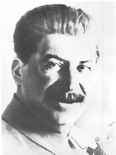
Мужчина с шармом. 1934.