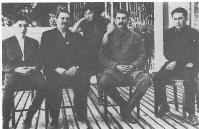
Василий Сталин, А.А. Жданов, Светлана Аллилуева, И.В. Сталин.