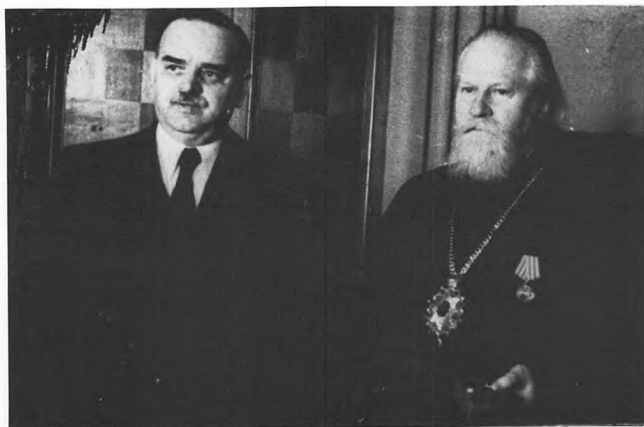
Н.М. Шверник и митрополит Николай Крутицкий, награжденный медалью "За доблестный труд в Великой отечественной войне 1941-1945 годов". 11 июля 1946.