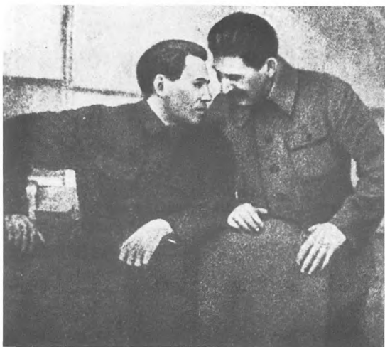
Н.И. Ежов и И.В. Сталин в день двадцатилетнего юбилея ВЧК-ОГПУ-НКВД. 20 декабря 1937.