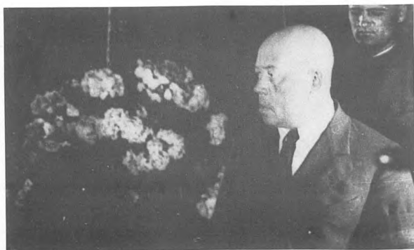
Александр Поскребышев, многолетний помощник Сталина.