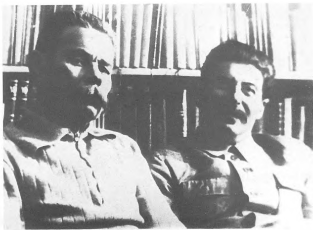
И.В. Сталин в гостях у Максима Горького. 11 октября 1931.