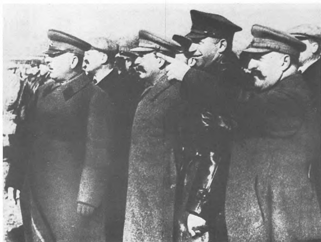
К.Е. Ворошилов, В.М. Молотов, И.В. Сталин, Алкснис, Г.К. Орджоникидзе на Тушинском аэродроме. 1935.