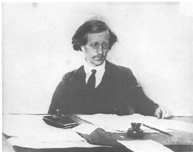
В.А. Антонов-Овсенко, член Петроградского ВРК. 1917.