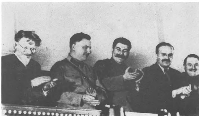
М.И. Калинин, К.Е. Ворошилов, И.В. Сталин, В.М. Молотов, А.А. Жданов в президиуме I Всесоюзного совещания рабочих-стахановцев. Ноябрь 1935.