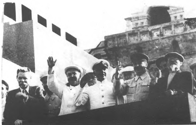
На физкультурном параде. 24 июля 1934.