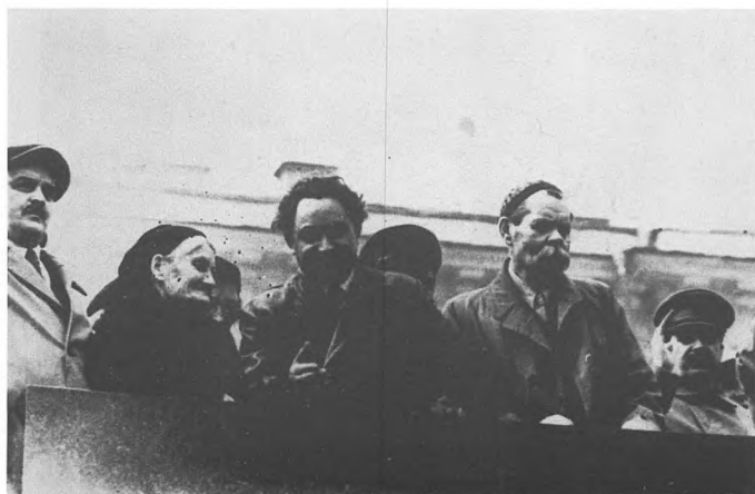
Георгий Димитров с матерью, Максим Горький, Иосиф Сталин на трибуне мавзолея. 1934.