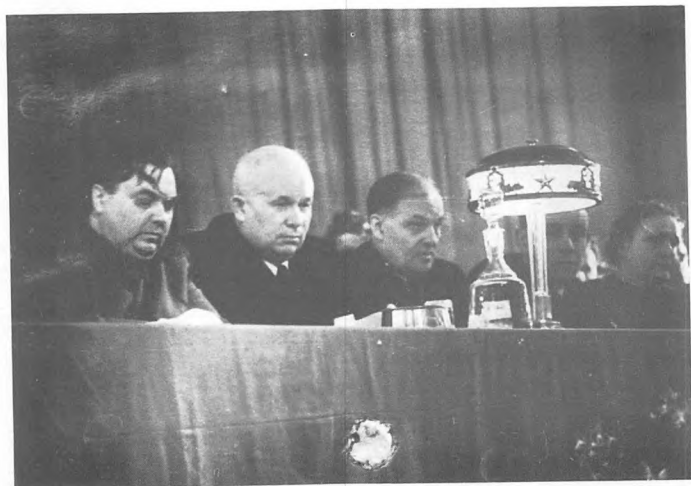
Г.М. Маленков, Н.С. Хрущев, М.Ф. Шкирятов. 5 марта 1950.