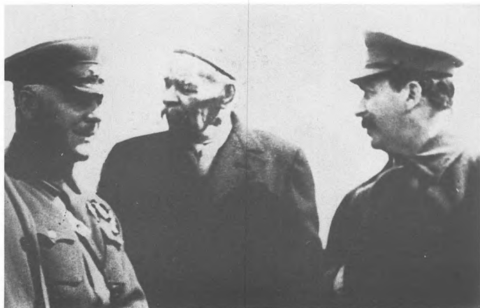
К.Е. Ворошилов, М. Горький, И.В. Сталин на аэродроме. 2 мая 1932.