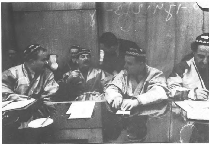
А.И. Микоян, В.М. Молотов, М.И. Калинин, И.В. Сталин, К.Е. Ворошилов, Г.К. Орджоникидзе на приеме делегаций Таджикистана и Туркменистана. 1935.