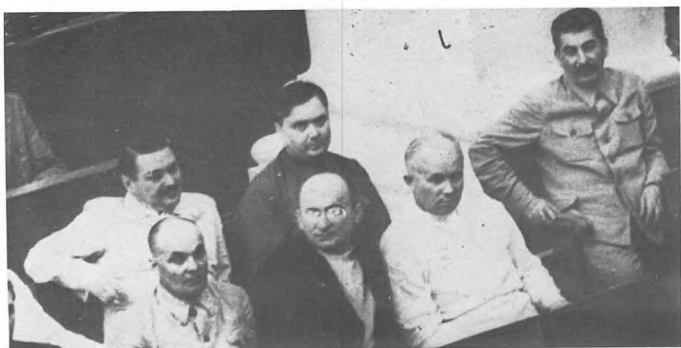
М.Ф. Шкирятов, Л.П. Берия, Н.С. Хрушев, И.В. Сталин, А.А. Жданов, Г.М. Маленков. 1938.