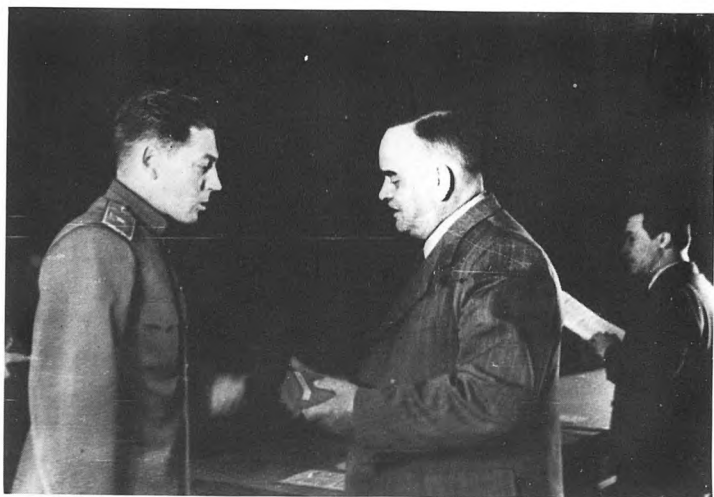
Н.М. Шверник вручает орден Красной Звезды гвардии генерал-майору авиации Василию Сталину. 10 августа 1948.