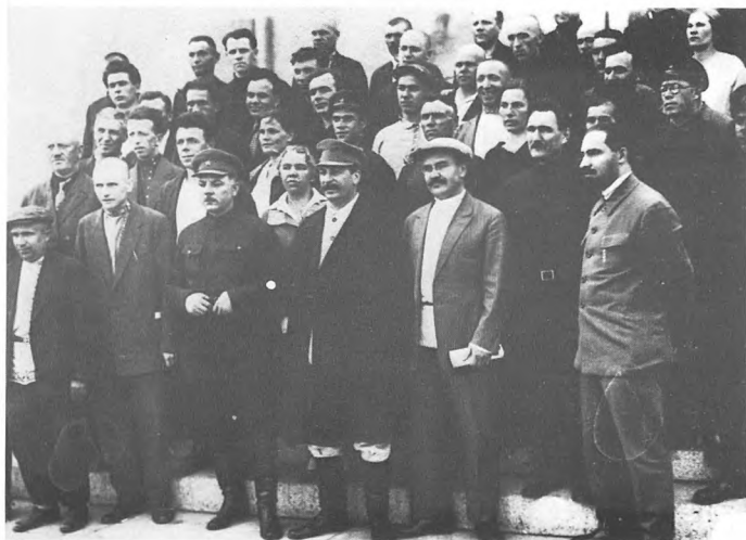
К.Е. Ворошилов, И.В. Сталин, В.М. Молотов, Л.М. Каганович с делегатами XVI съезда ВКП(б). 1930.