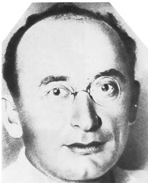
Л.П. Берия, секретарь Закавказского крайкома партии. 1935.