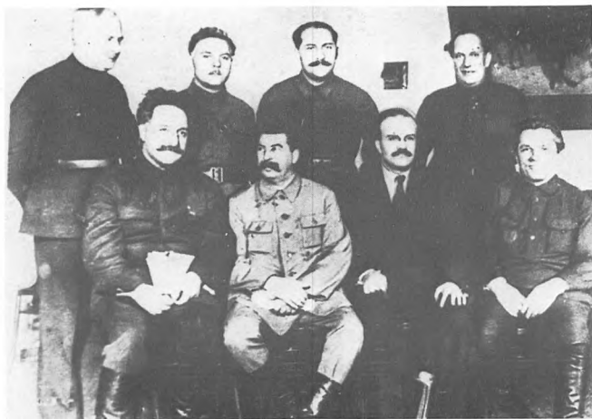
Г.К. Орджоникидзе, И.В. Сталин, В.М. Молотов, С.М. Киров, А.С. Енукидзе, К.Е. Ворошилов, Л.М. Каганович, В.В. Куйбышев в кулуарах XVII съезда. 1934.