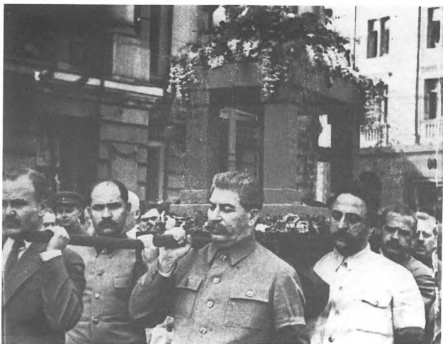
В.М. Молотов, Л.М. Каганович, И.В. Сталин, Г.К. Орджоникидзе, А.А. Андреев выносят урну с прахом Максима Горького из Колонного зала Дома Союзов. 20 июня 1936.