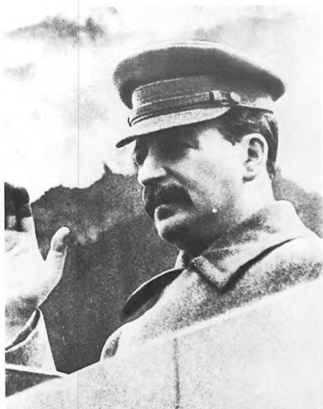
Вождь на все века. 1934.