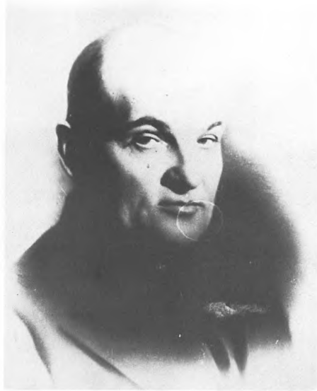
М.Ф. Шкирятов. 1938.