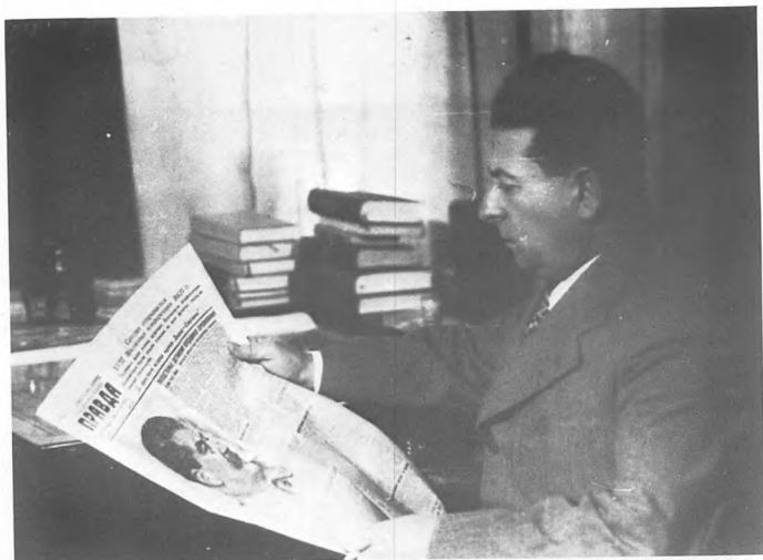
Л.З. Мехлис разглядывает портрет Сталина в газете "Правда". В 1935 году, будучи редактором этой газеты, Мехлис начал кампанию обожествления генсека. 1940.