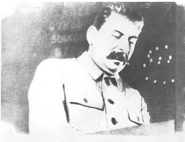
Сталин на торжественном собрании по случаю пуска первой очереди Московского метрополитена. Май 1935.