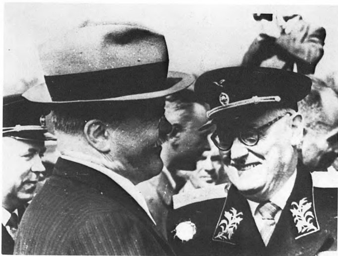
В.М. Молотов и А.Я. Вышинский на аэродроме встречают делегацию правительства Чехословакии. 9 июля 1947.