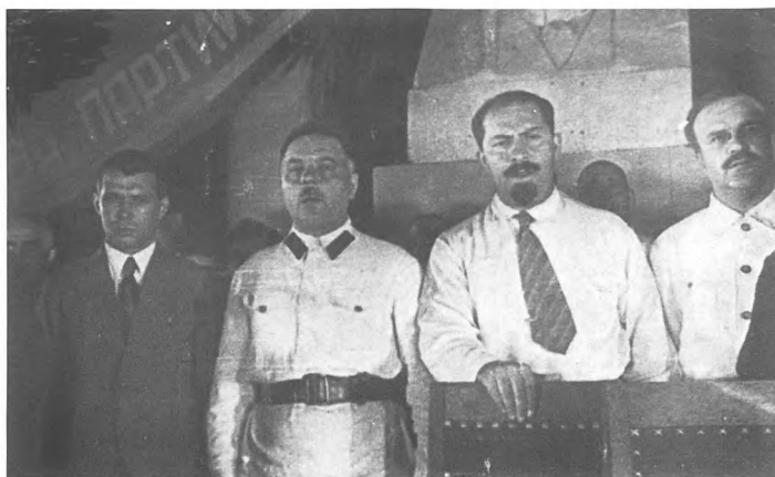
Александр Косарев, К.Е. Ворошилов, Л.М. Каганович, В.М. Молотов в президиуме VII конференции ВЛКСМ. 1932.