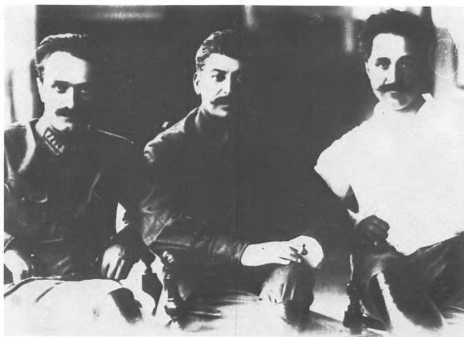
А.И. Микоян, И.В. Сталин, Г.К. Орджоникидзе. Тифлис, 1926.