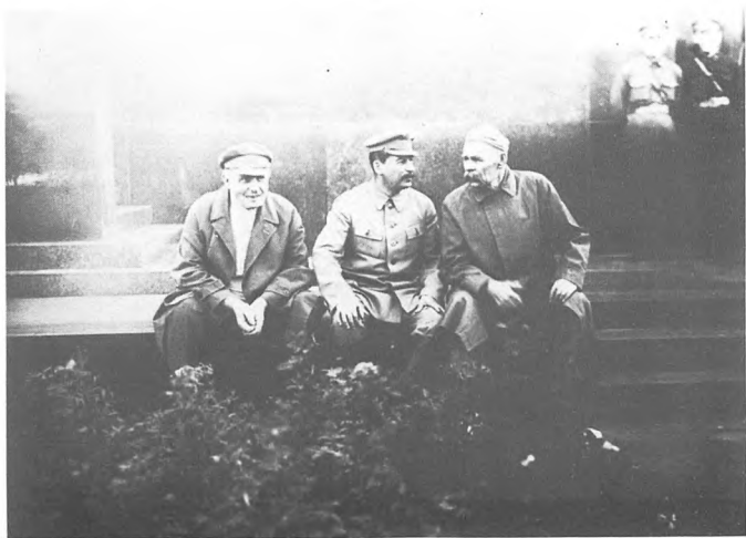
А.С. Енукидзе, И.В. Сталин, Максим Горький у мавзолея. 1932.