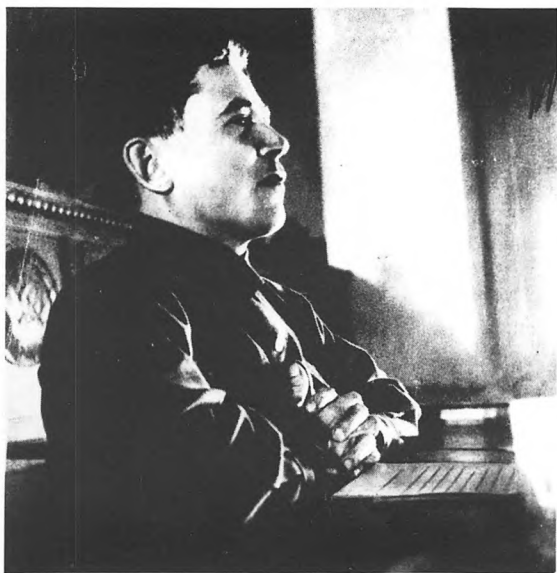
Сталинский нарком Николай Ежов.