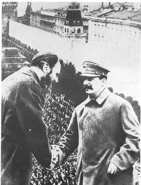
Сталин приветствует О.Ю. Шмидта, начальника арктической экспедиции на "Челюскине". 1934.