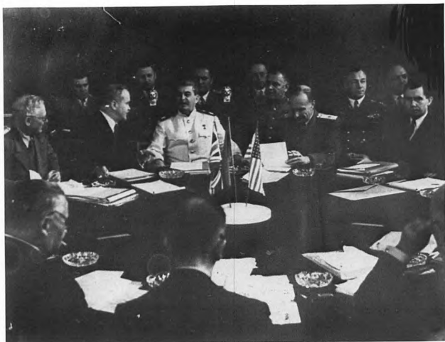
А.Я. Вышинский, В.М. Молотов, И.В. Сталин, Г.К. Жуков на заседании Потсдамской конференции. 1945.