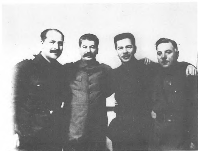
Л.М. Каганович, И.В. Сталин, П.П. Постышев, К.Е. Ворошилов. Январь 1933.