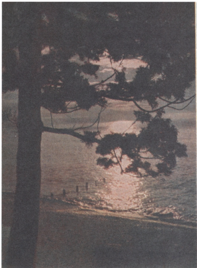
Черное море. Лунная дорожка.