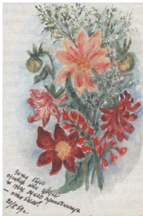
Рис. З.И. Таруниной от 20/X.1969 г.

Трогательно стихотворение «Последнее письмо». Сколько их приходило с фронта треугольничков со штемпелями полевой почты? Старик, как святыню, бережет этот пожелтевший треугольник от сына-фронтовика – это последнее письмо.