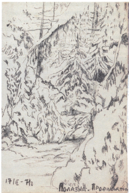
Рис. Лес зимой

Бывает – и часто! Небо низенькое, вздутое синевой, а в лесу такая свежесть, тишина! И на сердце тишина и тихая радость! А где-то все-таки плещет и плещет море.