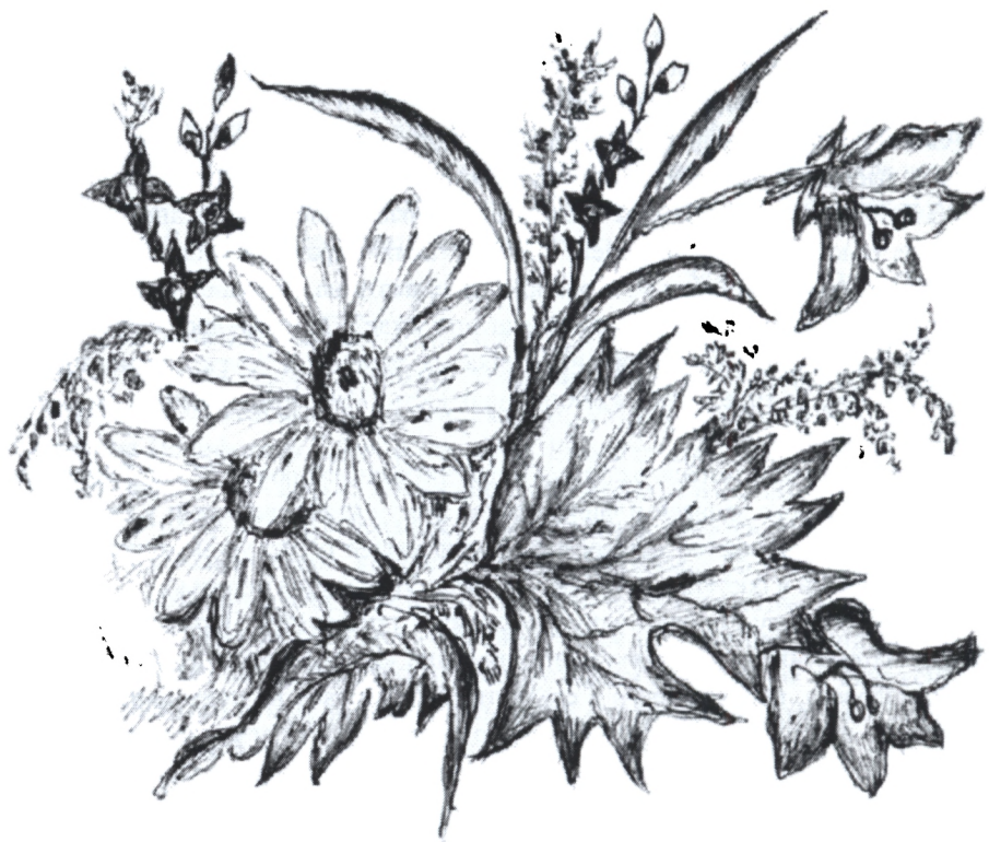
Рис. 3.И. Таруниной