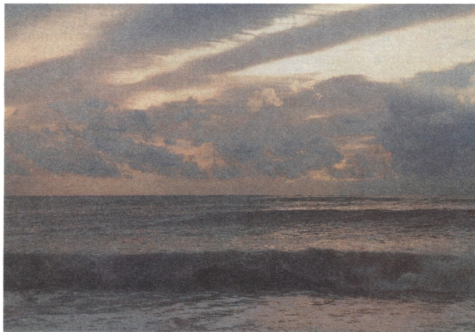
Море, закат.