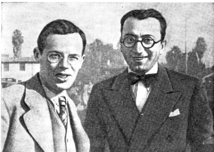
Илья Ильф и американский кинорежиссер Р. Мамульян

кого подвозили писатели, тех, кто помогал им вытаскивать из канавы едва не перевернувшийся автомобиль. С открытой душой принял Ильфа и Петрова Хемингуэй. Он звал их к себе во Флориду — на рыбную ловлю. Они были гостями Эптона Синклера, утверждавшего, что он никогда так не смеялся, как читая «Золотого тельца». Их дружески встретил уже прикованный к постели умирающий писатель Линкольн Стеффенс, только за год до того вступивший в коммунистическую партию. С лучшими голливудскими режиссерами они вели долгие откровенные разговоры, в которых, как перед самыми близкими людьми, раскрывались голливудские «крепостные». В ту же американскую зиму Ильф и Петров познакомились с Полем Робсоном. Это было время, когда впервые установились нормальные отношения между Советским Союзом и Соединенными Штатами с их рузвельтовским правительством.