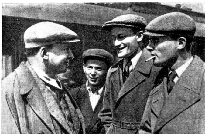
И. Ильф и Е. Петров встречают И. Эренбурга, приехавшего из-за границы. Москва, 1934 г.

и прочно, что произошло это без усилий со стороны критиков и литературоведов.