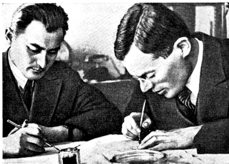
Илья Ильф и Евгений Петров за работой

Такова внешняя картина творчества Ильфа и Петрова. А сущность их соавторства? Что вносил в общее творчество каждый из писателей, что получила литература в результате такого своеобразного слияния двух творческих индивидуальностей? Попробуем ответить на этот вопрос, обратившись к предыстории творчества Ильфа и Петрова, к тому времени, когда возникли и существовали раздельно два писателя: писатель Илья Ильф и писатель Евгений Петров.