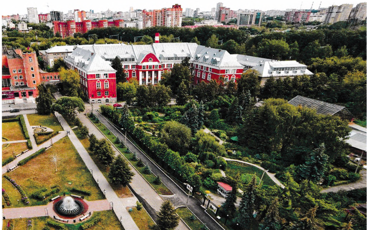
Комплекс Н. В. Мешкова стал основой университетского кампуса