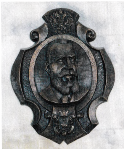
Барельеф Н. В. Мешкову в 1 корпусе