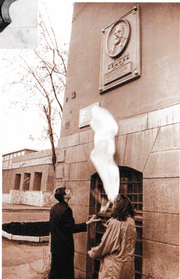
Открытие мемориальной доски Н. В. Мешкову, 1991 г.