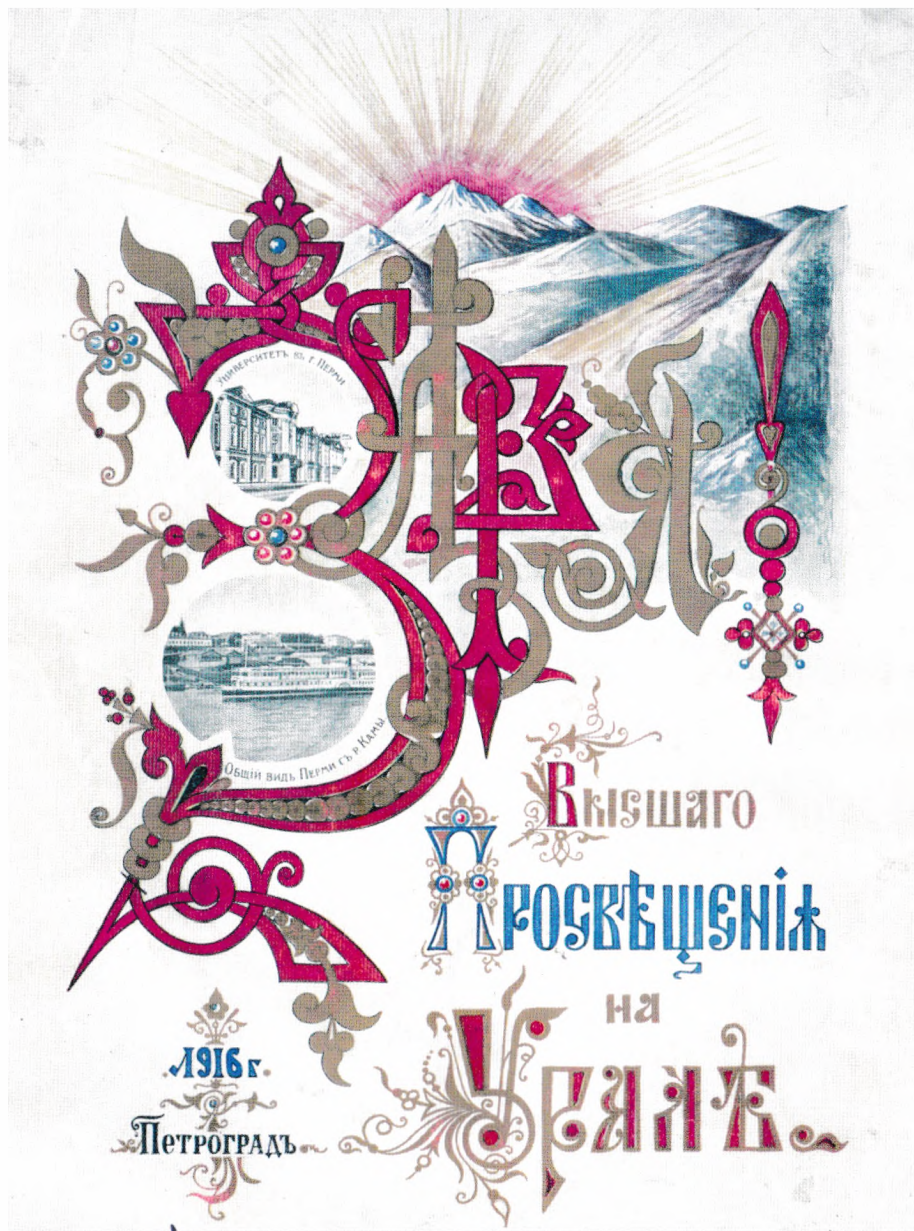
Обложка книги "Заря высшего просвещения на Урале", Петроград, 1916 г.