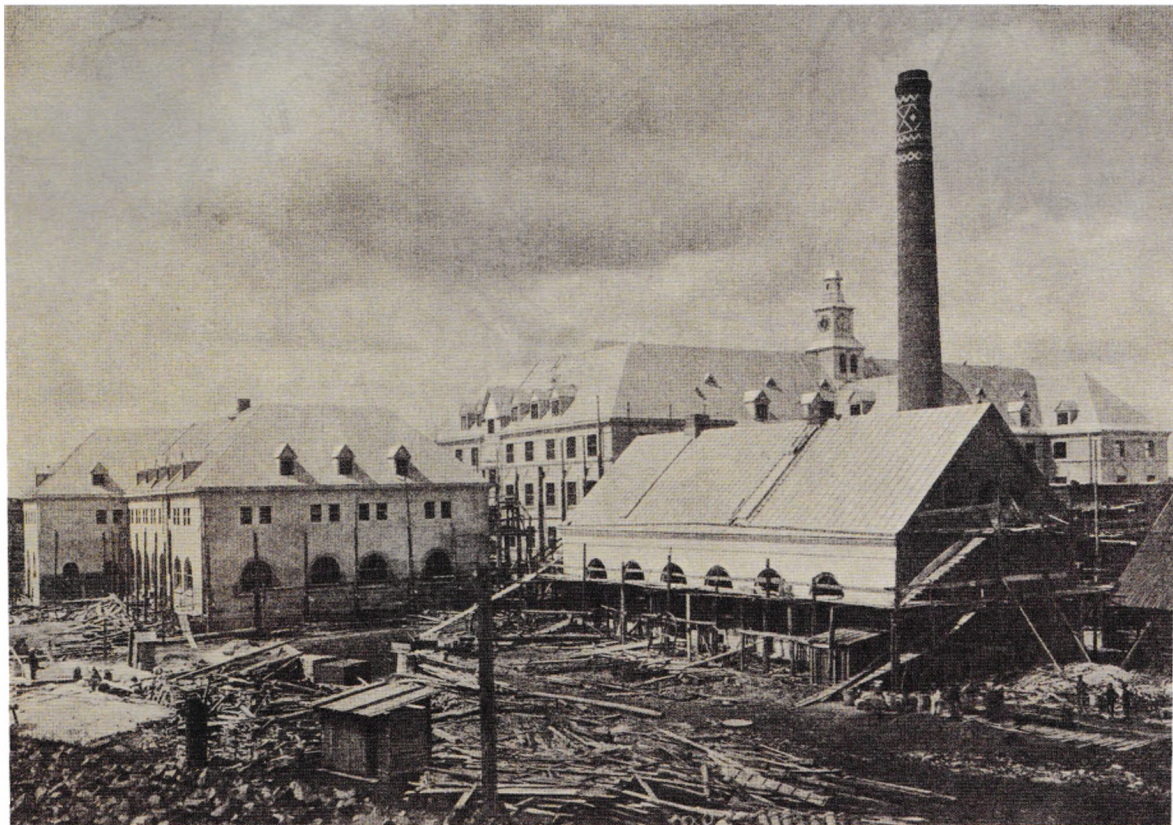
Строительство комплекса. Вид с железнодорожной насыпи