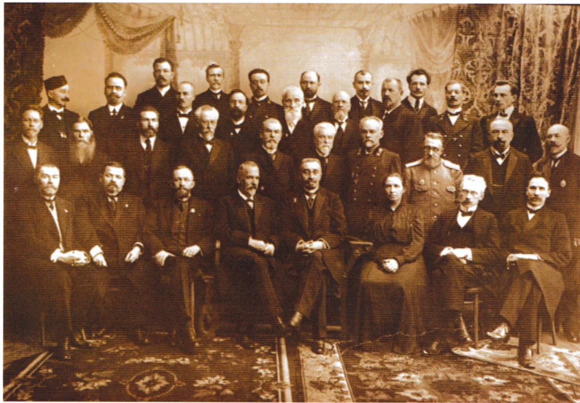
Комиссия по открытию университета в Перми 1 (14) октября 1916 г. В первом ряду четвертый слева Н. В. Мешков, рядом с ним товарищ министра народного просвещения В. Т. Шевяков, далее Т. В. Розанова