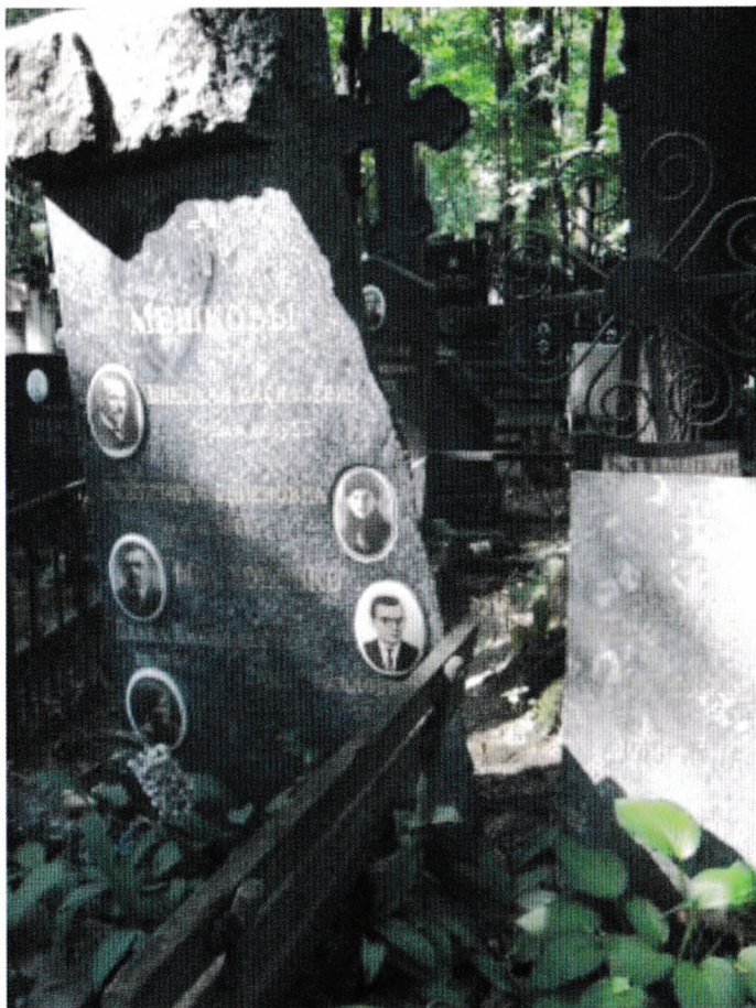
Могила Н. В. Мешкова на Введенском кладбище (Москва)