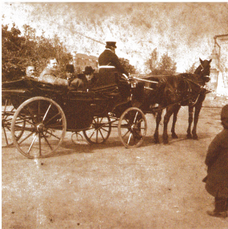
Н. В. Мешков с Ф. И. Шаляпиным и его музыкантами. Самара, 1909 г.