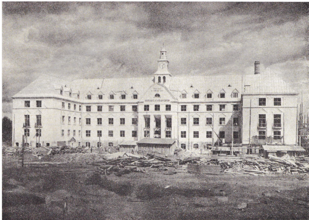
Строительство комплекса Ночлежного дома им. Е. И. Мешковой