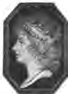
Графъ Павелъ Александровичъ и графиня Софія Владиміровна Строгановы въ молодости. (Съ миниатюры, принадлежащей великому князю Николаю Михайловичу).