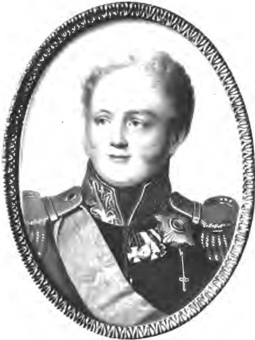
Императоръ Александръ I. (Съ миниатюры Строгановской коллекции).