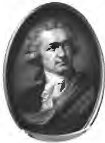
Графъ Александръ Сергѣевичъ Строгановъ. (Съ миниатюры Строгановской коллекціи).