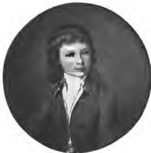
Графъ Павелъ Александровичъ Строгановъ мальчикомъ. (Съ миниатюры, принадлежавшей Ромму, нынѣ составляющей собственность великаго князя Николая Михайловича).