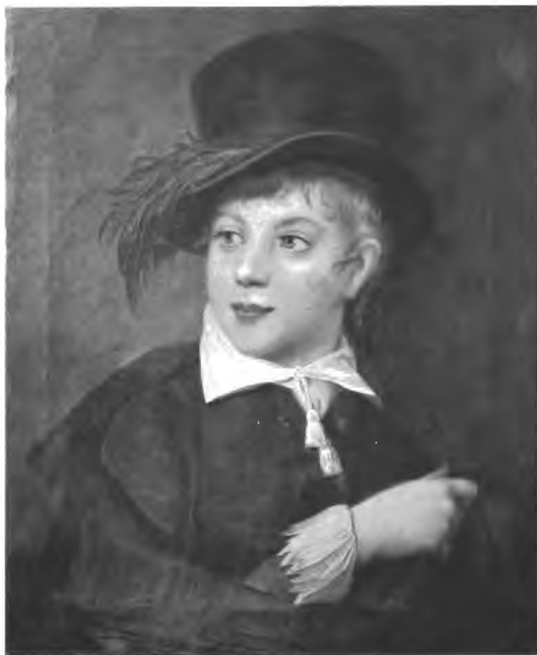
Графъ Александръ Павловичъ Строгановъ ребенкомъ. (Изъ Строгановской коллекціи).