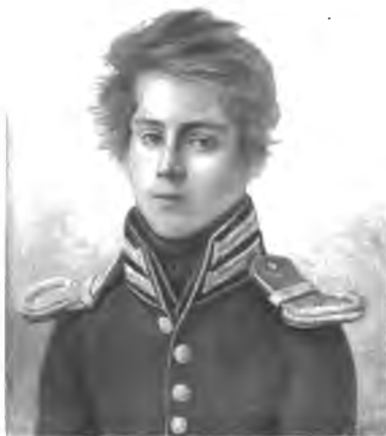
Графъ Сербій Григорьевичъ Строгановъ въ молодости. (Съ миниатюры Строгановской коллекціи).