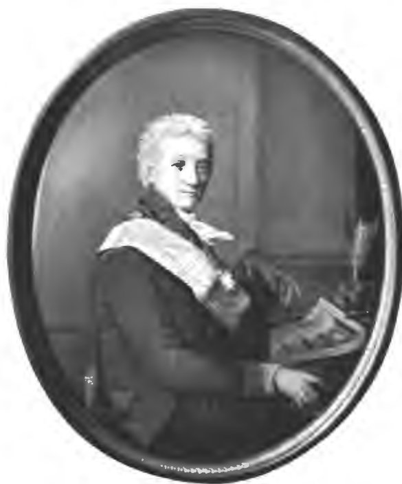
Графъ Александръ Сергѣевичъ Строгановъ. (Съ миниатюры Строгановской коллекции).