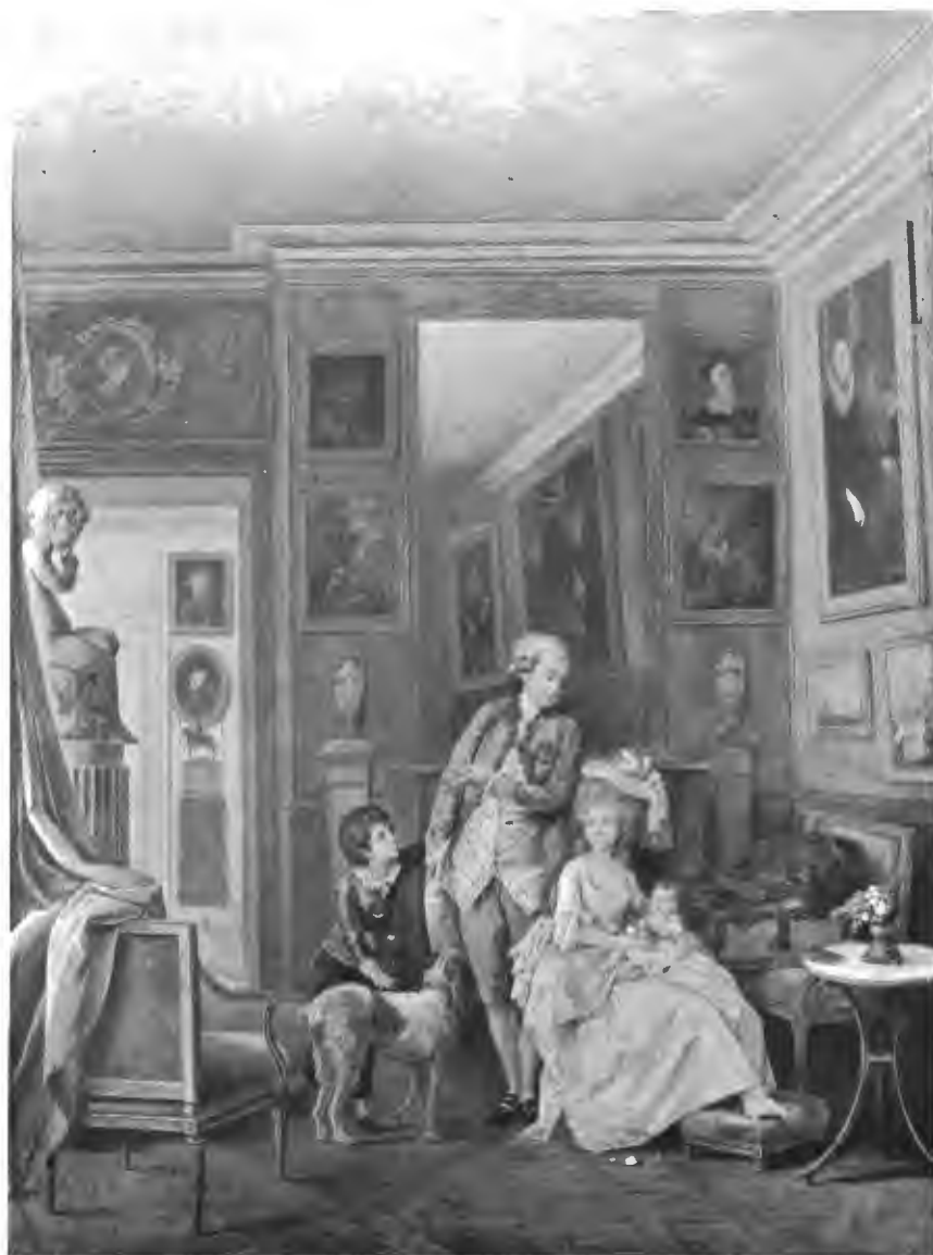
Графъ Александръ Сергѣевичъ Строгановъ съ супругой Екатериной Петровной и дѣтьми, Павломъ и Наталіей.