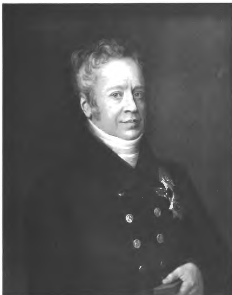
Графъ Григорій Александровичъ Строгановъ. (Изъ Строгановской коллекціи).