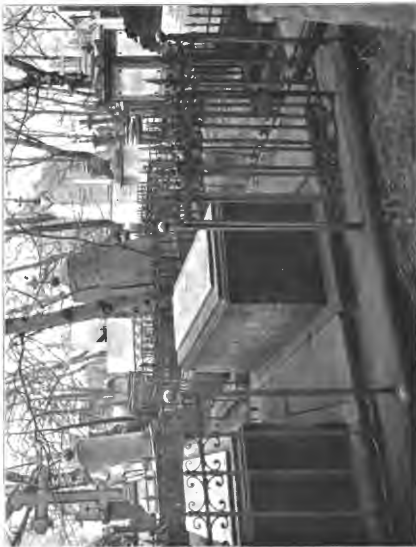
Могила графа Павла Александровича Строганова на кладбище Александрово-Невской лавры.