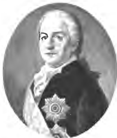
Графъ Александръ Романовичъ Воронцовъ, канцлеръ. (Съ миниатюры великаго князя Николая Михайловича).