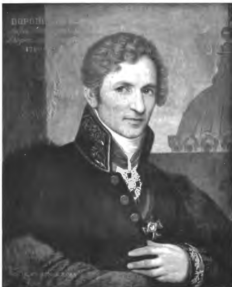
Андрей Никифорович Воронихинъ. (Съ портрета, находящагося въ Академіи Наукъ, имъ самимъ писаннаго).