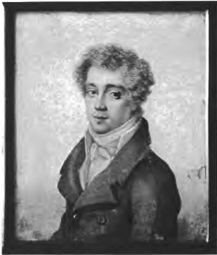
Баронъ Григорій Александровичъ Строгановъ въ молодыхъ годахъ. (Съ миниатюры Строгановской коллекціи).