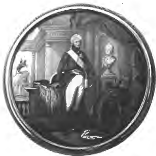
Императоръ Александръ I въ молодости. (Съ миниатюры великаго князя Николая Михайловича).