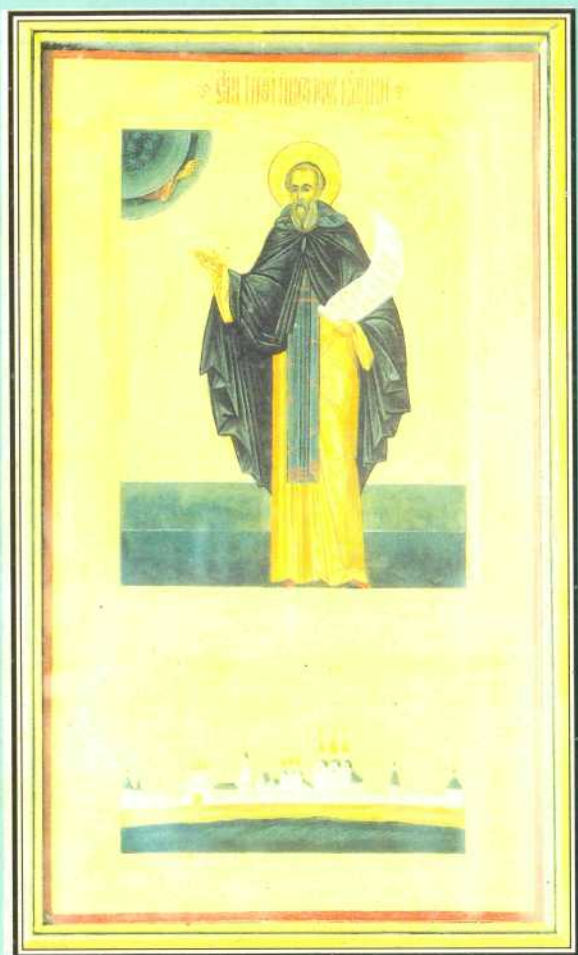
Преподобный Иосиф Волоцкий.

Икона работы И.В.Ватагиной. Середина XX века.