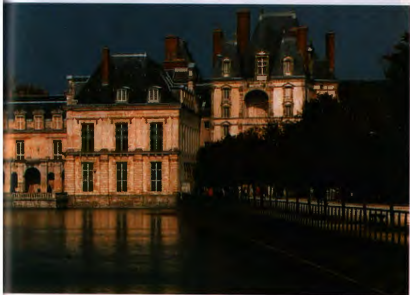
Chateau de Versailles, France, 1789