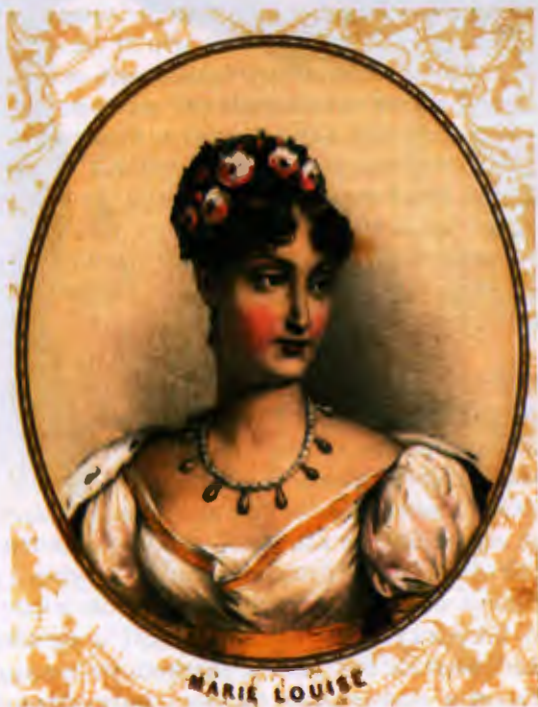
MARIE LOUISE Мария Луиза