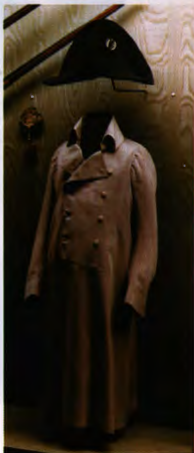
Знаменитые серая шинель и шляпа Наполеона