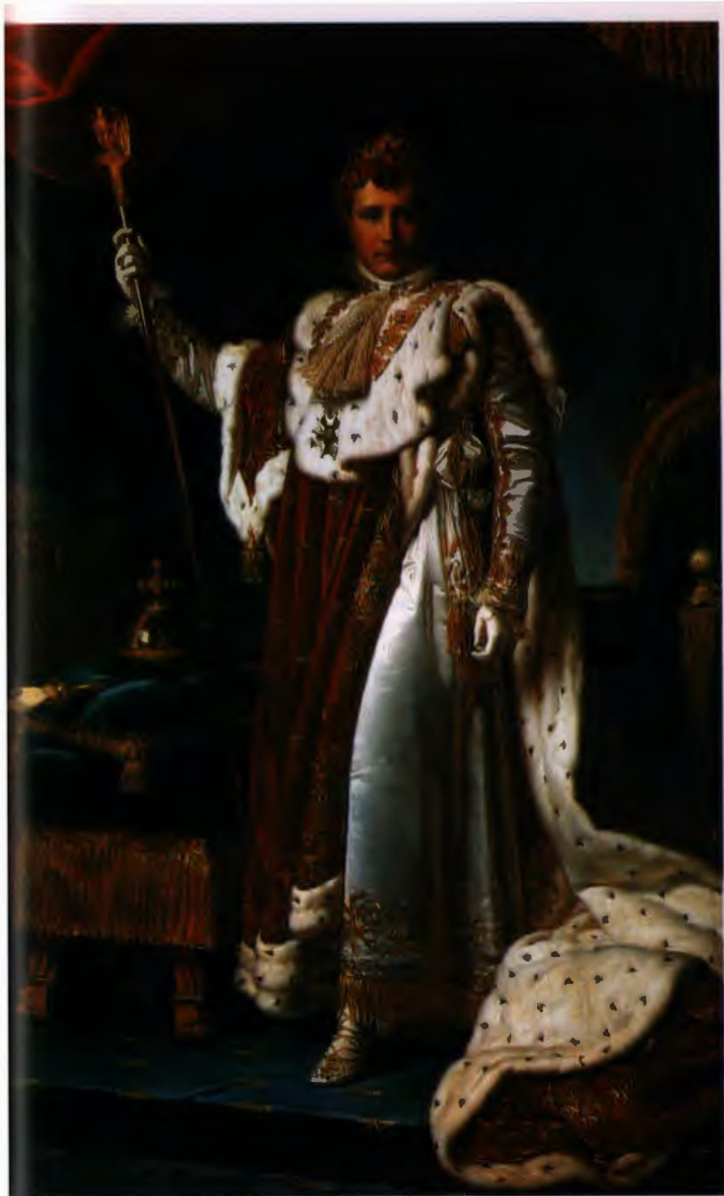
Наполеон в коронационном костюме