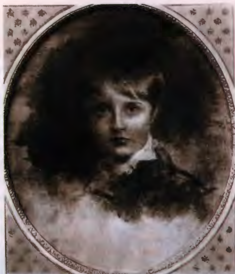
Наполеон II — сын Наполеона и Марии Луизы