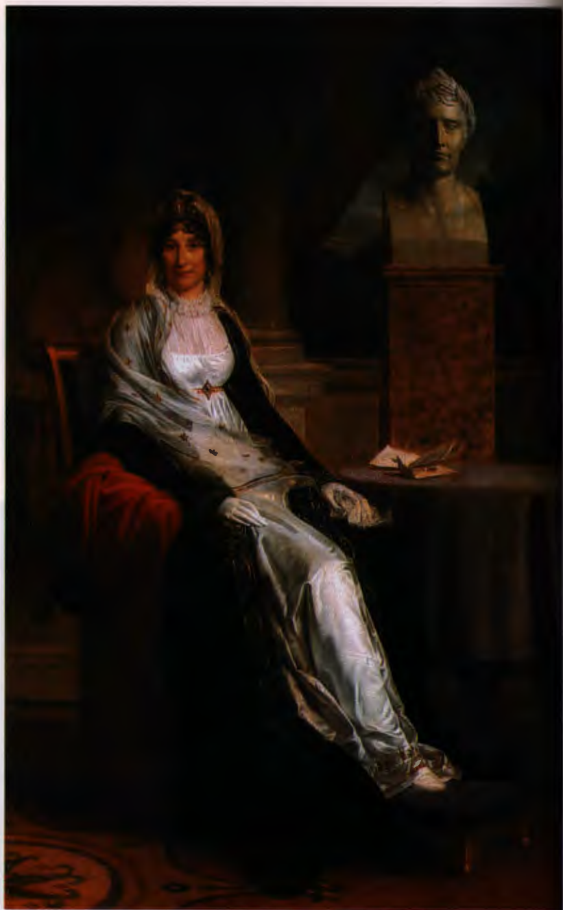
Мадам Мер , мать Наполеона