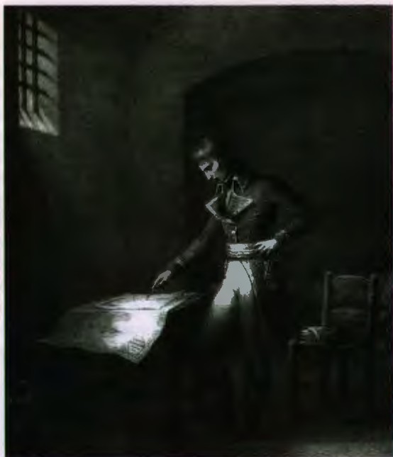
Бонапарт в тюрьме Антибского форта в августе 1794 года