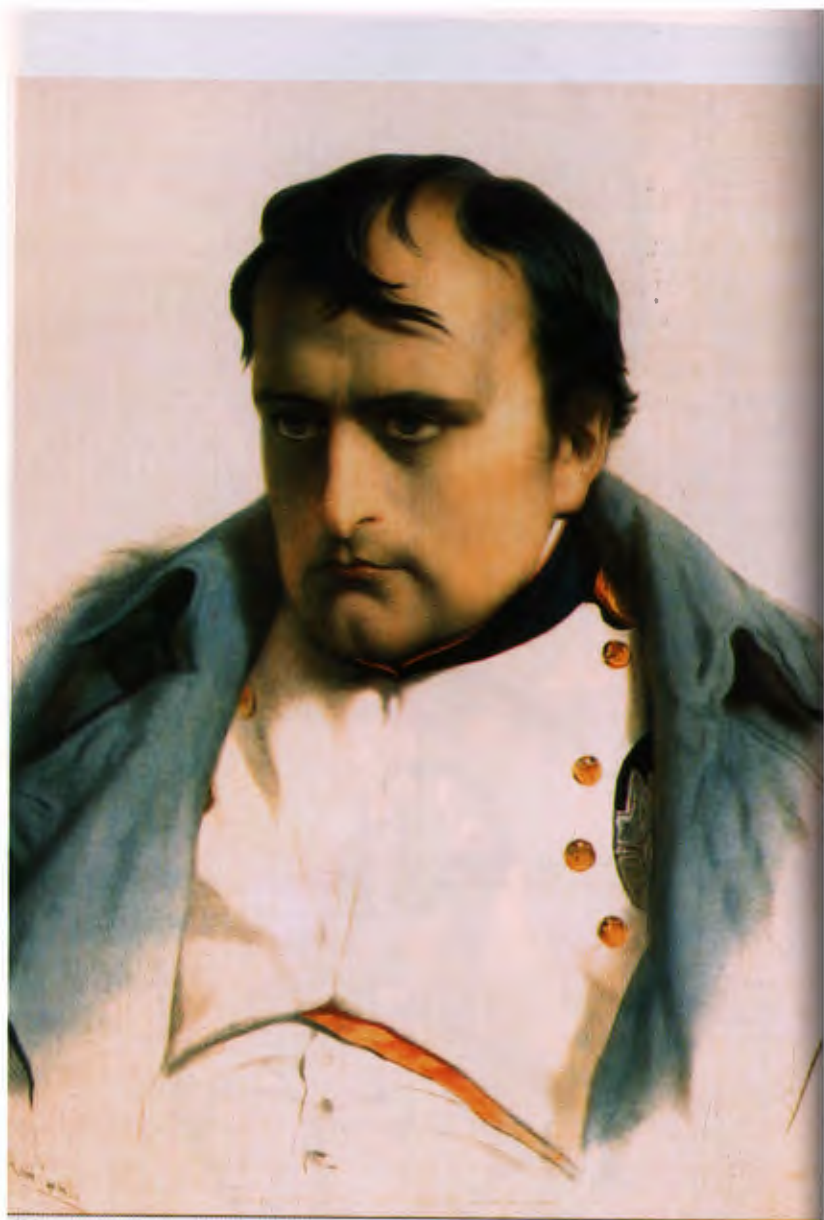
Portrait of a man in military uniform.