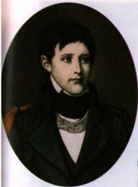
Бонапарт, лейтенант артиллерии