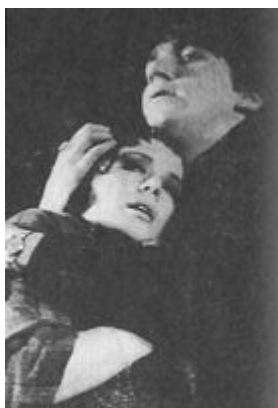
«Оглянись во гневе»