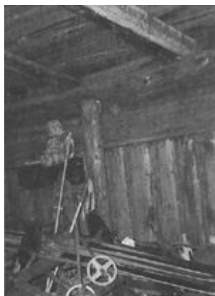
Лыжи в сарае лежат до сих пор.