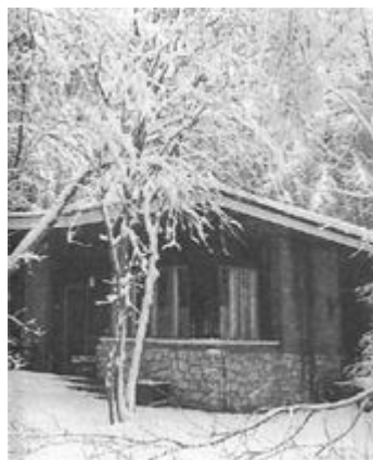
Дача в Пахре