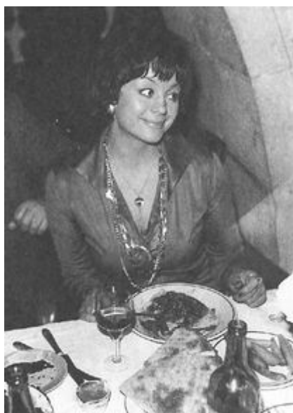
1976 год, Тбилиси.