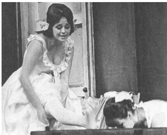
«Доходное место», в роли Юленьки.