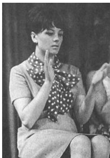
1966 год. Начало.