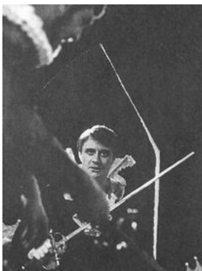
1967 год, «Дон Жуан».