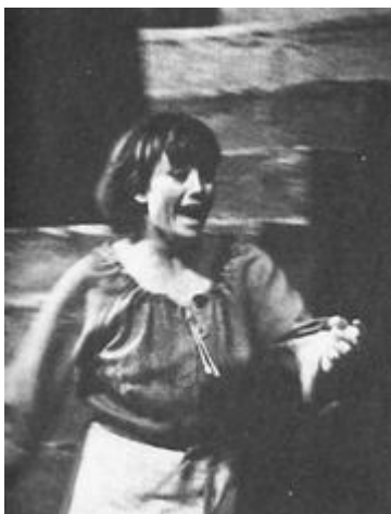
«Мамаша Кураж», в роли Катрин.