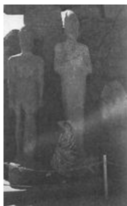
Египет, Луксор. 1998 год.