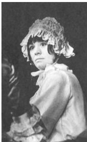
«Женитьба Фигаро», в роли Керубино.