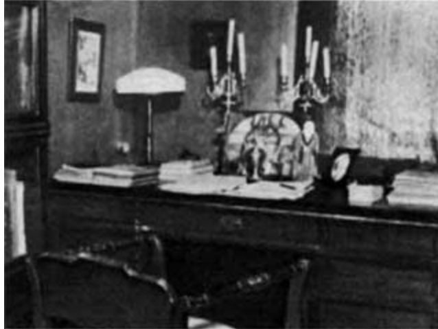
Кабинет М. А. Булгакова