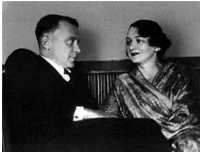
М. А. и Е. С. Булгаковы.

«Если судьба забросит тебя на угол улиц Ришелье и Мольера, вспомни меня! Жану Батисту де Мольеру от меня привет»