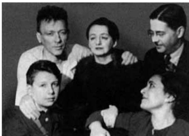
М. А. Булгаков в последний год жизни среди родных и друзей.

«Участь Миши мне ясна, он будет одинок и затравлен до конца дней»