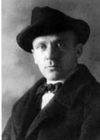
М. А. Булгаков. 1928 г.

«Очень обижается Булгаков на Советскую власть и очень недоволен нынешним положением. Совсем работать нельзя»