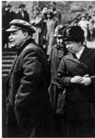
В. И. Ленин и Н. К. Крупская. «Надежда Константиновна взяла мой лист и написала сбоку красными чернилами: "Прошу дать ордер на совместное жительство"»