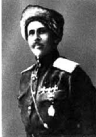
Гетман П. П. Скоропадский: «Великорусские круги на Украине невыносимы»