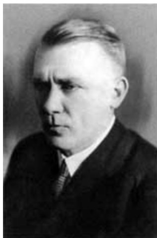
М. А. Булгаков.

«Участь Миши мне ясна, он будет одинок и затравлен до конца дней»