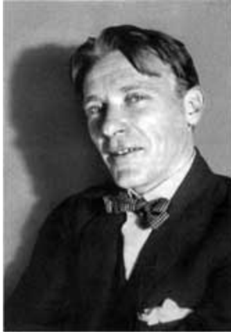
М. А. Булгаков.

«Синеглазый прославился и на некоторое время разбогател»