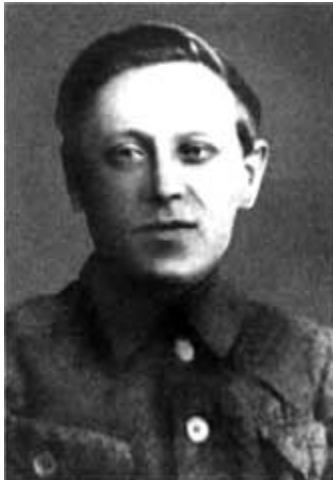
Семен Петлюра: «...и хотят Украину продавать бывшим царским министрам России...»