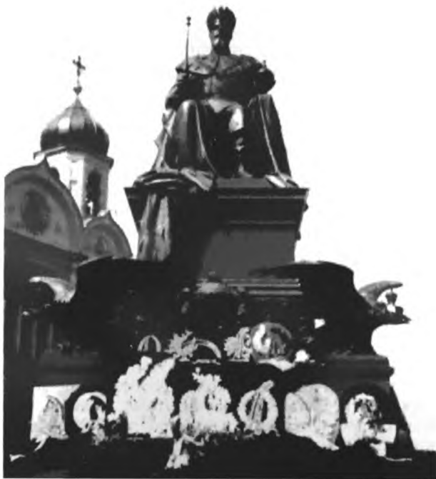
Памятник Александру III в Москве. 1912 г.