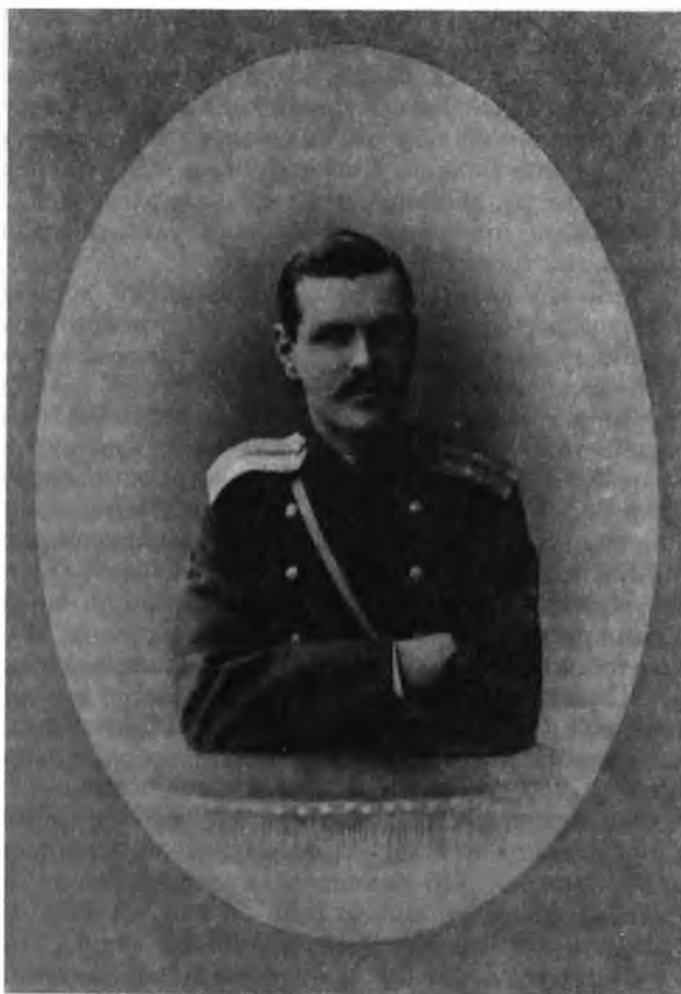
В. Ф. Джунковский. 1886 г.