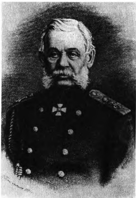
Д. А. Милютин