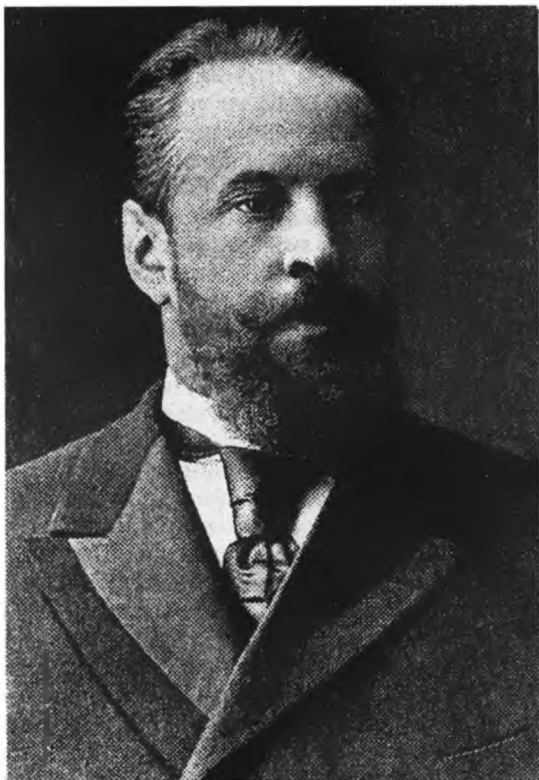
С. Ю. Витте