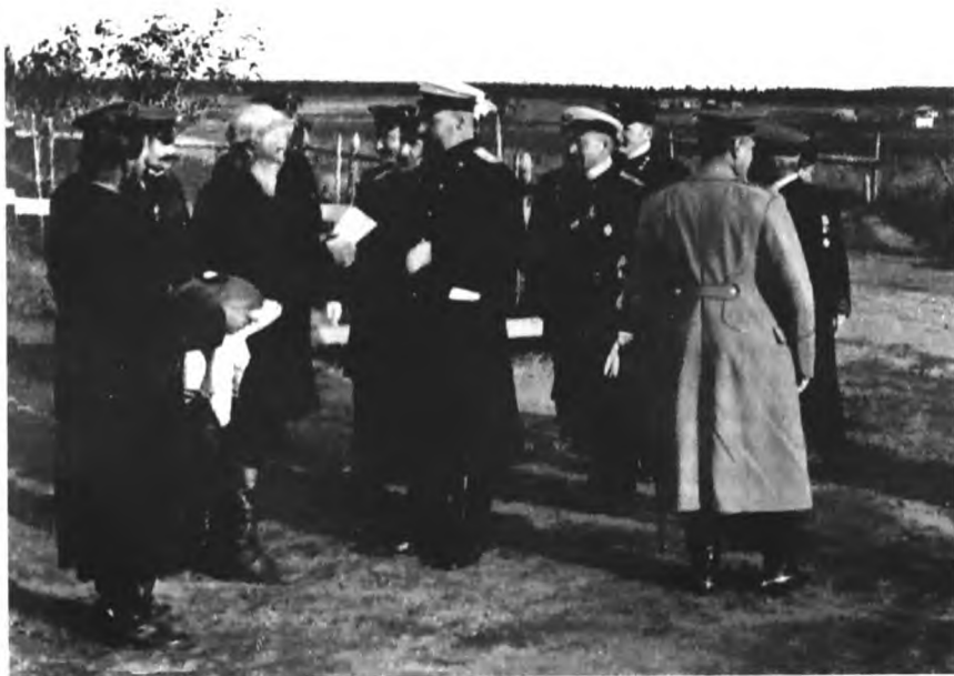
П. А. Столыпин на Колонецких хуторах в Бронницком уезде. 1910 г.