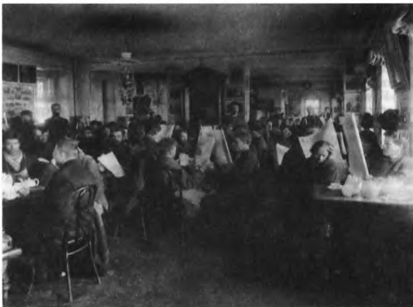
Чайная на Хитровом рынке (Фото из альбома, преподнесенного В. Ф. Джунковскому 14 апреля 1902 г.)