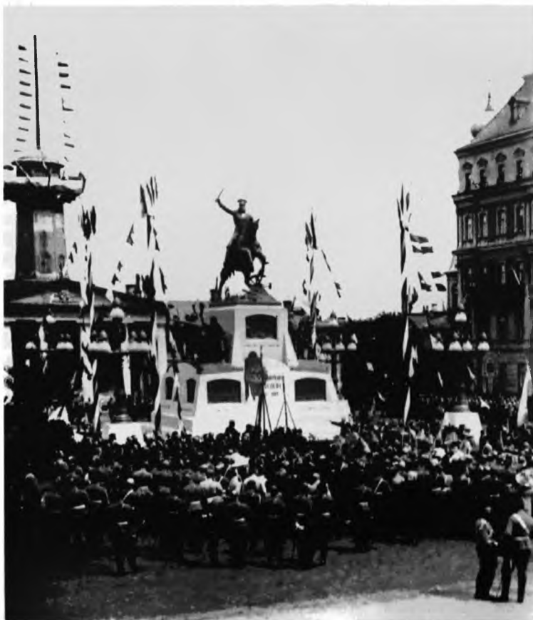
Открытие памятника генералу М. Д. Скобелеву в Москве. 1912 г.