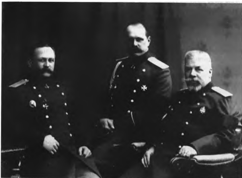
Московский генерал-губернатор С. К. Гершельман, московский губернатор В. Ф. Джунковский, московский градоначальник А. А. Адрианов. 1908 г.