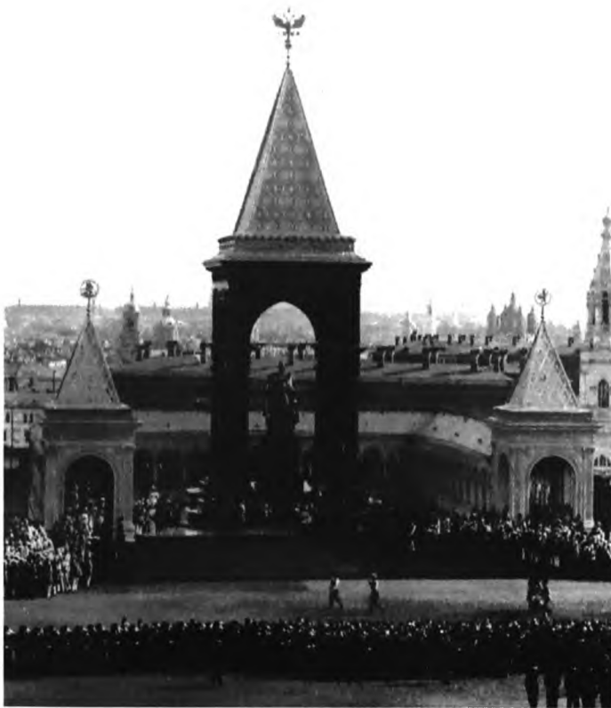
Памятник Александру II. 1911 г.