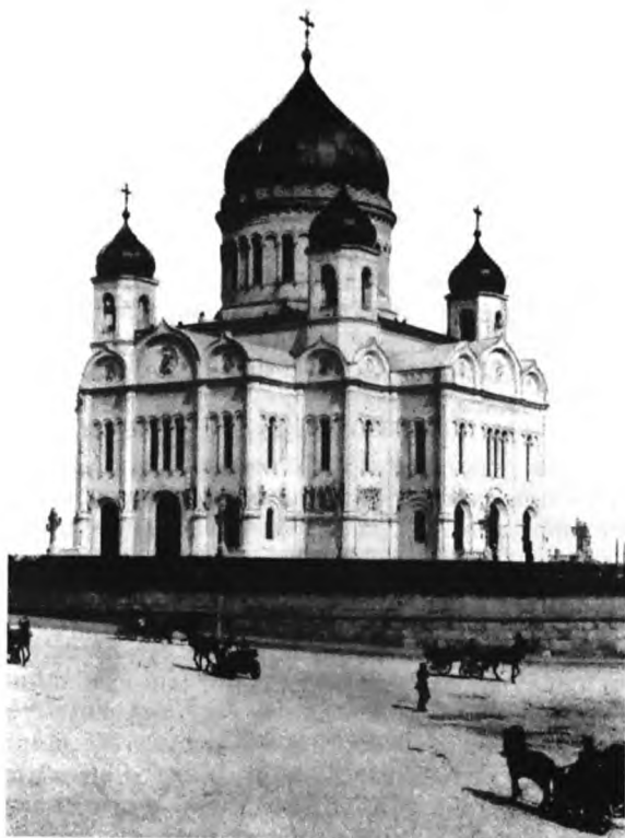
Храм Христа Спасителя