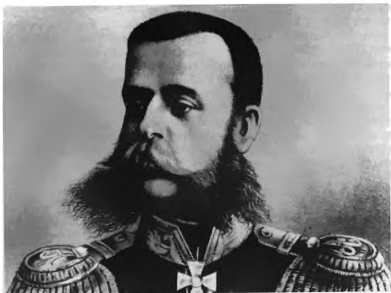
М. Д. Скобелев