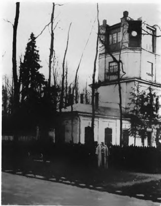
В. Ф. Джунковский с членами общества благоустройства поселка Новогиреево. 1908 г.