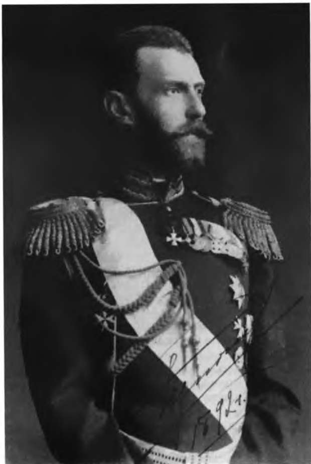
Московский генерал-губернатор великий князь Сергей Александрович. 1886 г.