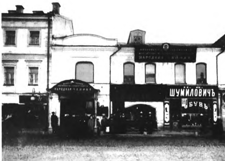
Чайная Московского столичного попечительства о народной трезвости