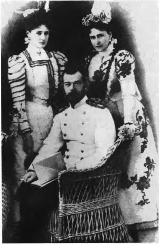
Император Николай II, императрица Александра Федоровна, великая княгиня Елизавета Федоровна