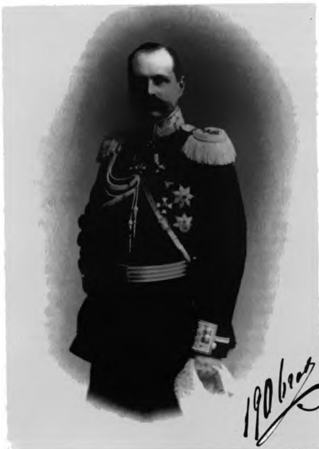
В. Ф. Джунковский. 1906 г.