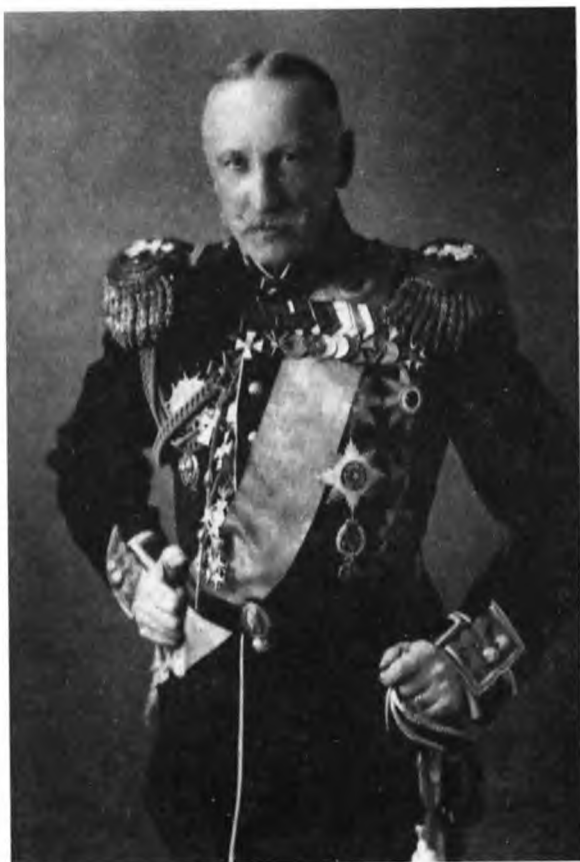
Ф. В. Дубасов, московский генерал-губернатор в 1905—1906 гг. 1906 г.