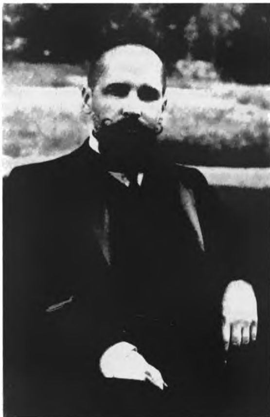
П. А. Столыпин