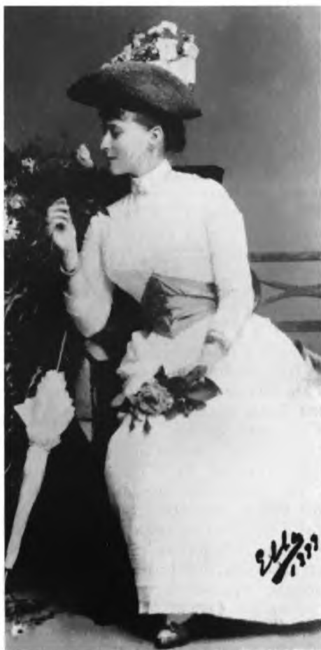
Великая княгиня Елизавета Федоровна, жена великого князя Сергея Александровича. 1888 г.