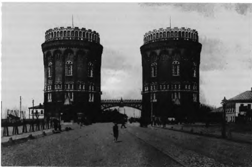
Водонапорная башня у Крестовской заставы