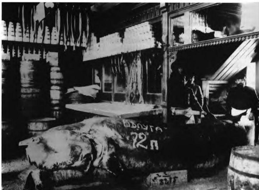
Рыбный магазин в Москве. Нач. 1900-х гг.