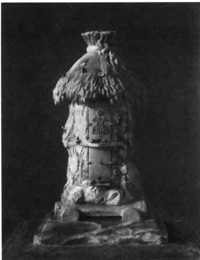
Улей, преподнесенный Старцевым наследнику царевичу Алексею. 1912 г.