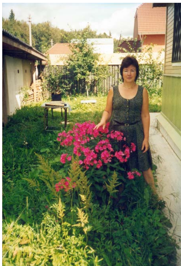
2002 год. Дом в Подмосковной деревне. Красные флоксы.