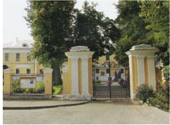
То же место после реставрации 1997г.

В главный дом усадьбы я заходила только один раз. Обычно дети в гости домой друг к другу не ходили: все жили, как и мы, по два квадратных метра на человека. Встречались и играли во дворе. А тут наступил мертвый сезон. Закончилась учеба в школе, и многие ребята разъехались на летние каникулы кто куда. Вот я и пошла в этот дом в надежде встретить кого-нибудь из ребят. Длиннющий коридор. Вдоль коридора множество дверей, обитых дерматином или ободранной клеенкой. Я растерялась, не зная куда идти дальше. И вдруг увидела маленького воробышка, который бился между двумя рамами закрытого окна в конце коридора. А перед окном сидела кошка и лапой через открытую форточку пыталась бедного воробышка достать. Я забыла обо всем на свете, ринулась на помощь.