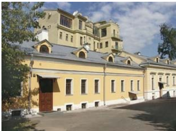
Дом после реставрации. Окошко справа от входа – мое.

Во дворе жили две девочки-сестрички, они выносили на улицу очень интересные книжки, красивые, с картинками, большого формата. И мы, сидя на лавочке, по очереди читали вслух. Помню совершенно фантастические арабские сказки с удивительными, неизвестными мне сказочными персонажами: шейхи, дервиши, джинны – так не похожими на наши русские, которые я знала. Невероятным везением для меня была возможность записаться в детский читальный зал Ленинской библиотеки. Он был открыт еще во время войны в 1942 году в Румянцевском зале Дома Пашкова. Всю войну он работал, чтобы маленькие москвичи и в это тяжелое время могли читать хорошие книжки. Во время бомбежек детей уводили из зала в бомбоубежище. У меня был настоящий читательский билет – книжечка в твердой обложке желтого цвета. Я сама, когда хотела, приходила и брала любые книжки. Они стояли на полках в открытом доступе, не было никаких каталогов и не надо было никого просить. Я просто выбирала самую красивую, садилась за стол и читала.