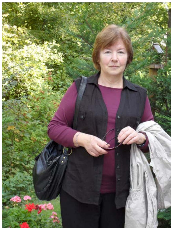
2011 год, когда была написана эта книга.