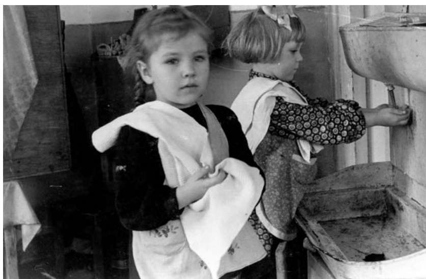
Я в детском саду в мамином фартучке.

Платья мне шила бабушка, а вышивала мама. У меня были беленькие фартучки на ляпочках, расшитые вишенками и клубничками. Один фартучек, самый замечательный, помню очень хорошо. Это была кошка с мордочкой посередине, а лапками – ляпочками она меня обнимала. Все придумывала мама. Ночами она вышивала мелким-мелким крестиком необыкновенные картины, подушки и думочки (маленькие подушки) и даже украшала скатерти. Вышивала под керосинкой или настольной лампой, уперев одну сторону пальцев в край стола, а другую в свой желудок, что, наверное, было больно. Очень хотелось как-то украсить пусть не свое временное жилье, создать уют.