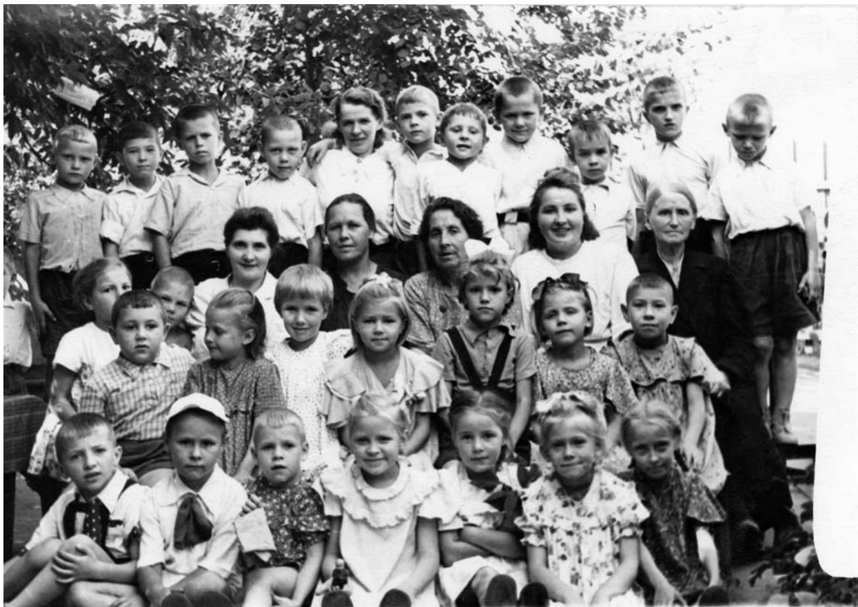
Детский сад. Мама, как положено медсестре, в белом халате. Рядом старенькая женщина, наш музыкальный работник. Я – третья слева во втором ряду.

Но мы в детском саду жили хорошо. Нас кормили три раза, у нас были игрушки и книжки, у нас были цветные карандаши и бумага, нас учили петь хором. Комната была одна. Мы в ней ели за маленькими столиками, здесь же и играли, а для тихого часа воспитательница ставила нам раскладные деревянные кровати с натянутой парусиной по форме напоминающими раскладные стулья, с которыми в наше время рыбаки ходят на рыбалку. Потом их убирали, и они стояли прислоненными к стенке, огромные, тяжелые.