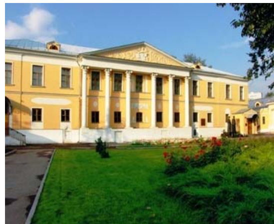
Усадьба Лопухиных после реставрации.