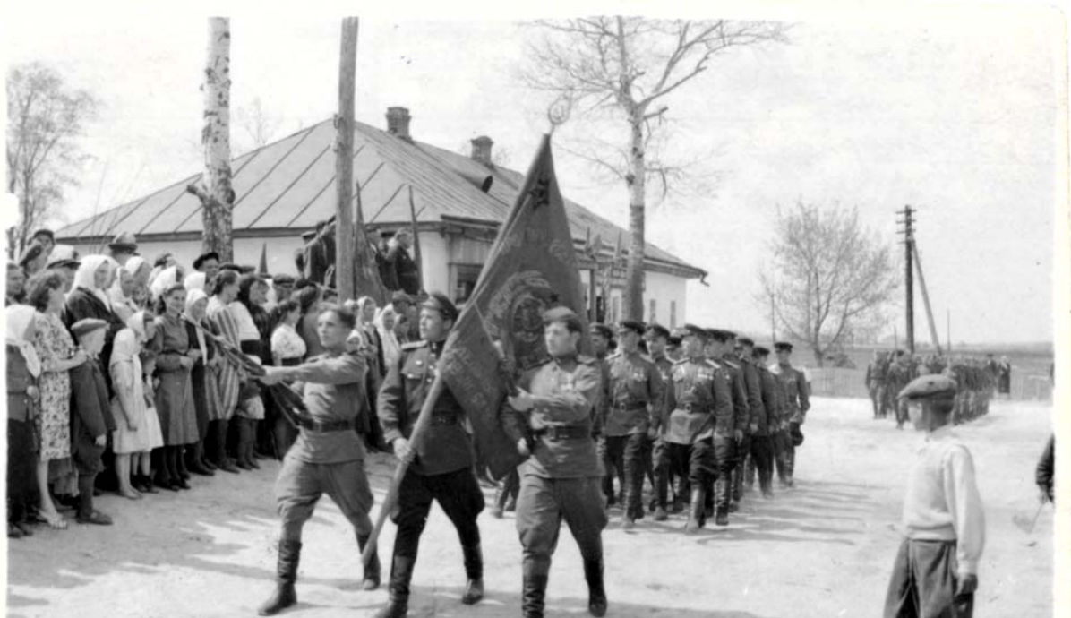
1949 год. Киечевка. Парад победы 9 мая. Мой папа в первом ряду крайний справа.

Потом, когда мне был один год, мы жили в Киечевке, на Украине, у мамы были огород и поросенок. Мама со мной ходила на огород, меня сажала на одеяло, там я и пошла первый раз за початком кукурузы. Мама тут же позвонила отцу, он прибежал, видимо, воинская часть была рядом, чтобы посмотреть на это чудо расчудесное, меня уговаривали, но я не сдвинулась с места. Один раз там же на этом же одеяле на меня напал соседский петух, он взлетел мне на голову и стал клевать, я закричала. Мама потом говорила, что у меня чудом сохранились глаза. Этот петух всех соседей доставал, но после случая со мной его пришлось наказать.