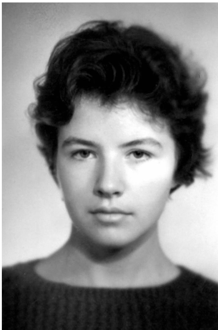
Я в возрасте 17 лет, после окончания школы. Перед поступлением в Московский экономико-статистический институт.