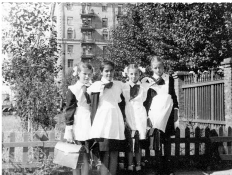
Я и мои подружки около школы.

После нашего старого жилья новая комната казалась огромной, да и сам переезд в новый дом с лифтом и квартира со всеми сказочными для нас удобствами казались нереальными. Родители, особенно папа, тоже испытывали чувство неземного счастья, и в день переезда вечером, лежа в кровати в своей собственной комнате, слыша, как наши соседи по квартире со свечкой и сантиметром (в первый вечер почему-то отключили электричество) делят общественные стенки в коридоре, при этом громко спорят, ругаются, очень удивлялся человеческой глупости и жадности. Сам он даже и не подумал участвовать в этом дележе общественной собственности. Он был умиротворен и расслаблен, как самый счастливый человек на свете.