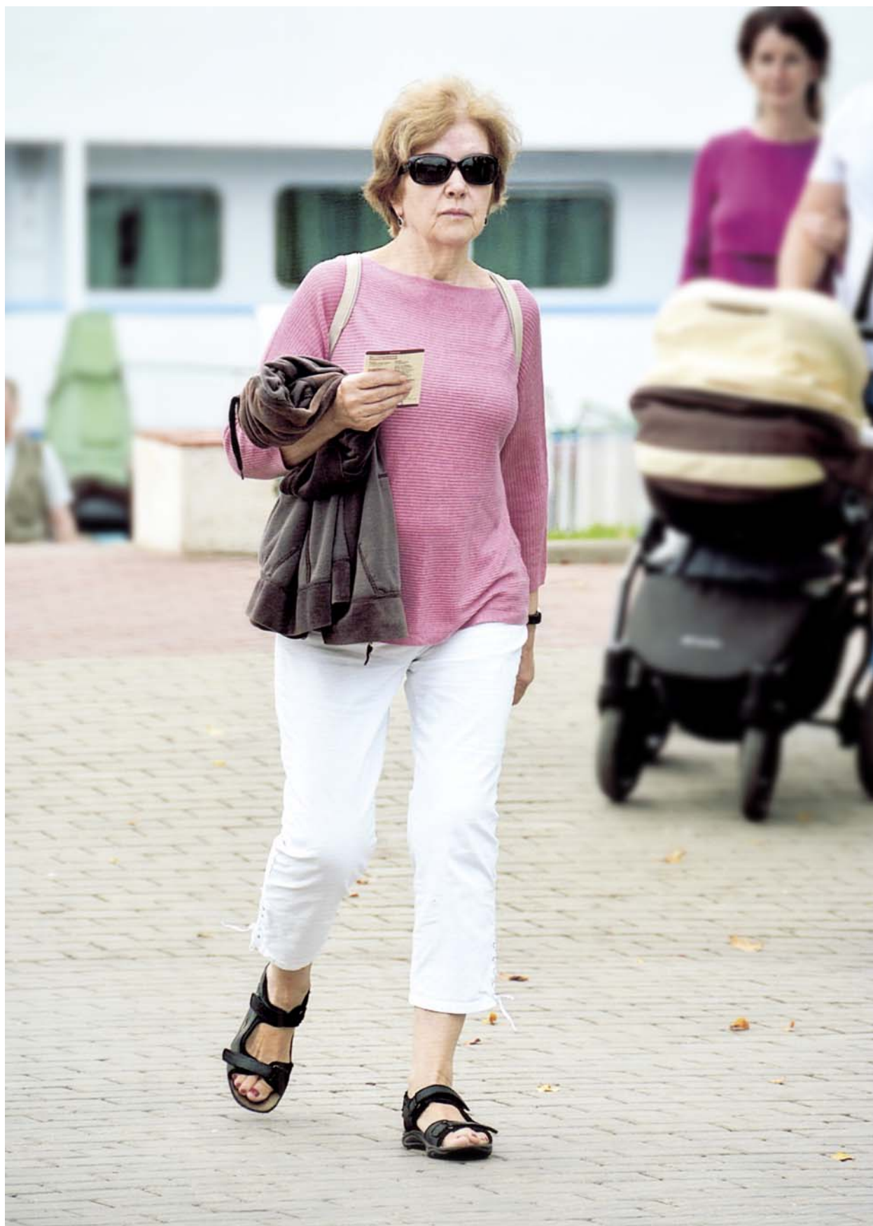
1 сентября 2019 года. Кострома. Во время круиза по Волге на теплоходе «Георгий Жуков».