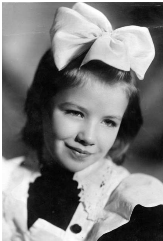
Я – первоклассница.

В детском саду мы лепили много, но только из одноцветной глины, да и сам процесс лепки не был простым занятием – надо было мочить руки в воде. А писали мы сначала карандашами, а потом ручками. Ручка была деревянной палочкой с металлическим наконечником, к которому крепилось съёмное стальное перышко, раздвоенное на конце. Перышко смачивали чернилами из чернильницы и писали, пока чернила на перышке не заканчивались. Хватало на несколько букв. Потом перышко надо было опять опускать в чернильницу. Учиться писать чернилами было трудно. Если на перо попадало больше чернил, чем надо, – поставишь кляксу. Еще надо было писать красиво: когда рука шла вниз, то с нажимом (раздвоенный кончик пера расширялся и линия получалась толстой), когда наверх – то волосяной линией. Когда много позже вводили в школах шариковые ручки, которые пишут линией одинаковой толщины, многие были против, боялись испортить детский подчерк. Сейчас же мы боимся, как бы наши дети вообще не разучились писать, когда можно печатать на клавиатуре.