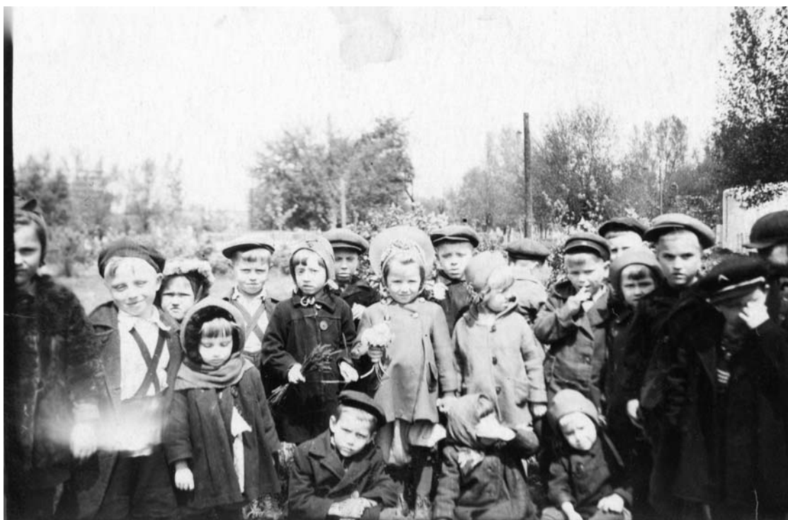
Детский сад. Я в центре в шляпе.