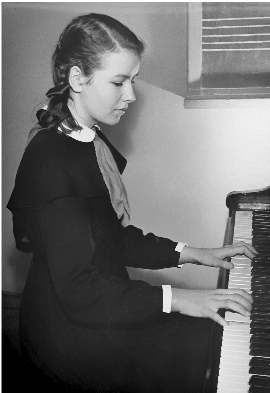
Я в возрасте 13 лет