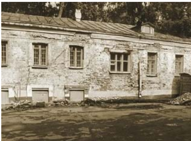
Что осталось от моего дома к 1970 году