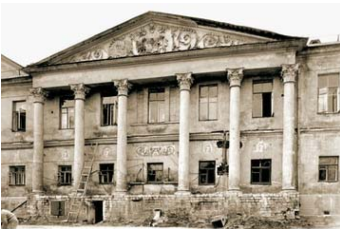
Здесь я спасала воробья.

Окно было наглухо забито гвоздями, открыть я его не смогла, как ни старалась. Попыталась поймать птенчика через форточку, но окно оказалось слишком высоким, а моя рука не намного длиннее кошачьей. Вокруг никого нет, и помощи ждать неоткуда. Кошку я отогнала, но она в любой момент могла вернуться. И я побежала на улицу. В нашем дворе, я знала, была столярная мастерская и всегда валялись всякие реечки, палочки, разный деревянный мусор, что могло помочь мне достать воробья. Я бежала во весь дух, думая только о нем, маленьком и беззащитном, и упала. Прямо на скорости проехала по асфальту своими двумя коленками и обоими локтями. Сильно содрала кожу. Обрато к воробью, с деревянной рейкой я уже возвращалась, хромая. Ни кошки, ни воробышка не было. О том страшном, что могло произойти, я старалась не думать.