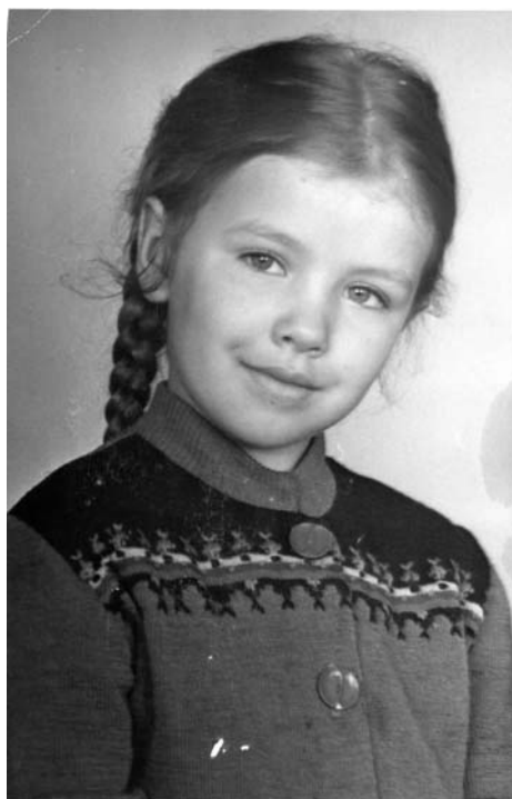
Здесь я еще с косичками.

Сразу после войны в городе Курске начали строить большой красивый железнодорожный вокзал. Старый разбомбили немцы во время авианалета. И нашу детсадовскую группу повели в него на экскурсию. Внешне вокзал был закончен, но внутри еще велись отделочные работы. Нам, как взрослым, рассказывали все про новый вокзал, водили по залам. Он был построен в честь погибших на Курской дуге. На стенах высоко под потолком я запомнила круглые барельефы. Но больше всего помню вкусный пряник в виде звездочки, который мне купила в привокзальном буфете тетя Лида, дяди Толина жена. Она здесь работала от художественной мастерской. Я очень была рада ее видеть. А с пряником не знала, что делать. Было очень неловко есть его одной при всех. Тогда я отдала его воспитательнице, которая как-то поделила его между детьми, и я съела свою долю уже с чистой совестью. Вокзал был открыт в августе 1952 года.