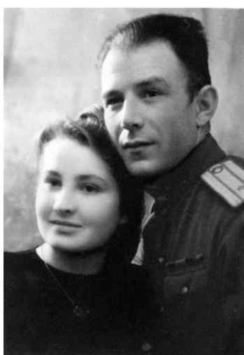
Мои родители. 1945 год.

Мама поступила в медицинский фельдшерско-акушерский техникум в Курске, сдала выпускные экзамены прямо перед моим рождением. По моему глубокому убеждению, мама должна была быть врачом, обязательно детским врачом, и в Курске для этого были все условия – прекрасный медицинский институт еще с дореволюционной историей, и мама с ее большим желанием и упорством, но все сломала, искорежила война.