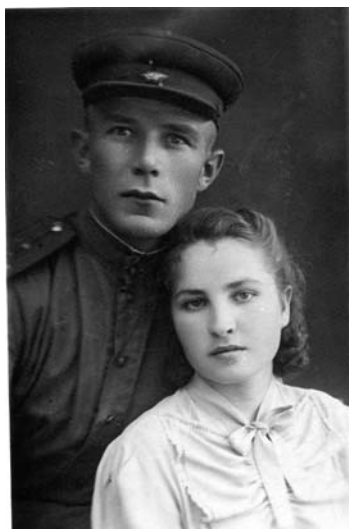
Мои родители. 1944год.

Так в преддверии великой битвы Второй мировой войны недалеко от места сражения и начался их роман. Папа уже считал бабушкину квартиру в Курске своим пристанищем. Уходя на фронт, оставил у них свои вещи: шинель и белые командирские бурки. Притащил откуда-то фанерный почтовый ящик с мукой, в которой были закопаны несколько гусиных яиц.