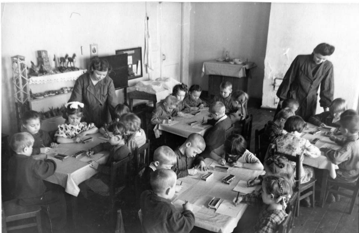
Детский сад. Мой затылок с двумя косичками за угловым столом около печки.

...Послевоенный детский сад. Мама работала медсестрой. Она лечила, делала прививки, отвечала за чистоту, составляла меню и должна была пробовать готовую еду, но никогда этого не делала. Она стеснялась. Было время голодное. Мою воспитательницу, немолодую женщину, которая жила с больной дочерью, уличили в том, что она прятала в печке оставшиеся от нас, детей, недоеденные огрызки хлеба. Ее чудом не уволили. Родители заболевшего ребенка приходили с кастрюльками за его порцией еды, чтобы накормить этой скудной едой всю семью.