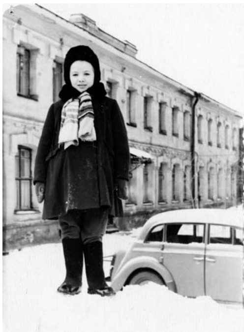
Зима. Валенки с калошами, шуба, меховая шапка с ушами. Шарфик – для красоты, только для девочки. За спиной – мой дом.

Мама, видя мое горе, повела меня в Детский мир в игрушечный отдел на первом этаже. Я задыхнулась от количества самых разных кукол в самых разнообразных одежках: не только в платьицах, но и в брючках, курточках с золотыми пуговицами. Мама мне сказала, чтобы я выбирала любую. А я закрыла глаза на все это великолепие, сказала себе, что они очень дорогие, на них трудно шить новую одежду и выбрала маленькую, тряпичную с пластмассовой головой и приклеенными волосами из пакли. Мне показалось, что мама обрадовалась моему выбору, и по дороге домой обещала помочь сшить новой кукле новую пижамку. Кусочек полосатого трикотажа как раз по ее размеру у нас уже был. Я тоже не чувствовала себя несчастной, наоборот, была гордой, что сделала правильный выбор: в нашей маленькой комнате мне такая роскошь была ни к чему.