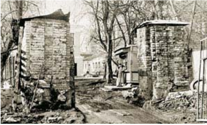
Вход в мой двор, вдалеке виден мой дом.