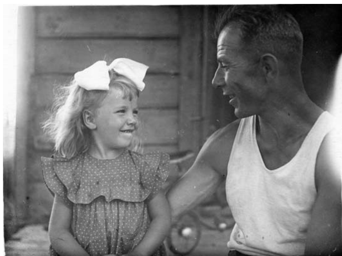
Мы с папой. Фотоаппарат на треноге фотографирует нас сам.

Иногда они с мамой ходили в театр, надо было ехать в центр города на трамвае. Вечером темнотища была жуткая, город, а тем более пригород, совсем не освещались. Мама надевала свое бархатное черное до пола платье, закалывала подол на талии булавками, чтобы не видно было из-под пальто, папа брал свой пистолет в маленькой кобуре из светлой кожи – после войны в городе было много бандитов, убивали и грабили. Женщины тогда носили ботики на кнопках. Очень удобно: надеваешь туфли, а сверху на них ботики, как калоши, но только гораздо красивее.