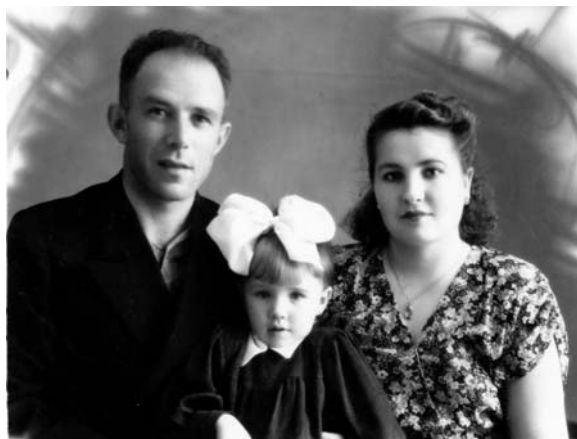
Папа, мама и я – дружная семья.

можденным условием, решить которую без знания специальных формул было невозможно, надо было выполнить много вычислений, но папочка решил, и решил правильно. Не спал всю ночь, считал. Дедушка был страшно доволен, что отдает свою дочь в руки достойного и умного человека. Они много спорили о политике, до крика, не уступая друг другу. Папа был очень ревнивым, ревновал маму к ее одноклассникам, одноклассникам, к соседям во дворе, особенно к Лешке Калошину. Так продолжалось всю нашу жизнь.