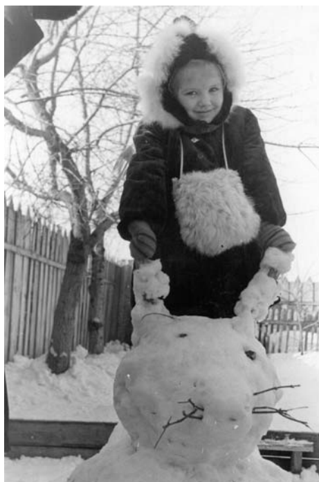
Я в детском саду. Кролик на капюшоне пока цел.

Платья мне шила бабушка, а вышивала мама. У меня были беленькие фартучки на ляпочках, расшитые вишенками и клубничками. Один фартучек, самый замечательный, помню очень хорошо. Это была кошка с мордочкой посередине, а лапками – ляпочками она меня обнимала. Все придумывала мама. Ночами она вышивала мелким-мелким крестиком необыкновенные картины, подушки и думочки (маленькие подушки) и даже украшала скатерти. Вышивала под керосинкой или настольной лампой, уперев одну сторону пальцев в край стола, а другую в свой желудок, что, наверное, было больно. Очень хотелось как-то украсить пусть не свое временное жилье, создать уют.