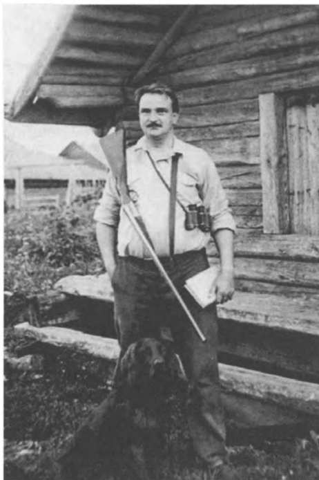
Как всегда в деревне — с ружьем, биноклем, книгой, бумагой для работы и... собакой. (1940 г.)

Надо писать историческую эпопею: Paul Scholberg . История моего современника. Сколько тут пройдет темных исторических картин — на заднем фоне моих скитаний с Шольбергом!