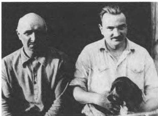
И. С. Соколов-Микитов и В. В. Бианки с Мартиком. (1940–1941 гг.)

Никаких офиц. заявлений насчет «вернутия» радио я подавать не хочу. Прошу тебя, справься только, законно ли у меня взяли аппарат и нельзя ли чего сделать? Тебе скоро придется отказаться от всех своих дел, чтобы выполнять мои поручения, — и ты меня возненавидишь.