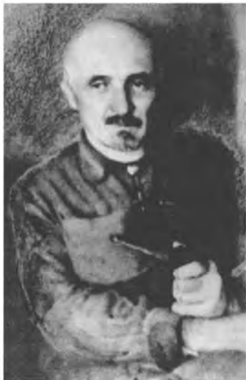
Иван Сергеевич Соколов-Микитов. (Конец 1940-х гг.)