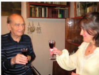
7 марта 2011 г. Отмечаю 80-летие с дочерью