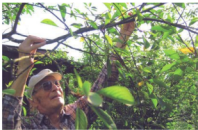
2008 г. Хлопкаты и работа дачника...