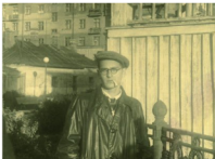
1949 г. Школа закончена с серебряной медалью, завтра — поступил на факультет МГУ