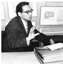
1960 г. На кафедре теории и практики журналистской печати; выборки «ключи» к новой дисциплине – теории журналистики