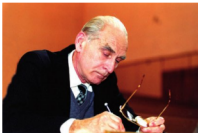
Вторая половина 2000-х гг. На одной из факультетских научных конференций