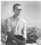
1959 г. Первый раз на Черном море — после защиты кандидатской диссертации