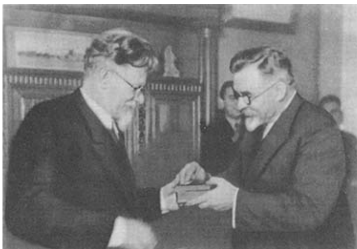
Г. И. Петровский вручает орден Ленина М. И. Калинин. 1935 г.