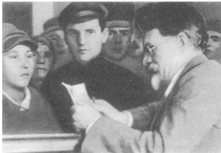
М. И. Калинин в своей приемной. 1926 г.