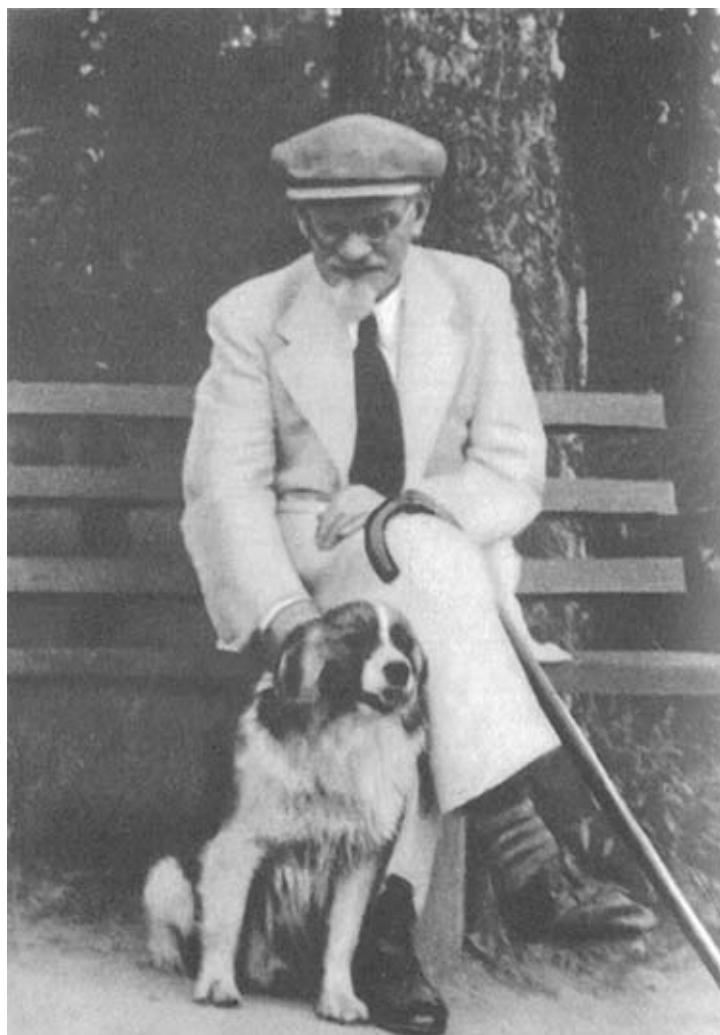
М. И. Калинин на даче в Мещерино во время прогулки.

Под лозунгом борьбы за выполнение решений XVII съезда партии, заданий второй пятилетки были проведены выборы в Советы в 1934–1935 годах. В обращении Центральный Исполнительный Комитет СССР призвал рабочих, колхозников, советскую интеллигенцию избрать такие Советы, которые были бы способны возглавить растущий энтузиазм и активность трудящихся, организовать их участие в борьбе за успешное выполнение второй пятилетки. [272] Большое внимание М. И. Калинин уделил тому, как Советы выполняют указы избирателей, в которых отражены забота трудящихся о строительстве социализма, их культурные и бытовые требования. «...Указы, — подчеркивал он, — задевают все стороны жизни, быта и потребностей трудящихся». [273] Поэтому их выполнение есть одна из важнейших государственных обязанностей Советов. Михаил Иванович предлагал «крепко карать» тех, кто обязан выполнять указы, но