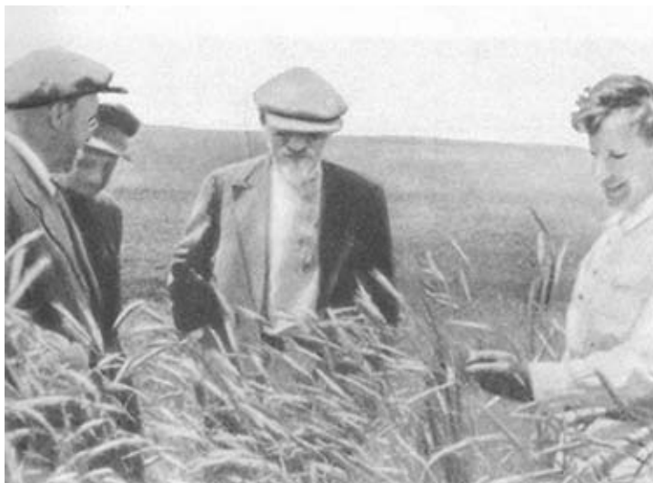
М. И. Калинин на поле одного из колхозов Воронежской области. 1936 г.