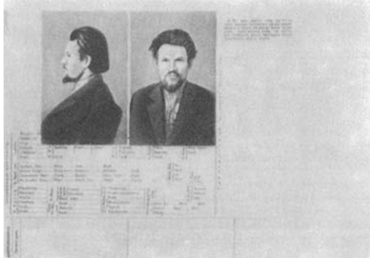
М. И. Калинин. 1903 г.