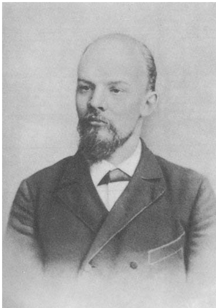
В. И. Ленин. 1897 г.