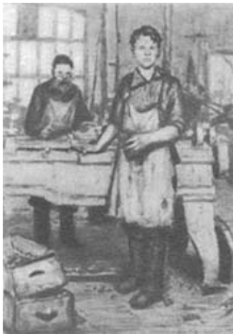
М. И. Калинин на заводе «Старый арсенал» (1893 г.). Художник Е. А. Косякова.