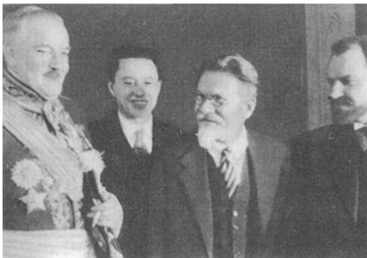
М. И. Калинин принимает посла Франции Альфана. 1933 г.