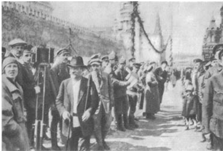
М. И. Калинин на Красной площади 1 мая 1922 г.