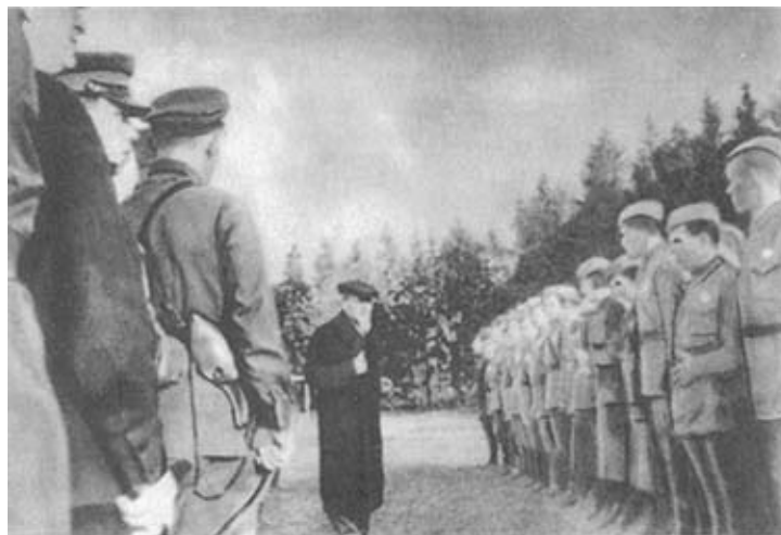
Выступление М. И. Калинина перед награжденными после вручения им правительственных наград. 33-я армия Западного фронта.