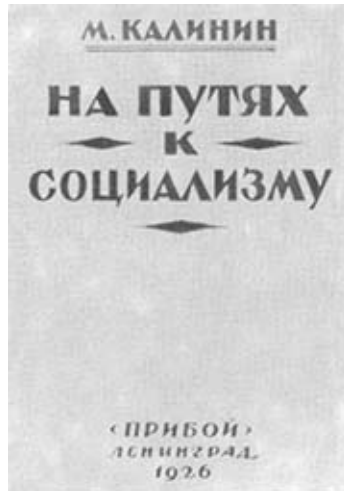
М. И. Калинин. На путях к социализму. 1926 г.