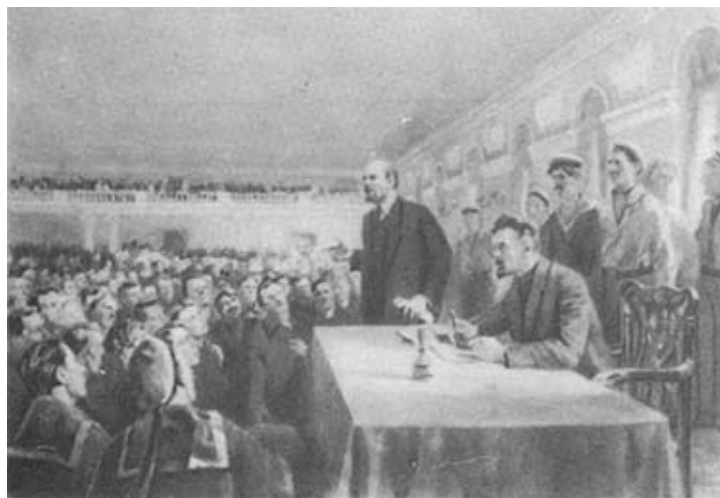
Выступление В. И. Ленина на Петроградском общегородском партийном собрании.