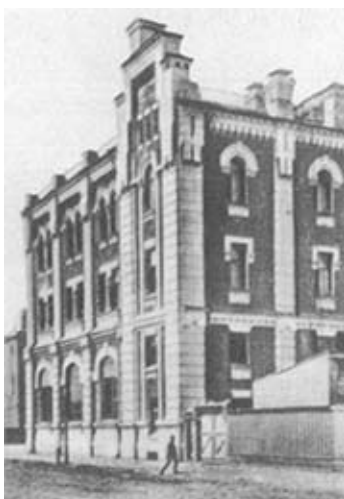
Миусская трамвайная подстанция в Москве, на которой М. И. Калинин работал монтером в 1910 г.