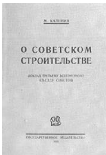
М. И. Калинин. О советском строительстве. 1925 г.