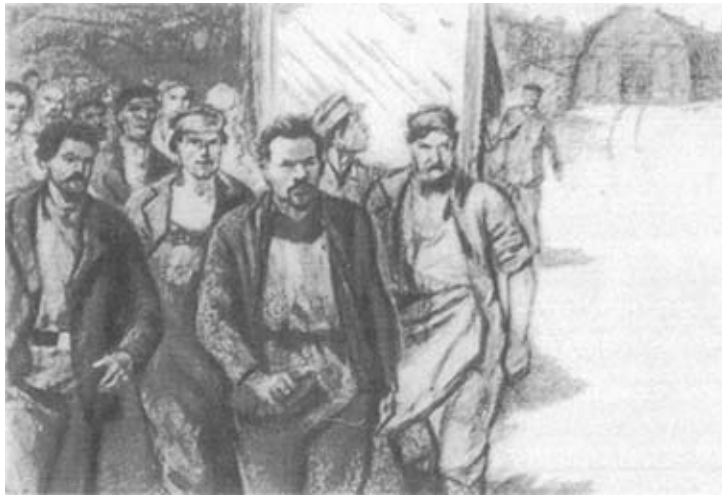
М. И. Калинин во главе стачки рабочих Путиловского завода. 1898 г. Художник А. И. Харшак.