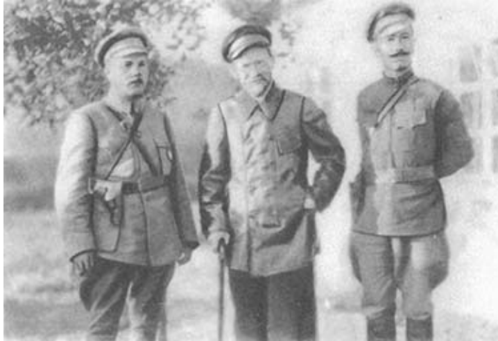
М. И. Калинин, С. М. Буденный, К. Е. Ворошилов. 1920 г.