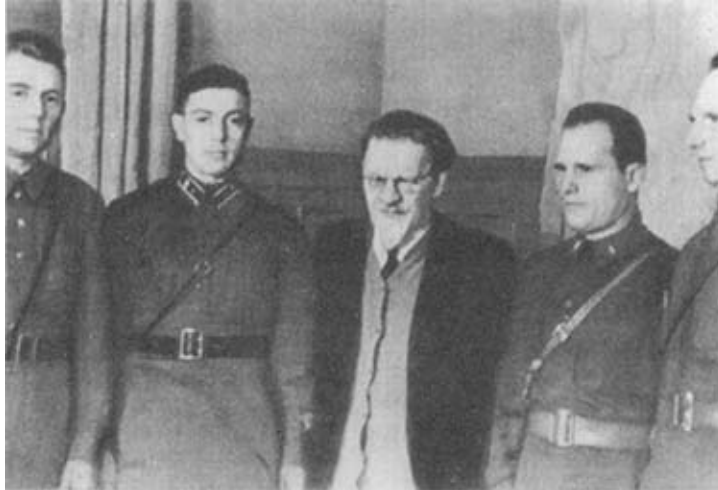
М. И. Калинин в группе пограничников. 1941 г.

На обсуждение многотысячных митингов большевики выносили самые острые вопросы — о власти, войне и мире, о земле, о борьбе с разрухой и голодом. Размах митинговой политической кампании был огромным. Так, только большевистская организация Выборгского района, которую Калинин представлял в ПК, в течение первых десяти дней марта провела около 100 митингов на заводах и в солдатских казармах.