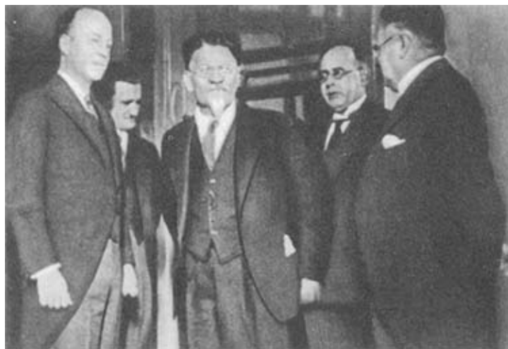
М. И. Калинин принимает посла США Вильяма Буллита. Москва, 1933 г.