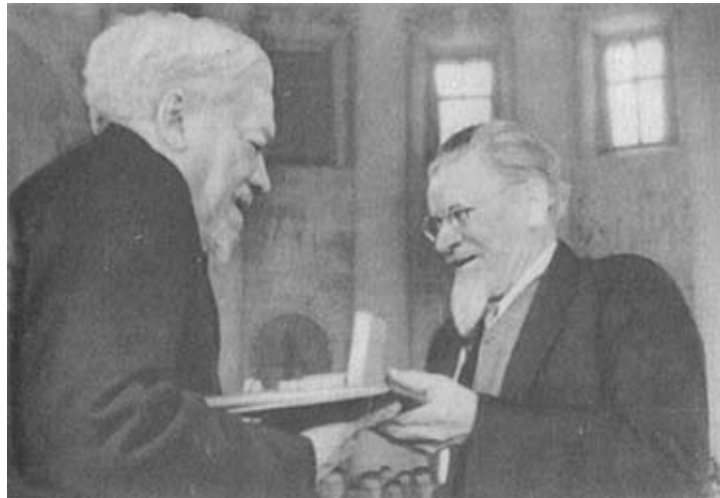
М. И. Калинин вручает орден Ленина, Золотую медаль «Серп и Молот» и грамоту Героя Социалистического Труда академику С. А. Чаплыгину. 1941 г.

Важнейшее задание партии было выполнено. Теперь можно было целиком отдаться организаторской работе по выполнению плана индустриализации.