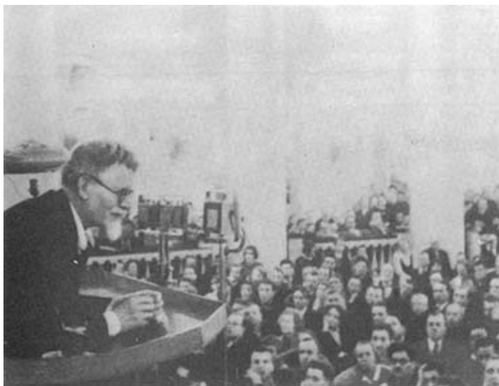
Выступление М. И. Калинина в Колонном зале Дома Союзов в день 25-летия «Правды». 1937 г.