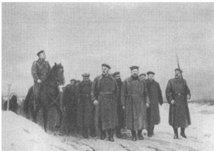
М. И. Калинин на этапе в Олонецкую ссылку. 1904 г. Художник А. Т. Даниличев.