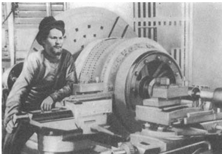
М. И. Калинин на заводе «Вольта» в Ревеле. 1903 г.

революционную деятельность в декабре 1900 г.