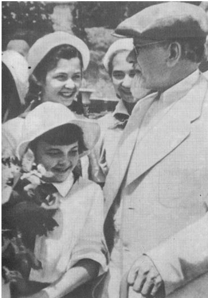
М. И. Калинин среди пионеров Артека. 1945 г.

В 1934–1935 годах с участием М. И. Калинина Президиум ВЦИК заслушал отчеты о работе 8 крупных горсоветов, 5 краевых исполкомов, 9 районных исполкомов, 7 сельских Советов. Всего было заслушано 52 «административно-территориальные единицы», начиная от сельсовета и кончая автономной республикой. Отчетам предшествовала проверка работы на местах, а решения Президиума ВЦИК, как отмечал Михаил Иванович, были приняты в строгом соответствии с потребностями той или иной области, района, сельсовета, с интересами государства, с задачами, которые решала страна. [271]