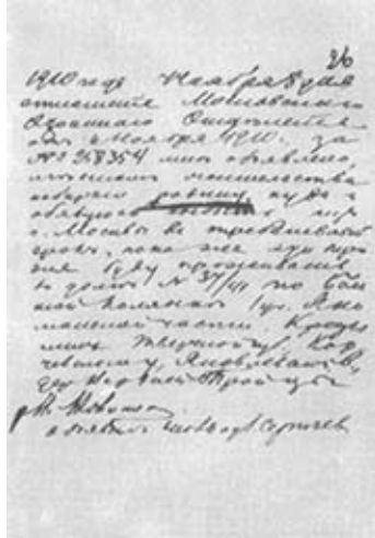
Документ, написанный рукой М. И. Калинина, об избрании им места жительства.