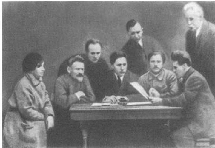
Члены инициативной группы по созданию первого легального Петербургского комитета РСДРП(б) в марте 1917 г. (фото 1922 г.).