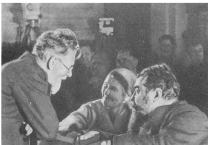
М. И. Калинин во время беседы с делегатами VII Всесоюзного съезда Советов. 1935 г.