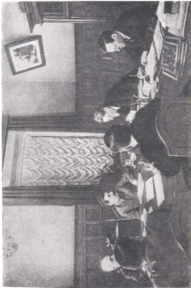
Заседание Президиума Верховного Совета СССР. Фотого.