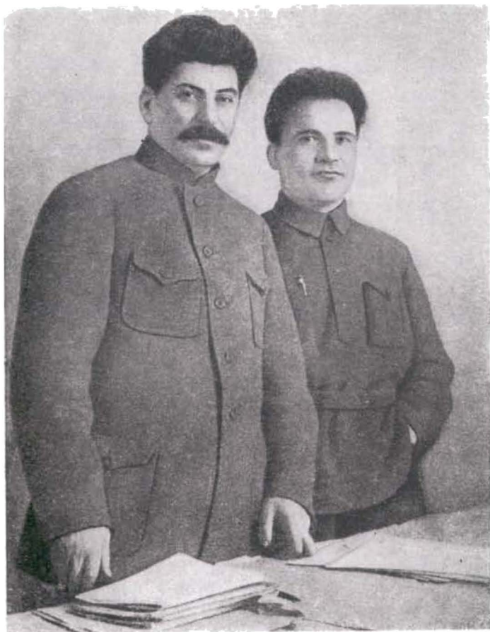
И. В. Сталин и С. М. Киров. Ленинград. 1926 г. Фото. .