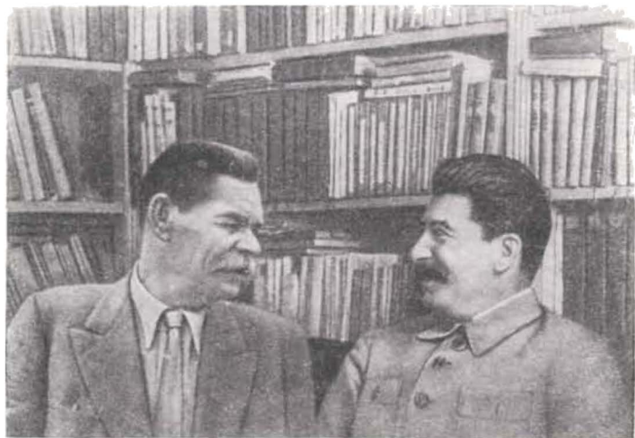
И. В. Сталин и А. М. Горький. Фото.