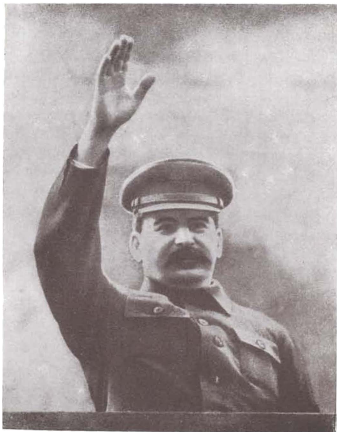
И. В. СТАЛИН. Фот.