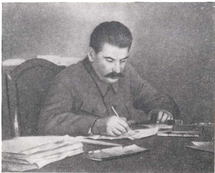
И. В. Сталин в рабочем кабинете. Фотого.