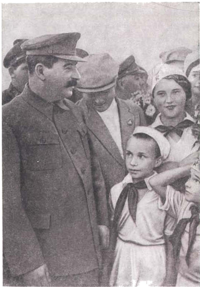
И. В. Сталин среди детей на Тушинском аэродроме. 1936 г. Фото.