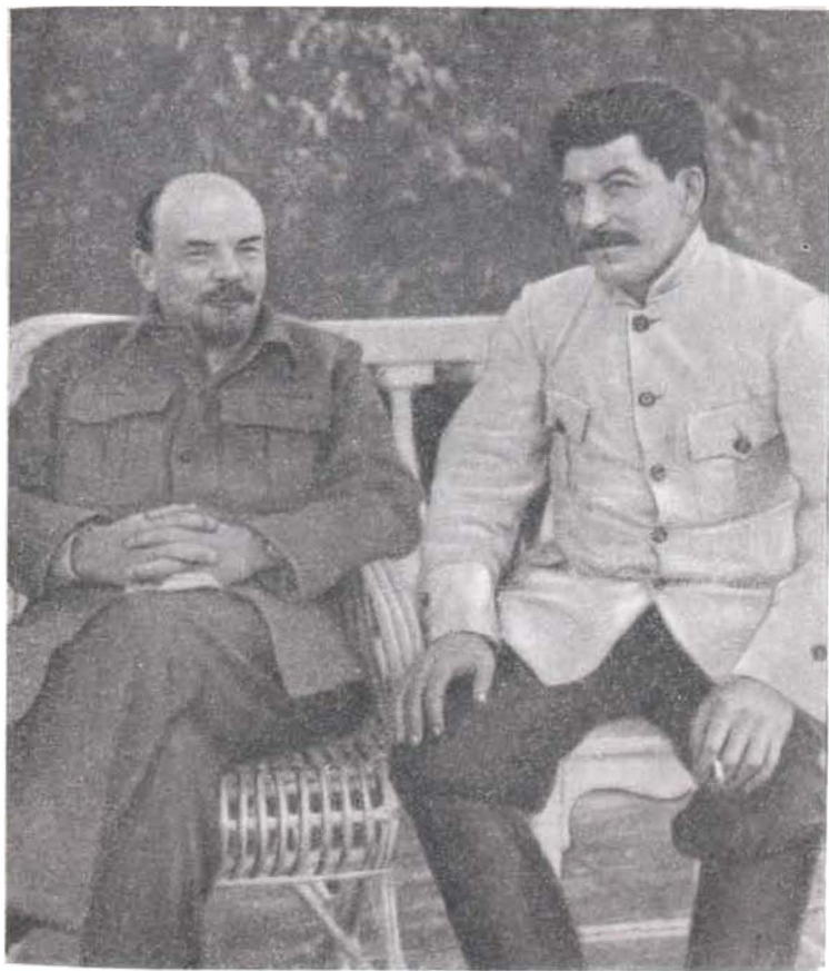
В. И. Ленин и И. В. Сталин в Горках. 1922 г. Фото.