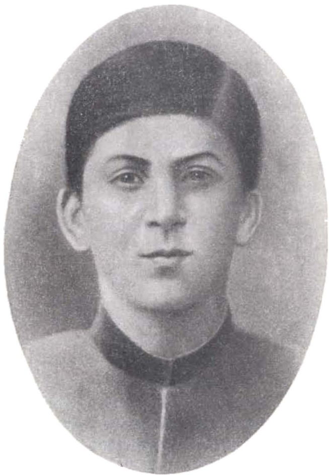
И. В. СТАЛИН.