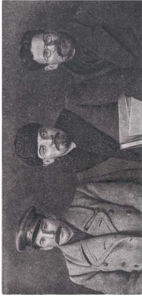
В. И. Ленин, И. В. Сталин и М. И. Калинин на VIII съезде РКП(б). Март 1919 г. Фото.