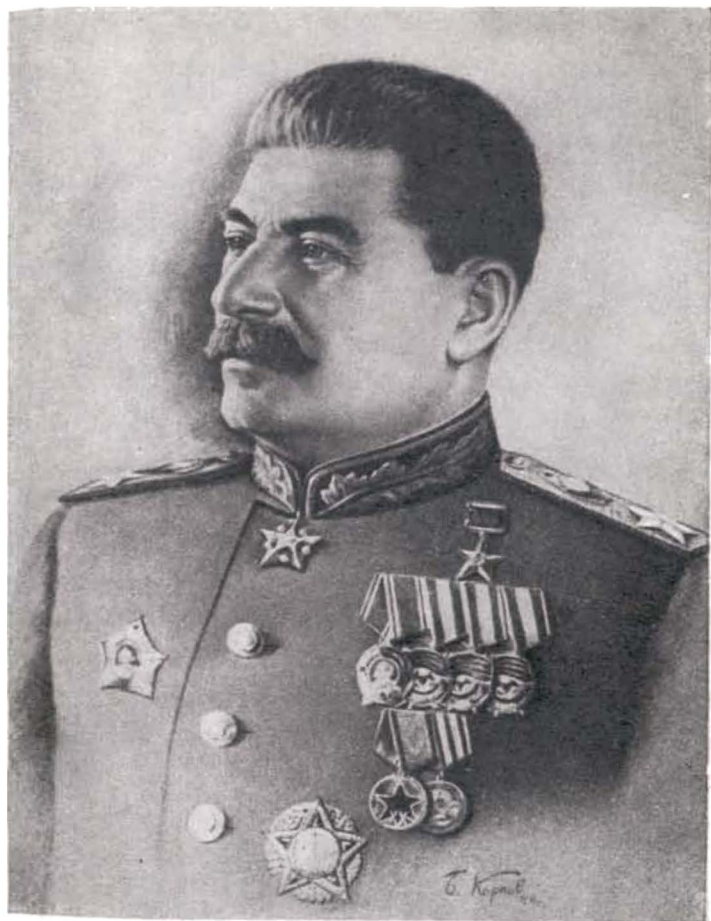
И. В. СТАЛИН. Рис. худ. Б. Карпова.