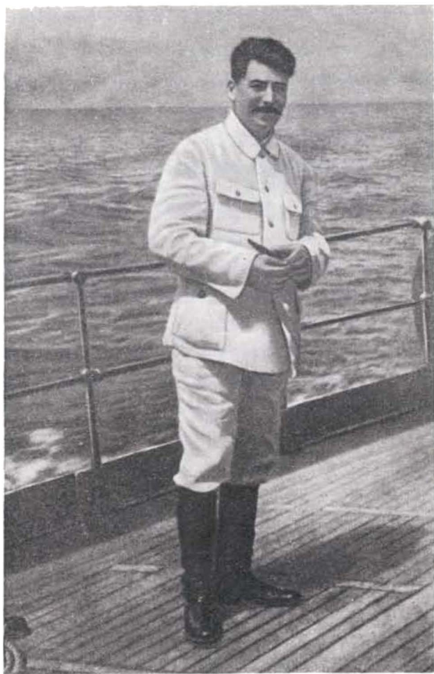
И. В. Сталин на палубе крейсера «Червона Украина» Черноморского флота. 25 июля 1929 г.