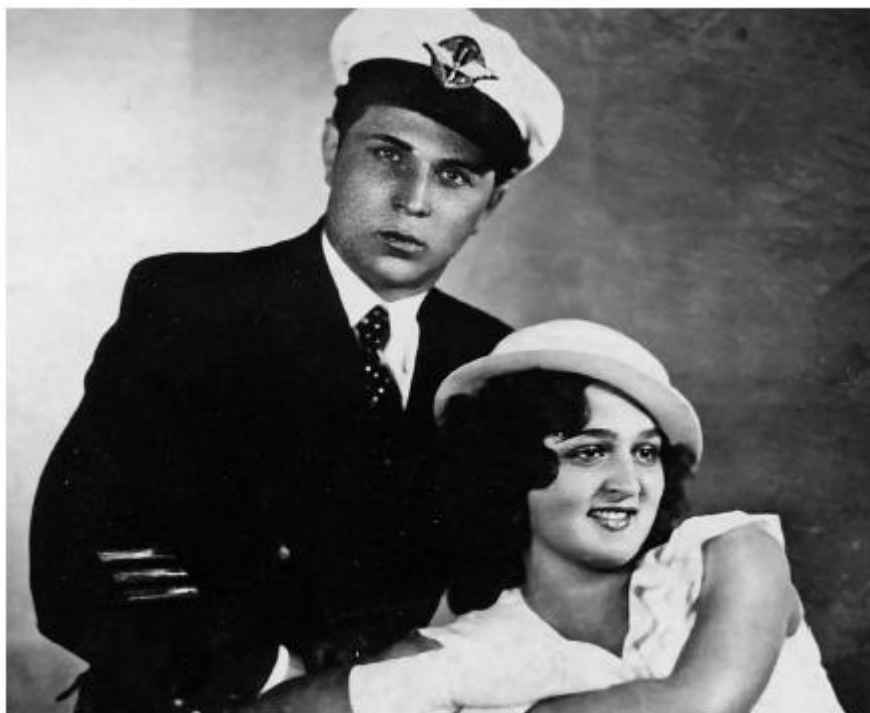
Счастливые молодожены. 1935 год

Убийство Кирова в Ленинграде открывает эпоху кровавых репрессий. Начались аресты. Отец, поляк по национальности, бросает четвертый курс академии, и они с мамой переезжают в Москву, наивно думая, что там отцу не грозит арест. Он продолжает учебу в МАТИ. Но когда в печально известном 1937 году родилась я, отцу пришлось бросить учебу и устроиться на работу в МАТИ снабженцем по материально-технической части, чтобы содержать семью. В 1938 году мама со мной, годовалой, поехала в Киев к своим родителям. Был июнь месяц. Отец провожал нас в ослепительно-белой форме гражданской авиации.