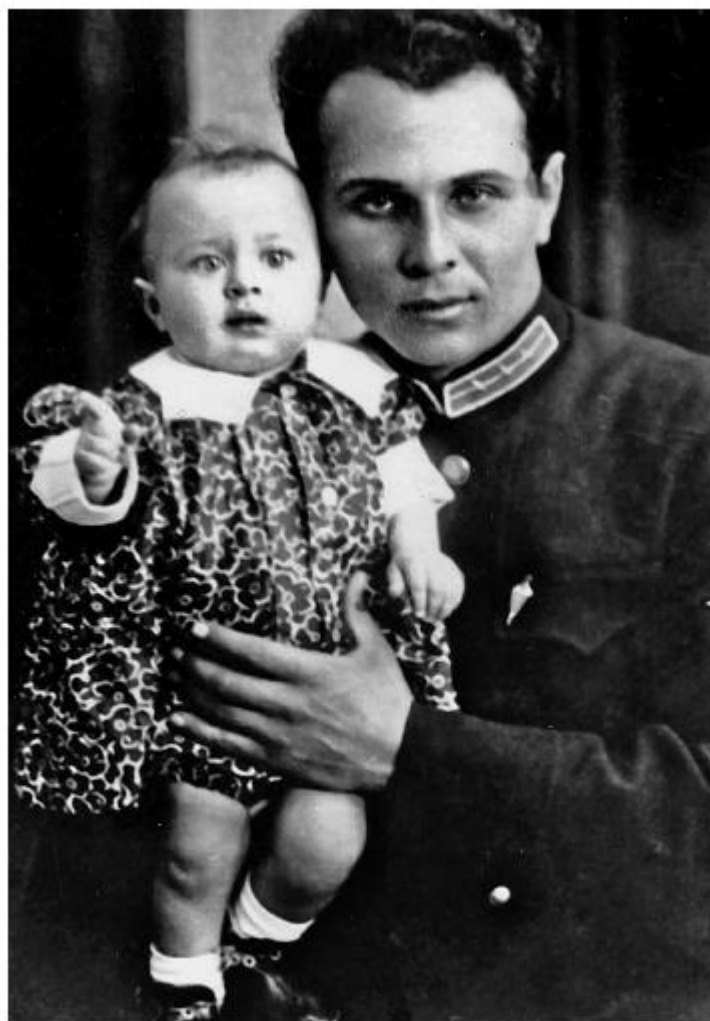
Папина любимица. 1937 год

Домой отец вернулся в ноябре. Некогда ослепительно-белая летняя форма гражданской авиации, в которой летом отец провожал нас с мамой в Киев, была серо-грязной и болталась на нем, как на вешалке. Он был очень худ. Глубоко запавшие глаза, отросшие длинные волосы и борода изменили его до неузнаваемости.