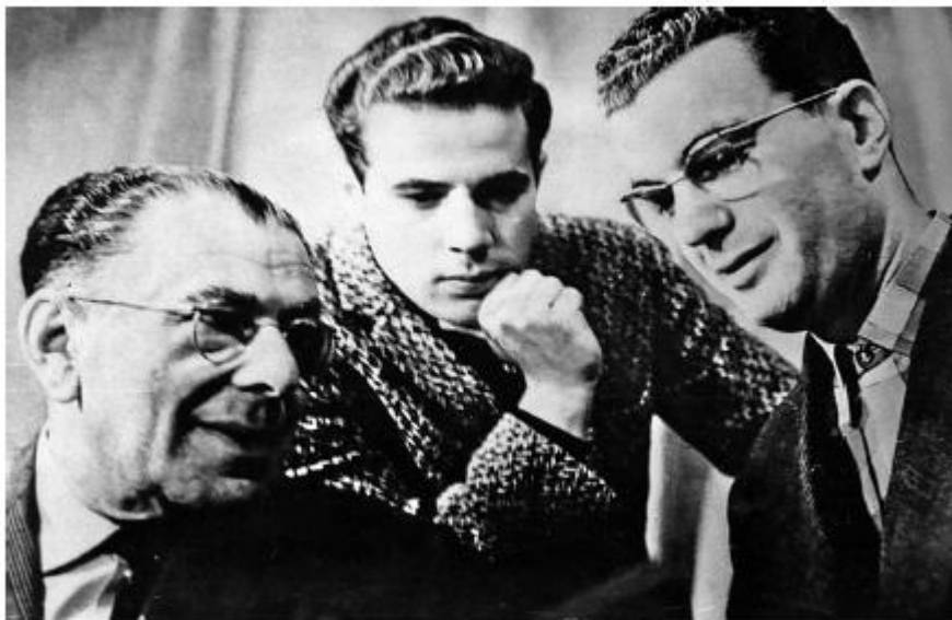
Э. Т. Кио с сыновьями. От братьев я узнала, что означают три загадочные буквы КИО. Днепропетровск, 1963 год

Мы проболтали еще до 6 утра. Тогда же я узнала, что значат эти три загадочные буквы — Кио.