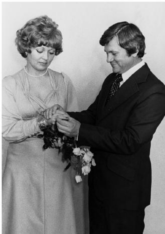
15 июля 1978 года мы с Людвигом вступили в законный брак. Мне — 39, ему — 42