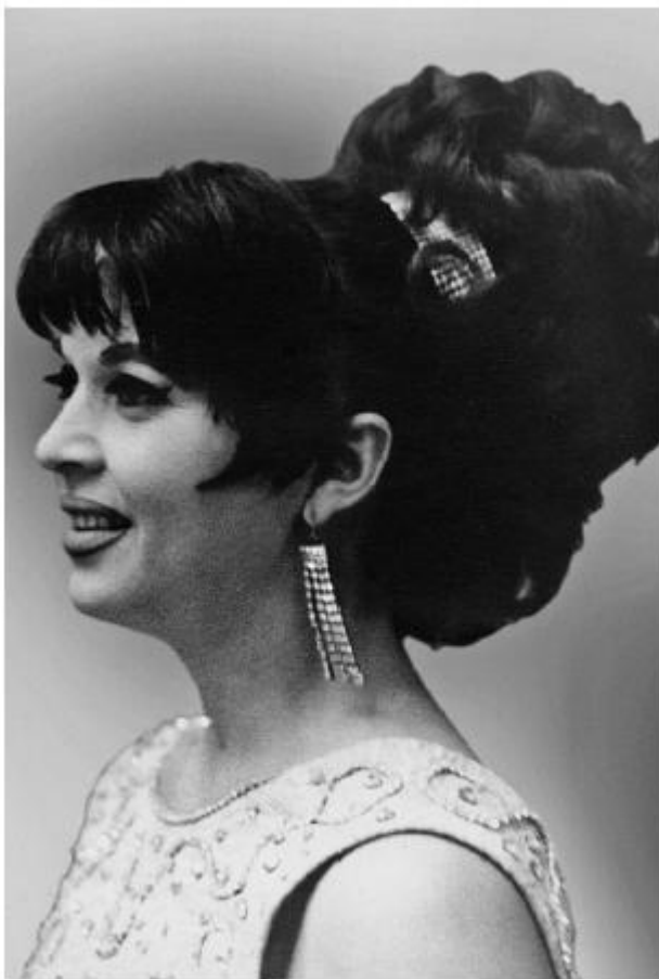
Цирк. 1966 год