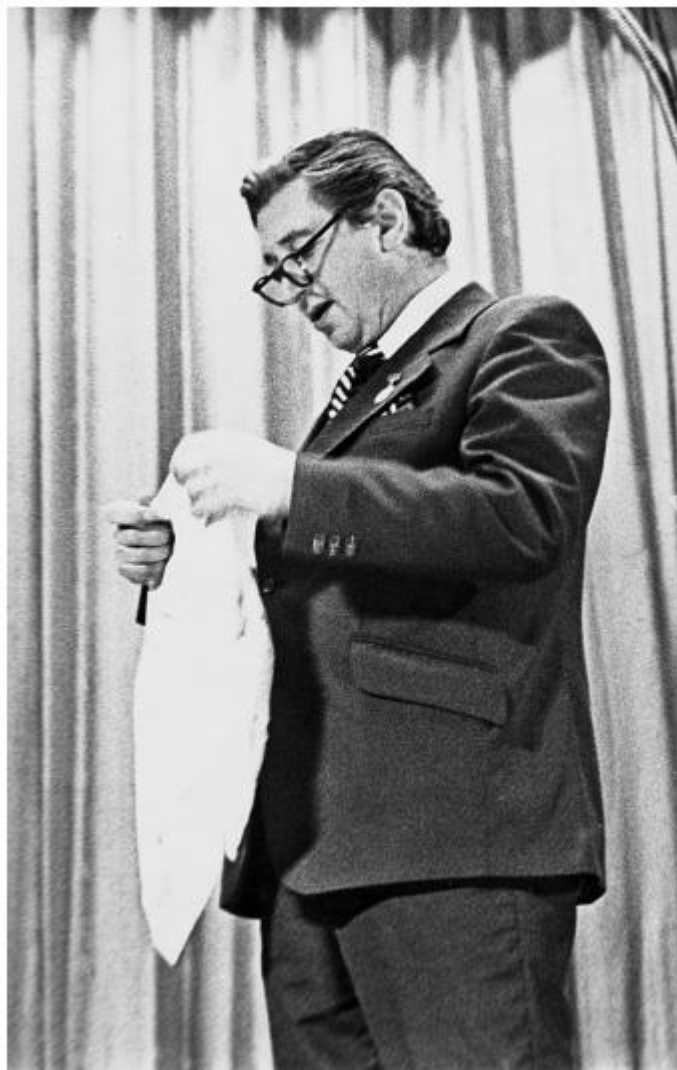
Борис читает монолог «Бабка на футболе». 1958 год

Так родился знаменитый дуэт Авдотьи Никитичны и Вероники Маврикиевны. Успех у них был феерический. Чтобы продлить общение с любимыми артистами, для них почти каждый раз после выступления накрывали столы. Нагрузка в работе была огромная, да плюс частые возлияния.