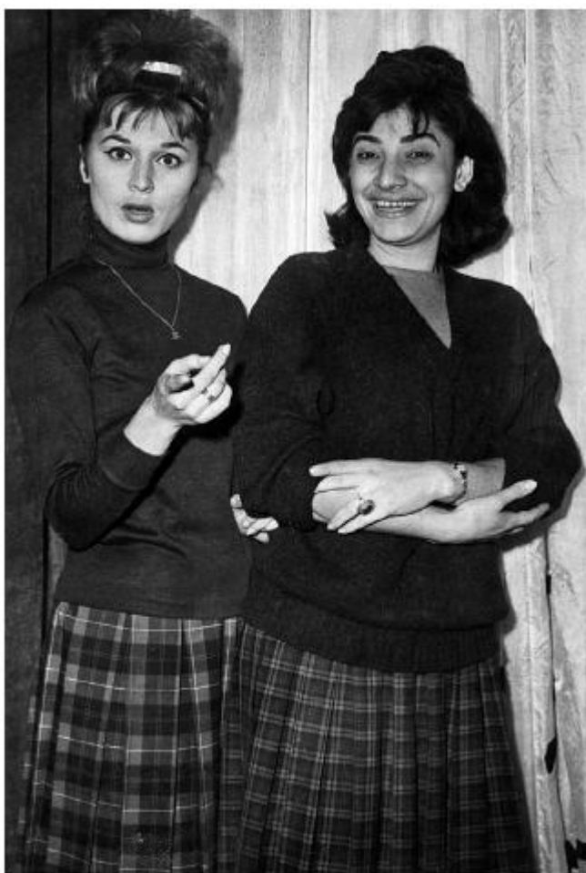
Я с Нани Брегвадзе. Франция, 1964 год