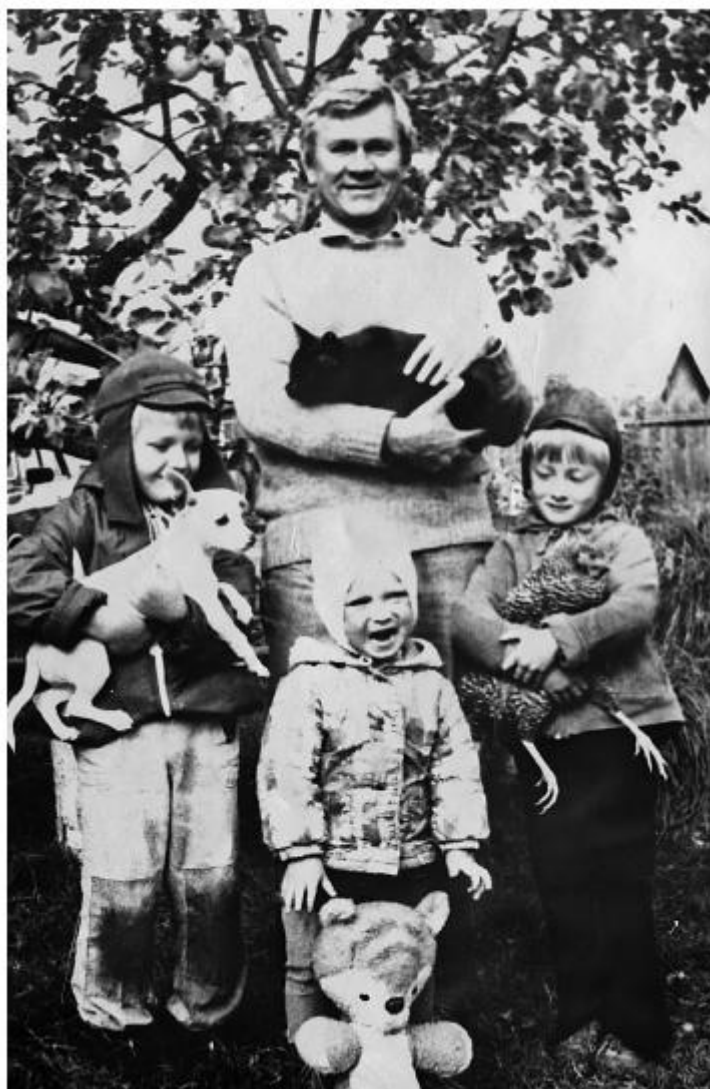
«Вот компания какая!» Деревня Бортнево, 1985 год

Однажды, по дороге на Лосиноостровский рынок, который тогда представлял собой несколько деревянных прилавков, на которых симпатичные азербайджанцы торговали дешевыми овощами (сейчас это хорошо укрепленный «плацдарм» для торговли всем, что только продается, со своей охраной и двухэтажными магазинами), я увидела на столбе объявление: «Клубу железнодорожников Лосиноостровского узла требуется руководитель драматического кружка». С моим дипломом ГИТИСа меня взяли на ставку 110 руб.