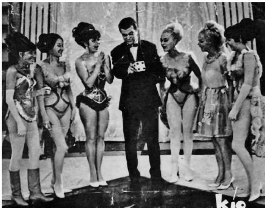
Эмиль Кио с ассистентками. Я — третья слева

Я начала поиски близнецов: ходила по домам, по дворам Киева, расклеивала объявления.