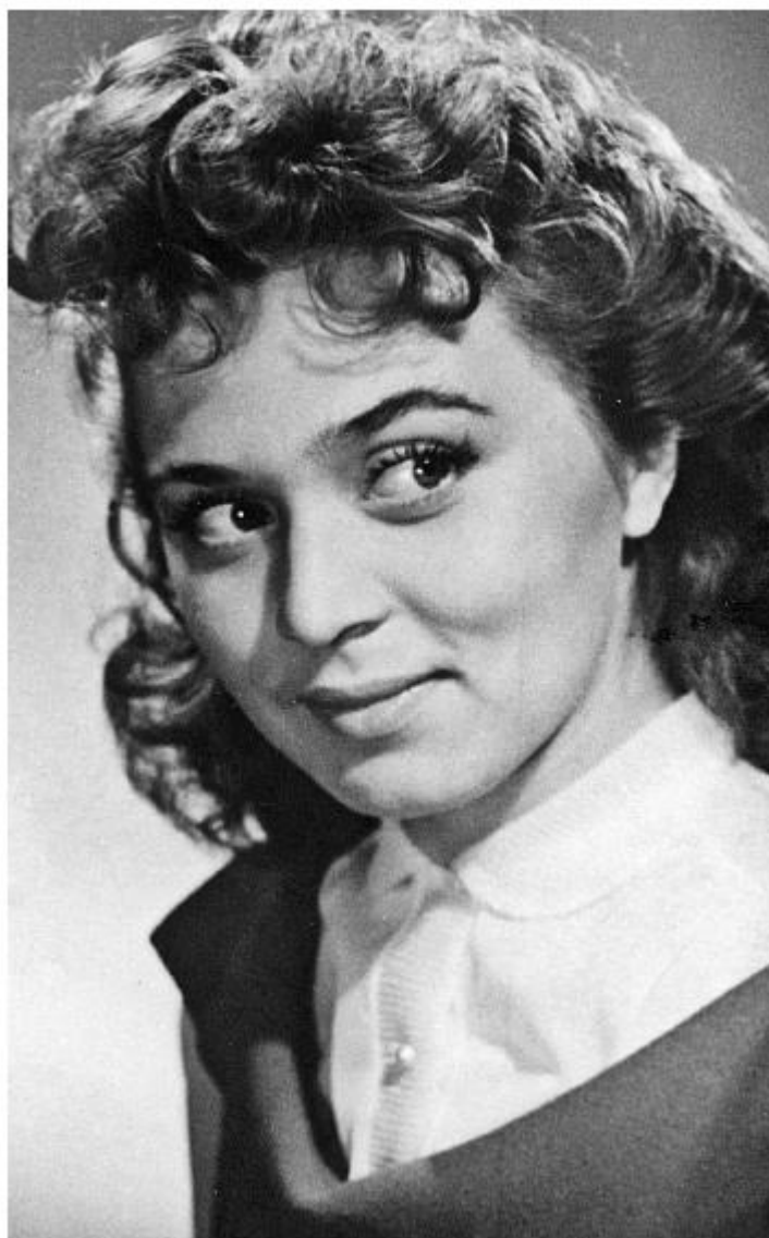
ГИТИС, 3 курс. 1958 год