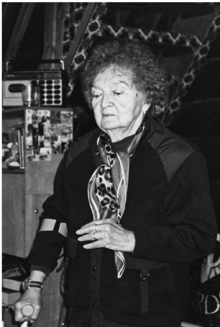
После смерти Вити мамочка сразу постарела

Мама пережила своего Витю на 6 лет. С потерей мамы, самого любимого в моей жизни человека, я ощутила себя сиротой. До сих пор не могу смириться с мыслью, что я больше никогда не услышу: «Доченька!» — и что мне больше никому будет сказать: «Мама!»