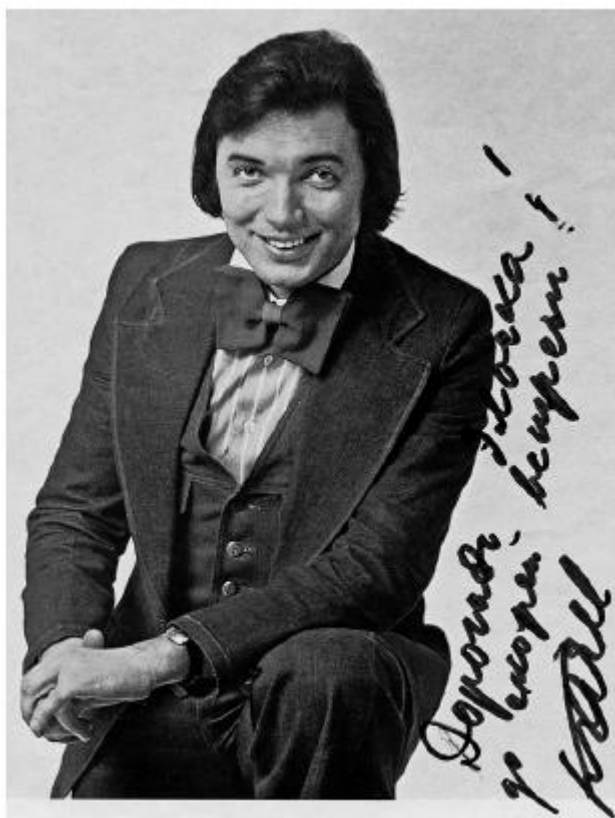
Автограф Карела Готта: «Дорогая Эллочка! До скорой встречи!»