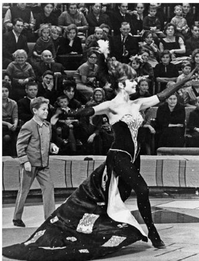
Я — ассистентка Кио. Ленинград, 1966 год