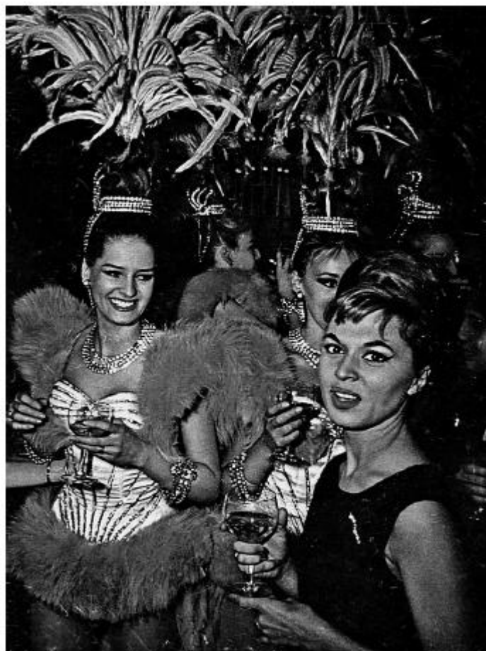
«Пари Матч»: «Э. Прохницкая — Натали в „Лидо“»