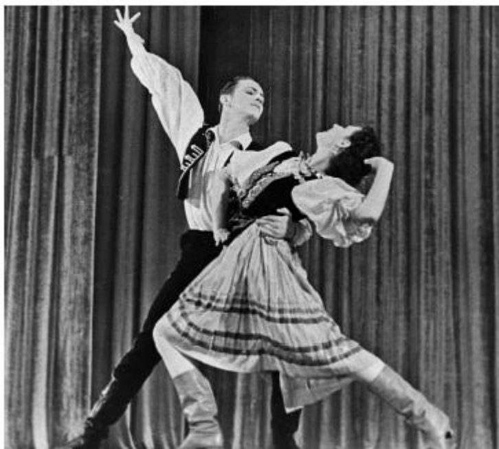
Марис Лиэпа и Марина Лукина. «Венгерский танец»

Изнуренные непосильным трудом, мы с нетерпением ждали летних каникул. У хореографического училища был свой пионерлагерь, недалеко от станции Новый Иерусалим на берегу реки Истры.