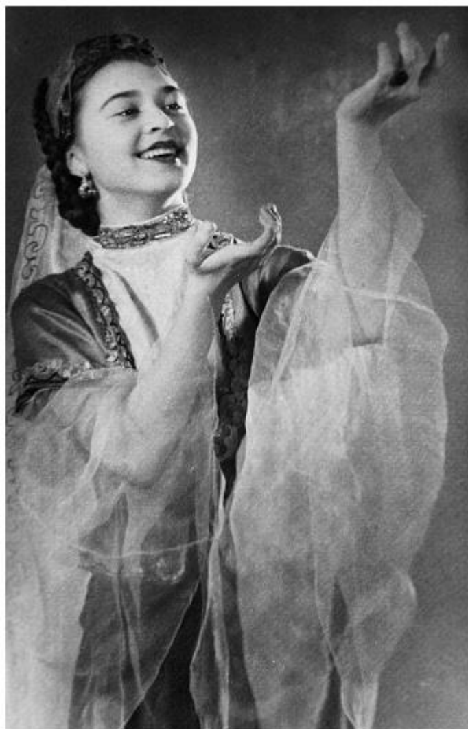
Азербайджанский танец в концерте хореографического училища. 1952-53 годы

В Большом театре мы были заняты не только в балетных спектаклях, но и в операх. Некоторые партии мы знали наизусть. В опере «Снегурочка» со мной случился позорный случай, за который я чуть было не вылетела из училища.