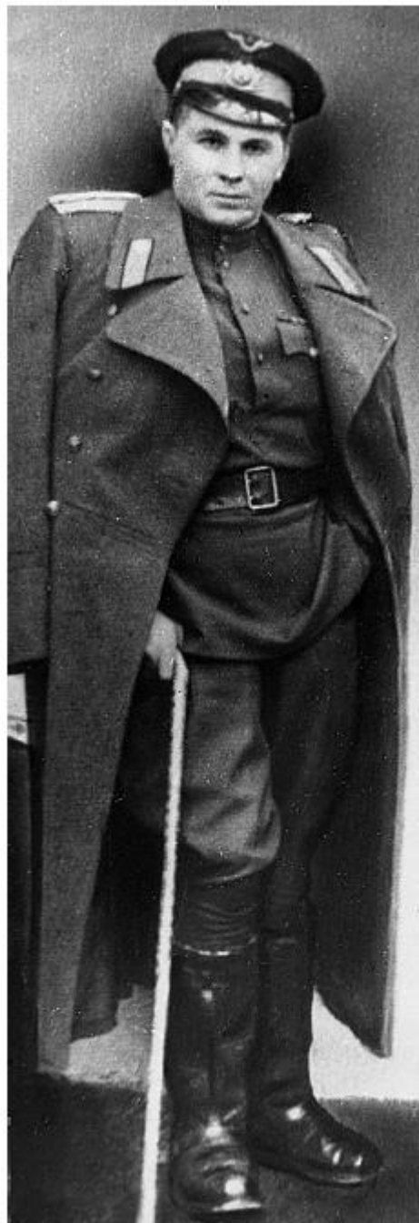
Таким папа вернулся с фронта. 1945 год

Нового Новодевичьего кладбища тогда не было. На старое кладбище, как и на территорию монастыря, вход был свободный.