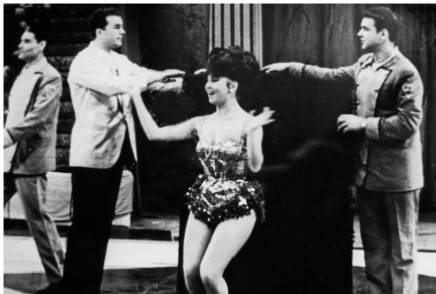
Я — ассистентка Кио

Последним моим участием в аттракционе Кио стали гастроли в Германии.