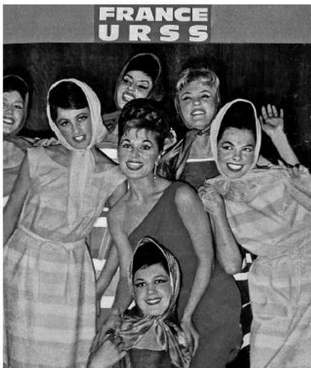
Я в окружении девушек из ансамбля «Радуга». Париж, 1964 год