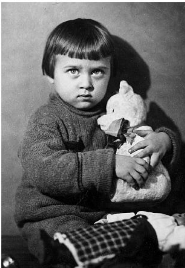
С детства я была очень серьезной. Мне 3 года