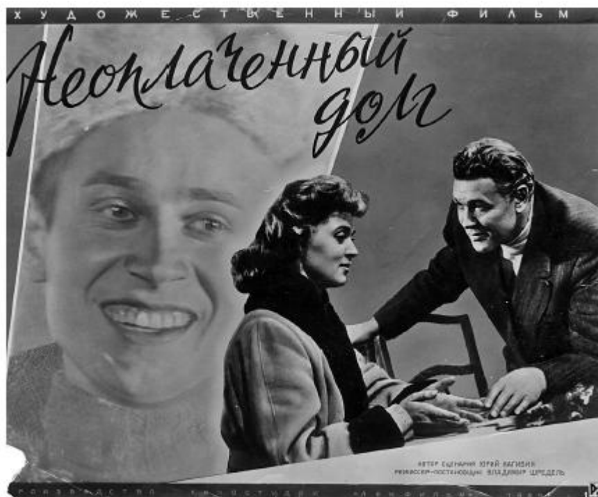
Афиша фильма «Неоплаченный долг»

Весною 1959 года, примерно в марте, меня утвердили на главную роль в кинофильме «Неоплаченный долг» по повести Юрия Нагибина «Слезай, приехали».