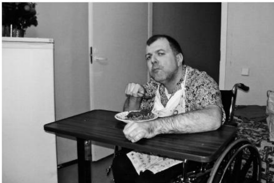
Эмильчик в пансионате