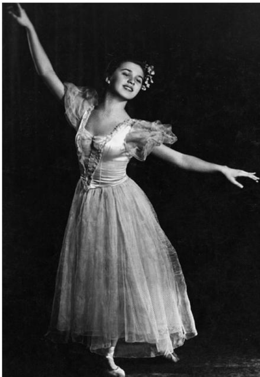
Хореографическое училище. Москва, 1953 год