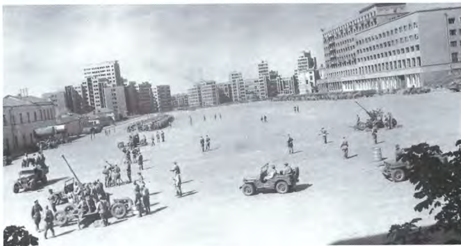
▲ Советские войска в освобожденном Харькове. Площадь Дзержинского. Август 1943 года