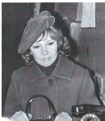
▲ Людмила Гурченко в роли Тамары в фильме «Пять вечеров», 1979 год