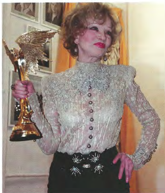
◀ Людмила Гурченко с наградой XXIII Национальной кинематографической премии «Ника» в почетной номинации «За честь и достоинство», 2010 год