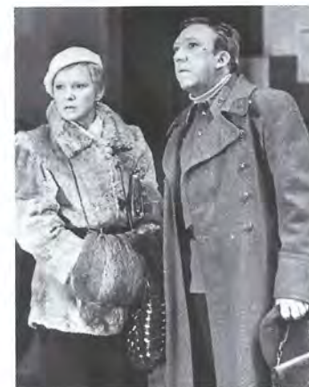
▲ В фильмах о войне Людмила Гурченко играла то, что некогда пережила сама. Кадр из картины «Двадцать дней без войны» с Юрием Никулиным

«Так-так-так», – говорит пулеметчик, «Так-так-так», – говорит пулемет.