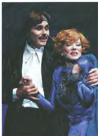
▼ Премьера первого московского мюзикла «Бюро счастья». Людмила Гурченко и Гедеминас Таранда – в главных ролях, 1998 год