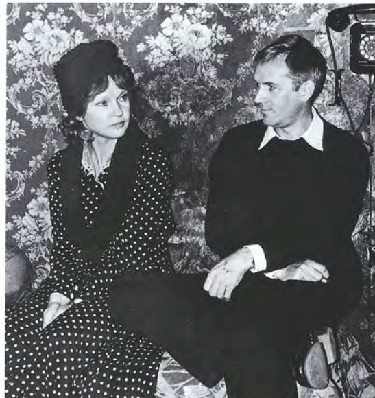
► Людмила Гурченко и Станислав Любшин на съемках фильма Никиты Михалкова «Пять вечеров», 1979 год

Как же намучилась Людмила Марковна, когда по возвращении тащила эту огромную статуэтку по ленинградскому аэропорту!.. В Москве самолет не смог совершить посадку: полосу не расчистили от снега. Борт развернули и отправили в Ленинград. Уставшие и вымотанные мужчины забыли о галантности – вот и пришлось заслуженной актрисе в одиночку нести тяжеленную награду по аэродрому. «Все сразу сели в общий вагон. Зазнаться было невозможно. Р-раз! По башке – и ты в строю», – вспоминала Гурченко.