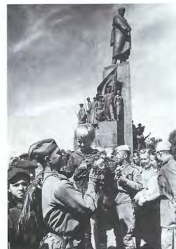
▲ Харьковчане приветствуют бойцов Красной армии, 1943 год. Пережив два тяжелых периода оккупации, измученные голодом, холодом и жестокостью захватчиков люди ликовали...