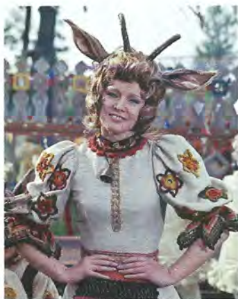
▲ Во время съемок в фильме «Мама» Гурченко получила серьезную травму ноги. Несмотря на тяжелый перелом и долгий реабилитационный период, актриса вышла на площадку с костылями – заканчивать съемки