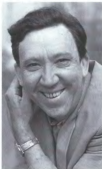
▲ Юрий Владимирович был лучшим другом Гурченко. Об их отношениях она вспоминала: «Таких друзей у меня больше не было»