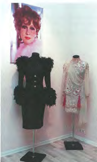
▲ Наряды Людмилы Гурченко на выставке в галерее «Дом Нащокина», 2011 год

ститута с аккордеоном, в ярко-зеленом платье из китайского шелка. Красный бант – на груди. Красный бант – на поясе. Завитые мелкими колечками волосы. А на ногах – единственные в мире красные туфли в стиле мушкетеров времен кардинала Ришелье...». Входит девушка из Харькова в аудиторию, а там великие мастера: Сергей Герасимов, «Молодую гвардию» которого все обожали, Тамара Макарова, фильмы с которой Людмила Марковна знала практически наизусть... И в другом конце стола – те самые две женщины из Щукинского училища, которые шептались во время ее выступления. Взглянув на Гурченко с иронией, они шепнули что-то Сергею Герасимову. В глазах мэтра сверкнул огонек, он стал задавать вопросы, явно желая послушать говор абитуриентки. В ответ на ее «шо» послышался легкий хохоток. Как оказалось позже, это были преподавательницы по речи. Тогда еще Гурченко не знала, что харьков-