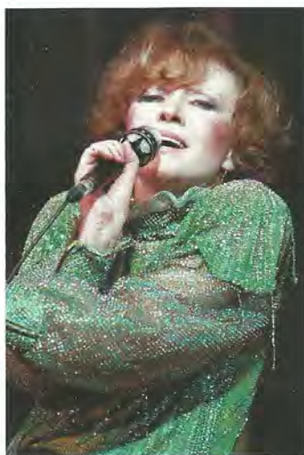
▲ Музыка всегда была частью жизни Людмилы Марковны. В долгие годы почти полного отсутствия ролей в кино она принимала участие в музыкальных выступлениях, а затем начала сама писать песни

Были роли в кино, неприметные, – о некоторых из них сама Гурченко позже жалела, называя их, в соответствии с едким выражением