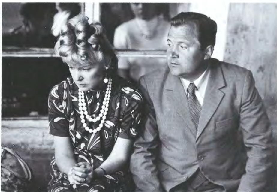
▲ Виктор Павлов и Людмила Гурченко в фильме «Уходя – уходи», 1980 год

мемуаров Вивьен Ли и Марлен Дитрих. Всё равно на Западе ее бы не поняли: как звезда может жить на съемной квартире, да еще и быть безработной после фильма, собравшего многомиллионную аудиторию?..