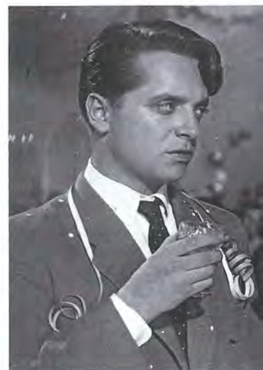
▲ Кадр из художественного фильма «Карнавальная ночь». В роли Леночки Крыловой – Людмила Гурченко, в роли Гриши Кольцова – Юрий Белов. Репродукция, 1956 год

Однажды во время съемок «Девушки с гитарой» Людмилу Марковну вызвали в редакцию популярной газеты. Там необыкновенно милый редактор слегка пожурил ее за «левые» концерты и рассказал о ловкачах-администраторах, которые на имени известных актеров делают незаконные деньги. Молодой харьковской девушке стало очень стыдно, она пообещала, что больше такого не повторится. Однако на этом история не закончилась. Всё тот же редактор вскоре написал фельетон – об артистах эстрады и голубых конвертах. Центром его повествования стала «самая молодая актриса, еще студентка, но уже...». В нескольких крупных газетах СССР были напечатаны статьи. В них говорилось о том, что многие молодые артисты не чураются участвовать в так называемых «левых» концертах. В статьях то и дело встречалось упоминание Людмилы Гурченко... Это сегодня подобные публикации могли бы стать лишь дополнительной рекламой, а тогда они были