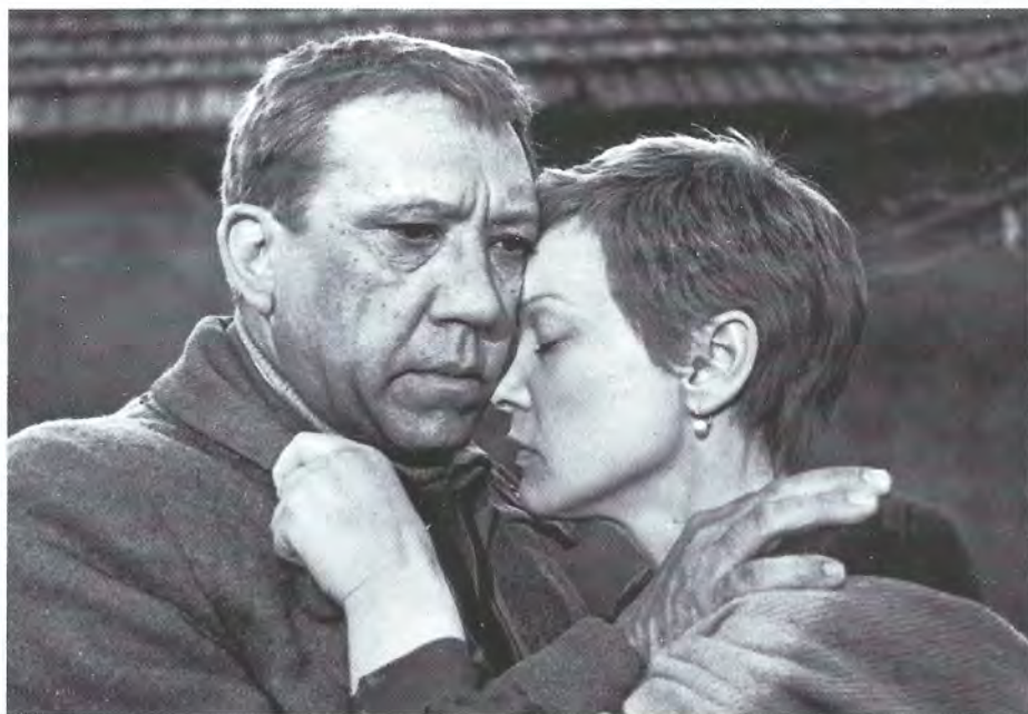
▼ В фильме «Двадцать дней без войны» Юрий Никулин и Людмила Гурченко сыграли влюбленных. Романа между актерами не было, зато было полное взаимопонимание и искренняя дружба. 1976 год

Познакомились они во время съемок фильма «Двадцать дней без войны». Никулин всячески поддерживал Гурченко во время съемок, тем более что отношения между актрисой и ре-