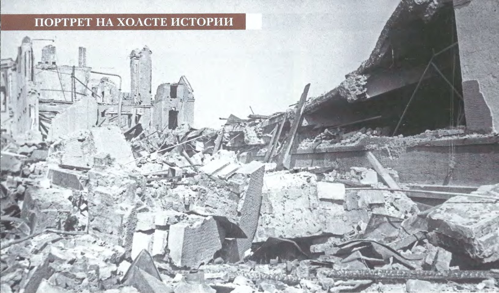
▲ После бомбежек многие здания были разрушены. Руины тракторного завода в Харькове. Фотография 1943 года