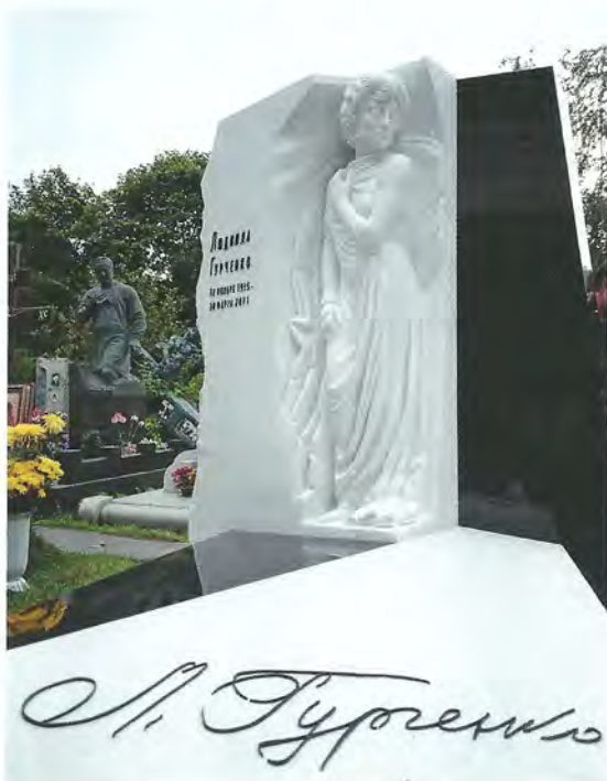
► Памятник народной артистке России Людмиле Гурченко на Новодевичьем кладбище в Москве