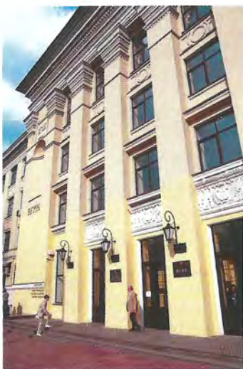
▲ Людмила Гурченко была безумно счастлива, поступив во ВГИК, о чем незамедлительно сообщила родителям в телеграмме. Современный вид Всесоюзного государственного института кинематографии, Москва