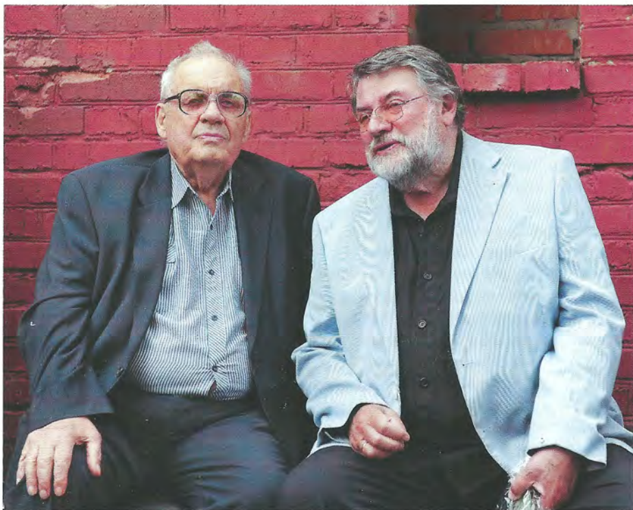
▲ Режиссер Эльдар Рязанов (слева) и актер Александр Ширвиндт на церемонии открытия памятника Людмиле Гурченко на Новодевичьем кладбище в Москве, 2012 год