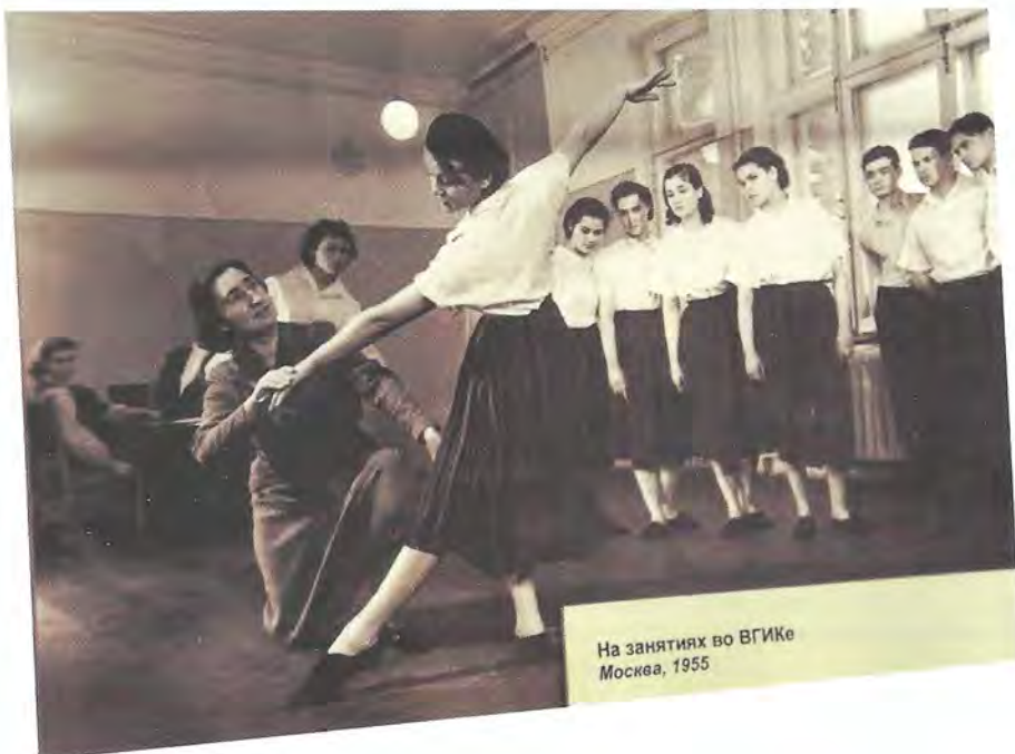
На занятиях во ВГИКе Москва, 1955