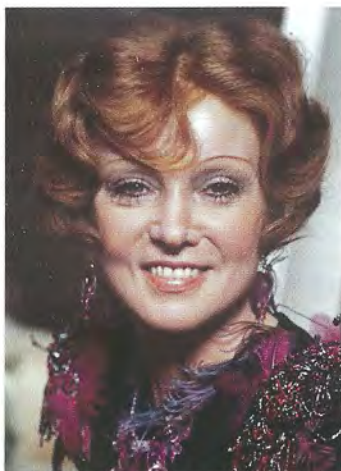
▲ Людмила Марковна Гурченко в фильме «Рецепт ее молодости». До самых последних лет актриса славилась своей поистине неувядающей красотой и элегантностью

«Так устаешь от сегодняшнего рационализма... Тебе улыбаются, а ты не знаешь, что у человека на душе».