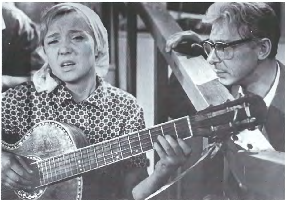
▲ Артисты Людмила Гурченко и Олег Ефремов в художественном фильме «Строится мост», 1966 год