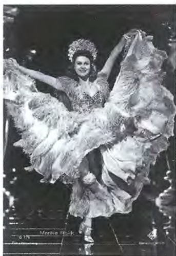
▲ Немецкая актриса Марики Рёкк очень полюбила маленькую Люсю. Ее песню из фильма «Девушка моей мечты» она исполнила перед немцами