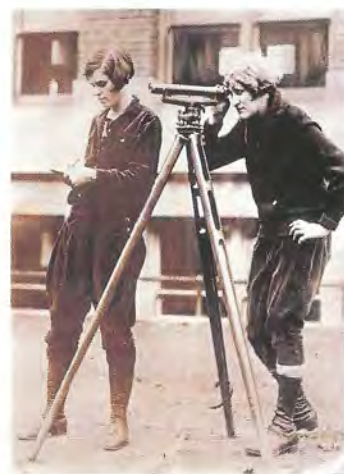
▲ 1920-е годы – эпоха, когда женщины стали бороться за свои права, носить те вещи, в которых удобно, и работать там, где нравится. Вивьен Ли при этом оставалась верна классическому идеалу женственности