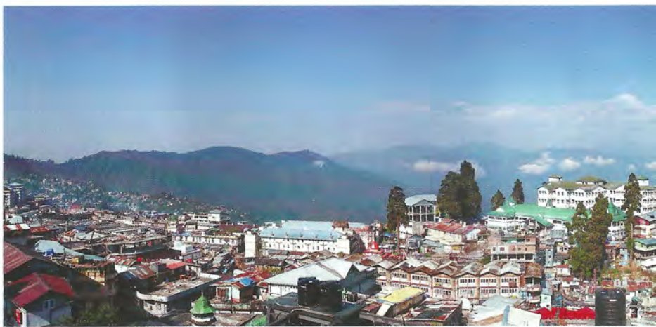
▲ Будущая звезда Вивьен Ли родилась в одном из живописнейших мест нашей планеты. Панорама Дарджилинга, Гималаи

Правильное питание, хороший климат и атмосфера любви в доме помогли Вивиан расти подвижным и проворным ре-