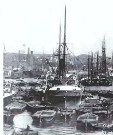
▲ Лондон в 1920-е годы. Первая мировая окончена, жизнь в городе бурлит, словно предвидя все ужасы следующей войны, еще более страшной