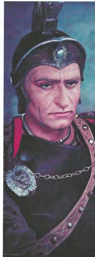
▼ «Цезарь и Клеопатра». После этой постановки Вивьен была признана «лучшей Клеопатрой всех времен». В роли Цезаря, разумеется, Лоуренс Оливье

С исполнителем главной роли Марлоном Брандо Вивьен поначалу была сдержанна, но чуть позже они сдружились и стали восхищаться друг другом, хоть и осознавали, насколько они разные.