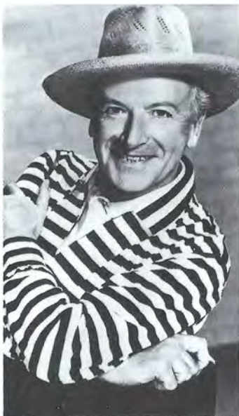
▲ Сесил Битон, дизайнер и фотограф, работавший со многими знаменитостями прошлых лет. Среди его фотографий можно отыскать снимки королевской семьи, Мэрилин Монро, Одри Хэпберн и многих других выдающихся личностей

Внешность Вивьен всегда была ее сильной стороной. Ангус Макбин, фотограф, как-то сказал: «Она была самой красивой женщиной, которую я когда-либо фотографировал. И оставалась таковой до своей самой последней фотосессии, снятой незадолго до ее кончины в 1967 году. Конечно, я могу быть предвзятым, ведь я был более чем влюблен в нее».