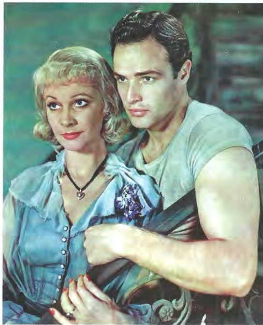
◀ Вивьен Ли и Марлон Брандо в фильме «Трамвай “Желание”». Актеры относились друг к другу с большим уважением, хотя в начале знакомства слегка побаивались даже заговорить. 1951 год

В работе над фильмом Вивьен была очень осторожна, так как никогда раньше не работала с Элиа Казаном. В результате переговоров о будущем образе Бланш режиссер и актриса никак не могли прийти к общему мнению. Ли