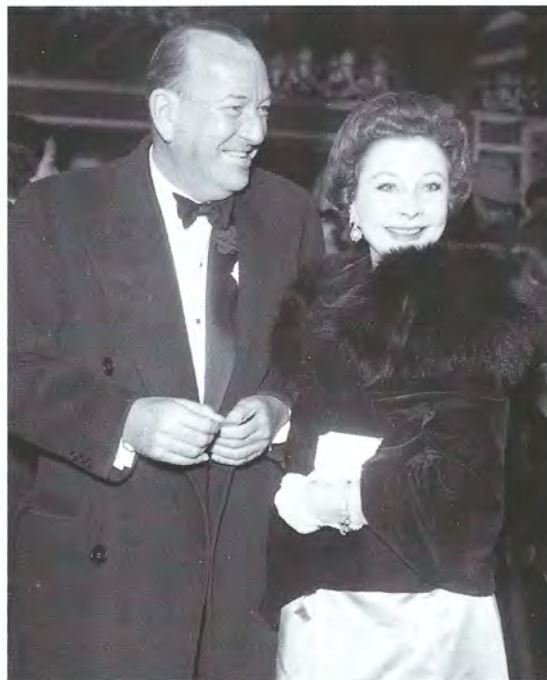
► Актриса Вивьен Ли и Ноэл Коуард во время празднования его 59-летия в 1958 году. Он всегда утверждал, что Вивьен обладает поистине тонким умом

Ноэл Коуард, будучи другом Вивьен, восхищался: «Она блистала в компании, а ум ее был остр... Она удивительно владела словом, а ее эмоциональную силу можно было сравнить лишь с землетрясением». Известный актер Рекс Харрисон так вспоминал о дружеских беседах с Вивьен: «Все ее разговоры были только о Ларри, и, глядя на ее красивое, полное обожания лицо, я слушал ее. Я любил Вивьен. Мы только держались за руки и никогда между нами не было ничего большего, но я не могу сказать, что моя любовь к Вивьен была плато-