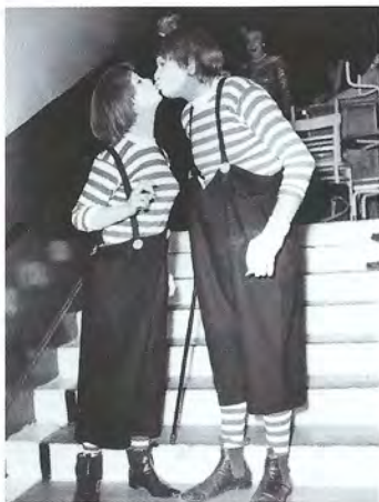
▲ Она была разносторонней личностью, которой одинаково успешно давались любые роли. Вивьен Ли (слева) и Лоуренс Оливье в театре «Палладиум» в перерыве между спектаклями

► Вивьен не могла жить без работы в театре. Он приносил ей настоящее счастье. И публика воздавала актрисе сполна. Оперный театр Манчестера, примерная Вивьен Ли. Сентябрь 1953 года