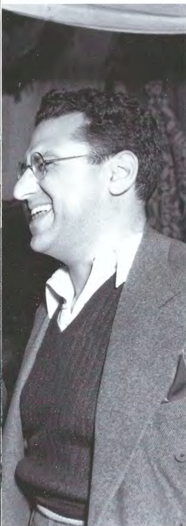
► Вивьен Ли и Рекс Харрисон в фильме «Буря в стакане воды». 1937 год. Актер не понаслышке знал об истинных чувствах Вивьен к Лоуренсу Оливье

И я полагаю, это и была та обратная сторона ее маниакально-депрессивной монеты.... Она была очень образованным человеком. Она говорила на четырех языках и она говорила очень умные вещи, не только в своих интервью».