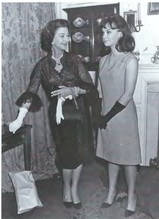
◀ Вивьен Ли, с неизменной сигаретой и в перчатках, и Никола Пагетт на вечере в честь празднования возвращения Вивьен в театр Вест Энда после шестилетнего перерыва. Лондон, 3 февраля 1965 года

не могла спокойно наблюдать, как задуманное чиновниками претворяют в жизнь. Вивьен устроила небольшую демонстрацию с транспарантами. Муж отказался участвовать в этом мероприятии, а прохожие не обратили никакого внимания на женщину, призывающую спасти театр.