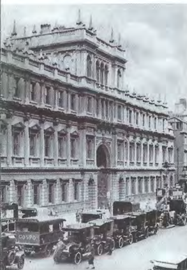
▼ Королевская академия драматического искусства была для юной Вивиан священным местом. Учеба здесь – ключ к новой жизни, к успеху и славе. Фото 1926–1927 годов