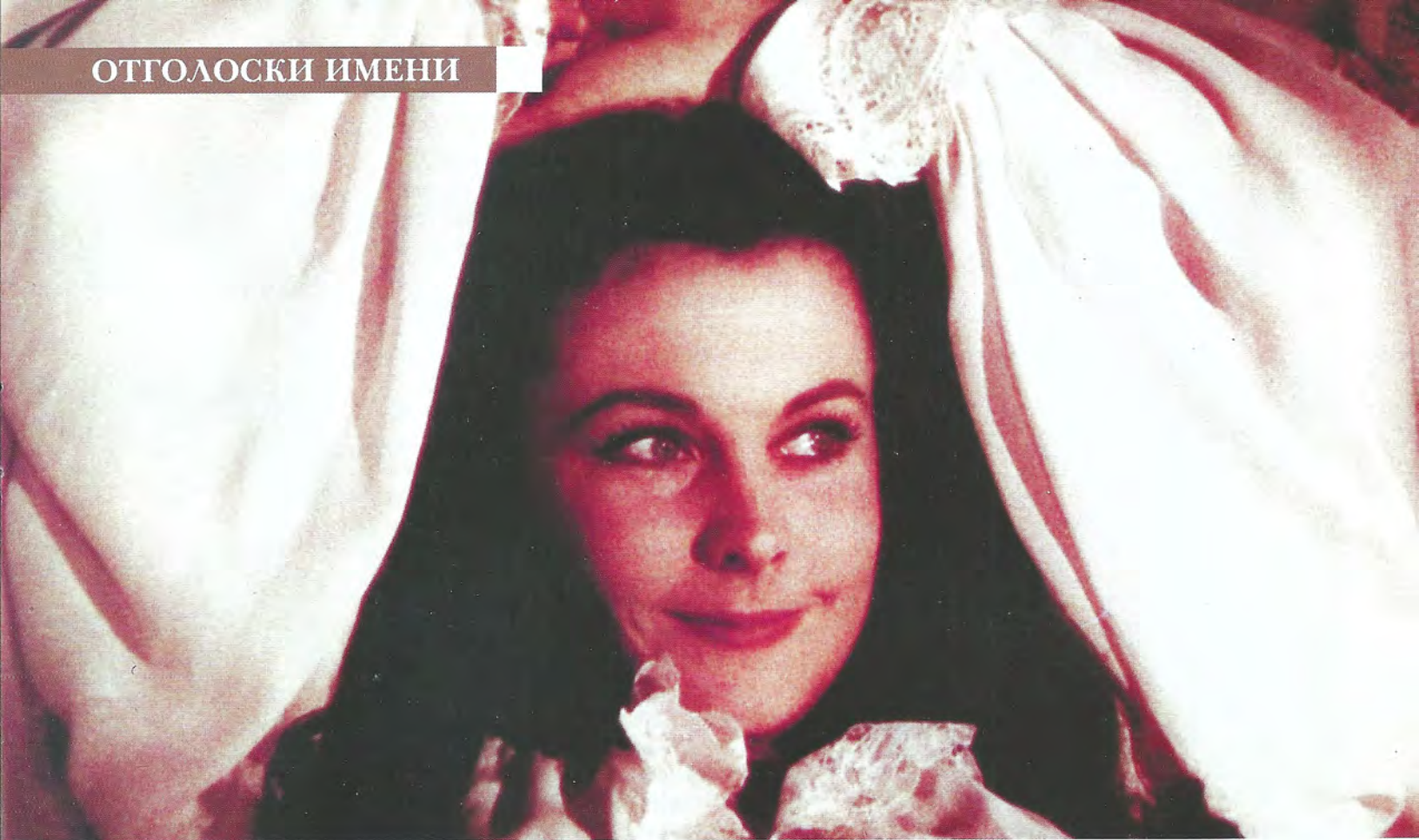
▲ Вивьен в образе Скарлетт – самая известная, ставшая легендарной роль актрисы