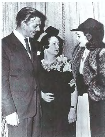
▼ Вивьен Ли (справа), Кларк Гейбл и Маргарет Митчелл на вечере в честь выхода на экраны «Унесенных ветром». Декабрь 1939 года

Д жюльетта, Офелия, Клеопатра, Скарлетт О'Хара, Бланш Дюбуа, леди Гамильтон, Виола – все эти роли Вивьен Ли сыграла в кино и театре. Она никогда не выставляла напоказ свой звездный статус, хотя, несомненно, им обладала. С ней бывало непросто, но она была искренней натурой и профессионалом, стремившимся к вершинам своего искусства.