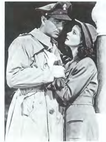
▲ Кадр из фильма «Мост Ватерлоо», 1940 год. Вивьен Ли и Роберт Тейлор великолепно показали красивую историю о подлинных чувствах

Вивьен была настолько симпатична Черчиллю, что он подарил ей в знак уважения и признания картину – натюрморт с розами. Этот подарок дорогого стоил – ведь картину написал сам даритель!