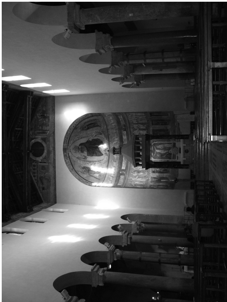
8. Храм св. Саввы на Авентине. Внутренний вид базилики.