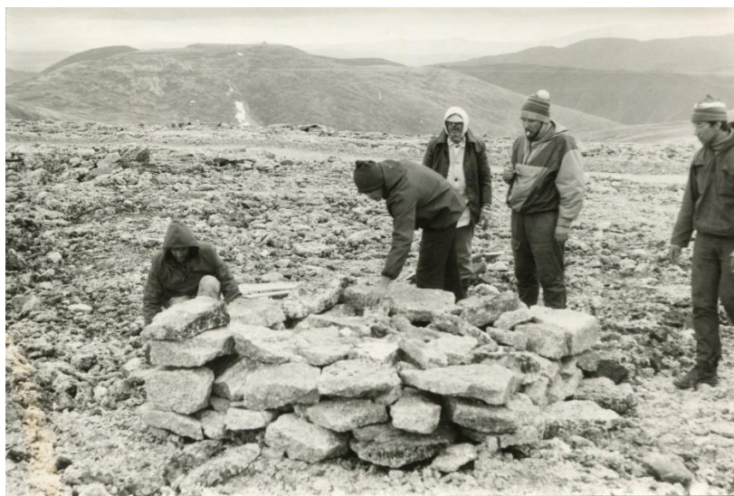
Сооружение каменного постамена для памятника

Одной из важных задач экспедиции было найти место для будущего памятника. Так описал в своей книге «Когда закончится Гражданская война» этот поиск Рудольф Веденеев: «Здесь, на краю земли, между заброшенными урановыми рудниками каторжных зон Северной и Восточной, океанская даль до конца июля забита льдами, а гряды хребтов вытягиваются в очередь, чтобы примерить мантию Королеве. Как бы вдогонку ей устремилась молчаливая свита – монументальные гранитные останцы, – здесь их зовут кекуры, – забытый людьми и Богом караул, прихотью природы приставленный к царствующей над округой вершине. [...] Невдалеке от кекур и выбрали место для будущего памятника. Был обычный туманный день. Голоса вязли в плотной белой массе, да говорить и не хотелось, работали молча. Медленно, камень за камнем рос террикон – из тех же гранитных глыб, что шли и на бараки, и на могилы. В основание была вмурована бронзовая плита с надписью: «Здесь будет воздвигнут памятник узникам, погибшим в урановых рудниках ГУЛАГа в 40–50-е годы». Гранитные плиты тяжело улеглись в землю, образовав постамент архаичной силы и строгости. [...] Поставить им всем памятник – невысказанно, но и жить с сердцем, сжатым болью и тоской об ушедших, нельзя. Памятник нужен нам, живым» 11 .