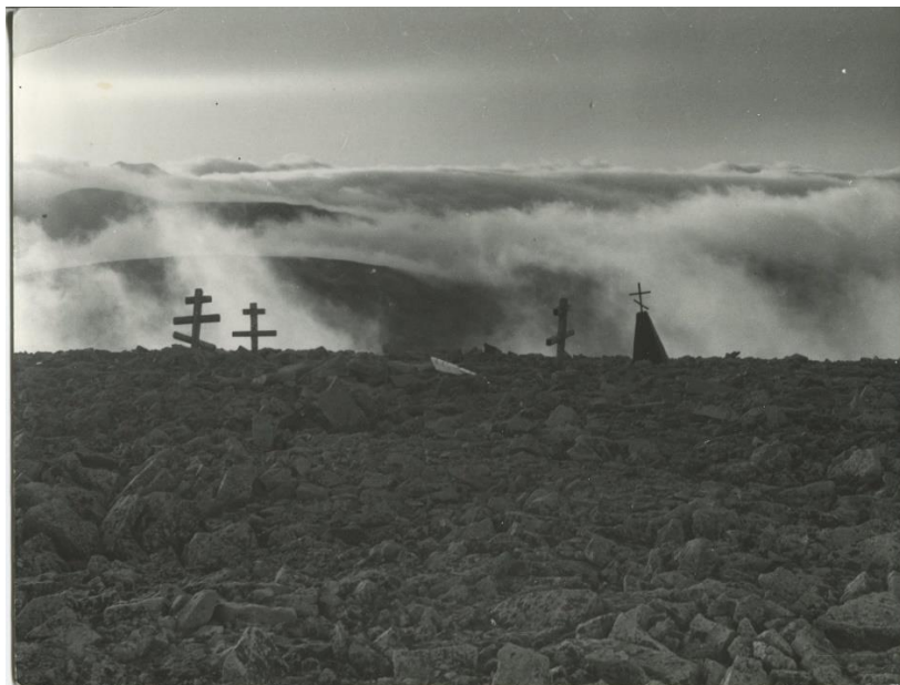
Кладбище заключённых между зонами Северная и Восточная