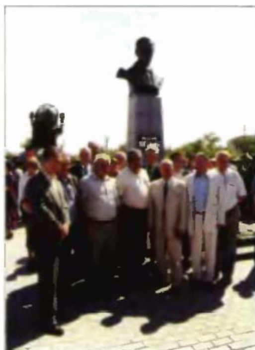
Ветераны строительства наземного комплекса многоэтажной ракетно-космической системы «Энергия-Буран» на открытии памятника Генеральному конструктору академику Янгелю М. К.