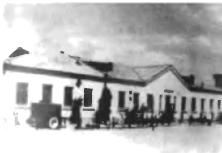
Первое административное здание