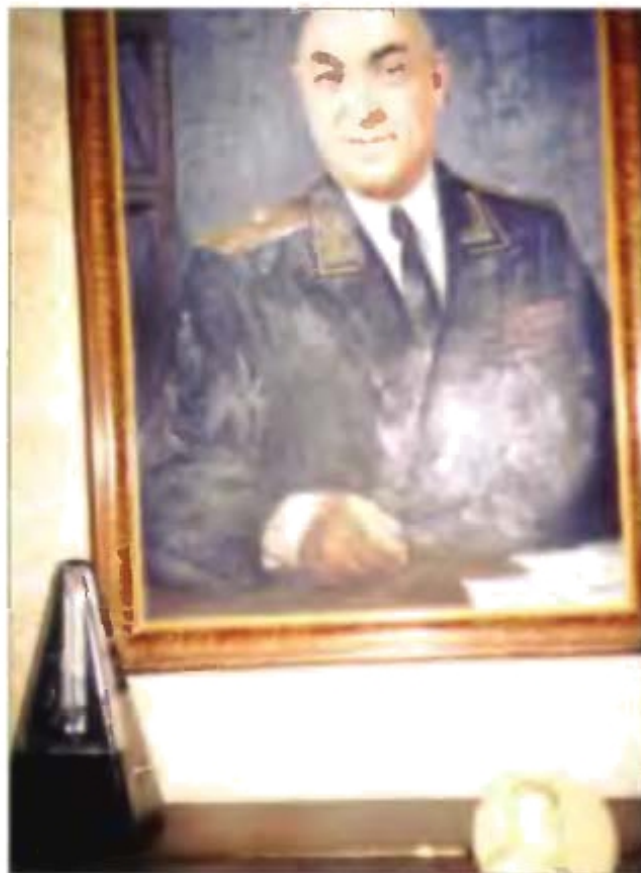
Портрет генерала в квартире дочери и внука.