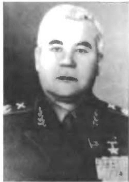
Неделин Митрофан Иванович (1902-1960 гг.)

Дважды Герой Социалистического труда, генеральный конструктор первых ракетно-космических систем