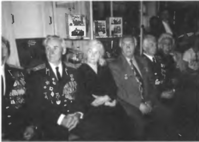
Встреча ветеранов 130 УИРа в г. Киеве.