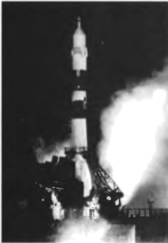
Идет подготовка к пуску ракеты-носителя на площадке 31