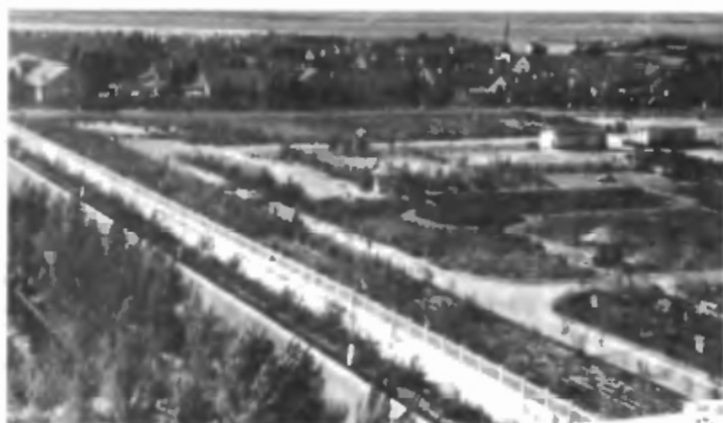
Деревянный городок в 1960 году

Прошли годы. Неузнаваемо изменился облик главной космической гавани нашей страны — космодрома Байконур. В каждом здании — тепло сердец и рук военных строителей