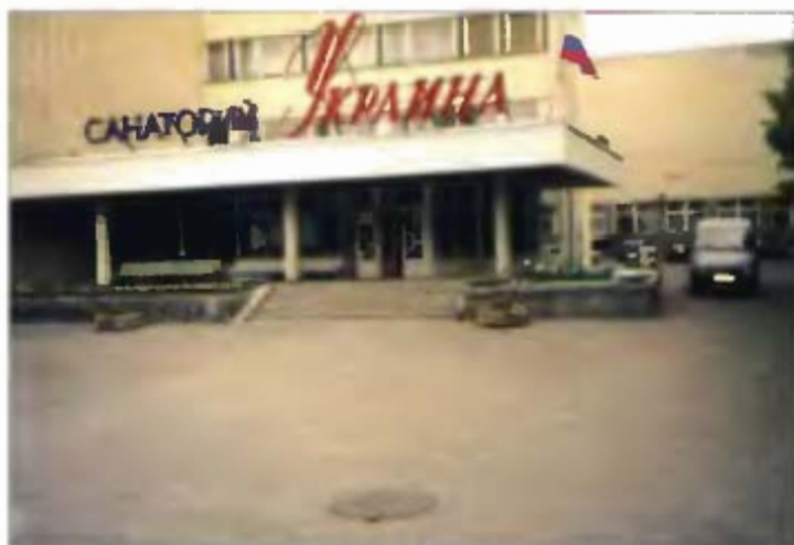
На этом месте стоял дом семьи Шубниковых.