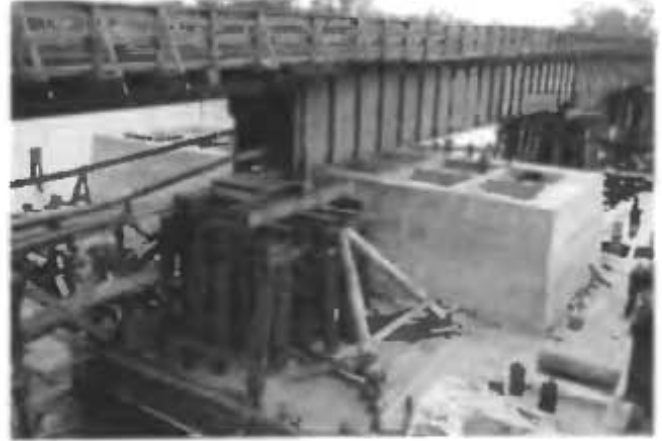
Вид кессона после распалубки.