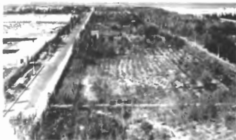
Это чудный парк-оазис в пустыне — творения рук военных строителей (1960 г.)