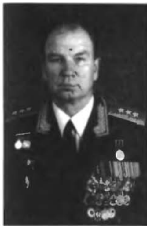
Генерал-полковник Шумилов Л.В.

Первый заместитель начальника строительства и расквартирования войск Министерства обороны СССР (1985-1990 гг.)