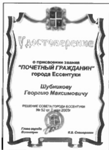
Удостоверение «Почетный гражданин»