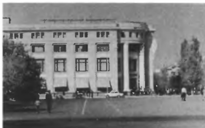
Здание центрального универмага. Построено под руководством Г.М. Шубникова. 1960 г.