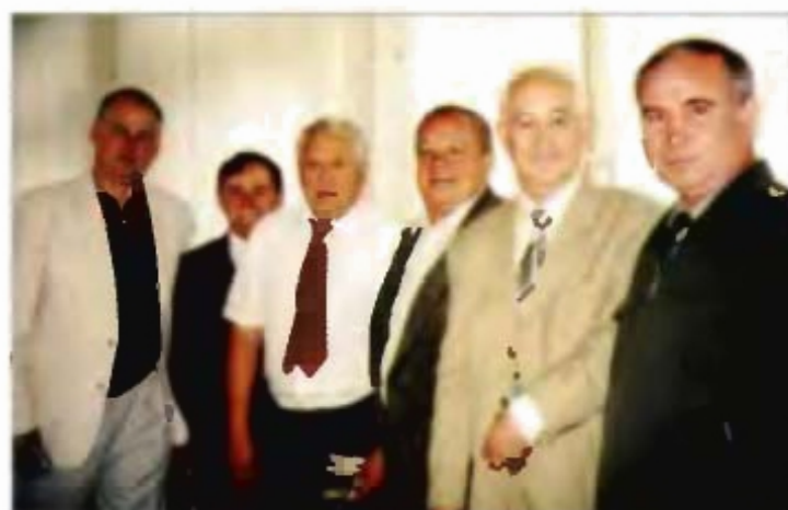
Ветераны 130 УИРа. Снимок на память.