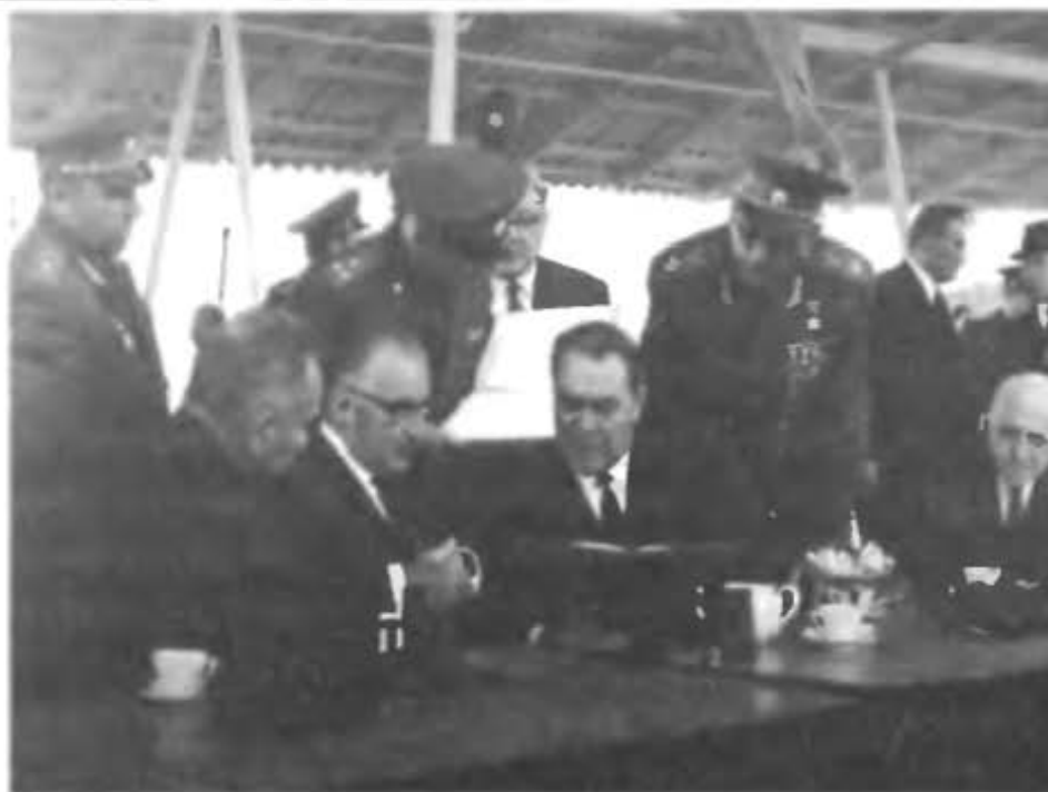
Л.И. Брежнев на смотровой площадке «Гагаринского старта»