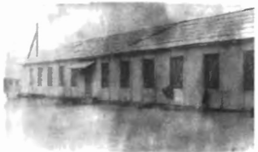
Первые жилые бараки