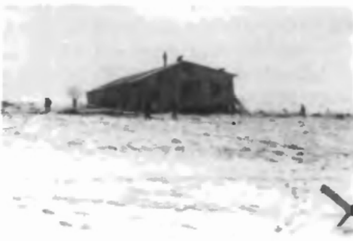
Первая солдатская казарма на 9 площадке