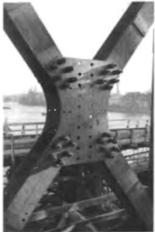
Монтажный узел фермы