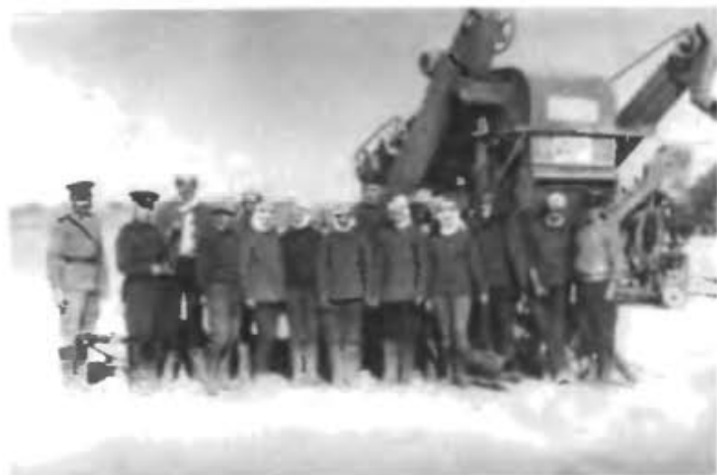
Группа рабочих и военных строителей на поле колхоза имени III Интернационала Кзыл-ординской области

Политотдел и руководство УИРа значительное место в своей работе отводили культурно-воспитательной работе с личным составом. В каждом управлении начальника работ, отряде были построены и оборудованы клубы, библиотеки. Регулярно проводились культурно-массовые мероприятия — демонстрация художественных фильмов, концерты художественной самодеятельности, логическим продолжением которых был городской смотр талантов.