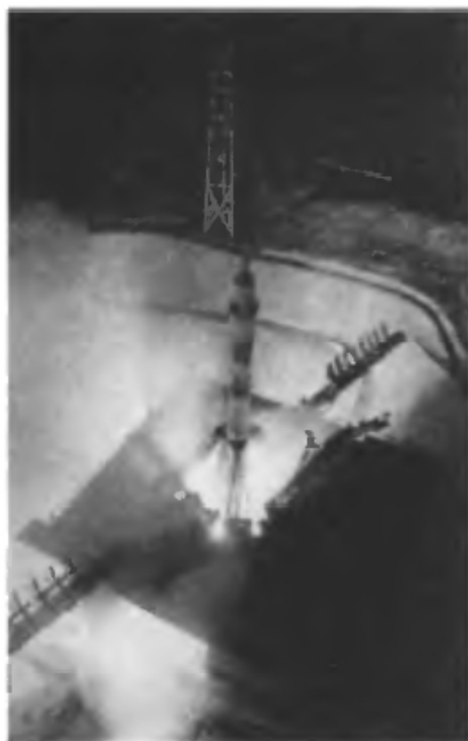
Ночной старт. Эта ракета скоро доставит ИСЗ на околоземную орбиту.