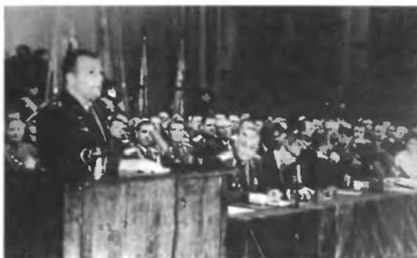
Встреча Ю.А. Гагарина с руководством 130 УИРа и подчиненных стройорганов.