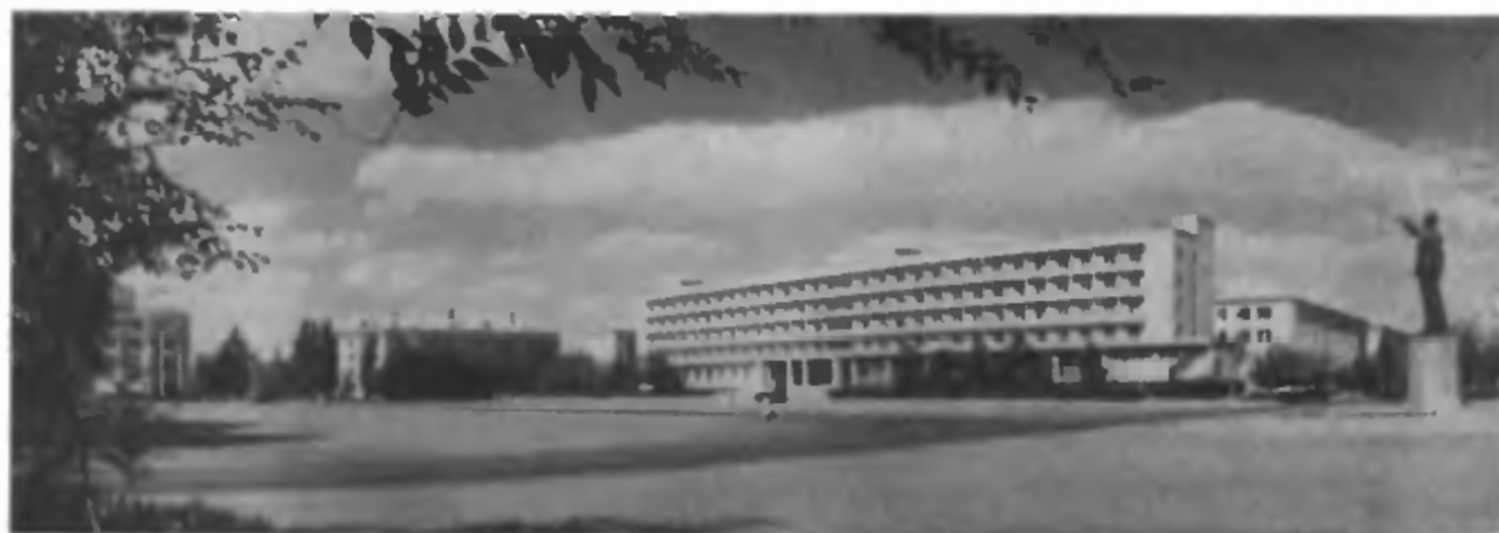
Главная площадь города Ленинска и гостиница «Центральная», штаб Полигона и дома на прилегающих улицах

Прошли годы. Неузнаваемо изменился облик главной космической гавани нашей страны — космодрома Байконур. В каждом здании — тепло сердец и рук военных строителей