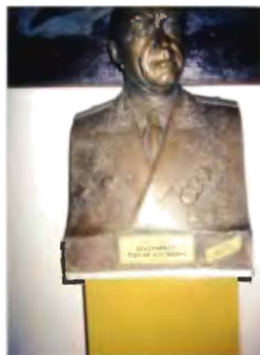
Бюст генерала-майора Шубникова Г. М. в краеведческом музее г. Ессентуки. Скульптор Постников Г. М.