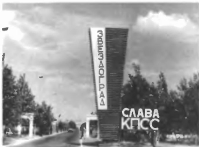
КПП на въезде в г. Звездоград