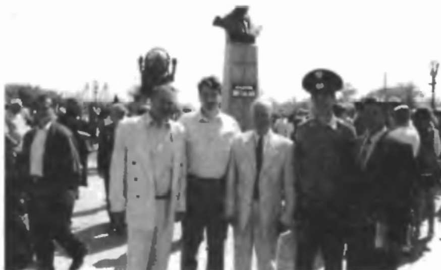
Памятник Михаилу Кузьмичу Янгелю академику, генеральному конструктору ракетно-космической техники, дважды Герою Социалистического Труда (Байконур, 2 июня 2001 г.)