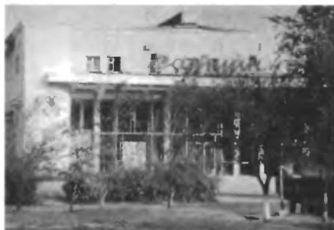
Кинотеатр «Сатурн». 1965 г.