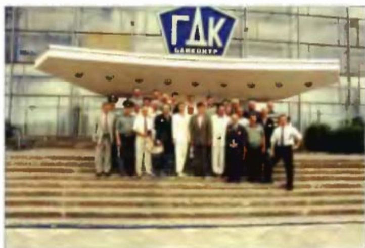
Делегация ветеранов после посещения музея боевой и трудовой славы, у Дома офицеров-строителей.