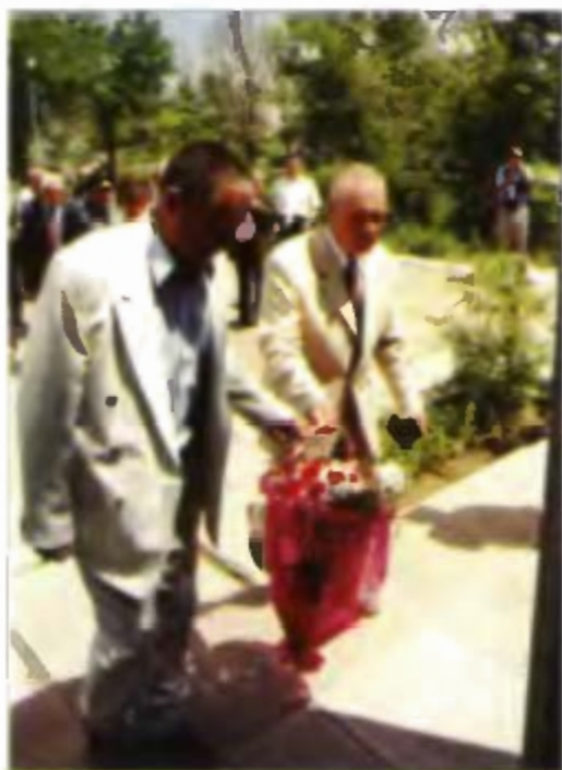
При возложении цветов к памятнику Г. М. Шубникову. 2 июня 2001 г. Генералы А. А. Макарычев, В. А. Хренов.