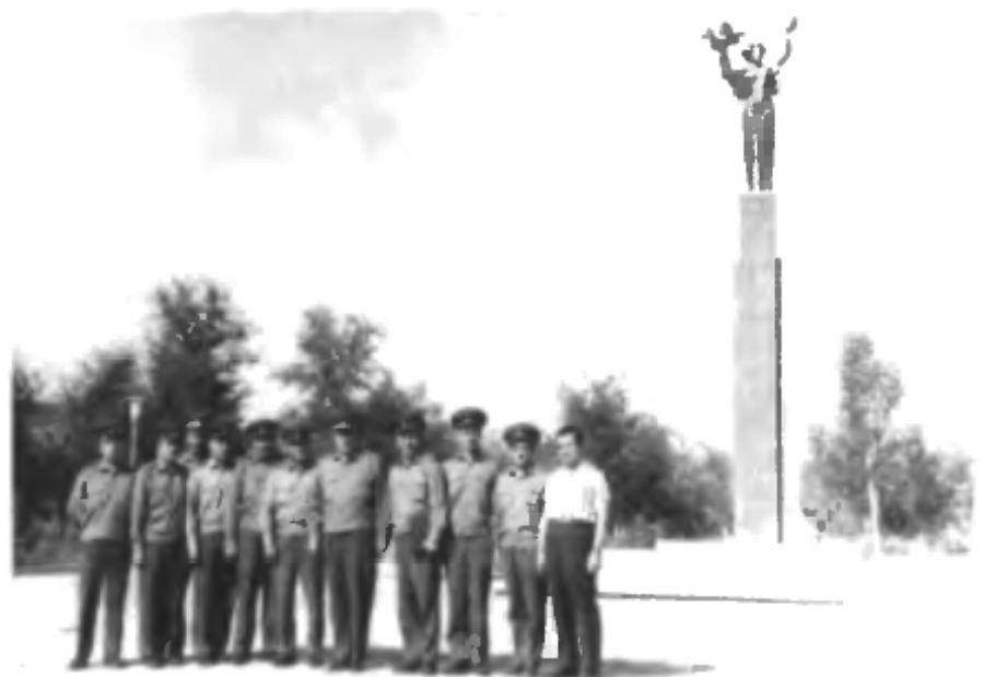
«Наука и Космос». Этот обелиск установлен в одном из парков Байконура

«Памятный камень», заложенный на месте строительства первого здания будущего города.