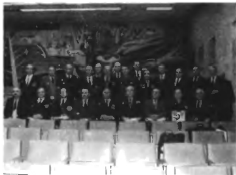
Ветераны строительства космодрома Байконур на I съезде федерации космонавтики СССР