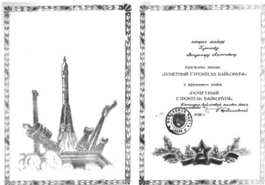
Диплом «Почетный строитель Байконура»