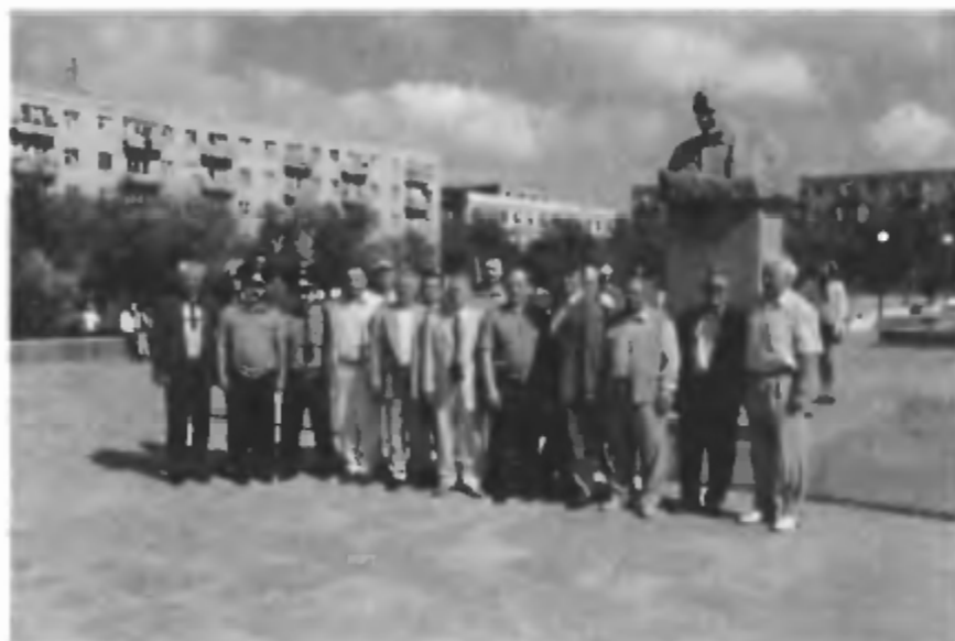
У памятника Сергею Павловичу Королеву, главному конструктору первых ракетно-космических систем, академику, дважды Герою Социалистического труда. Байконур, 2 июня 2001 г.