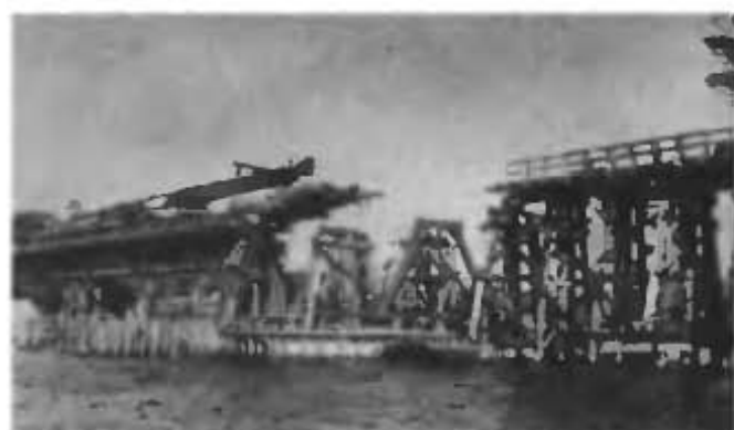
Разборка 3-х пролетов старого моста для строительства железо-бетонной опоры.