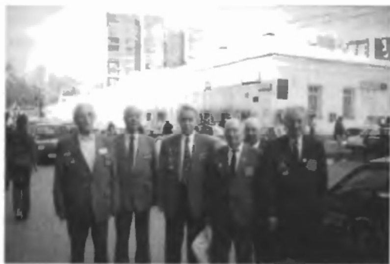
Ветераны строительства космодрома Байконур после встречи. Они были первыми.