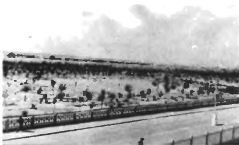
Деревянный городок в 1957 году