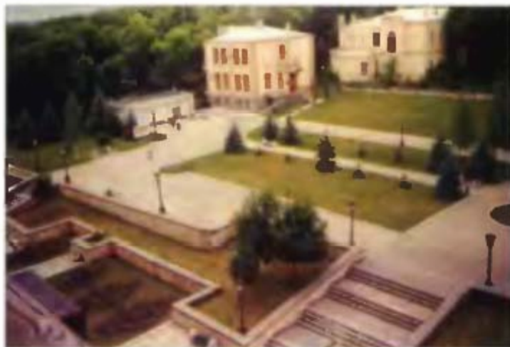
Объекты, построенные Г. М. Шубниковым в городе Ессентуки в предвоенные годы.