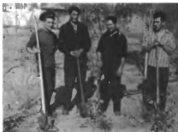
Работа по озеленению г. Ленинска ул. 8-ое Марта, дом 5. (1958 г.)