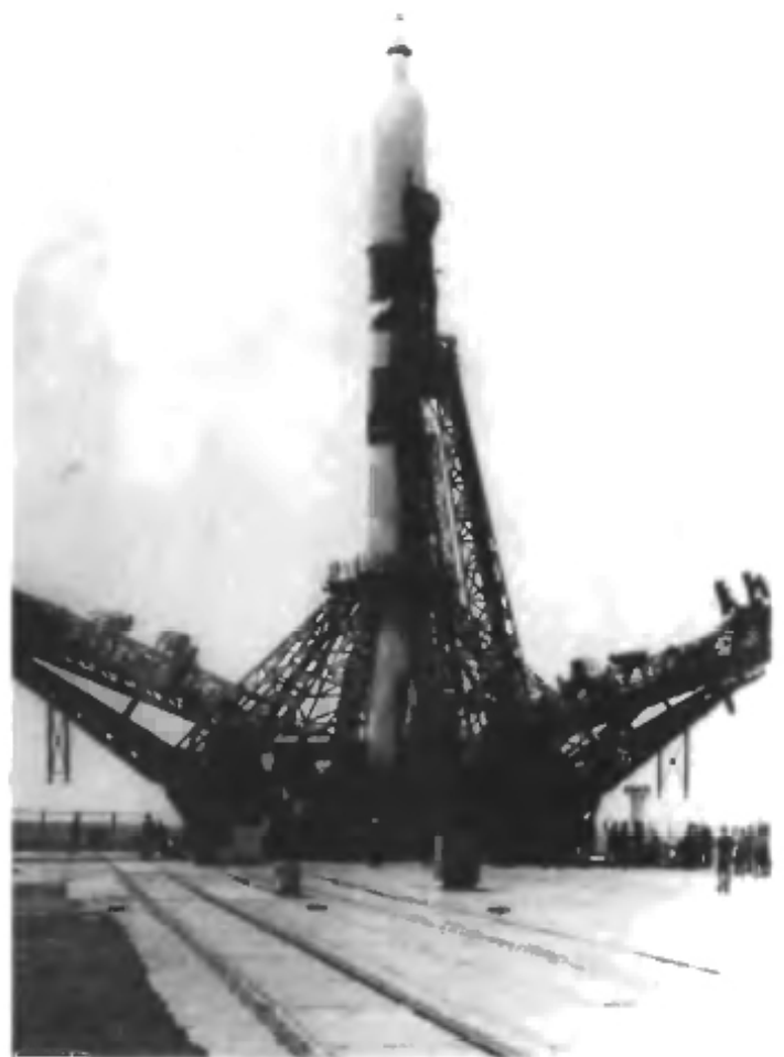
Ракета на пусковом устройстве «гагаринского» старта, сданного в эксплуатацию в мае 1957 года. Здесь началась дорога к звездам.