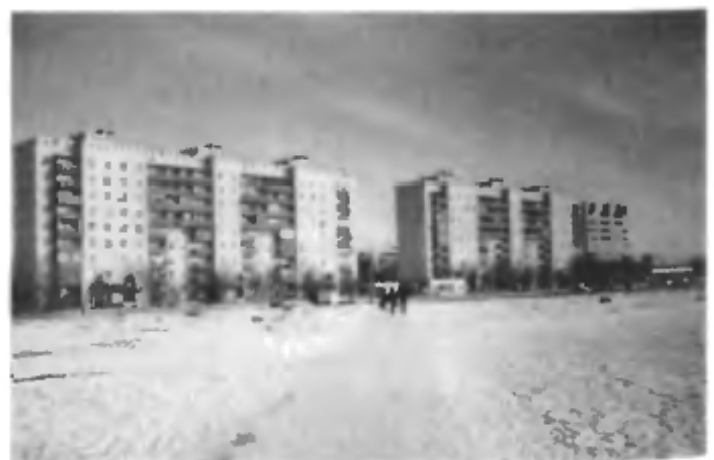
Новые дома города в 7 микрорайоне (1988 г.)