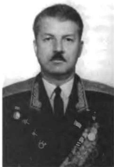
Генерал-лейтенант Курушин А.А.

Начальник космодрома «Байконур» (1965-1973 гг.)