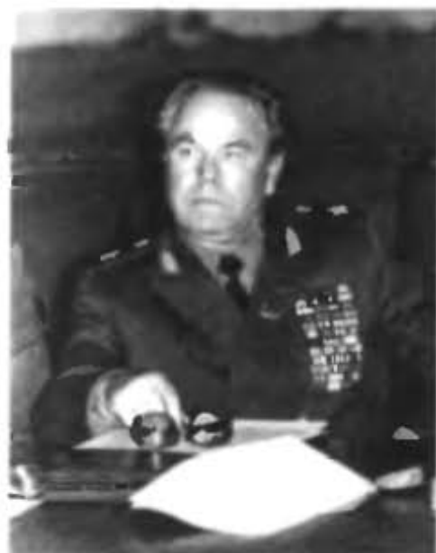
Маршал Шестопалов Н. Ф.

Маршал инженерных войск, заместитель Министра обороны СССР по строительству и расквартированию войск с 1978 по 1988 год