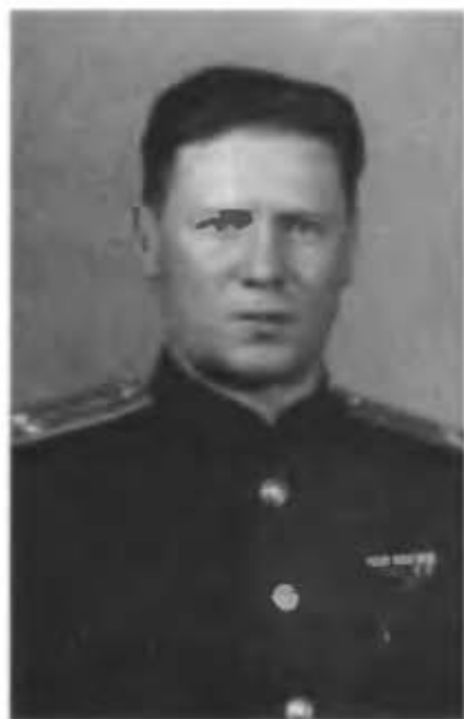
Полковник Разумов Всеволод Яковлевич