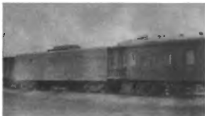
В начале строительства космодрома жили в железнодорожных вагонах