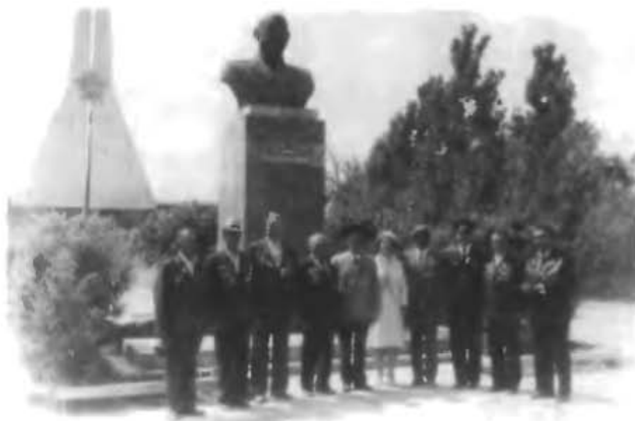
Руководители стройки, ветераны Великой Отече- ственной Войны у памят- ника Г.М. Шубникова. 1 мая 1987 года