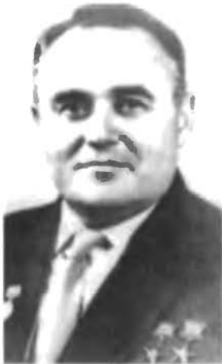
Королев Сергей Павлович (1906-1966 гг.)

Дважды Герой Социалистического труда, генеральный конструктор первых ракетно-космических систем