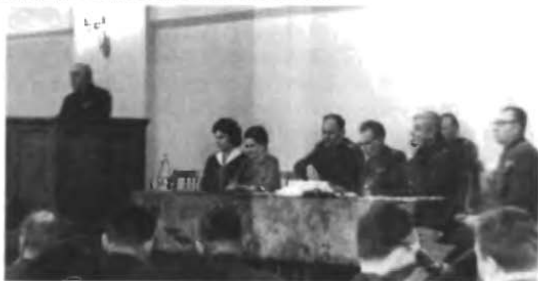
Генерал-майор Г.М. Шубников проводит совещание с руководящим составом 130 УИРа. (Август, 1964 год)

Ежеквартально Георгий Максимович проводил общий для всех строительных организаций так называемый партийно-хозяйственный актив. Для участия в нем привлекались не только руководители строительных организаций, но и начальники участков. Шубников во всем продолжал политику «укрепления линии», воспитания и повышения роли «линейного» состава — уровня руководства, непосредственного возглавляющего строительство объектов.