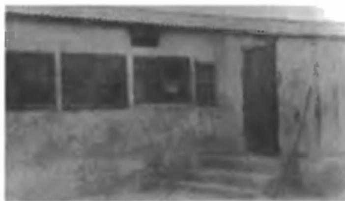
Первый магазин на жилой площадке