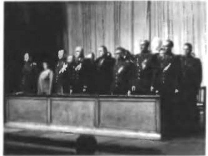
В президиуме торжественного собрания по обсуждению задич строительства под «Лунную программу» (Ноябрь, 1964 год)