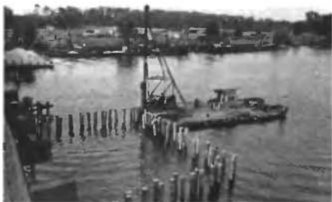
Забивка свай для остравка