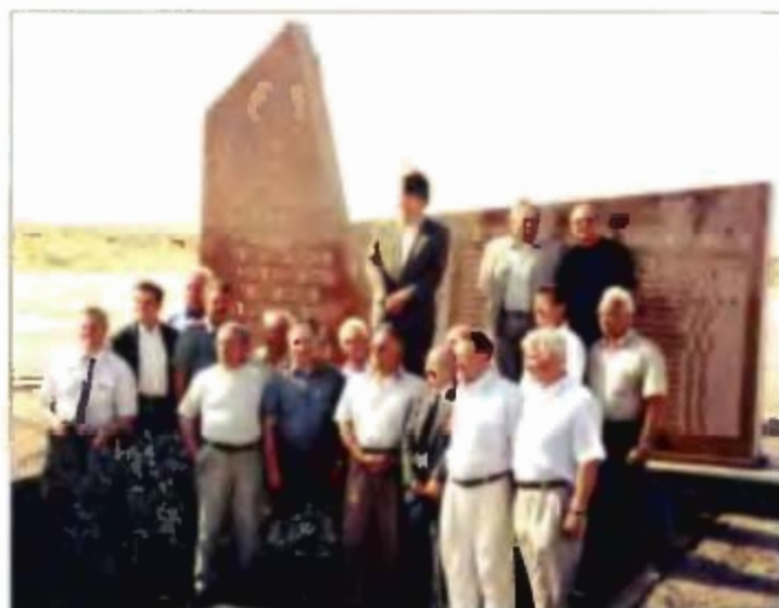
Ветераны, прибывшие на 50-летие 130 УИРа на 41 площадке у памятной стелы погибшим во время катастрофы 24 октября 1960 г.