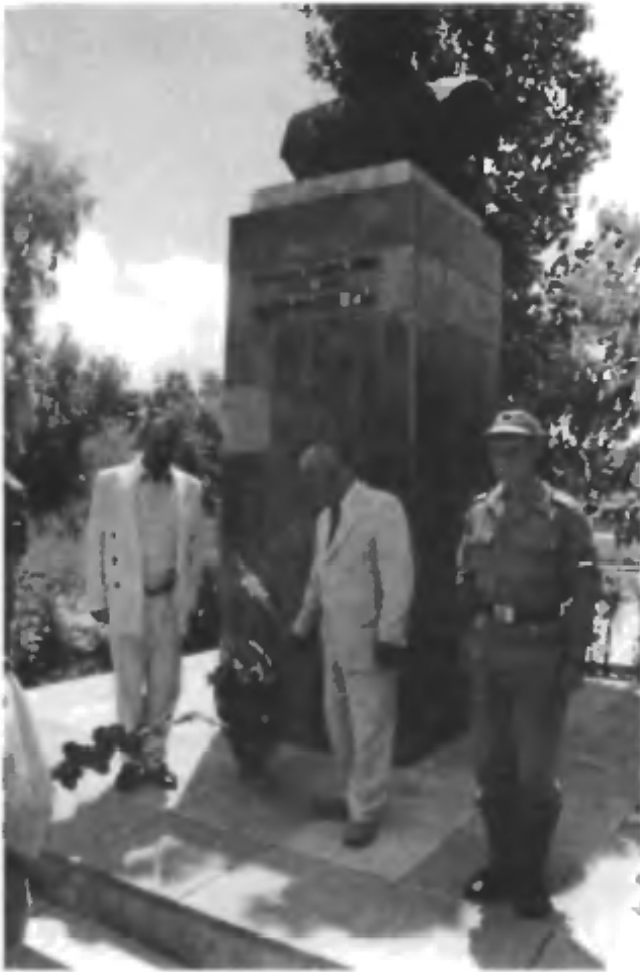
Памятник Главному строителю Байконура, Первому почетному гражданину города Ленинска генерал-майору Шубникову Г.М. Открыт в мае 1983 года.

Архитекторы: Н.Асатури, А.Гречишников (Байконур, 2 июня 2001 г.)