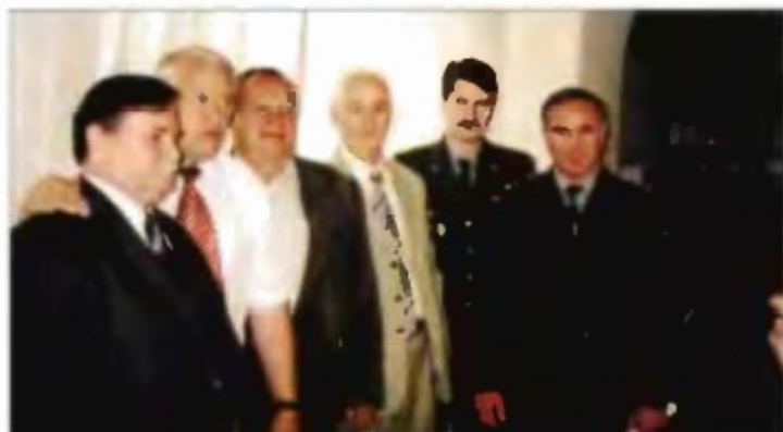
Снимок на память.