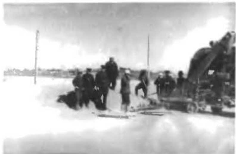
С военными строителями, рабочими на полевом стане колхоза имени Чапаева

Когда был построен Дворец культуры со зрительным залом на 800 мест, эти мероприятия стали носить по-настоящему массовый, зрелищный характер. При Дворце культуры действовали два лекционных зала, библиотека с читальным залом, музей строителей. Кроме того, на сэкономленные деньги построили музыкальную школу на 200 мест, директором которой на протяжении 12 лет была моя жена Евдокия Владимировна. Она принимала активное участие в строительстве школы, ее оснащении, подборе преподавателей. Школа была очень хорошо оборудована и неоднократно занимала первое место в смотре такого рода учебных заведений, проводившемся в Казахстане. Наши сыновья — Юрий и Виктор — после окончания