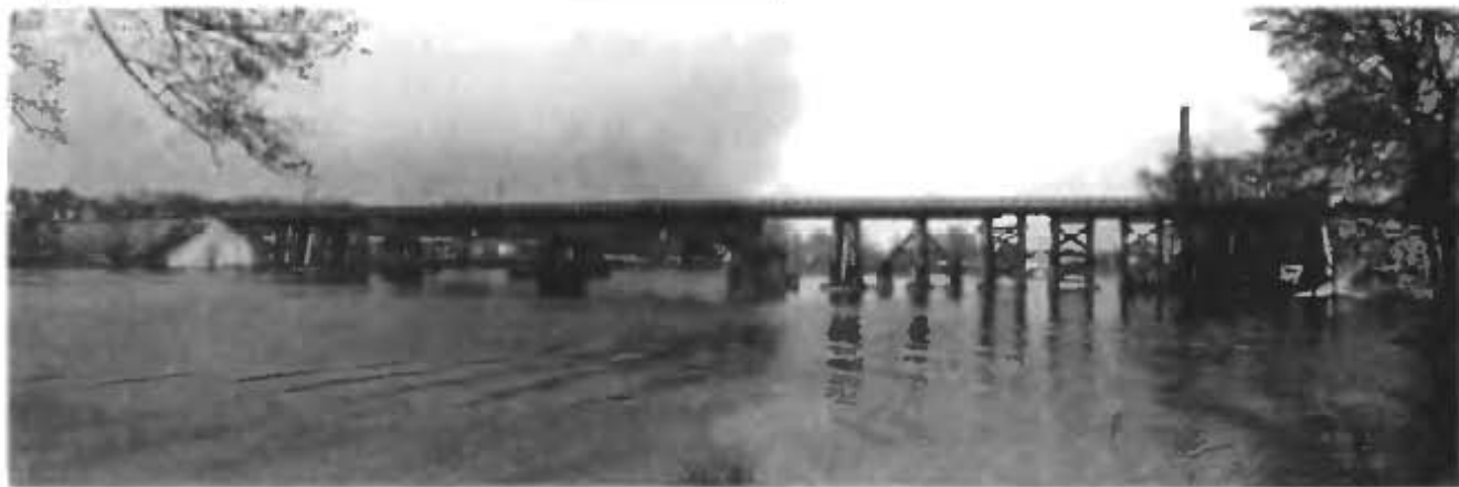
Общий вид моста до восстановления.