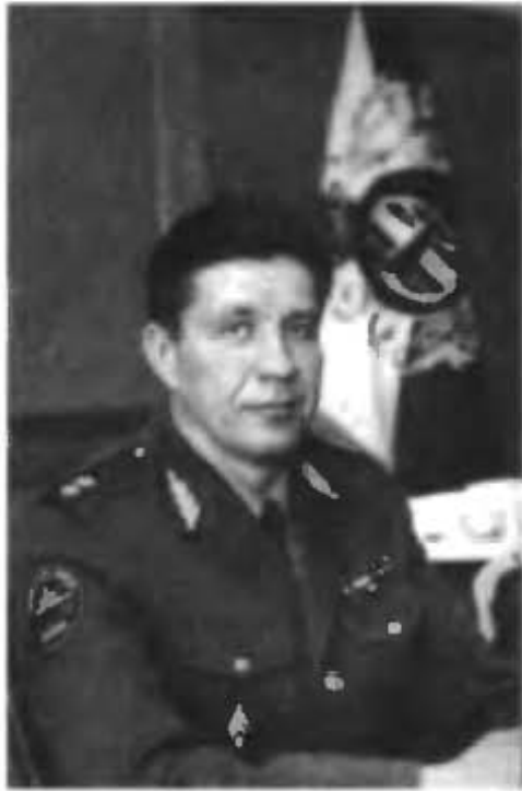
Генерал-лейтенант Поповкин В.А.

В истории Байконура много знаменательных дат, но одна из них — особая. 2 июня 1955 года — день рождения космодрома. Через тернии к звездам прокладывали и прокладывают свой путь все, кто связал свою жизнь с Байконуром. Дорога в космос длиной почти полвека овеяна славой, мужеством и трудом людей, для которых Байконур стал родным домом.