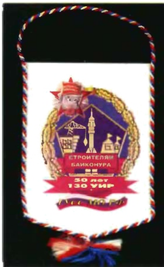
Памятный вымпел и юбилейная медаль, посвященные 50-летию образования ордена Октябрьской революции 130 управления инженерных работ. (20 мая 2001 г.)