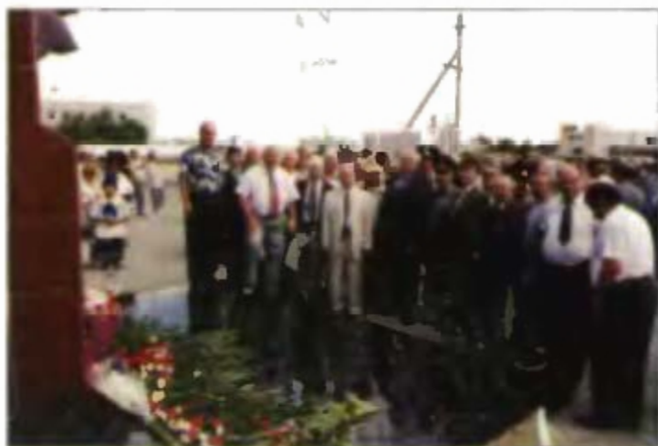
Ветераны строительства системы «Энергия-Буран» на открытии памятника генеральному конструктору академику Бармину В. П.