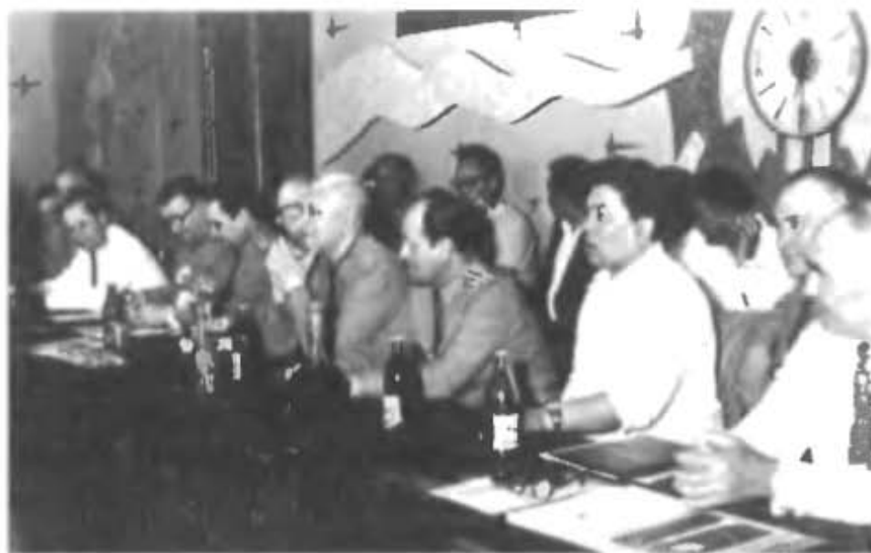
В фойе Дворца культуры строителей. Руководство 130 УИРа и приглашенные гости в ожидании вручения наград передовикам производства