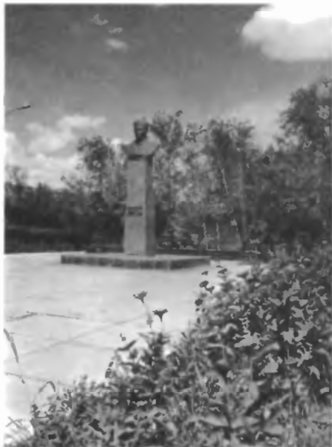
Памятник академику М.К. Янгелю