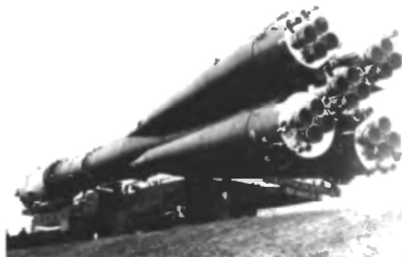
Транспортировка ракеты по спецпути на пусковое устройство ракетного старта