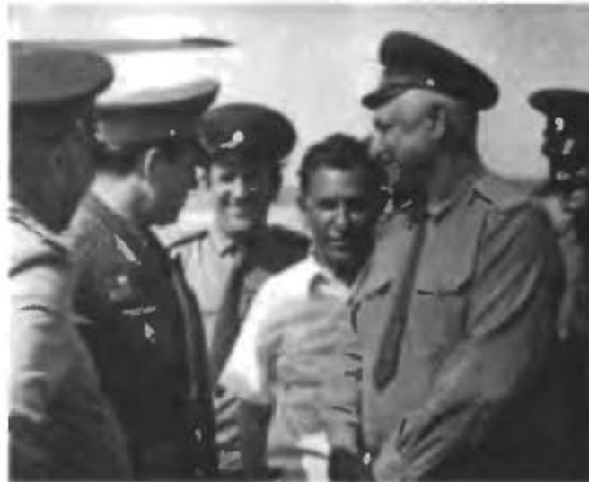
На строящихся объектах под «Лунную систему» (Байконур, 110 площадка)