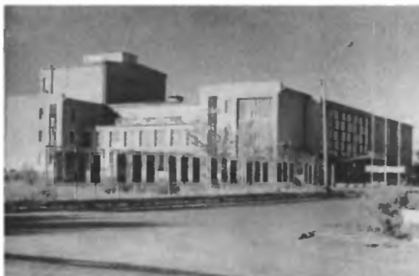
Дом офицеров строителей, один из основных центров культурной жизни города. 1965 г.