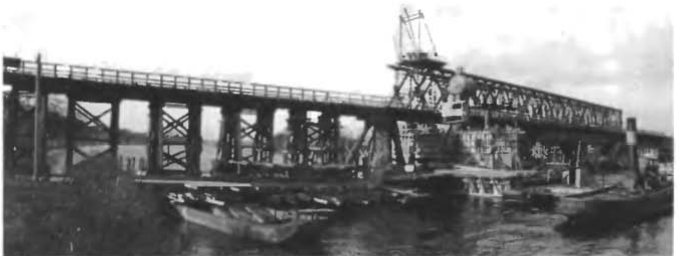
Общий вид восстановления моста