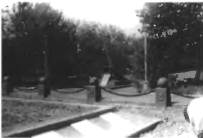
Место захоронения и памятники испытателям, погибшим на космодроме Байконур во время катастроф 24 октября 1960 г. и 24 октября 1963 года, расположенных напротив штаба 130 УИРа