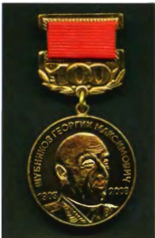
Памятный юбилейный знак, изготовленный к 100-летию со дня рождения Георгия Максимовича Шубникова.