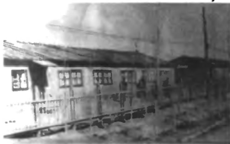
Первая улица поселка «Заря» (1956) г.