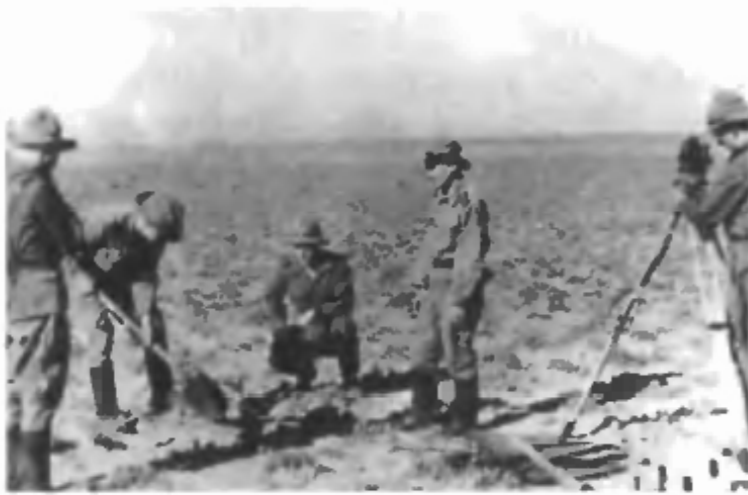
Военные строители забивают «Первый кол» в основание, где будет построено здание и город Звездоград (Ленинск, Байконур)