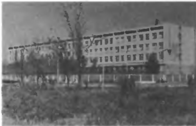
Лечебный корпус гарнизонного госпиталя. Несет здоровье людям. 1961 г.