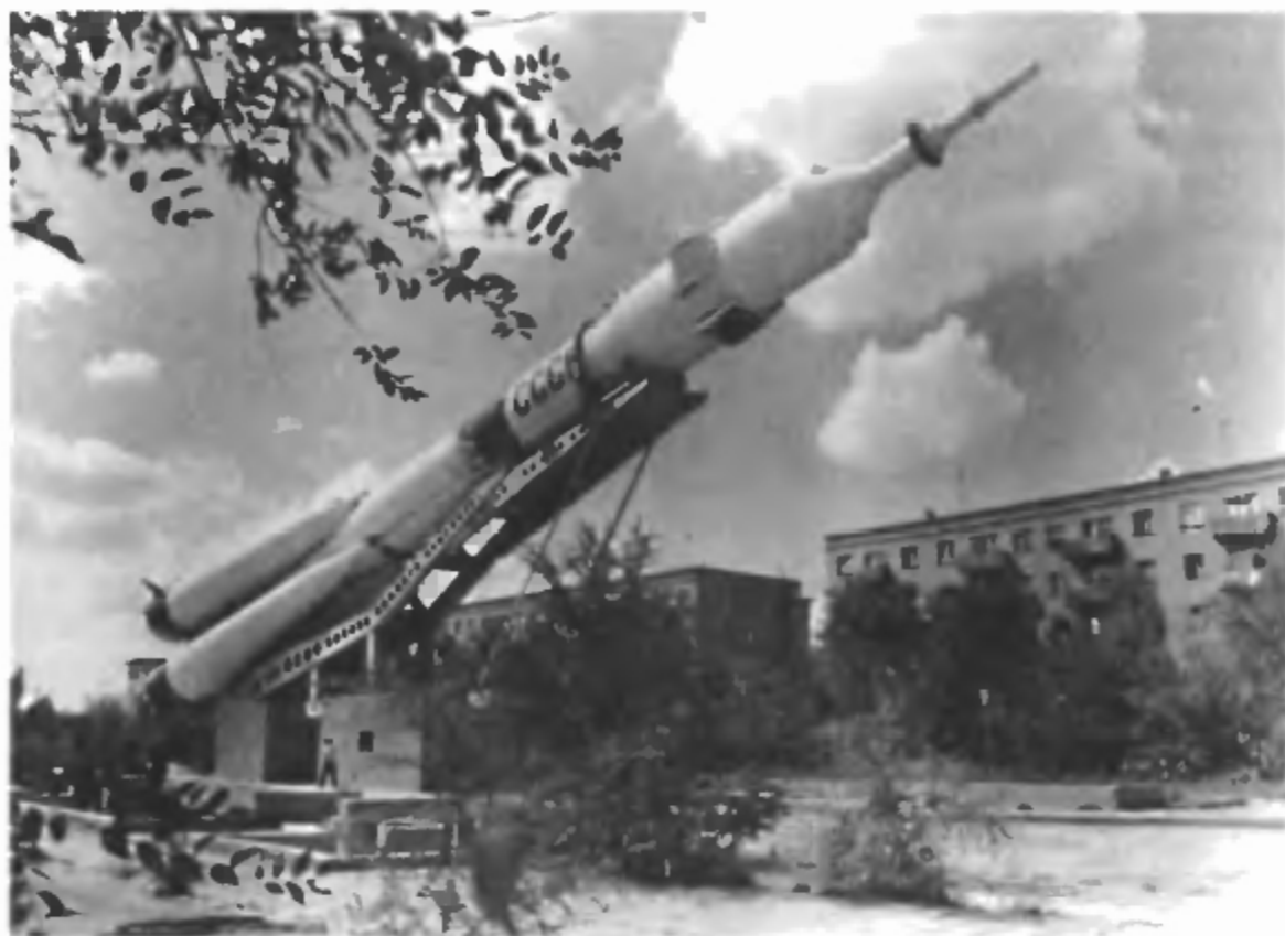
Монумент покорителям космоса. На одной из центральных улиц города ракета-носитель «Союз»