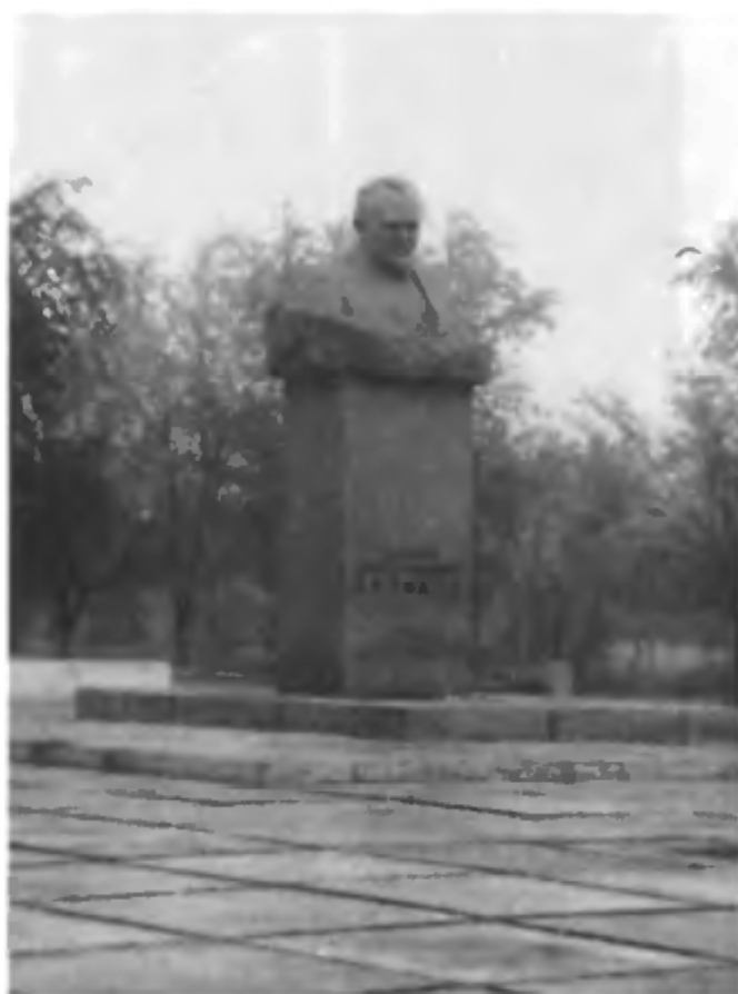
Памятник С.П. Королеву на площади города, которая носит его имя.

Летопись космонавтики в названиях улиц, площадей города. Жители свято хранят память о создателях космической техники. Визитная карточка города — его памятники.