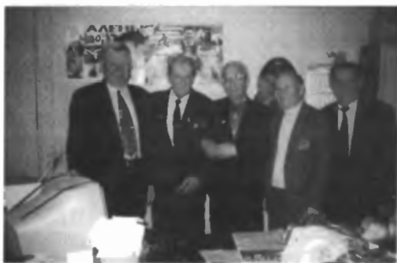
Снимок на память

Сплоченный коллектив, созданный Г.М. Шубниковым, прославился среди военных строителей. Под его руководством выросло много офицеров, которые позже руководили крупными стройками, стали генералами. И они старались работать так, как работал сам Шубников — с максимальной отдачей для дела и повседневным вниманием к людям.