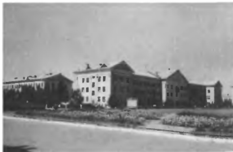
Одна из первых улиц города... (1960 г.)