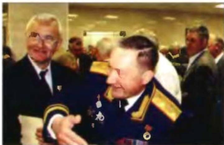
За праздничным столом ветеранам есть о чем поговорить...