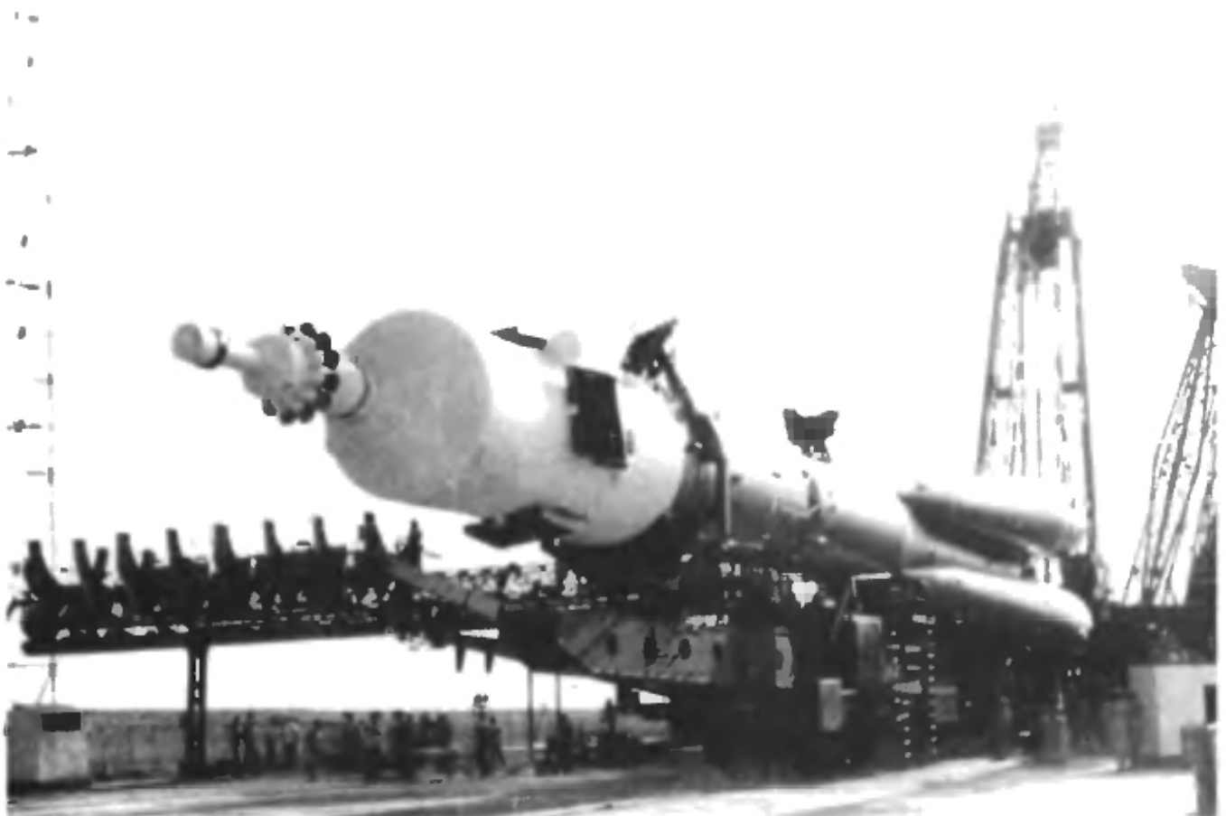
Установка ракеты на пусковое устройство на «гагаринском» старте.