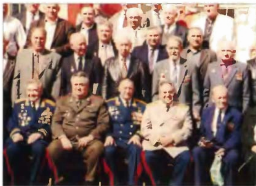
На память о встрече...