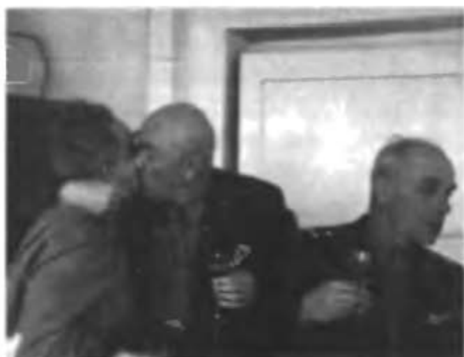
На проводах к новому месту службы генерал-лейтенанта А.Г. Захарова