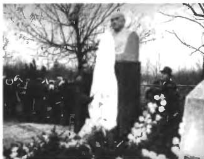
Открытие памятника на могиле Г.М. Шубникова (г. Ессентуки, май 1966 года)