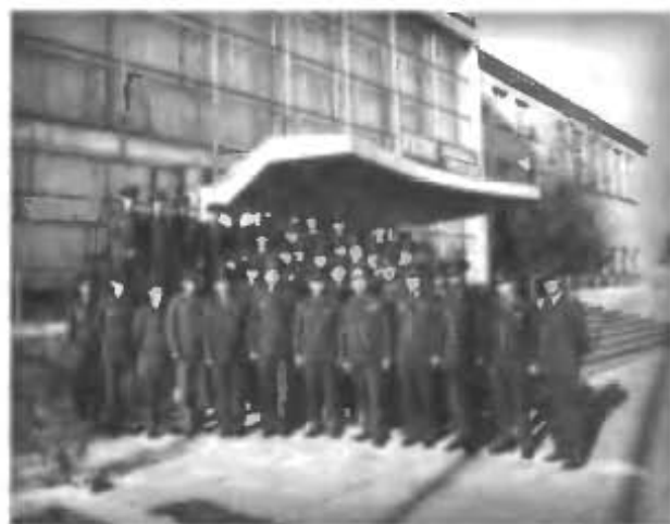
Генерал-майор Федоров А.А. со своими заместителями, начальниками отделов и служб 130 специального территориального управления после посещения музея боевой и трудовой славы, в годовщину рождения Г.М. Шубникова (май 1986 г.)

Затем создавался комплекс сооружений на площадках 250 и 250 «А», кислородно-азотный завод, ряд хранилищ для компонентов ракетного топлива, монтажно-испытательный корпус на 112-й площадке. Были закончены общестроительные и монтажные работы на СДИ, командном пункте площадки 110, посадочном комплексе орбитального корабля и