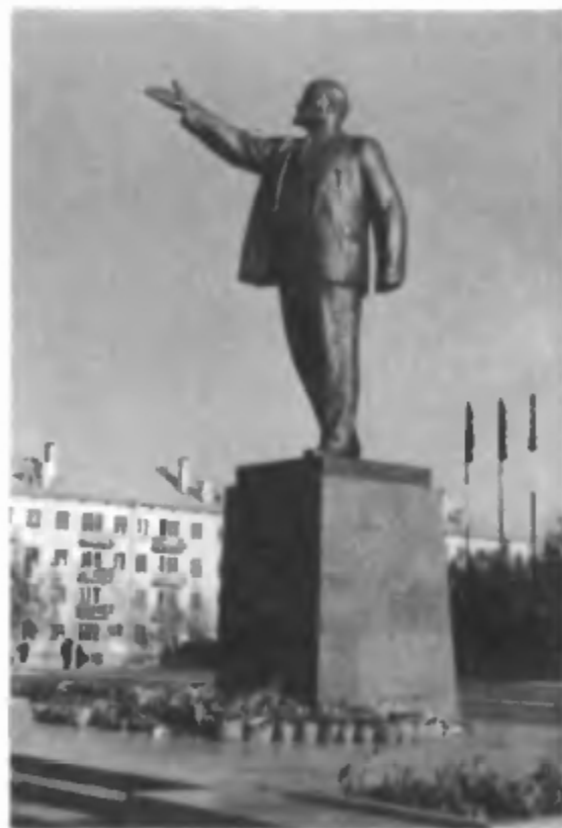
Памятник В.И. Ленину на центральной площади Байконура