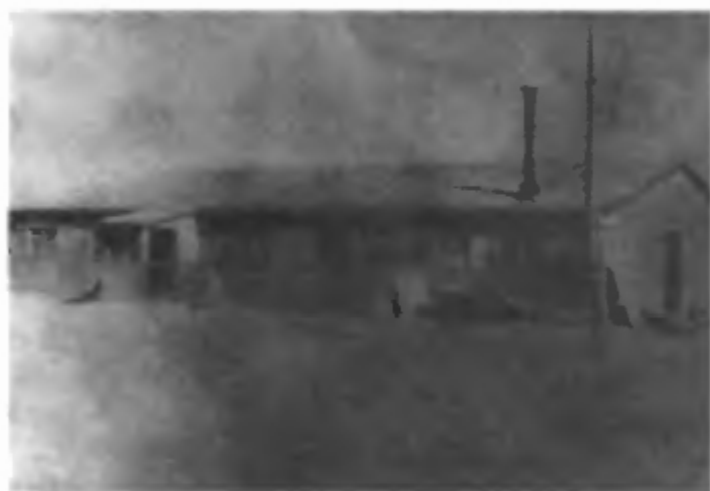
Первое офицерское общежитие