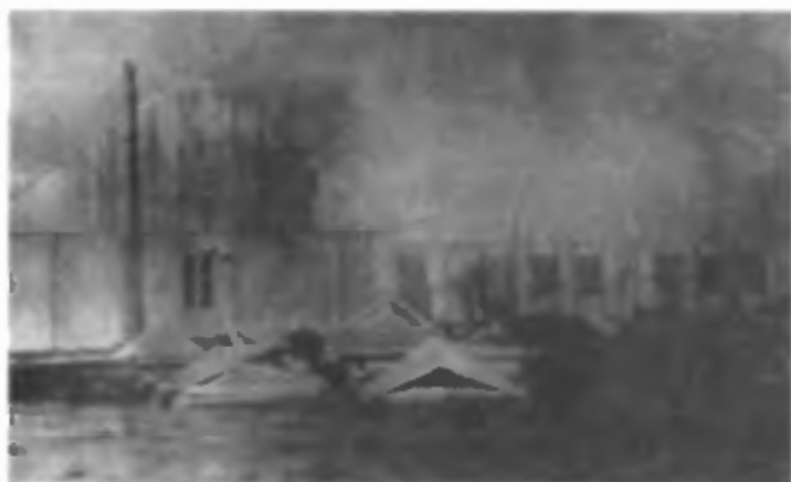
Монтаж сборно-щитовой казармы на 9 площадке