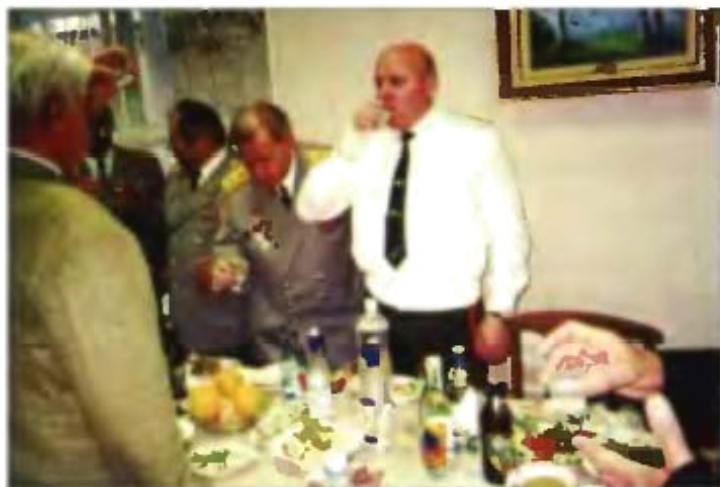
1-й торжественный тост, посвященный 50-летию Ордена Октябрьской революции 130 УИРа, провозгласил начальник ГУСС МО РФ генерал-лейтенант Гребенюк А. В.