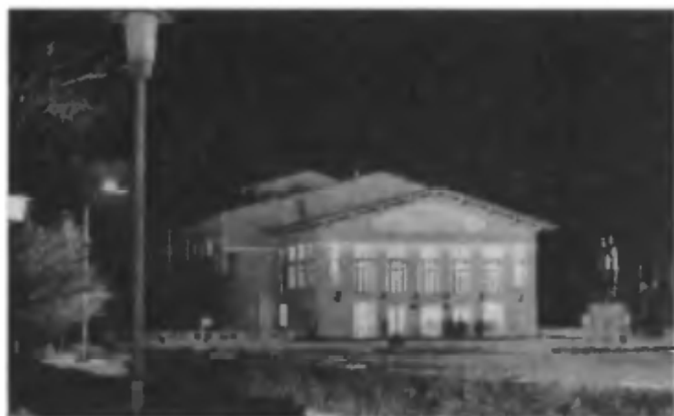
Дом офицеров гарнизона. (1962 г.)