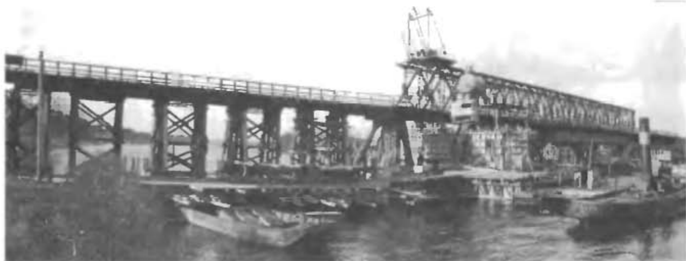
Общий вид надвинутой фермы.

врагу. Развернулись работы по восстановлению жизненно важных объектов Германии.