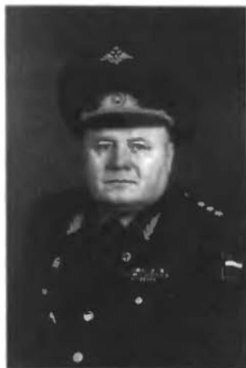
Генерал-полковник Гребенюк А.В.

Начальник строительства и расквартирования войск — Заместитель министра обороны Российской Федерации