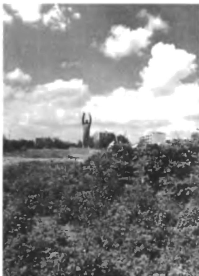
Памятник Ю.А. Гагарину в городе Байконур