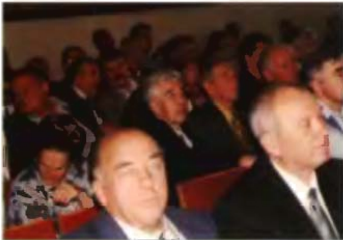
В зале вечера памяти.