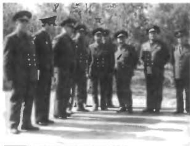
После осмотра строящихся объектов многоразовой космической системы «Энергия-Буран» (2 сентября 1985 г.)

В центре внимания начальника строительства, начальников отделов, их заместителей было выявление «узких» мест в выполнении целевых задач, оказание практической помощи в доставке строительных материалов, техники, создание условий для проживания, питания большого количества не только военных строителей, но и рабочих субподрядных организаций, промышленности. Все это позволило соблюсти сроки строительства, монтажа большого количества оборудования, а затем проведения автономных и комплексных испытаний. Военные строители ни на один день не задержали конструкторов, промышленников и испытателей. Первая и вторая очереди 779-го объекта на 45-й площадке были сданы в эксплуатацию на полгода раньше установленного срока с хорошим качеством.