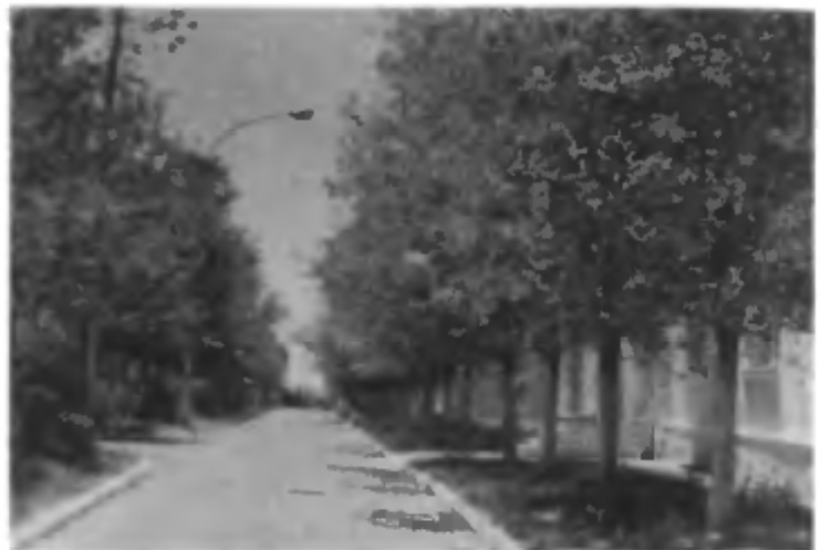
Городские аллеи — спасение горожан от изнурительной жары (1965 г.)