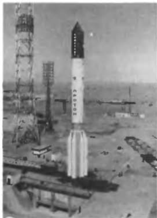
Ракета носитель «Протон»