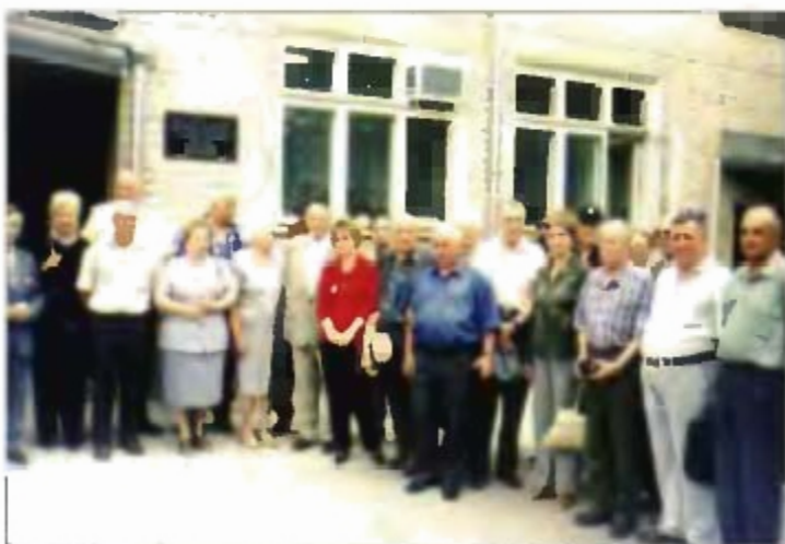
Делегация, родные, ветераны у мемориальной доски Г. М. Шубникову.