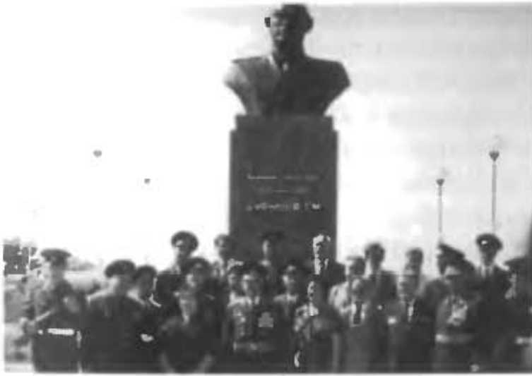
Генерал-майор А.А. Федоров с ветеранами-первопроходцами Байконура, прибывших на открытие памятника Г.М. Шубникову. (Май 1983 г.)