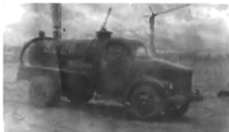
Питьевую воду на объекты привозили издалека