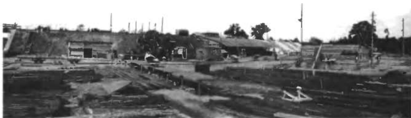
Общий вид строительной площадки.