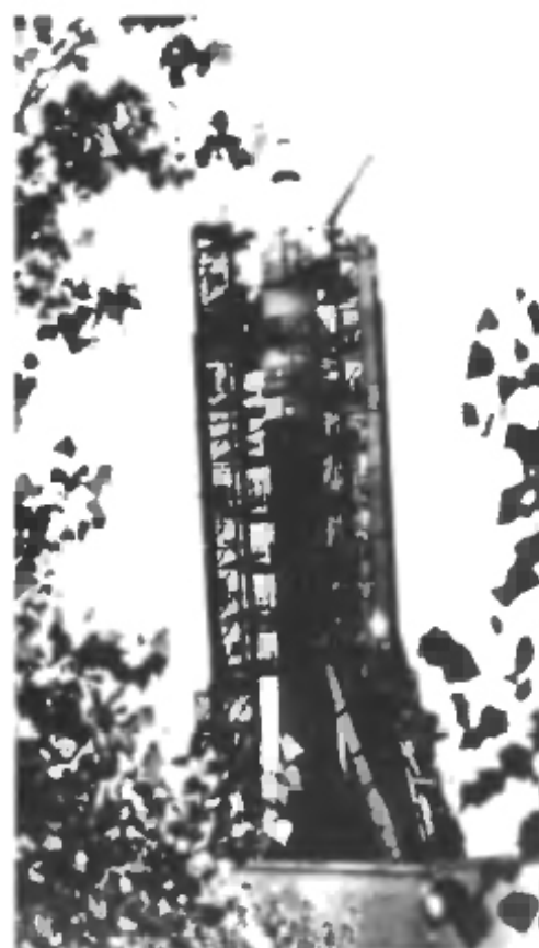
12 апреля 1961 года 9 часов 07 минут. Со знаменитого гагаринского «Поехали!» Начался полет человека к звездам.