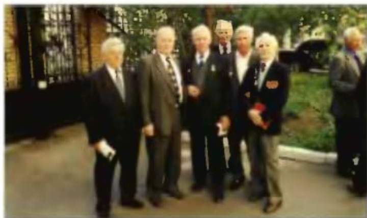
Встретились ветераны строительства космодрома Байконур.