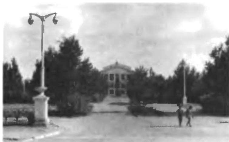
Плавательный бассейн «Орион»