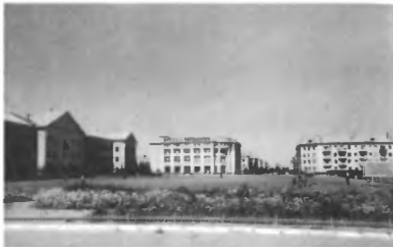
Центральная площадь города. Байконур, 1961 г.