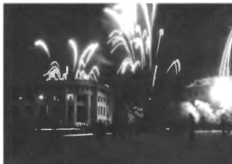
Центр города во время праздничного салюта. (ноябрь, 1964 г.)