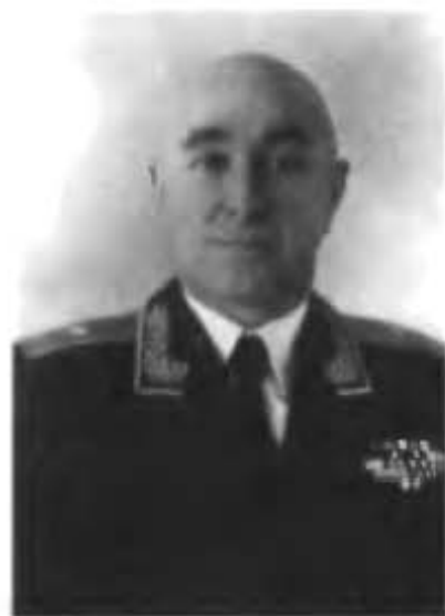
Георгий Максимович после присвоения звания генерал-майора (Байконур, 1957 год)

Официальное сообщение ТАСС означало, что задание Родины успешно выполнено. А 4 октября 1957 года состоялся запуск первого искусственного спутника Земли. Этот день стал началом космической эры, праздником для все-