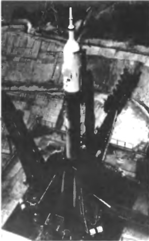
Космос начинается на земле...