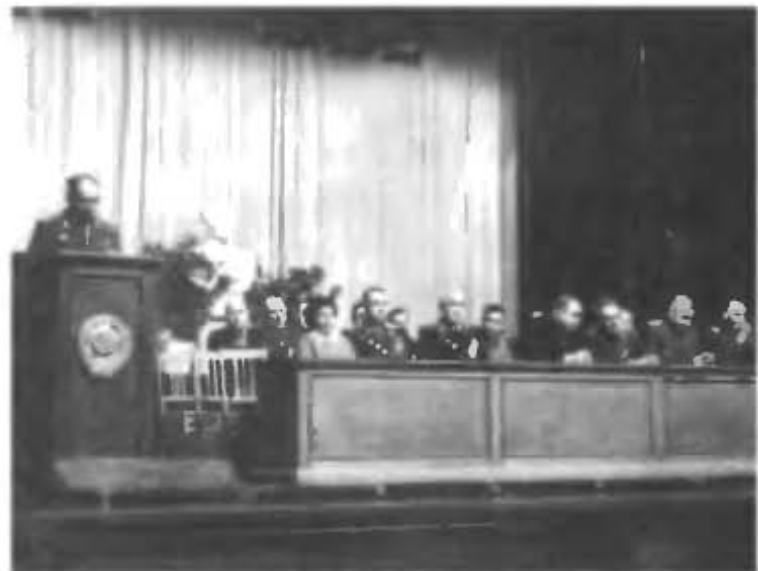
Собрание партийно-хозяйственного актива стройки