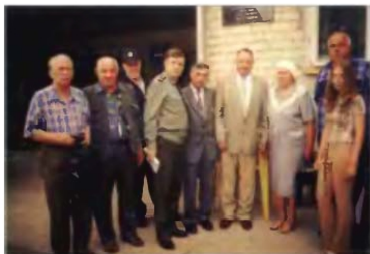
Делегация у мемориальной доски с родными и ветеранами космодрома Байконура.