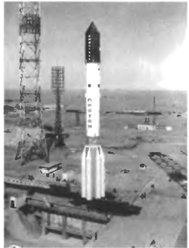
Мощная ракета «Протон» на старте, построенного под руководством Г.М. Шубникова (Площадка 81, 1965 г.)