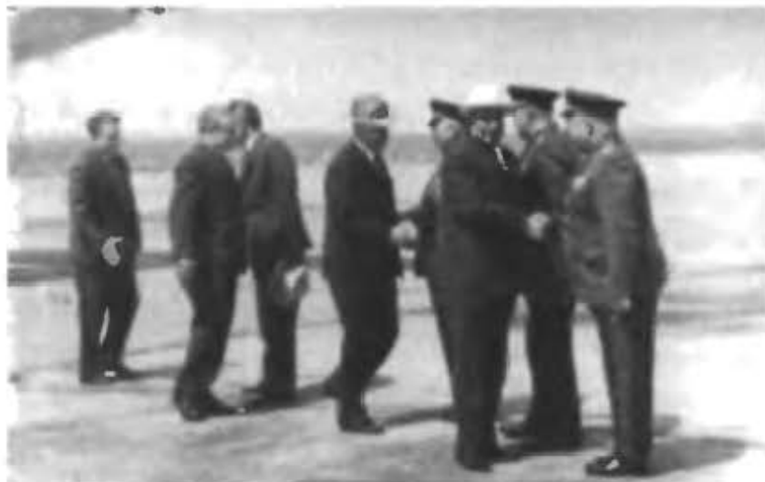
Руководство страны на земле космодрома