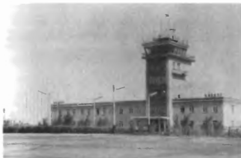
Здание аэровокзала «Крайний»