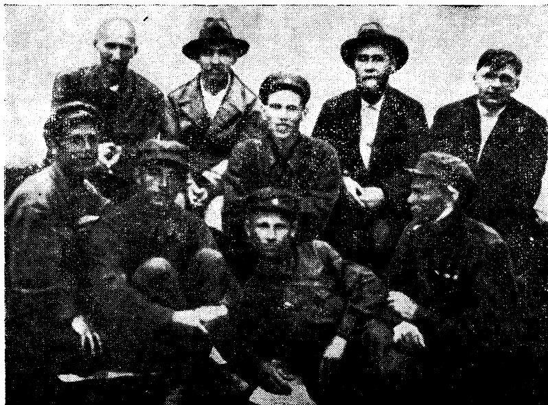
СТУДЕНТЫ ГЕОГРАФИЧЕСКОГО ФАКУЛЬТЕТА ПЕРМСКОГО ПЕДАГОГИЧЕСКОГО ИНСТИТУТА В ЛАГЕРЯХ ОСОЛВИАХИМА. 1936 г.

облплана и других организаций. Сделал много научных докладов, редактировал научные труды.