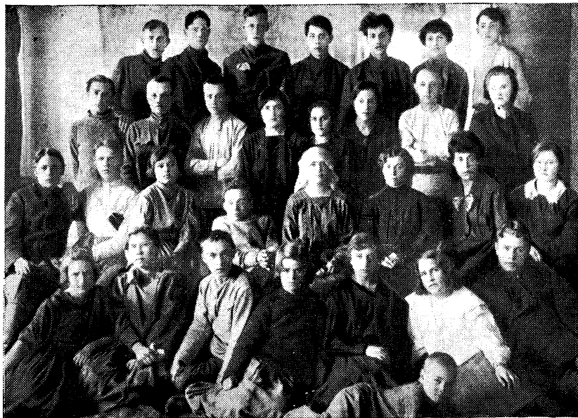
ГРУППА МОЛОДЕЖИ, СПЛОЧЕННОЙ ВОКРУГ ВТОРОЙ РАЙОННОЙ БИБЛИОТЕКИ ПЕРМИ. — «ВТОРОРАЙОННИКИ».

Именно в те годы их первых встреч она была хозяйкой явочной квартиры. Затем арест, тюрьма. Та же участь постигла тринадцать читателей-подпольщиков.