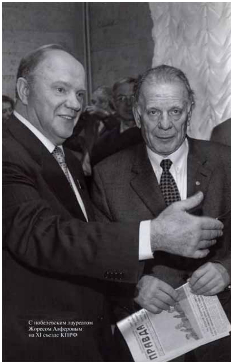
С нобелевским лауреатом Жоресом Алферовым на XI съезде КПРФ.