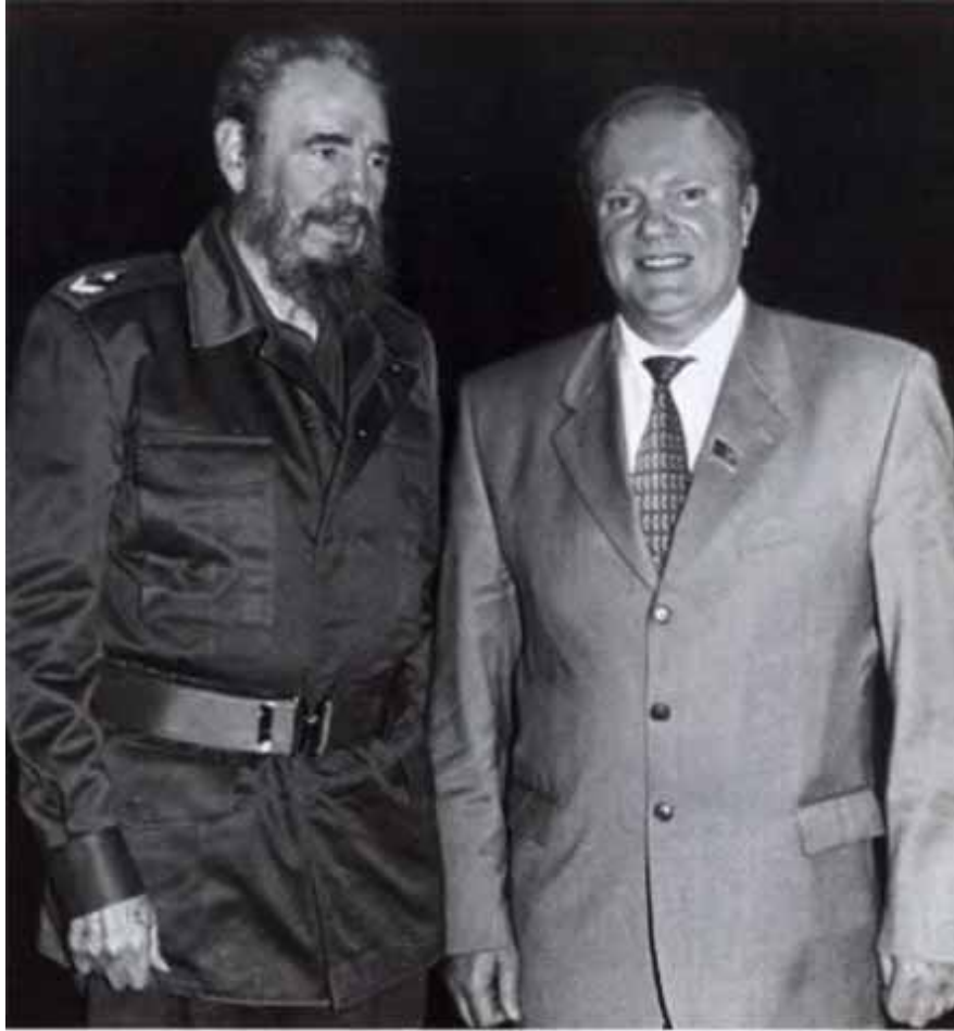
На героической земле Кубы с Фиделем Кастро.