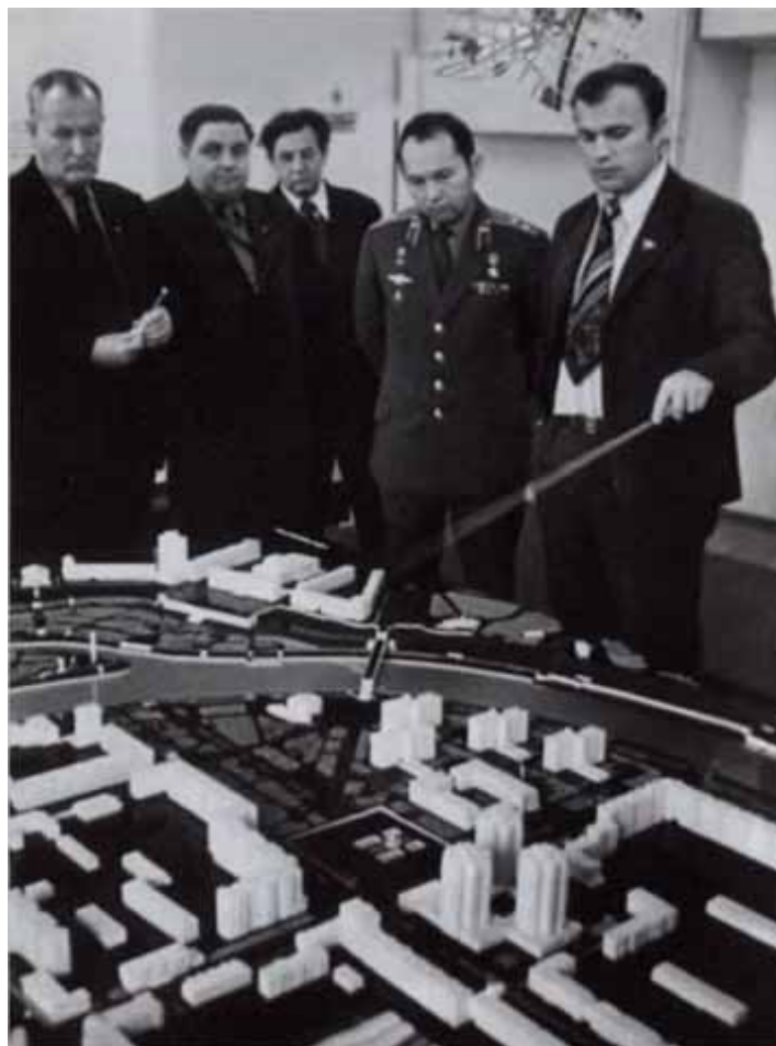
«Здесь будет город-сад». У плана генеральной реконструкции Орла. 1975 г.