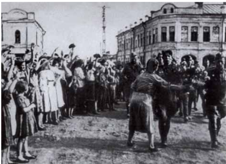
Встреча освободителей. Орел, август 1943 г.