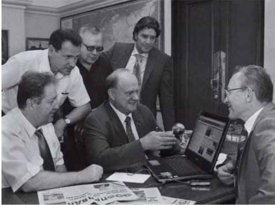
Среди ближайших помощников.