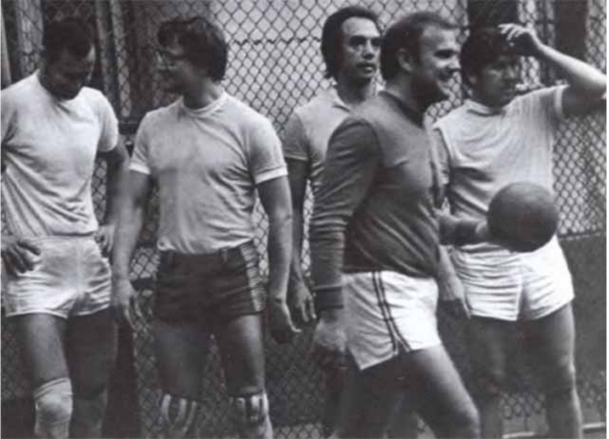
Капитан волейбольной команды АОН при ЦК КПСС.