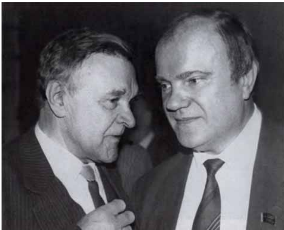
С писателем-патриотом Юрием Бондаревым.