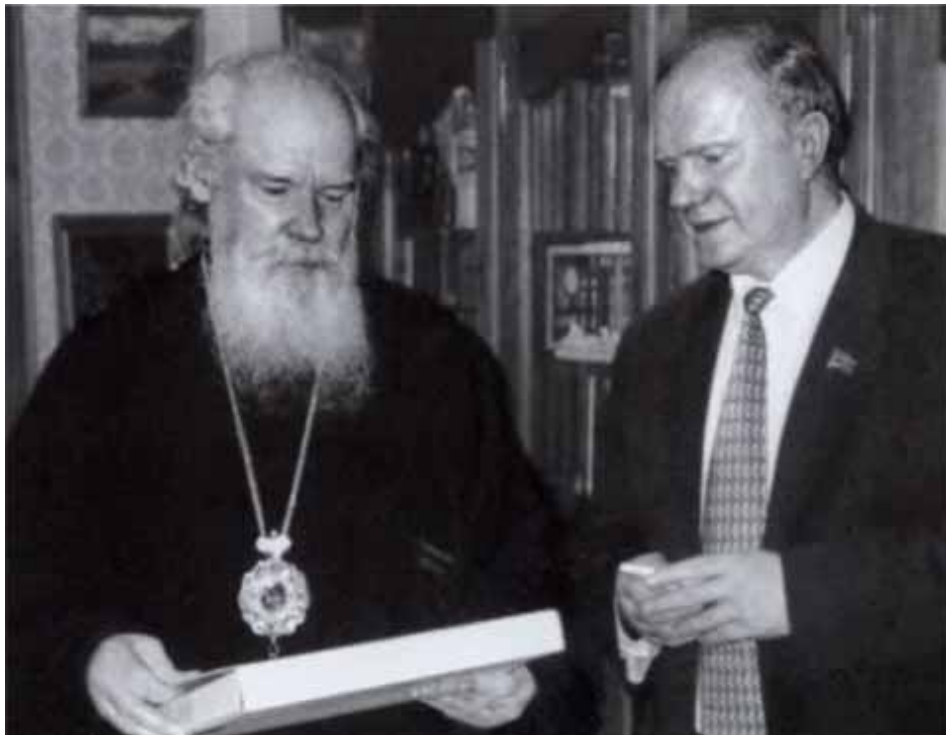
На встрече с патриархом Алексием II.