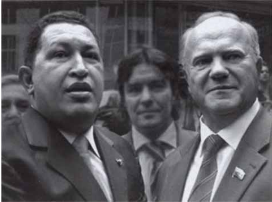
С президентом Венесуэлы Уго Чавесом. Москва, июнь 2007 г.