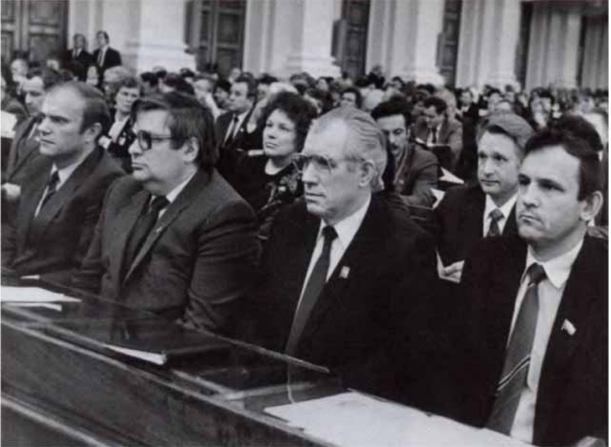
На переломе. Г. А. Зюганов на Съезде народных депутатов СССР.