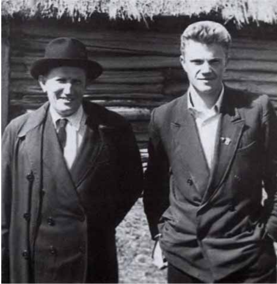
Отец и сын.