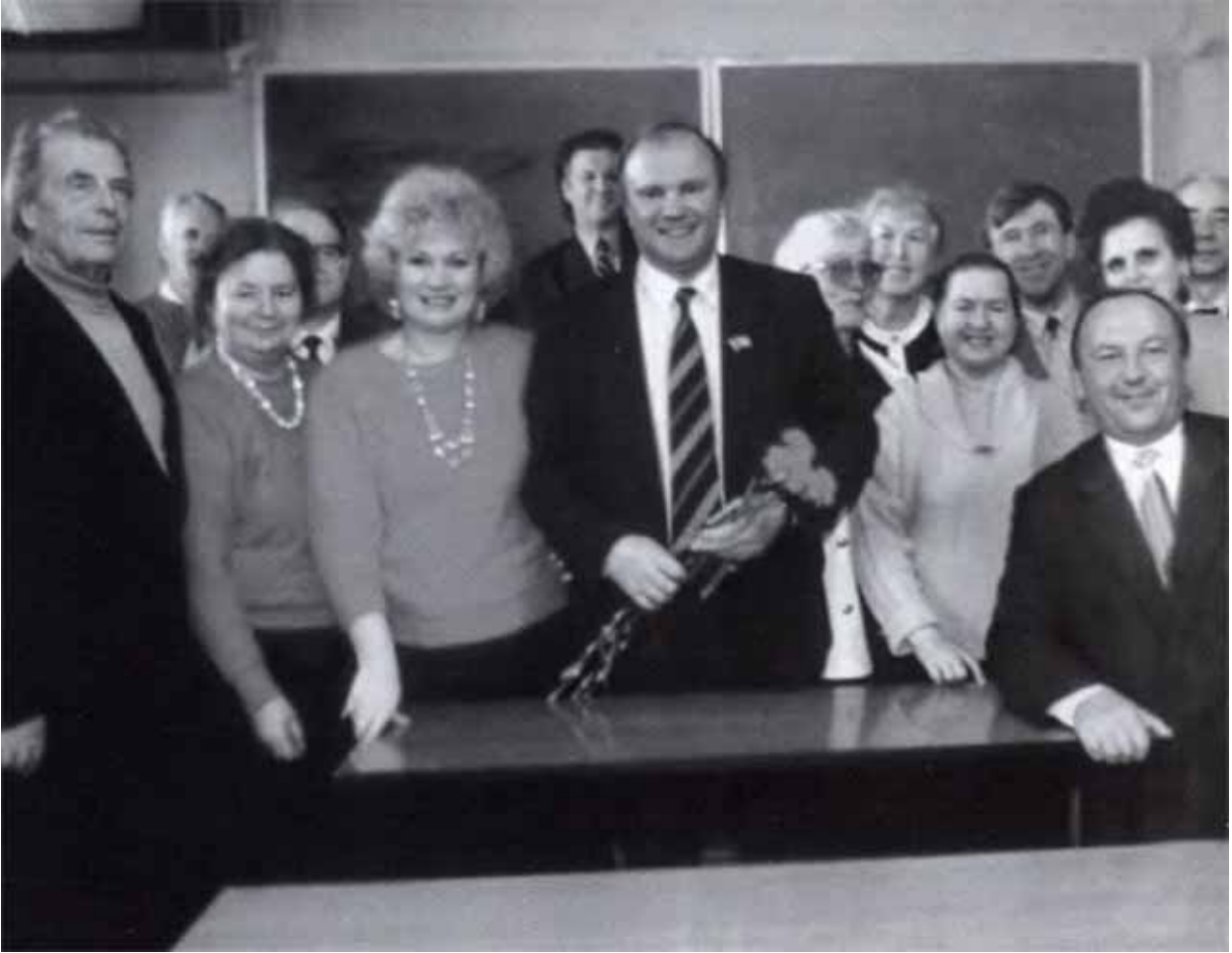
Среди выпускников и преподавателей Орловского пединститута.