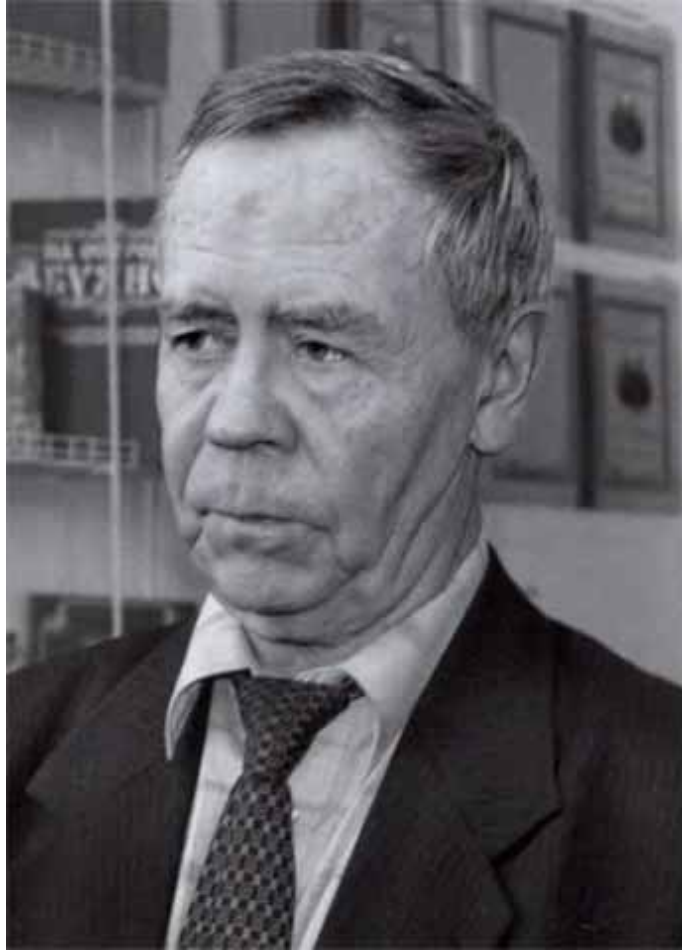
Активный участник патриотического движения писатель Валентин Распутин.