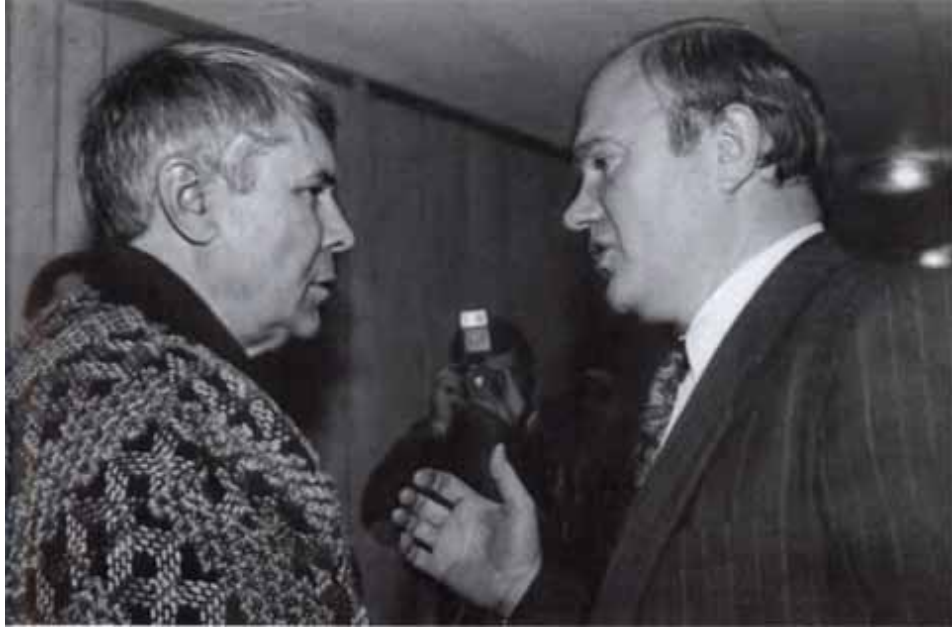
С верным соратником главным редактором «Советской России» Валентином Чикиным.