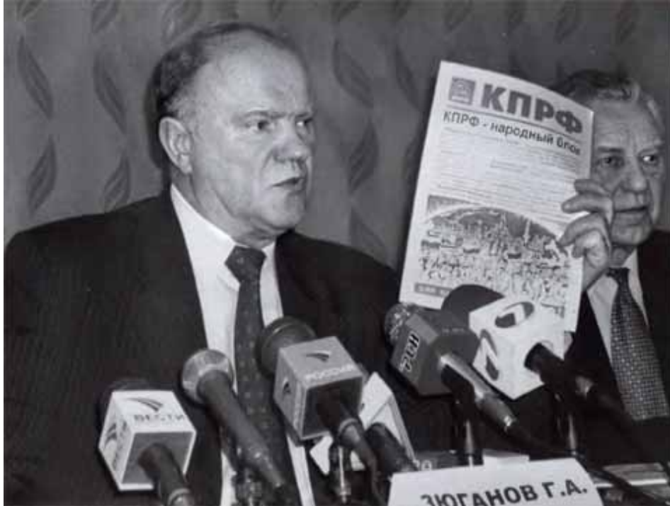
Во главе Компартии и избирательного блока КПРФ.