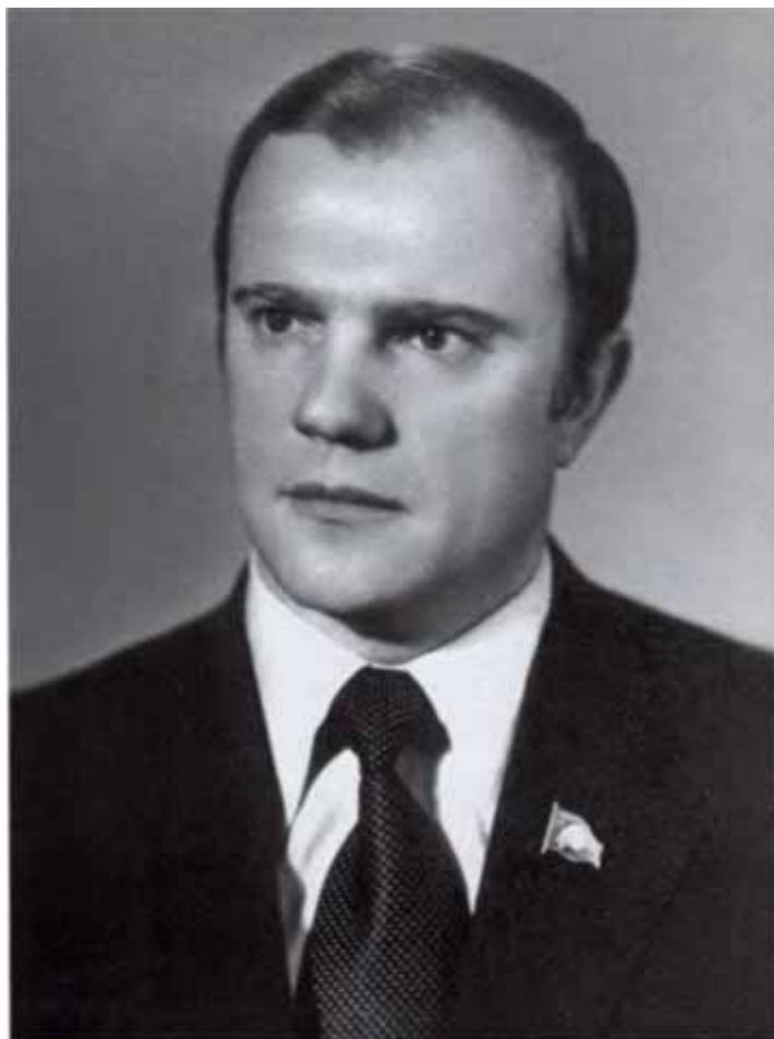
Секретарь Орловского ГК КПСС. 1974 г.