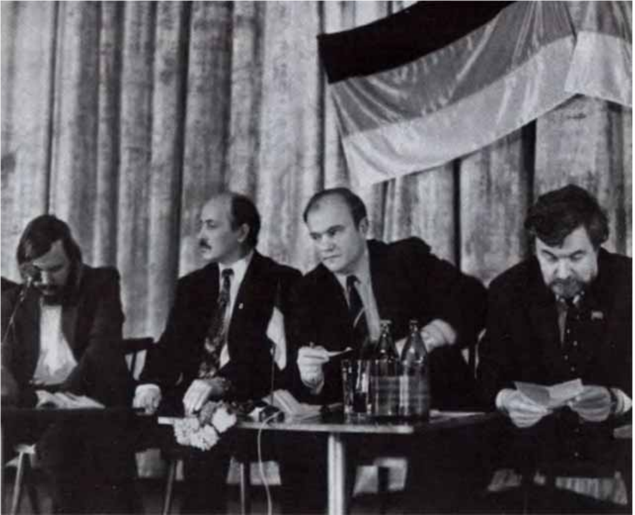
У истоков создания Фронта национального спасения. 1992 г.