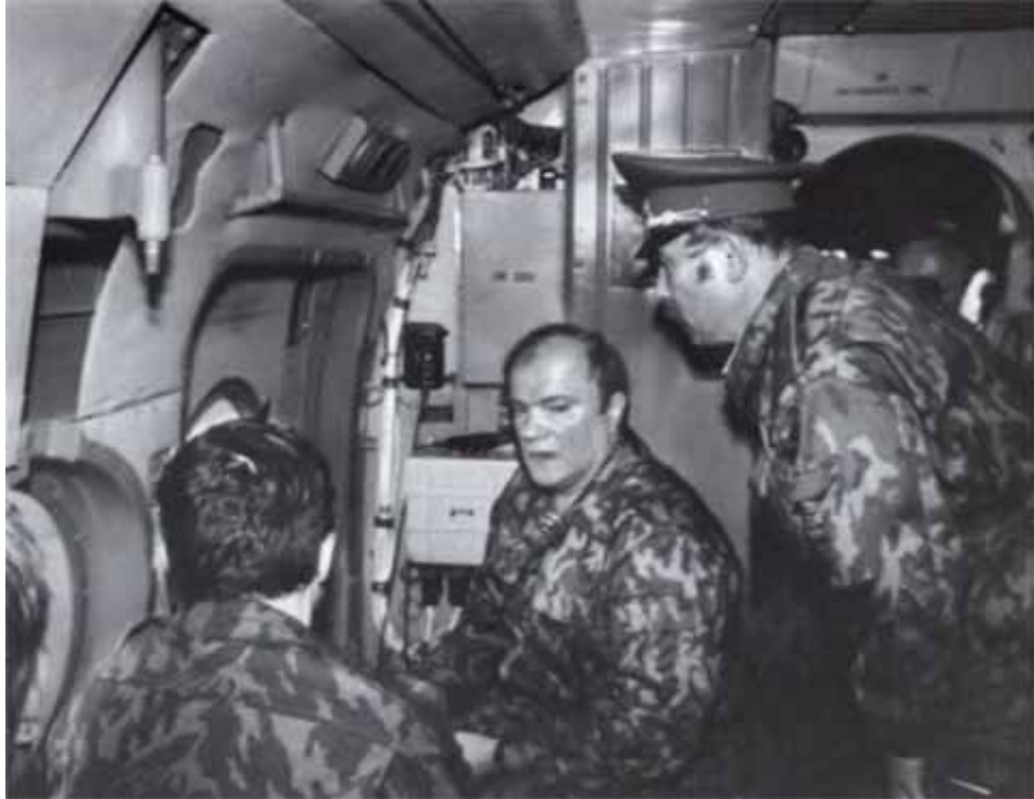
Полковник запаса Зюганов на учениях.