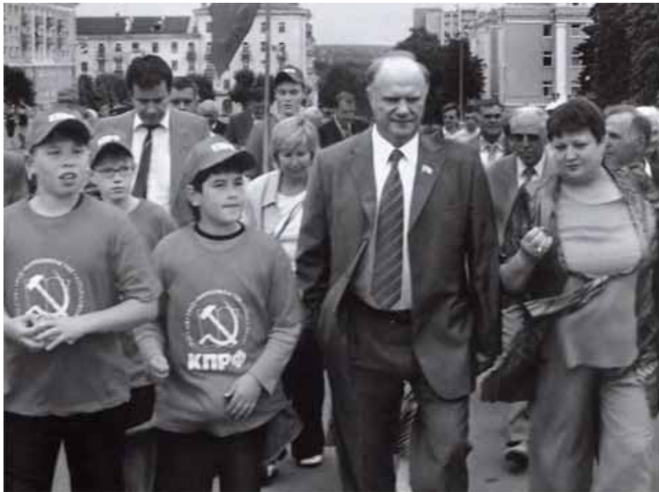
На Съезде представителей трудовых коллективов России. Саранск, июль 2007 г.