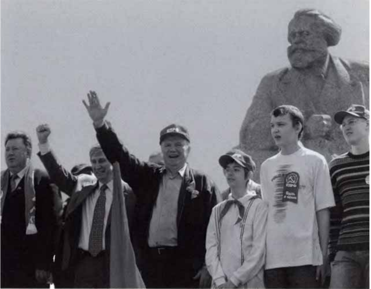
В авангарде борьбы за социальную справедливость.