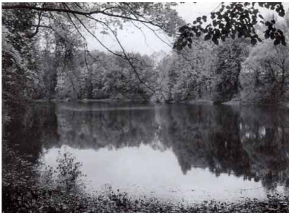
Уголок родной Орловщины.