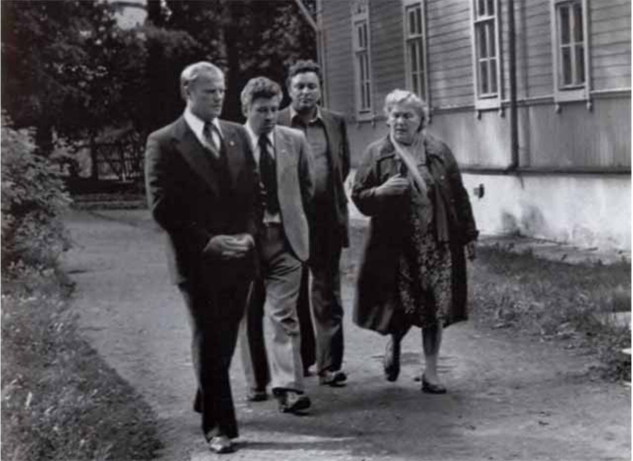
У Дома-музея И. С. Тургенева в Спасском-Лутовинове после восстановления усадьбы.