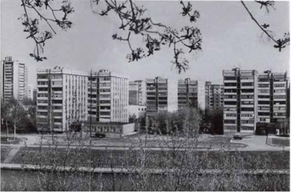
Современные жилые кварталы города.