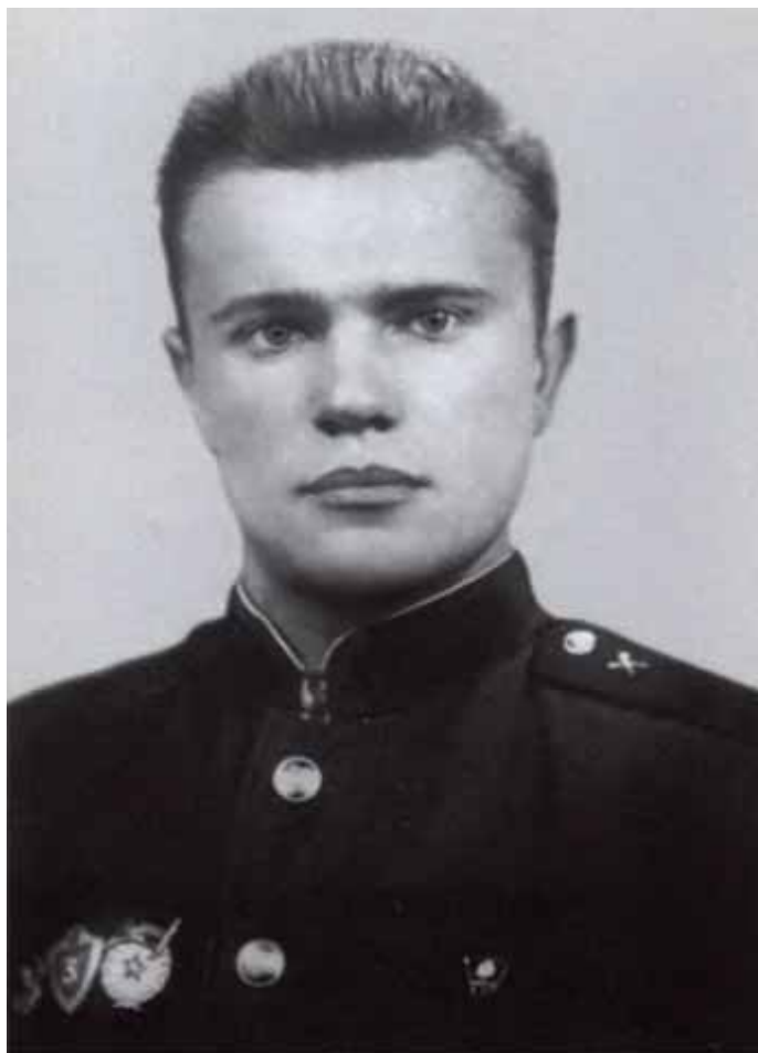
Молодой гвардеец. Группа советских войск в Германии. 1963 г.