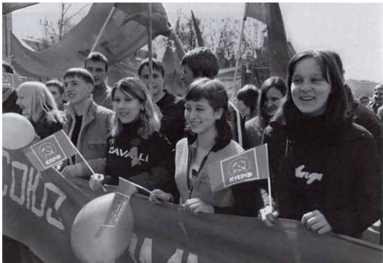
Молодая смена КПРФ.

Предложения оппозиции конструктивны. Москва, 2007 г.