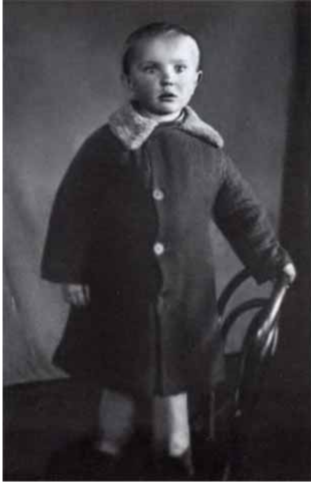
Снимок на венском стуле — символ времени. 1948 г.