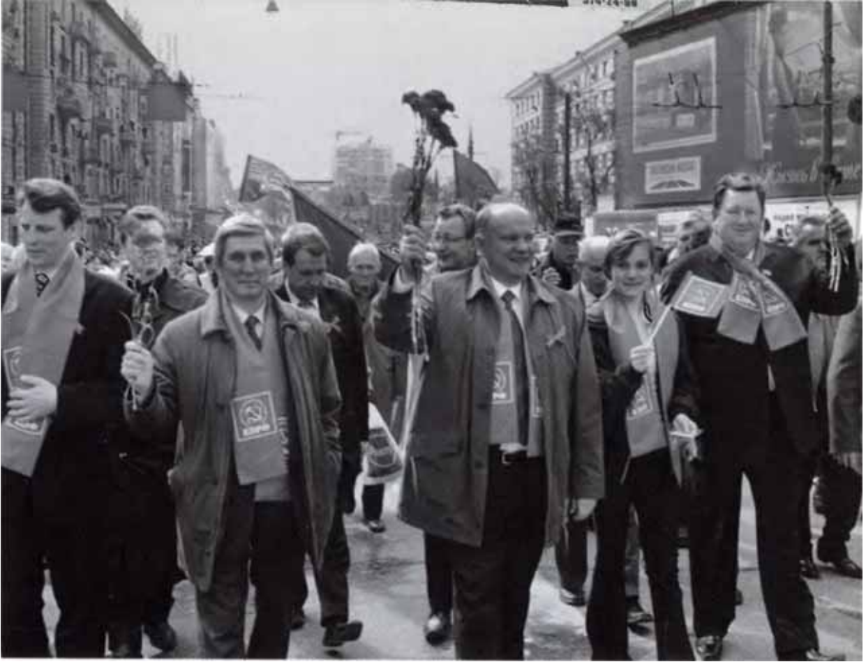
Праздник весны — праздник солидарности.