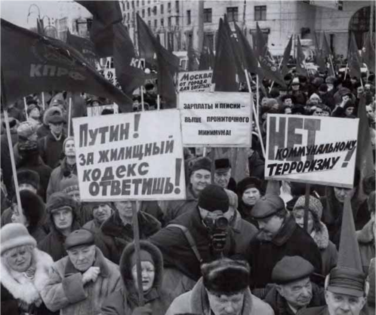
Народный протест нарастает.