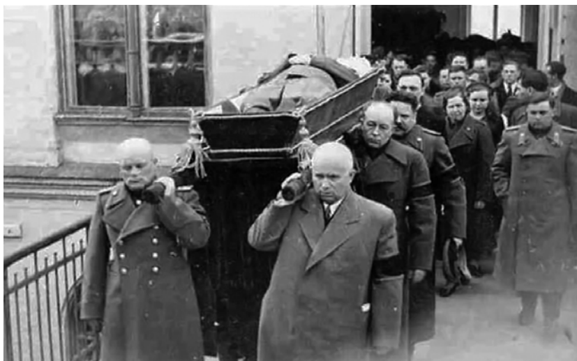
Н.С. Хрущёв (справа) лично участвовал в церемонии похорон Н.Ф. Ватутина