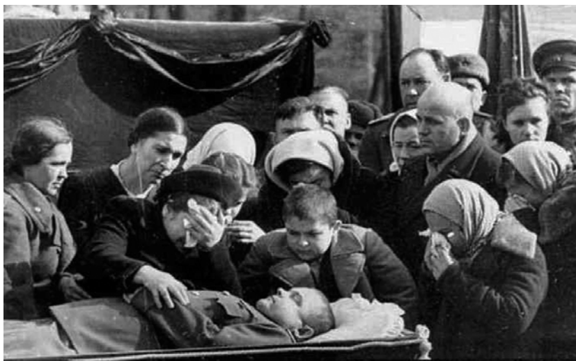
Прощание близких родственников с Н.Ф. Ватутиным

Фрагмент распоряжения об организации похорон генерала армии Н.Ф. Ватутина