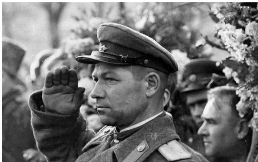
Солдаты и офицеры 1-го Украинского фронта провожают в последний путь своего командующего