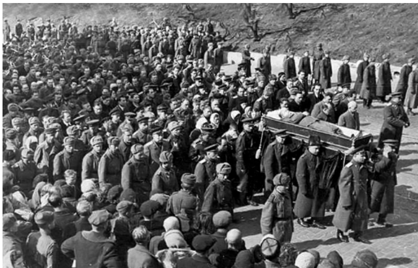
Траурная процессия на одной из центральных улиц г. Киева