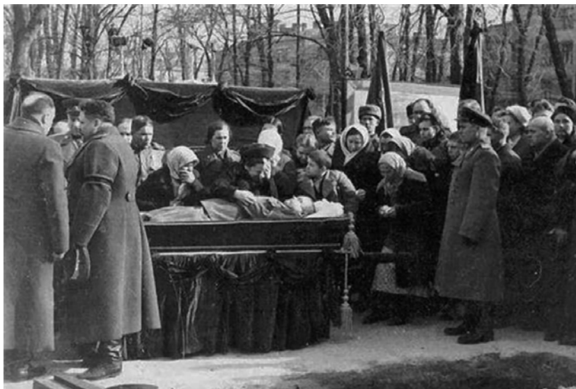
Близкие родственники и сослуживцы у гроба Н.Ф. Ватутина